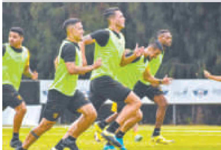
Jugadores del Tigre en plena labor física, ayer en Cochabamba.

El cuadro atigrado prosiguió ayer su preparación en el complejo aviador, donde hoy continuarán sus entrenamientos.