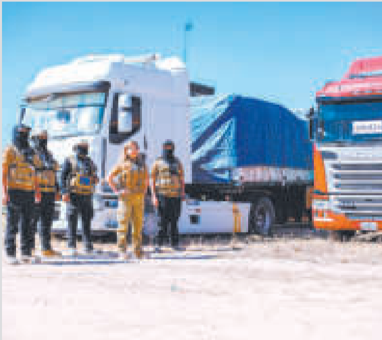
El número de decomisos también batió récord.