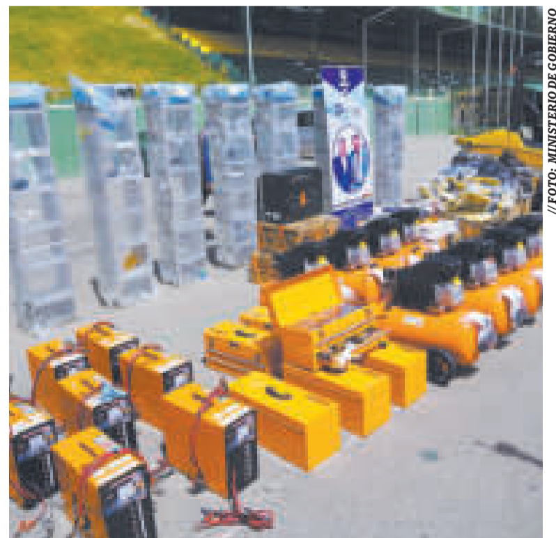
Equipos entregados por el Ministerio de Gobierno a Dircabi.

MILLONES DE BOLIVIANOS es el desembolso que comprometió la cooperación extranjera.