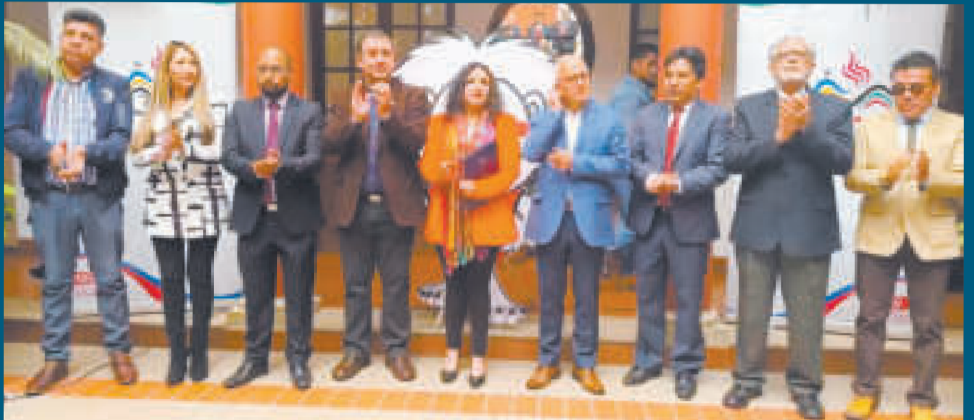
Autoridades del Comité Organizador de los Juegos Bolivarianos de la Juventud.

“Vamos avanzando con paso seguro para la realización de los Juegos Bolivarianos de la Juventud en Sucre, que va a dejar un legado muy importante y grande de todo lo que puede significar para el desarrollo deportivo local y para la motivación de los jóvenes para que