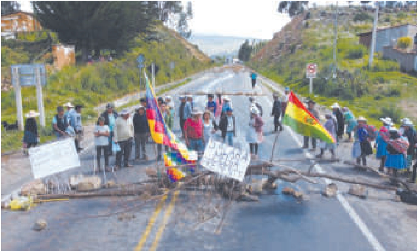
La medida de presión se inició el lunes.