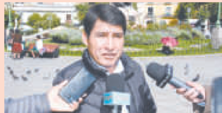
El gobernador de Chuquisaca, Damián Condori.

El gobernador de Chuquisaca, Damián Condori, planteó ayer que la Fiscalía actúe de oficio contra los incitadores de los bloqueos de caminos. Calificó a Evo Morales como el “primer violador” de la Constitución Política del Estado (CPE).