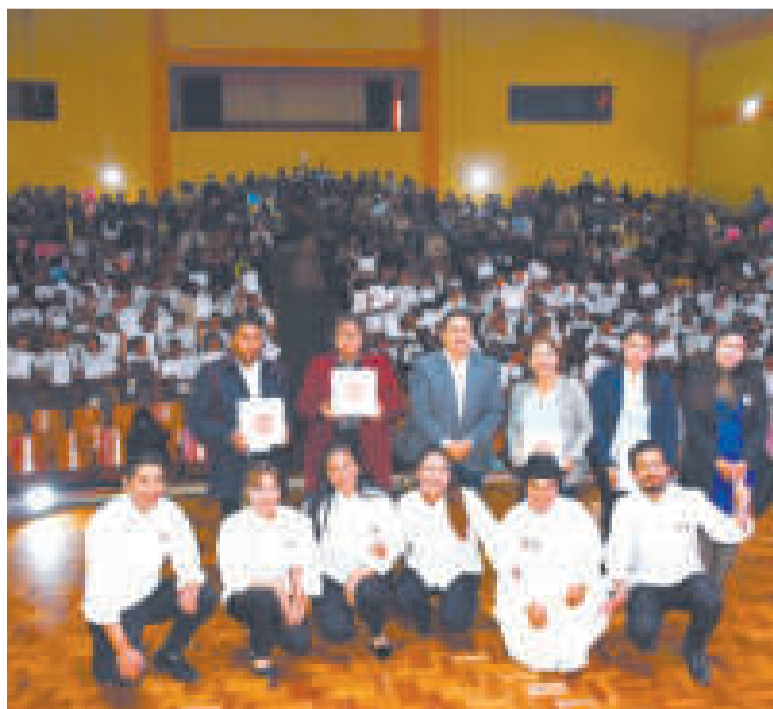
Acto de entrega de certificados.

Mamani destacó el alcance de las Escuelas de Cocina Manq'a, que tienen presencia en varias capitales de departamento del país, como La Paz, Cochabamba, Potosí, Tarija, Chuquisaca y Pando.