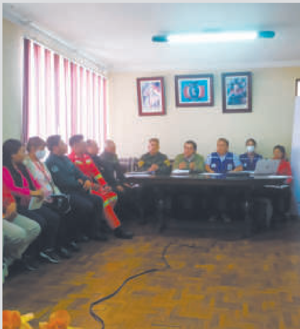
Reunión de coordinación para el Carnaval de Oruro.