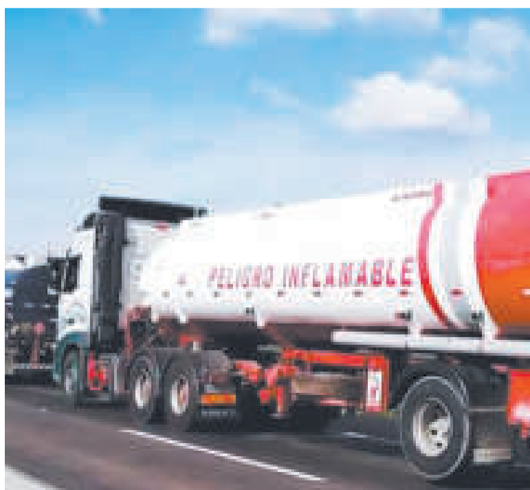
Una cisterna en un punto de bloqueo.