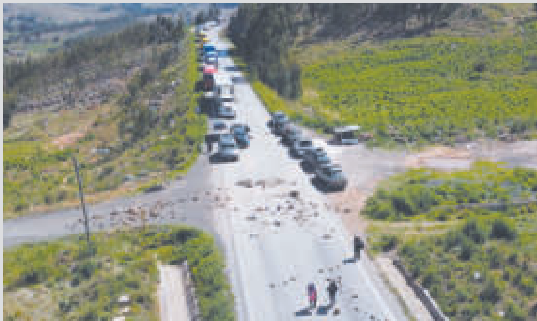
El transporte interprovincial está perjudicado por los bloqueos en Sacaba, Cochabamba.