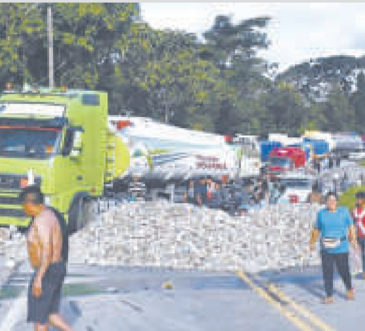
Un punto de bloqueo en el trópico.

municado”, dijo. El punto con mayor cantidad de bloqueadores continúa siendo Parotani, que conecta Cochabamba con Oruro y el occidente boliviano.