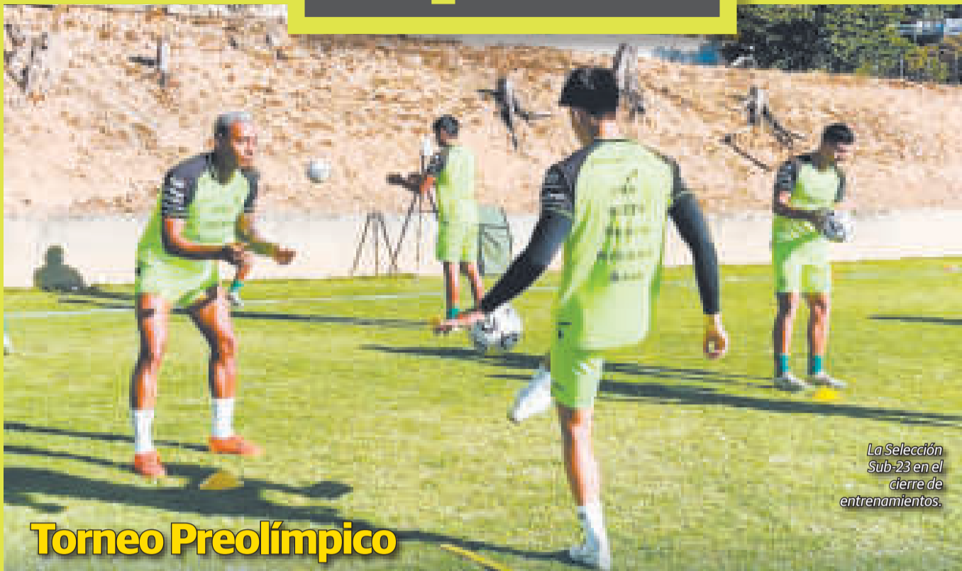
La Selección Sub-23 en el cierre de entrenamientos.