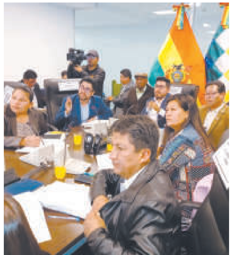
El debate de la Comisión rindió frutos.

El viceministro detalló que, a nivel nacional, el 93% de los trabajadores percibe un salario por debajo de los Bs 13