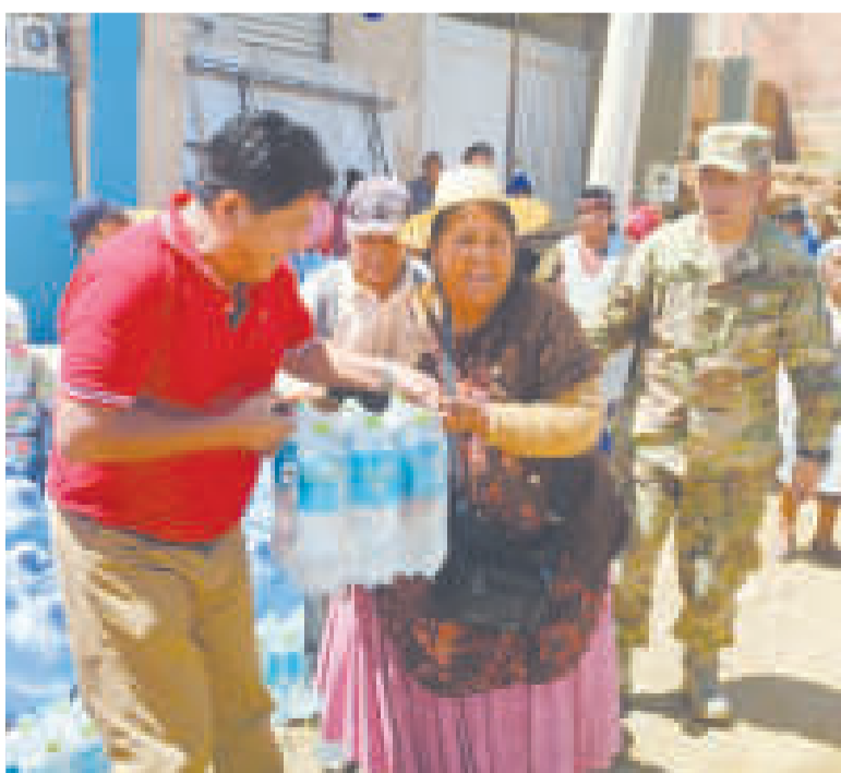
Entrega de ayuda humanitaria a las familias afectadas por los deslizamientos.

Calvimontes indicó que se elaborará un plan para resolver el problema habitacional de los vecinos que perdieron sus viviendas.