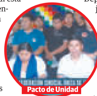
Pacto de Unidad

Los dirigentes de la Federación Sindical Única de Trabajadores Campesinos de Cochabamba, de la Federación Departamental de Mujeres Campesinas Originarias e Indígenas de Cochabamba 'Bartolina Sisa', de los regantes y mineros cooperativistas, entre otros, también determinaron una vigilia el martes 30 de enero en la brigada departamental y no descartaron "tomar de forma pacífica" la Asamblea Legislativa Plurinacional, si no se da curso a la celebración de las elecciones judiciales.