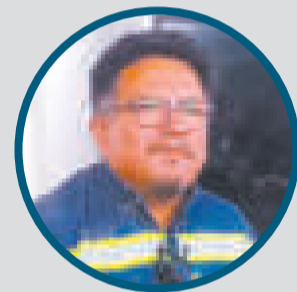
Los productos son de alta calidad en el mercado.

PARA ABRIL DE ESTA GESTIÓN se concluirá la construcción del nuevo almacén de la planta de Envibol.