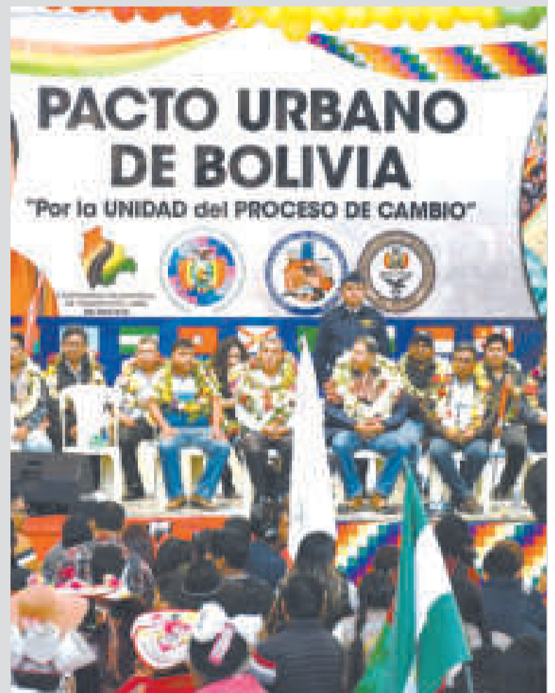
El presidente Luis Arce en la fundación del Pacto Urbano de Bolivia.