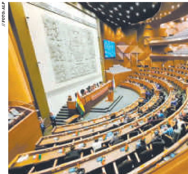
Una sesión de la Asamblea Legislativa.

El viceministro recordó que la competencia de canalizar las elecciones judiciales es de responsabilidad de diputados y senadores de la Asamblea Legislativa.