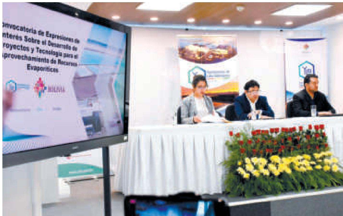
El acto del lanzamiento de la convocatoria, ayer.