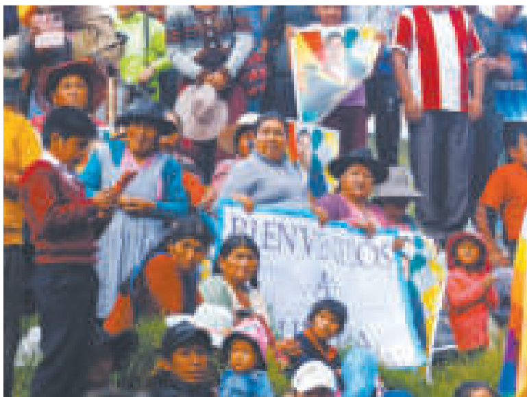
Los habitantes de Sucre expresan su respaldo al Jefe de Estado mediante carteles con mensajes de apoyo.

los estudiantes usen telescopios, microscopios y otros equipos sofisticados e incursionen desde temprana edad en ramas importantes de diversas ciencias.