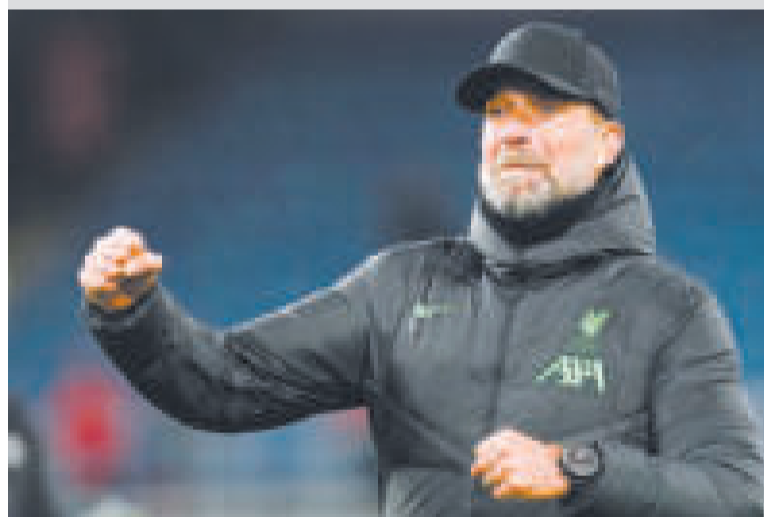
El profesional alemán Jürgen Kloop dejará la dirección técnica de Liverpool.

Luego de una importante renovación dentro del plantel, Liverpool elevó considerablemente su nivel con respecto a la pasada temporada, se posicionó como uno de los mejores equipos del planeta.