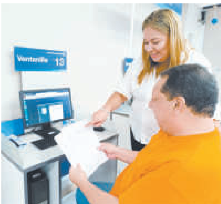
La iniciativa posibilitó varias prácticas tributarias.