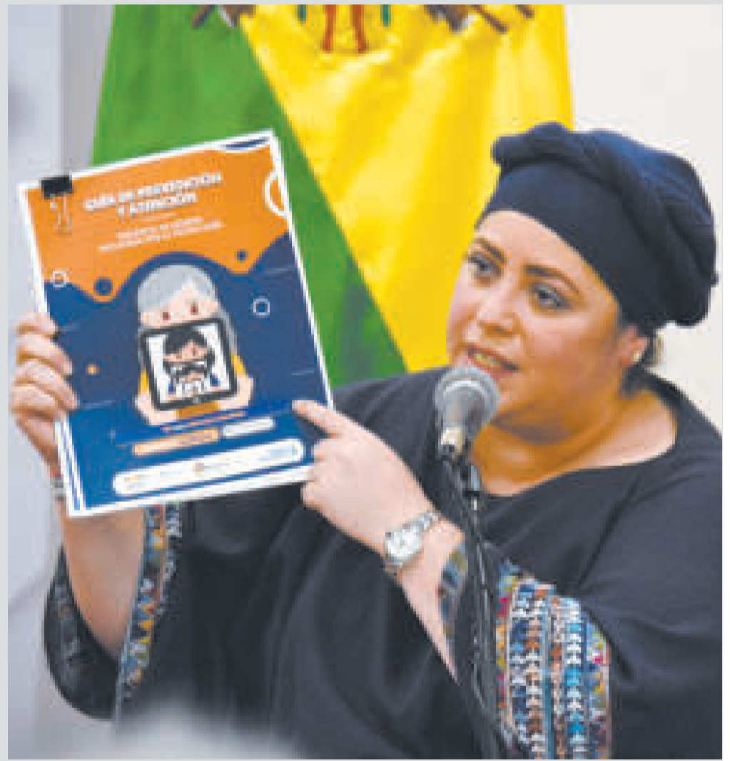
La ministra María Nela Prada en el acto de presentación de la 'Guía de prevención y atención'.

En el tema de sensibilización se busca que se visualicen los tipos de violencia, ciberactivismo impulsado a través de testimonios. Además de ONU Mujeres Bolivia, la campaña contó con el apoyo de Agencia de Cooperación de Suecia, entre otras instituciones.