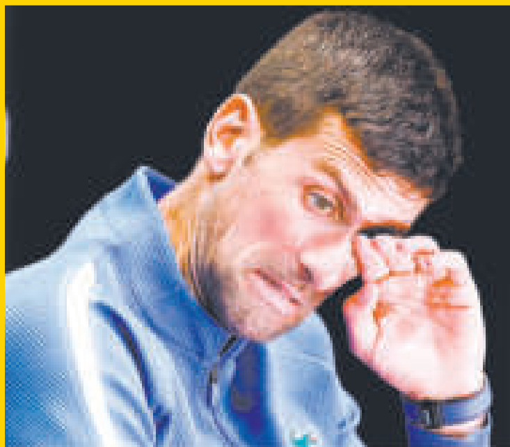
El tenista Novak Djokovic después de perder en el Open de Australia.