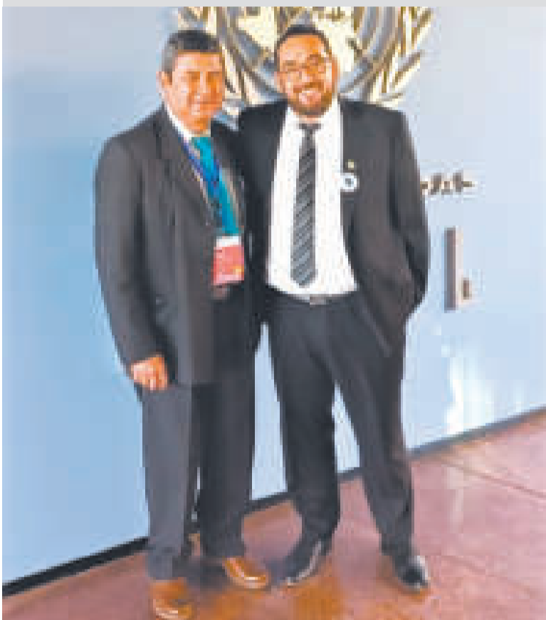
Participantes del encuentro internacional.