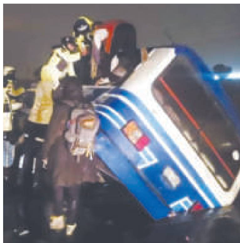
La intensa lluvia provocó, en El Alto, el encunetamiento de un micro.

DE LA NOCHE aproximadamente sucedió la caída del muro sobre tres menores de edad.