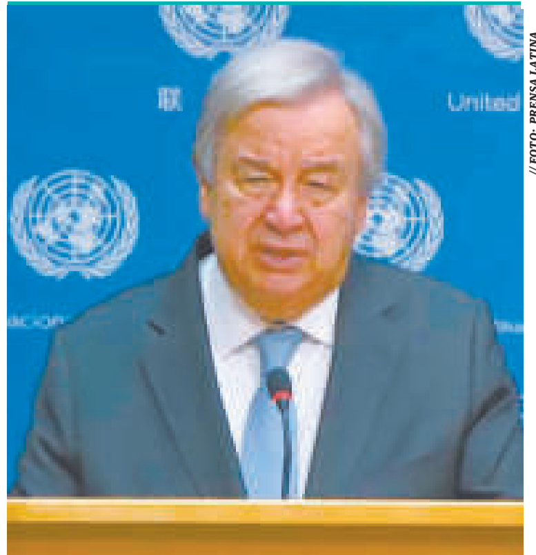
El secretario general de la ONU, António Guterres.