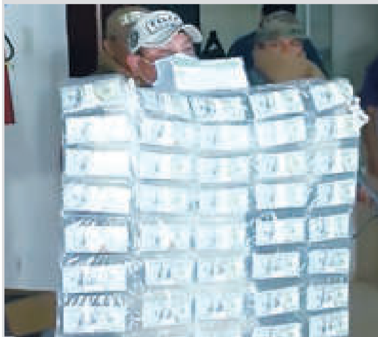
Parte del millón de dólares.