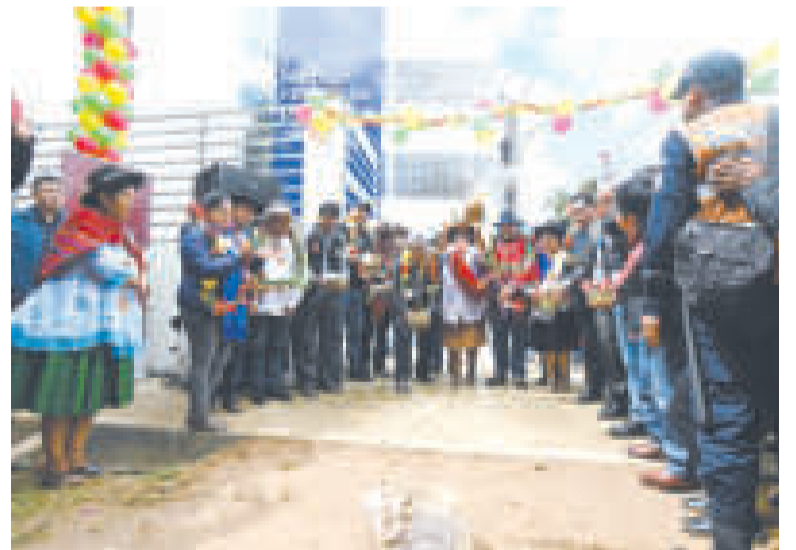
Las autoridades entregaron una moderna unidad educativa de tres plantas, totalmente equipadas.

“Apuntamos a una educación de calidad. Queremos que nuestros hijos sean mejores que nosotros”.