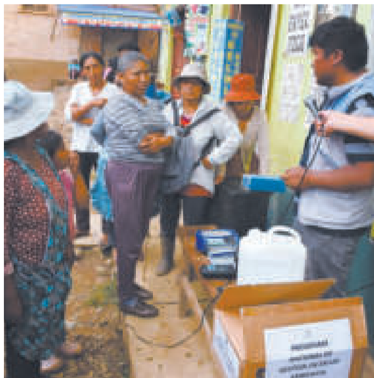
Un técnico en salud capacita a los comunarios.

MINUTOS se espera para que se diluya la pastilla potabilizadora y elimine todas las bacterias.