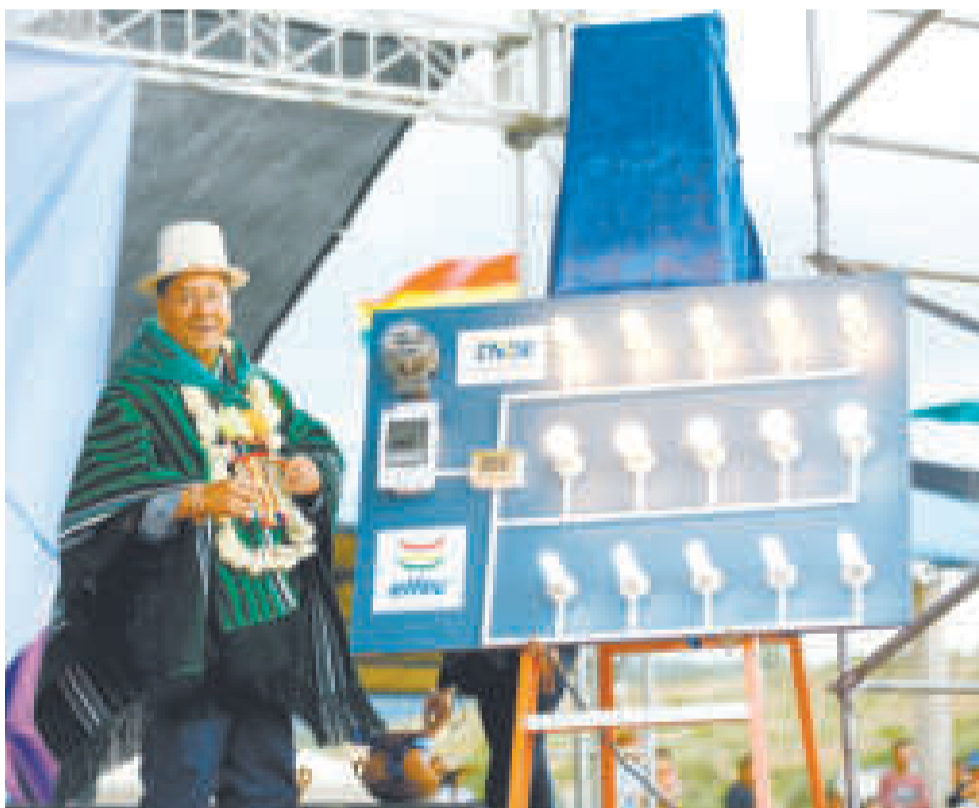
El presidente Luis Arce durante el encendido de la electrificación rural.