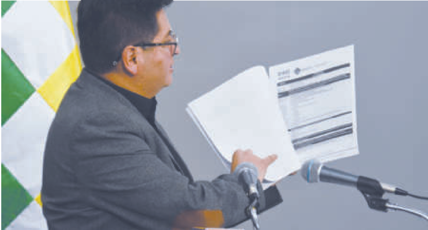
El ministro de Economía, Marcelo Montenegro, en conferencia de prensa.