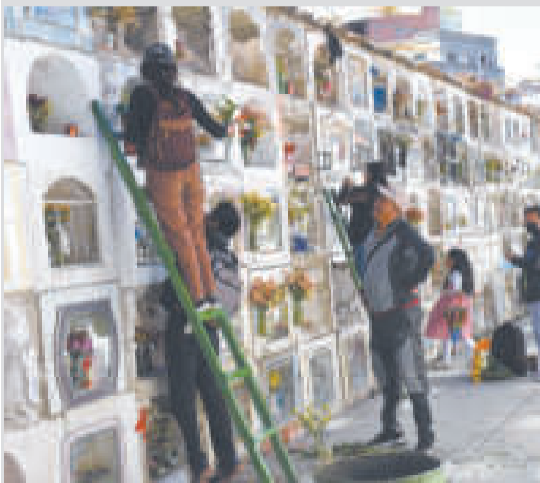
Familiares depositan flores para sus seres queridos.