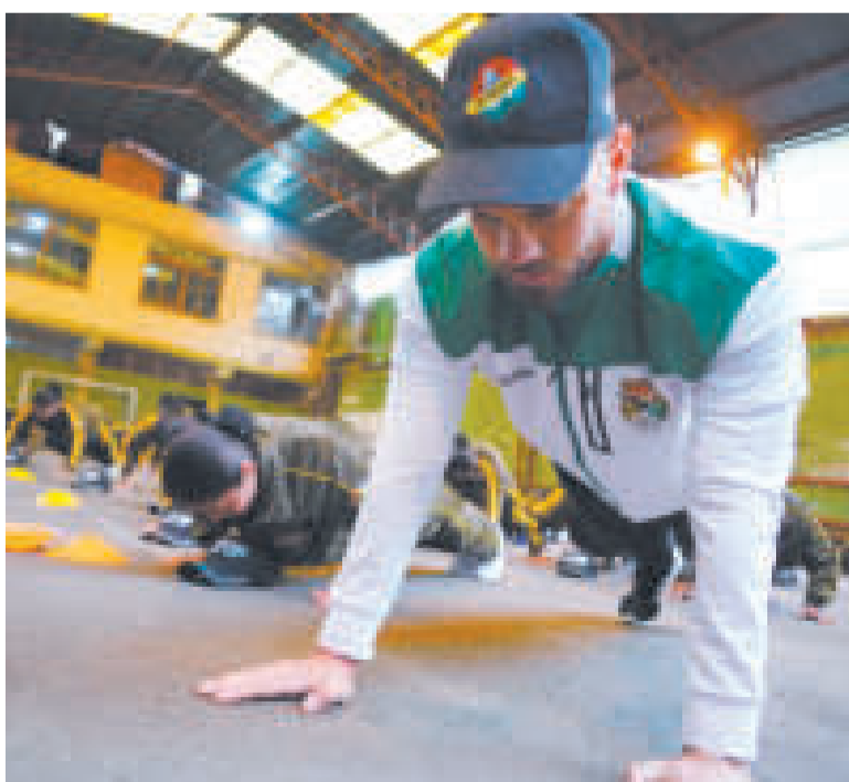
El ministro Del Castillo hace flexiones en el primer día de Plan de Reacondicionamiento Físico.