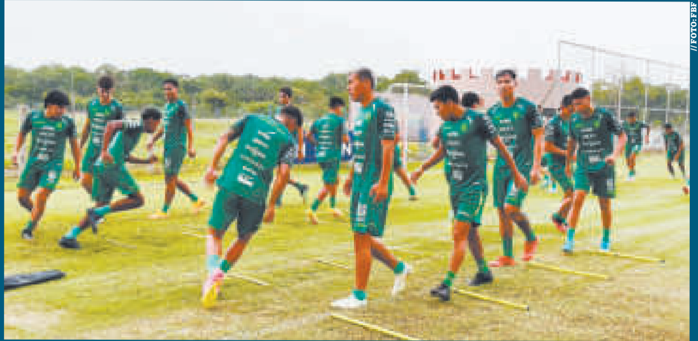
Los jugadores convocados a la Selección boliviana Sub-23 en plena preparación física en el complejo Kalomai.

roel expresó el objetivo de todos los jugadores. "Primero hay que ganarse el puesto y entrar en la lista", sostuvo.