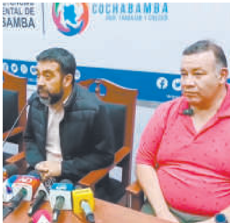
El Viceministro de Autonomías y el director del INE en conferencia de prensa.

El viceministro subrayó que, aunque el Gobierno nacional promueve el diálogo y ha orientado a las partes involucradas, la responsabilidad de resolver este conflicto recae en los gobiernos departamental y municipales de Cochabamba, basándose en el mapa oficial de Bolivia.