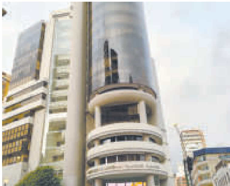
Fachada del Ministerio de Economía y Finanzas Públicas.

Con esta norma queda exento el pago del Impuesto al Valor Agregado (IVA) para la importa-