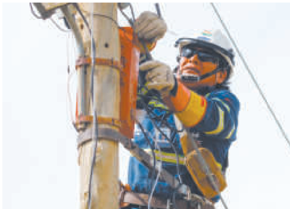
Uno de los técnicos de electrificación durante una jornada de trabajo.