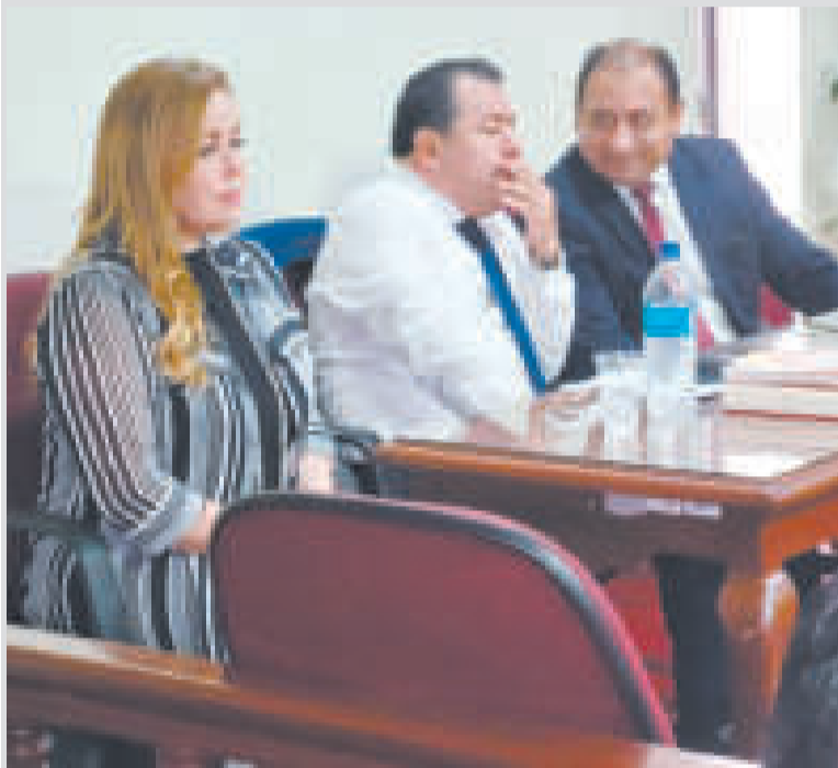
La exalcaldesa Angélica Sosa en la audiencia por el caso Ítems Fantasma.