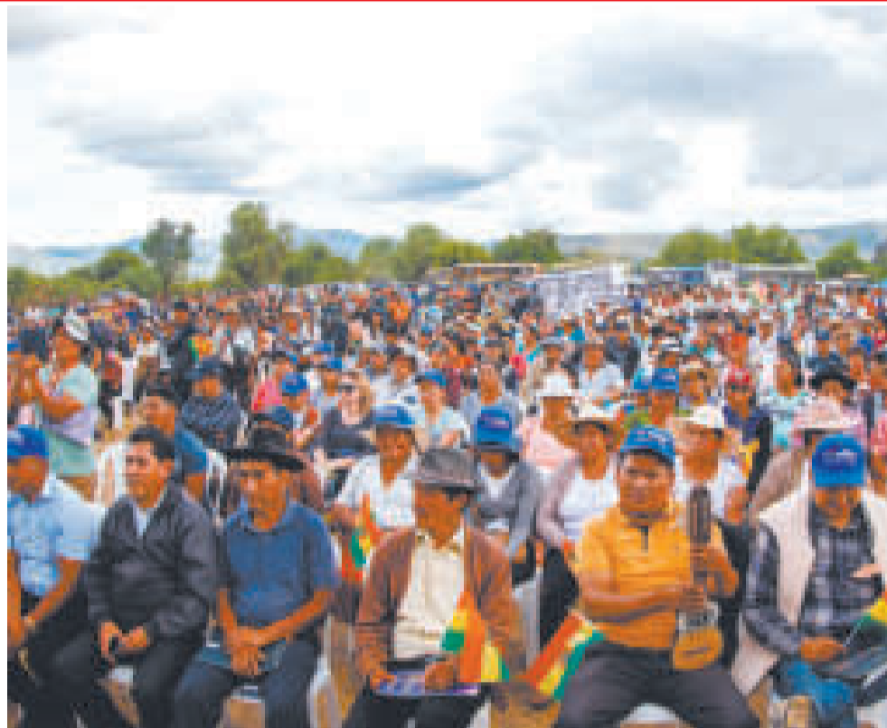
Cientos de pobladores del municipio de Mizque, Cochabamba, llegaron al evento de entrega.

A su vez, el ministro de Economía y Finanzas Públicas, Marcelo Montenegro, anunció que, en el primer trimestre de este año, el Presidente inaugurará la “primera planta de biodiésel en Santa Cruz, que nos va a ahorrar 100 millones de dólares en subvenciones”.