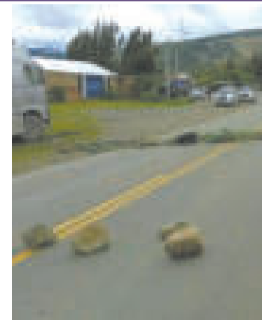
Bloqueo en Tiraque.