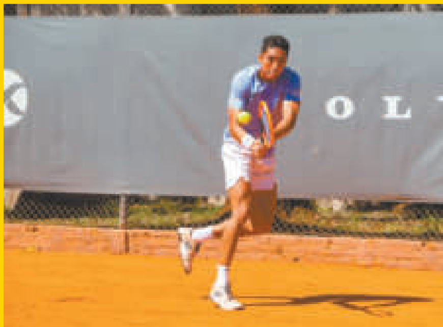
El tenista nacional Murkel Dellien quedó eliminado en la modalidad dobles.