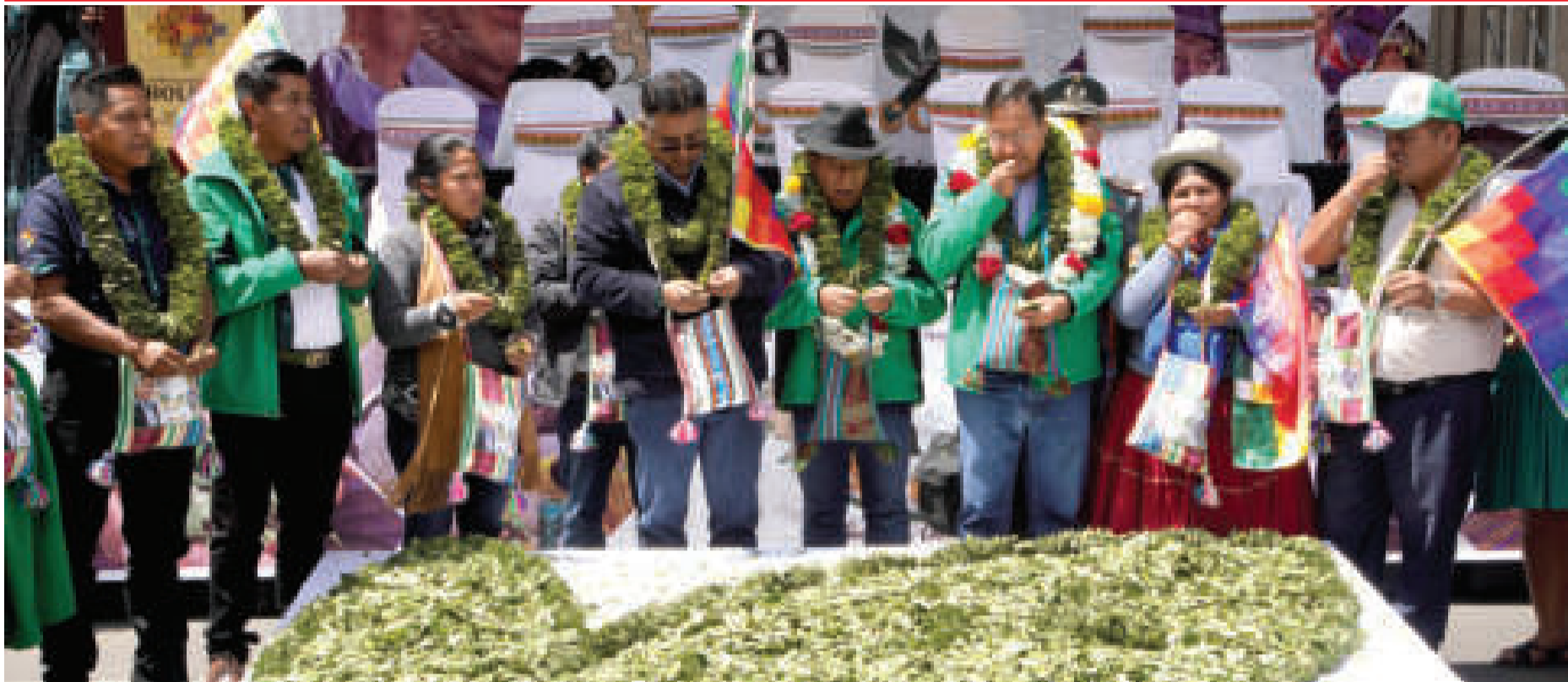
El presidente Luis Arce en el Día del Acullico.