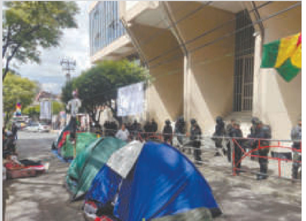
Protesta de “evistas” en puertas del TCP, en Sucre.