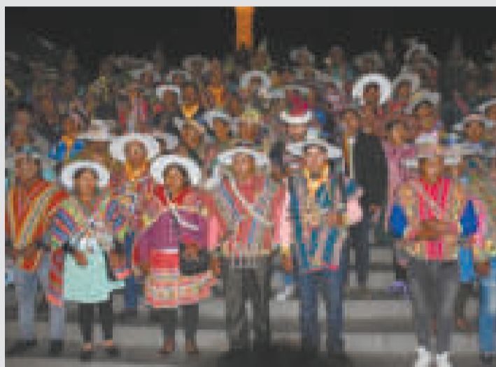
Dirigentes de los suyus Charkas Qhara Qhara Ayllus del Norte Potosí.

Los electos dirigentes de los suyus Charkas Qhara Qhara Ayllus Guerreros del Norte Potosí FAOI NP denunciaron el cierre de las oficinas centrales del Consejo Nacional de Ayllus y Markas del Qullasuyu (Conamaq), por lo que solicitaron a las autoridades una investigación para establecer las causas del cierre de sus oficinas.