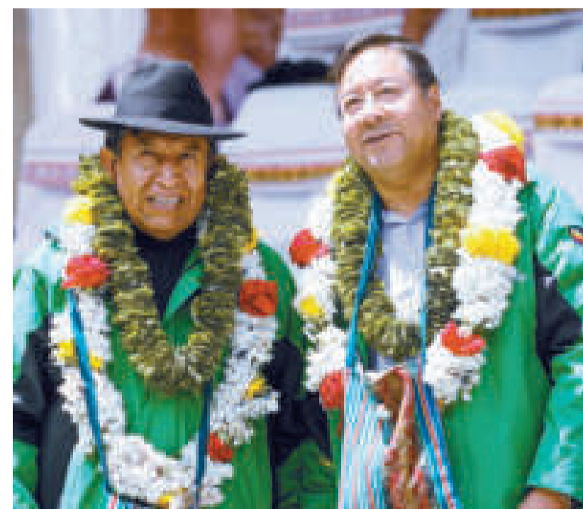
Proclaman al binomio "Lucho y David" para las elecciones de 2025.

En la provincia Inquisivi del departamento ado en la Casa Grande del Pueblo.