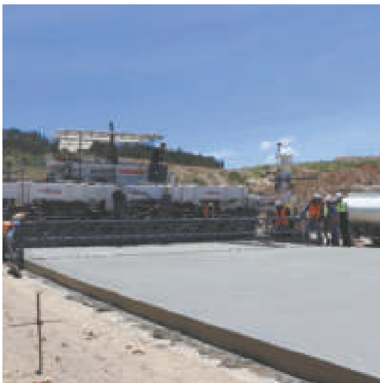
La pavimentadora de última generación.

Con una extensión de 25,6 kilómetros y un ancho de 20 metros, la doble vía Sucre-Yamparáez contará con pavimento rígido de 20 centímetros y la construcción de cuatro carriles, dos de subida y dos de bajada, consolidando así un proyecto de gran importancia para la región.