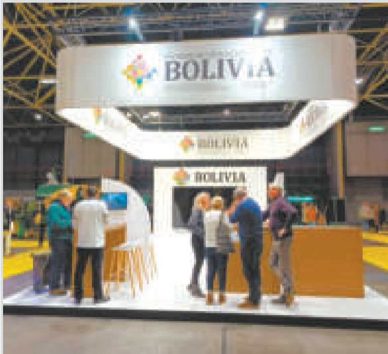
El stand de Bolivia en la Feria Vakantiebeurs 2024.

Gracias a las diligencias gubernamentales se gestionó un stand de 42 metros en el evento de promoción turística en Europa.