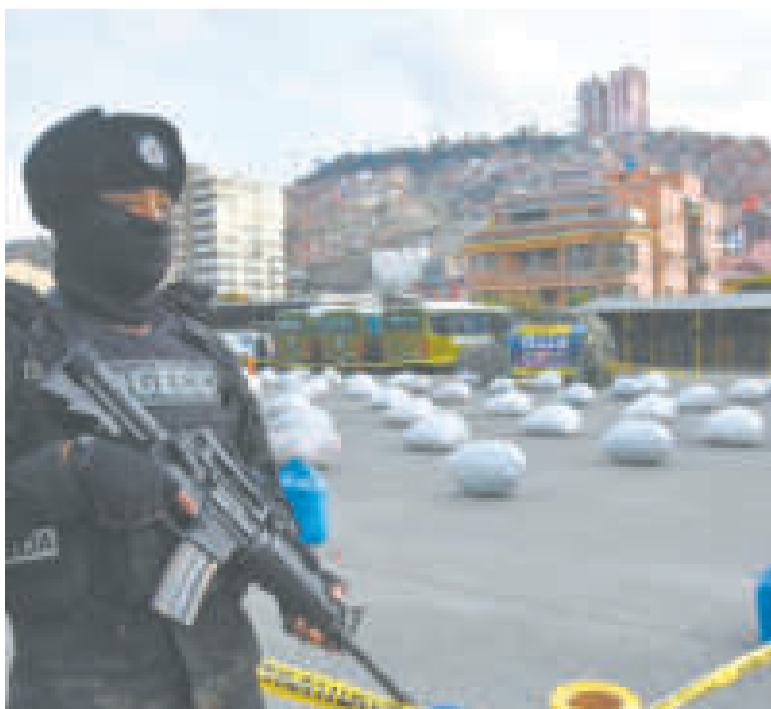
Un uniformado custodia la coca de procedencia peruana incautada.