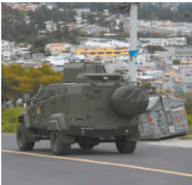
La Policía y las FFAA trabajan para que los rehenes sean liberados.

De acuerdo con el ente, 158 son Agentes de Seguridad Pe-