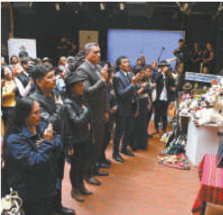
Los integrantes del Comité de Salvaguardia.