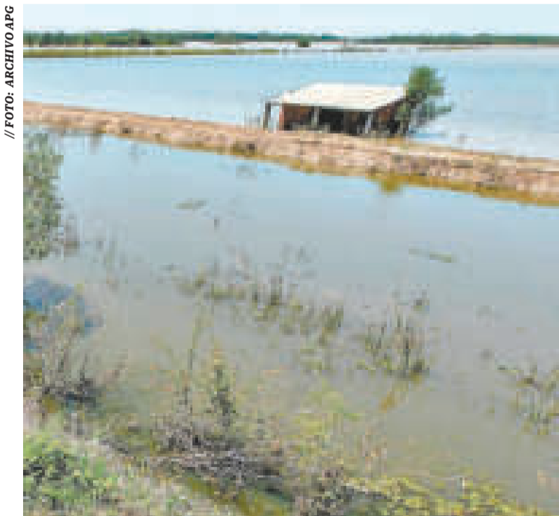
Un anterior desborde de río en la comunidad El Carmen de Santa Cruz.

Del 12 al 14 de enero, en La Paz y parte del norte de Yungas, en cuenca alta del río Beni, los ríos con posibles desbordes son Cotacajes, Boopi, Tamampaya, Solacama, Unduavi, Taquesi, Luribay, Porvenir, Zongo, Coroico, con posibles desbordes que afectarán comunidades cercanas. Del 12 al 15 de enero en el altiplano paceño en el río Desaguadero; mientras del 12 al 14 de enero, en el departamento de Oruro, en el río Lauca.