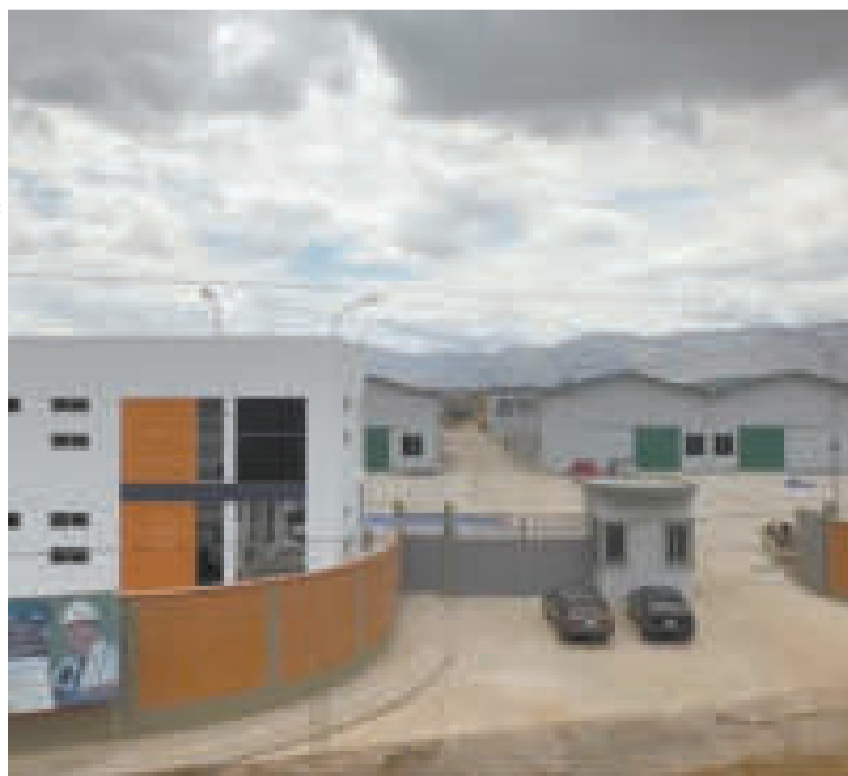
La empresa pública Kokabol está en Cochabamba.