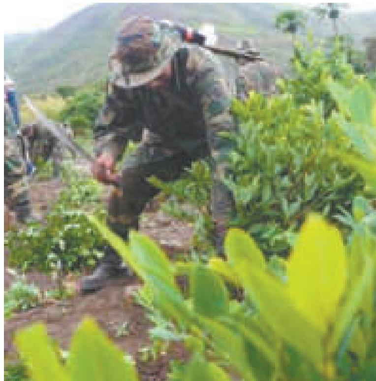
Un efectivo militar en labores de erradicación.

EFFECTIVOS militares, policiales y civiles fueron movilizados en las tareas de erradicación.