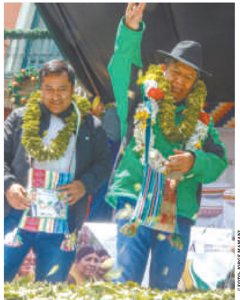
El vicepresidente David Choquehuanca.