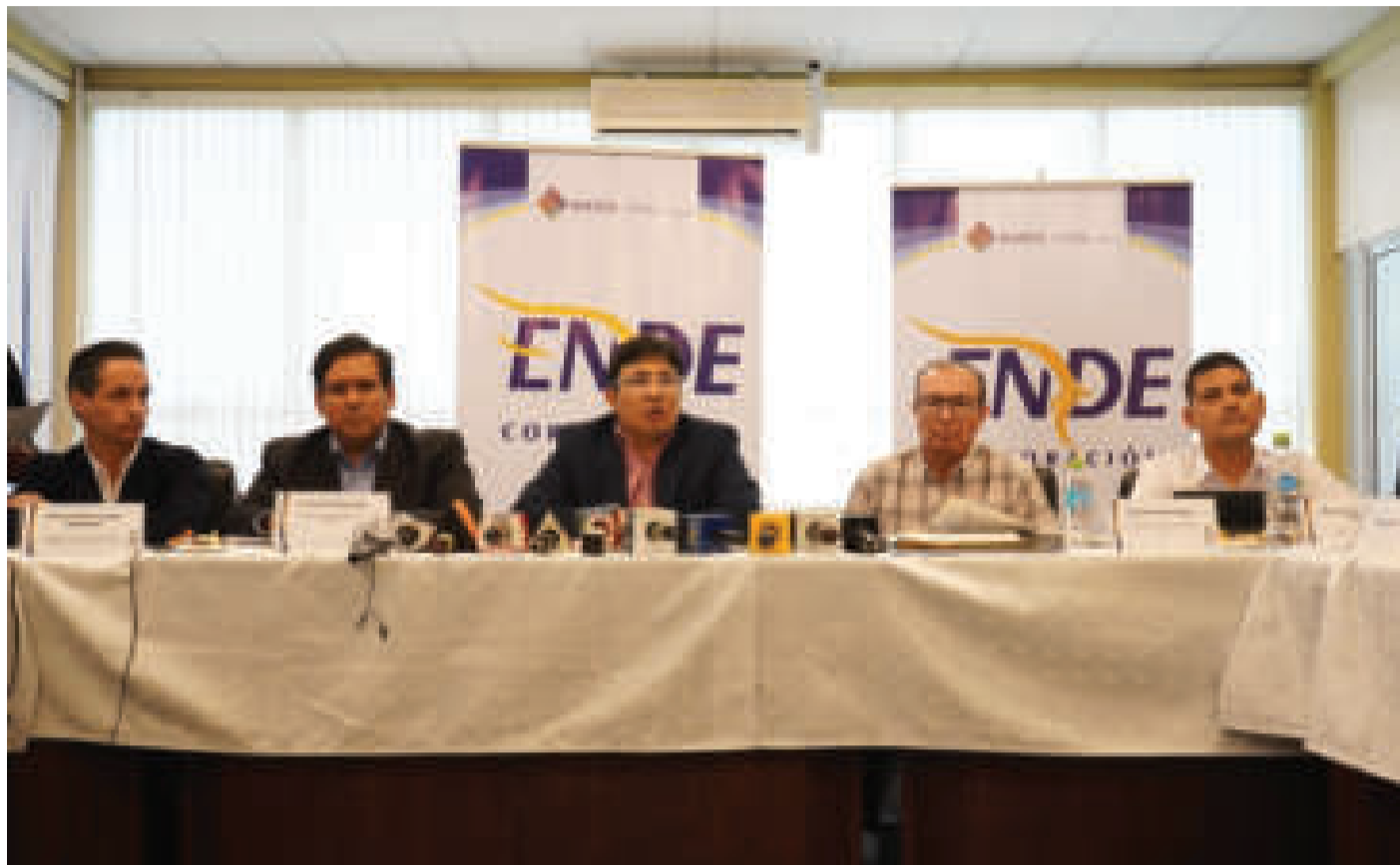
El ministro de Hidrocarburos, Franklin Molina (centro), junto a autoridades de ENDE.