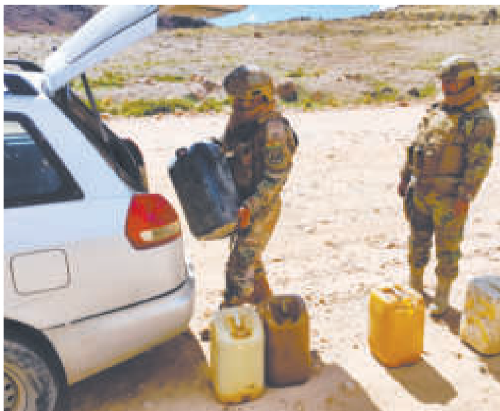
Incautación de gasolina que estaba siendo desviada al contrabando.