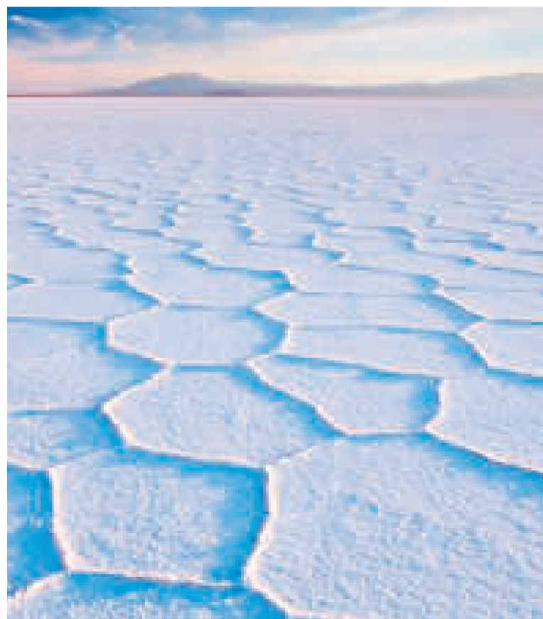
El salar de Uyuni es uno de los sitios turísticos más rentables para el país.

“Son 12 millones de euros que estamos ejecutando en 2024 gracias a las gestiones de nuestro ministro de Desarrollo Productivo, Néstor Huanca”, dijo el viceministro.