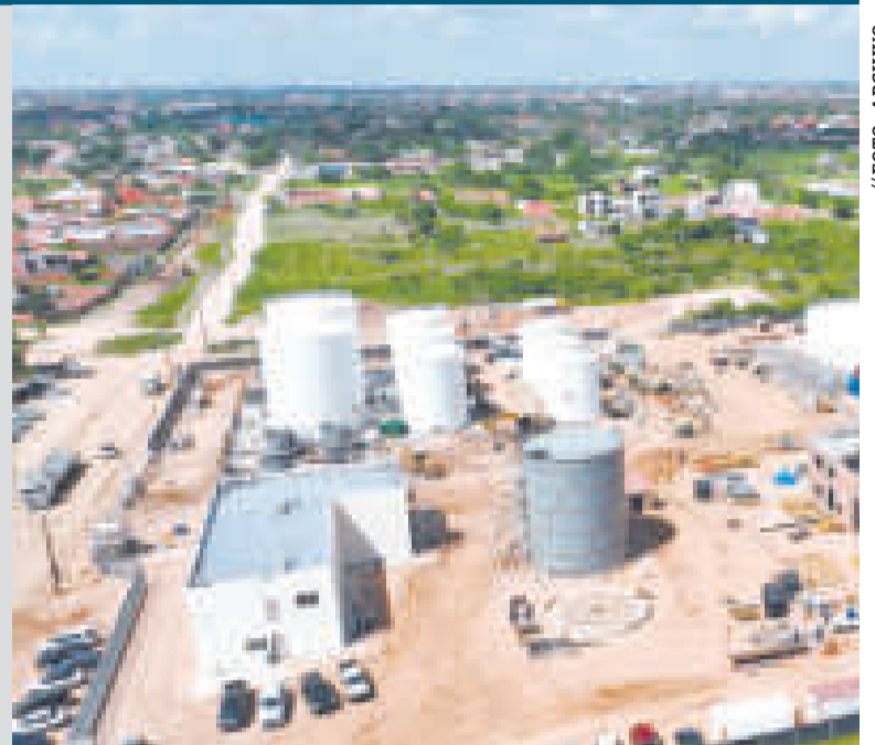
Avances de la construcción de la Planta de Biodiésel I.

De acuerdo con Yacimientos Petrolíferos Fiscales Bolivianos (YPFB), la Planta de Biodiésel I procesará diariamente 1.500 barriles de biodiésel con materia prima proveniente de aceites vegetales como el macororó, palma y soya, entre otros.