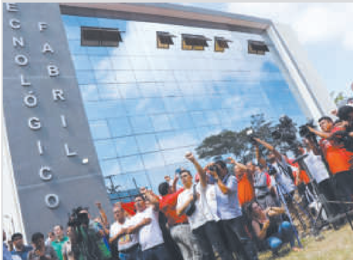
Acto de entrega del nuevo instituto fabril en Santa Cruz.