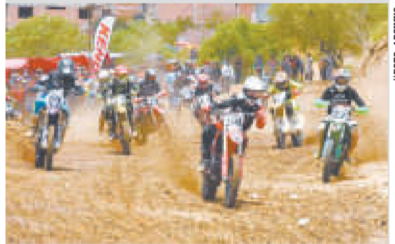
La primera carrera nacional de motociclismo de 2024 se disputará en Montero.

Los dirigentes de las asociaciones y de la Federación se reunieron el viernes en Santa Cruz, donde hicieron una evaluación de la gestión pasada y dieron el visto bueno al calendario nacional de las carreras. Fue aprobado el Reglamento de Competencias, "que contiene muchas modificaciones que comprenden la seguridad de todos los pilotos y el público en general", informó la FBM.