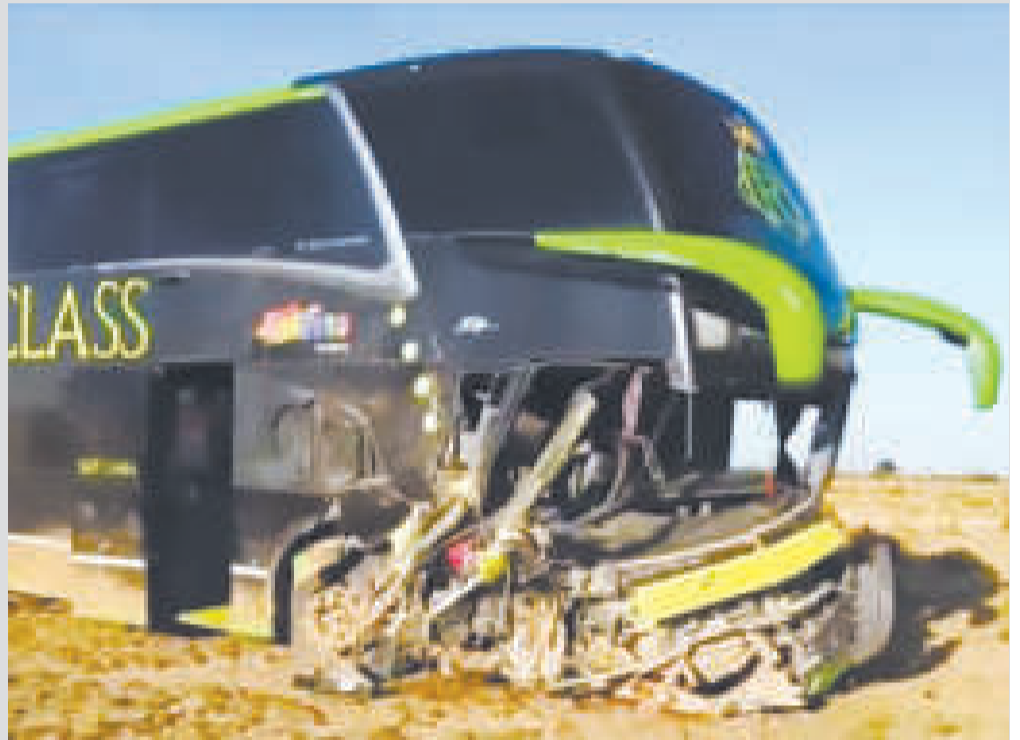
Daños materiales de consideración en ambos vehículos.