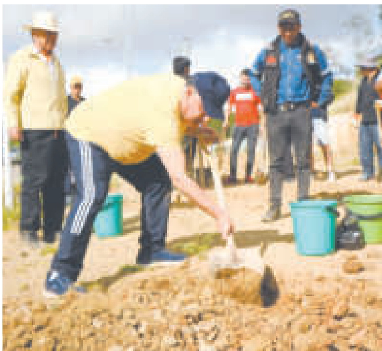
El fiscal general Juan Lanchipa durante la reforestación.