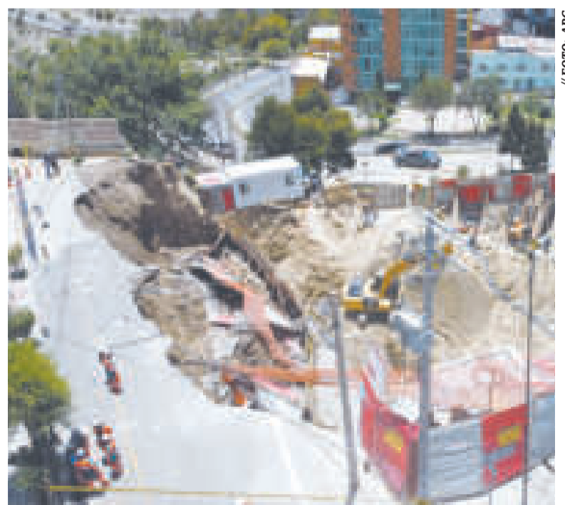
La zona donde se hundió la plataforma.

Las causas del colapso aún permanecen en evaluación, sin embargo, por seguridad, las calles adyacentes al lugar del hecho permanecen cerradas a la circulación vehicular. No se registraron daños personales, solo materiales.