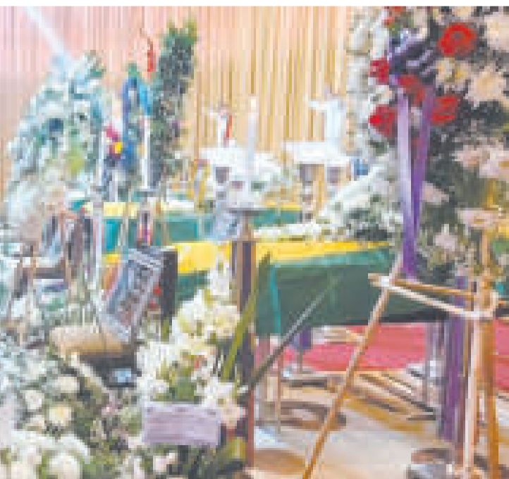
El ministro de Defensa, Edmundo Novillo, en el velorio de los militares, en La Paz.