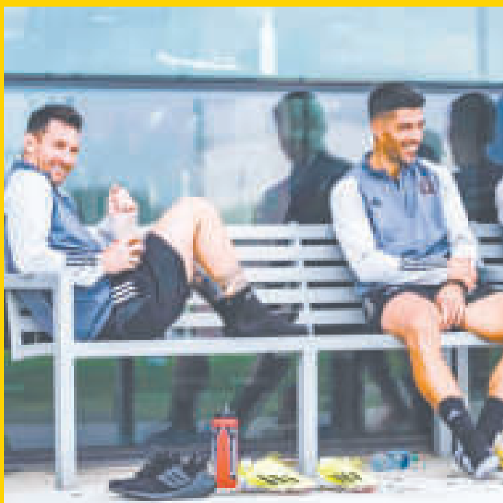
Messi (izq.) y Luis Suárez sonríen en el inicio del trabajo del Inter Miami.