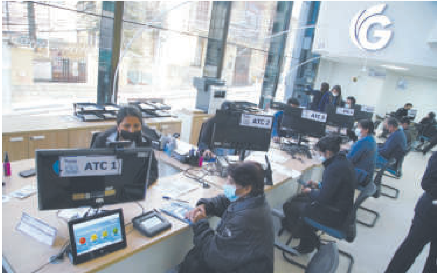
La Gestora Pública.

Con relación a la cartera de recaudaciones, la Gestora Pú-