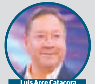
Luis Arce Catacora

La obra demandará una inversión de $us 47 millones. La cifra superará los $us 400 millones con la Planta de Biodiésel II de Senkata, El Alto; la de diésel ecológico HVO y proyectos adicionales que tienen que ver con la evacuación del producto, la logística como tal, transporte, acopio y creación de microempresas.