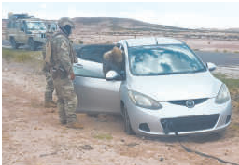
Requisa de un vehículo cuya internación se presume que fue ilegal.