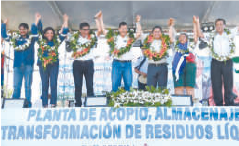
El gobierno del presidente Luis Arce impulsa la industrialización del país con el potencial de cada región.

“Aquí estamos siempre firmes trabajando por el pueblo boliviano”, finalizó el presidente Arce.