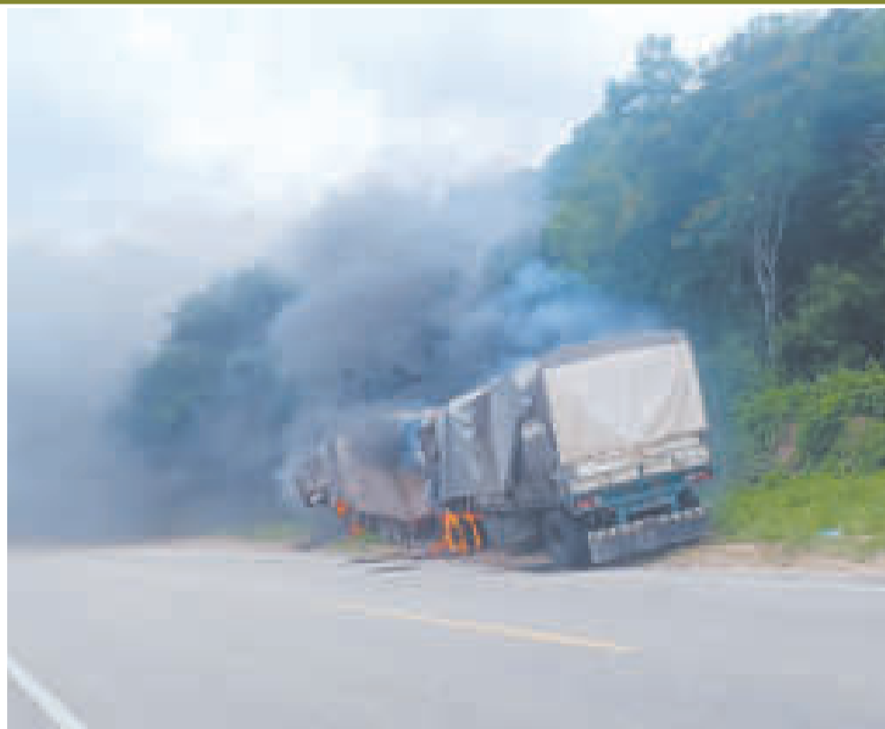
Efectivos proceden a la quema de un camión con productos de contrabando, en Tarija.

“La lucha contra el contrabando es una política de Estado que protege y cuida la economía del pueblo boliviano. Lamentablemente esta misión conlleva altos riesgos y peligros, aún a costa de su propia vida”, posteó Novillo el día que fallecieron los militares.