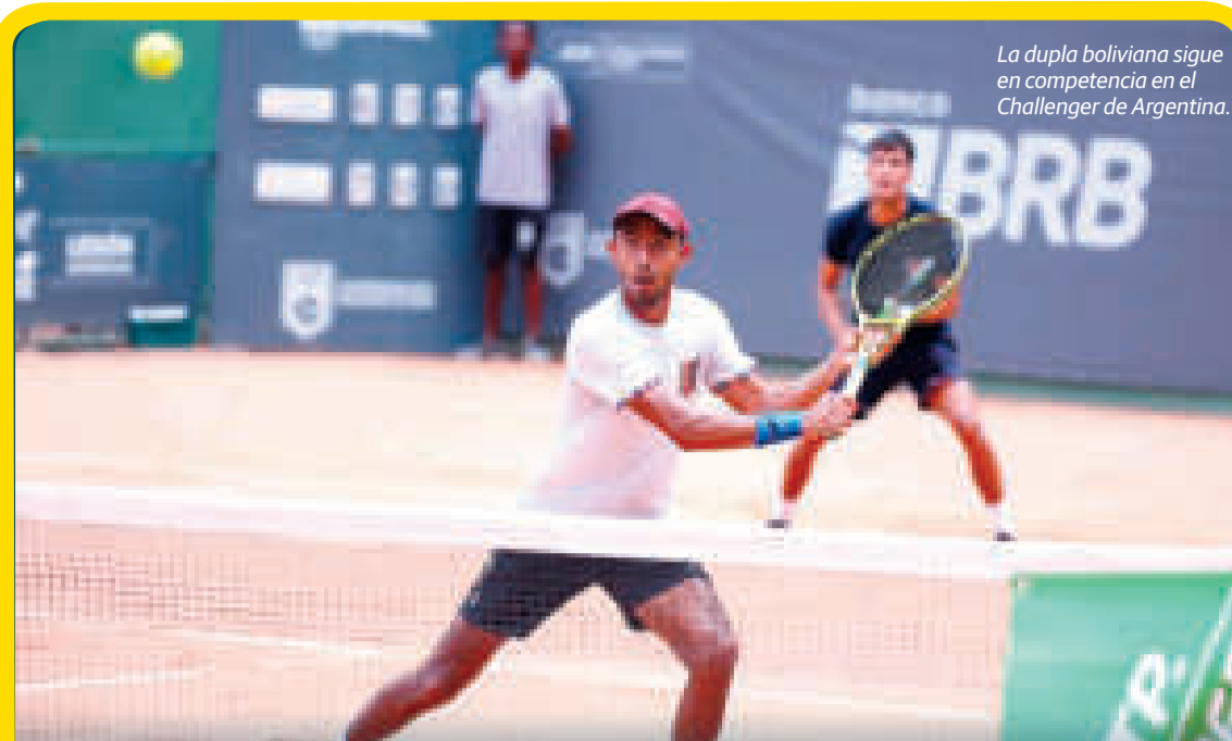
La dupla boliviana sigue en competencia en el Challenger de Argentina.