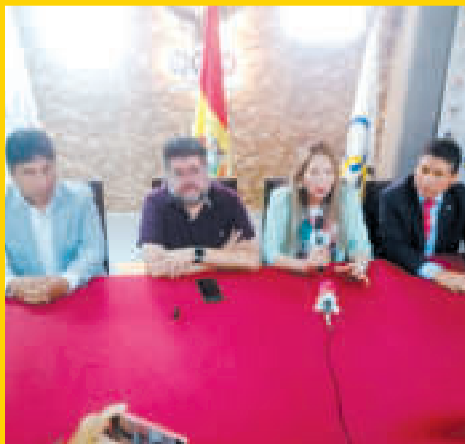
Autoridades deportivas en la reunión celebrada en Sucre.

Desde el Viceministerio de Deportes se aseguró que las tres infraestructuras deportivas en las que trabaja la institución, el Polideportivo de Garcilazo, la Piscina Olímpica y el Poligimnasio, se encuentran afinando los detalles finales para que puedan brindar todas las condiciones, cumpliendo con los máximos estándares internacionales para que los deportistas puedan competir demostrando su talento en la competición que se desarrollará del 4 al 14 de abril.