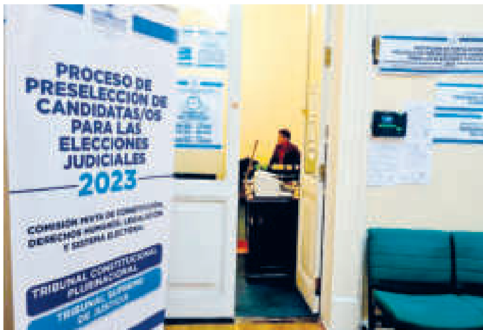
Proceso de preselección de candidatos para las elecciones judiciales del pasado año.

El bloqueo de caminos que debía iniciar ayer fue postergado hasta el lunes en espera de que las autoridades dejen sus cargos y desde el Legislativo se encamine una ley que convoque a las elecciones judiciales; sin embargo, el proceso está empantanado.