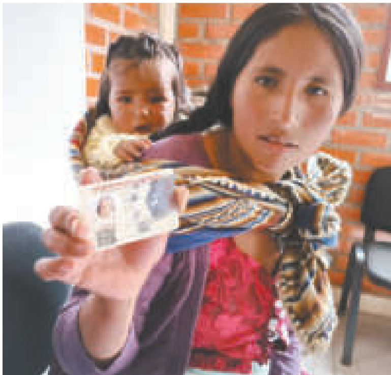
Una madre con la cédula de su bebé.