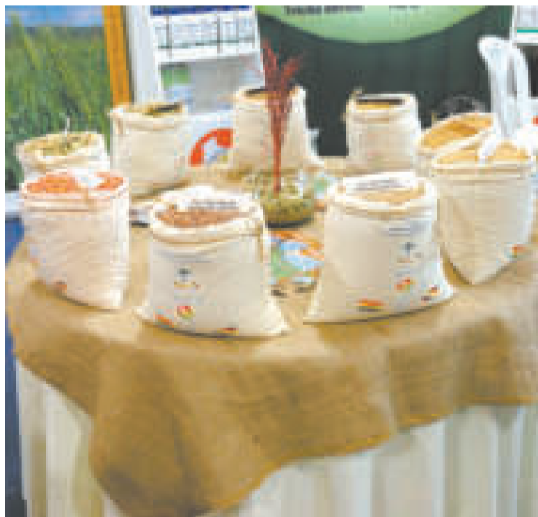
La estatal presenta una variedad importante de semillas.