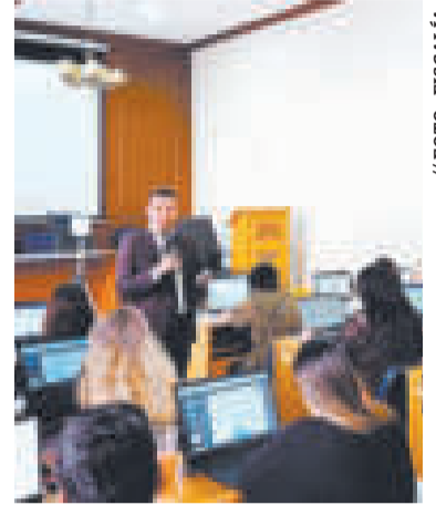
Postulantes durante una clase.

“Vamos a seguir trabajando para dar respuestas en caso de ser necesario”, dijo