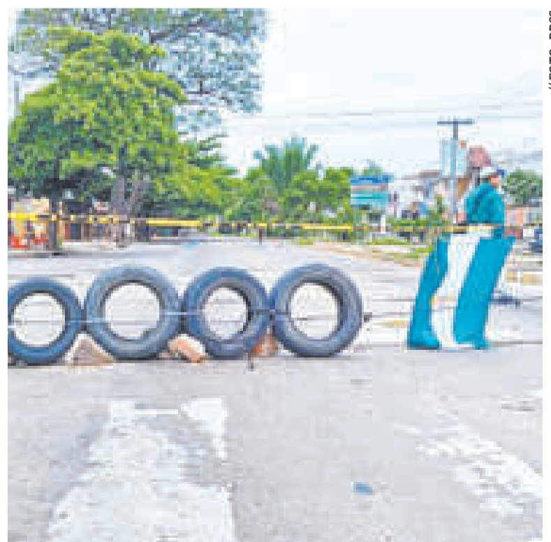
Una vía cerrada en el paro de 36 días en la ciudad de Santa Cruz de la Sierra.

DE FEBRERO ES la fecha hasta la cual se amplió la detención preventiva.