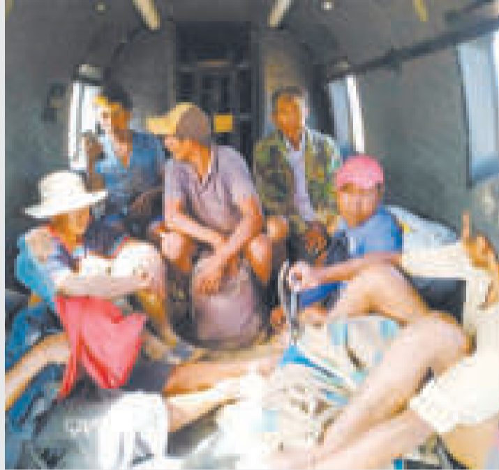
Parte del grupo de los rescatados en un helicóptero de la FAB.

Las operaciones se ejecutaron en los municipios de El Torno y La Guardia del departamento de Santa Cruz. CCREA, en coordinación con el Viceministerio de Defensa Civil, organizó el rescate con el apoyo de un helicóptero Súper Puma de la Fuerza de Tarea Aérea Diablos Rojos para evacuar a las personas atrapadas en islotes formados naturalmente en medio de la crecida de las aguas producto de las lluvias que cayeron en la región desde la mañana.