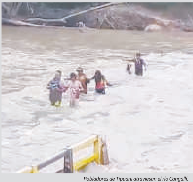
Pobladores de Tipuani atraviesan el río Cangallí.