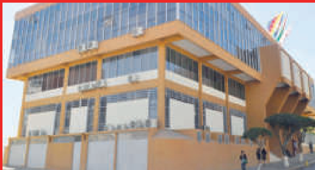
El Tribunal Constitucional Plurinacional.