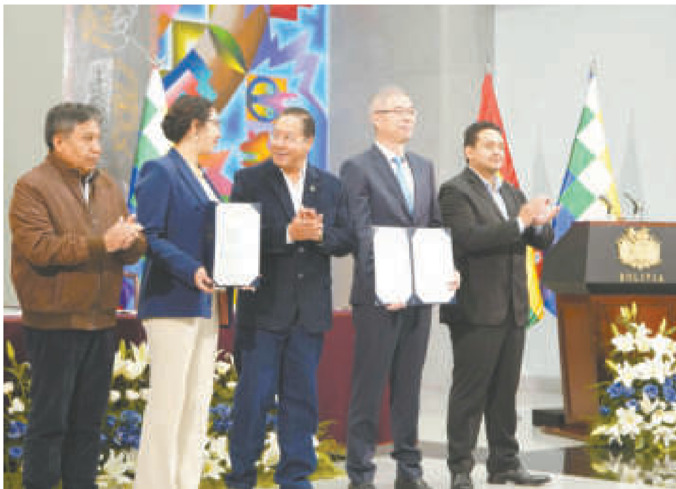
El presidente Luis Arce junto a autoridades de Estado y representantes del consorcio chino CBC.

El complejo tendrá una capacidad inicial de 2.500 toneladas por año de producción de carbonato de litio. La inversión llega a $us 90 millones.