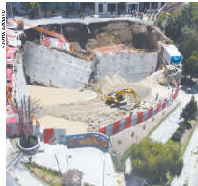
El hundimiento y colapso de la plataforma.

El colapso de la plataforma ocurrió el jueves como resultado de la construcción de un edificio.