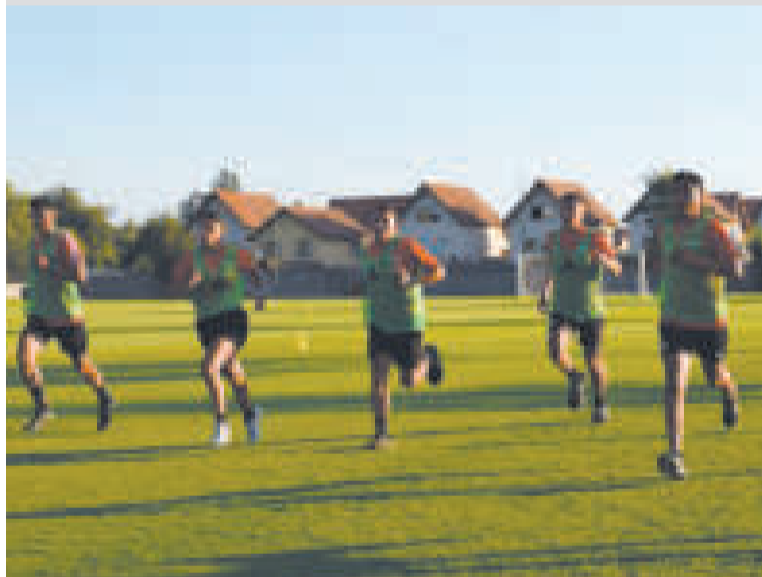
Árbitros bolivianos durante las pruebas físicas en Chile.

Las actividades de los becarios bolivianos se desarrollaron ayer y continuarán hoy con el trabajo en simuladores de videoarbitraje, con la finalidad de que vayan adquiriendo las destrezas suficientes para el uso de la herramienta propia del fútbol profesional.