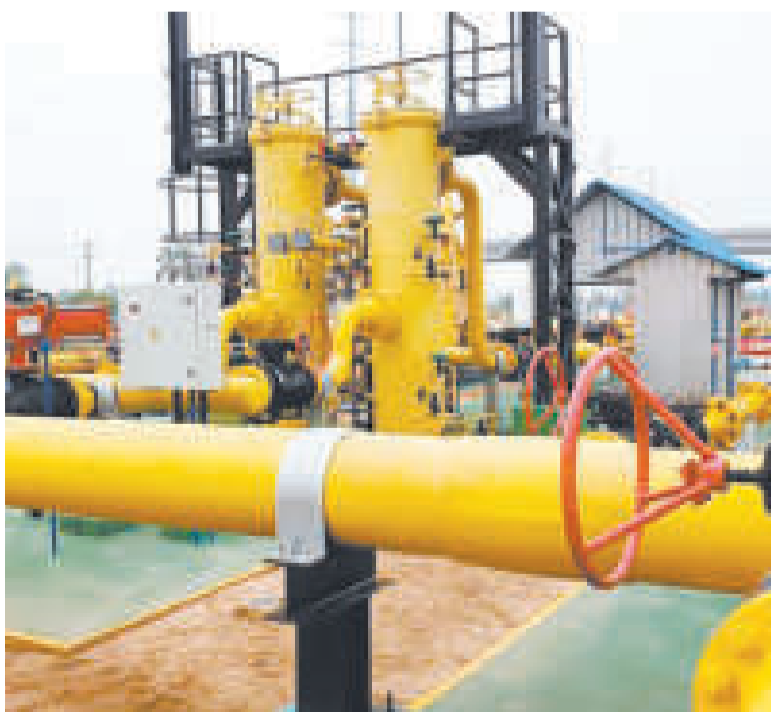
Ductos de la estatal YPFB.