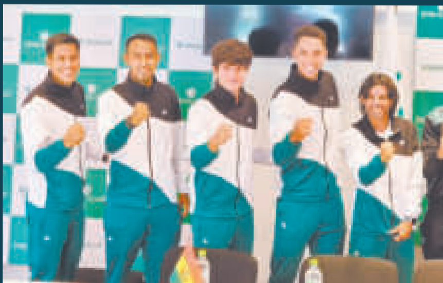
La confianza del equipo Bolivia de tenis por lograr el objetivo de ascender en la Copa Davis.

Hoy, el combinado nacional enfrentará a la poderosa Brasil (10.45 de Bolivia).