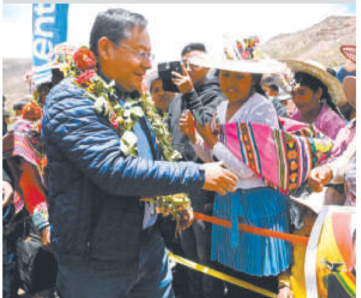
El presidente Arce recibe el cariño del pueblo.