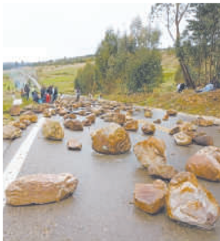
El corte de rutas contra la ciudadanía.

“Prácticamente el problema se está solucionando a nivel de la Asamblea Plurinacional y, de manera conjunta, con los actores políticos que tienen representación parlamentaria. Ese acercamiento está siendo impulsado por nuestro hermano vicepresidente David Choquehuanca. Por lo que estas acciones radicales son un atentado contra los propios bolivianos por parte de un sector de políticos radicales enfascado solamente en intereses personales”, sostuvo.