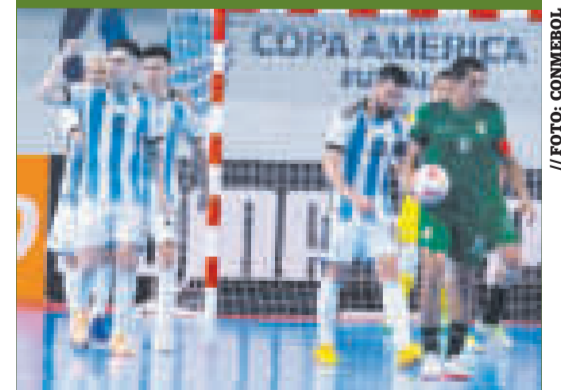
Escena del triunfo argentino ante la Selección de futsal.