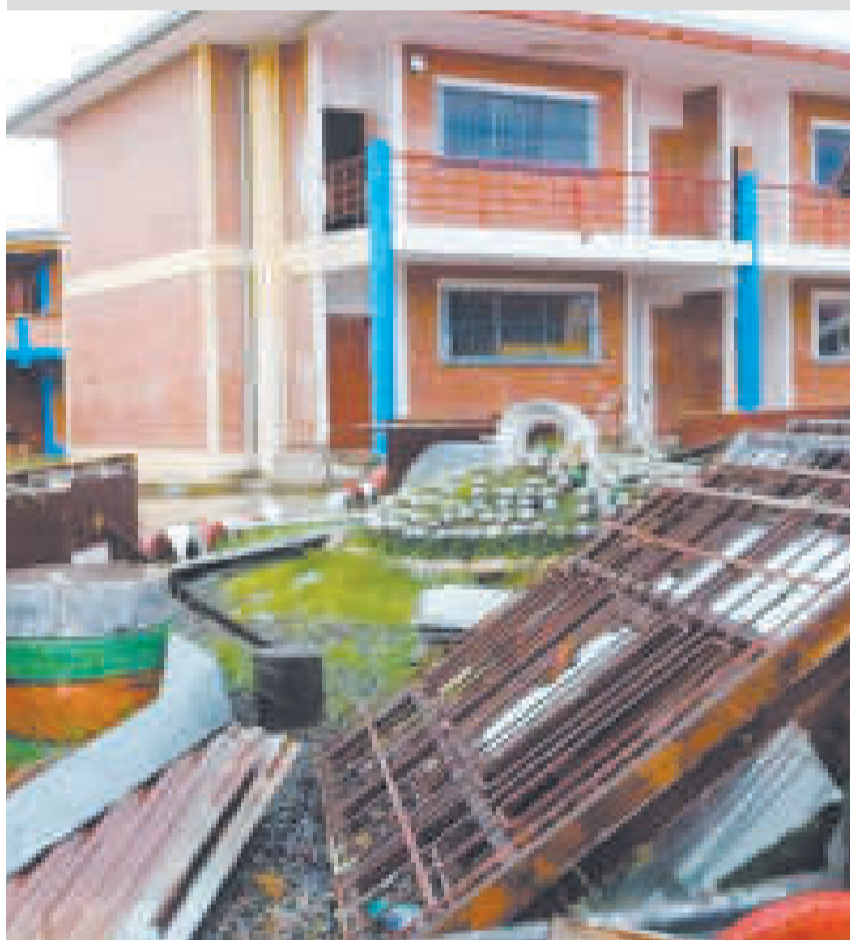
Las alcaldías son las entidades competentes para atender el estado de los colegios.