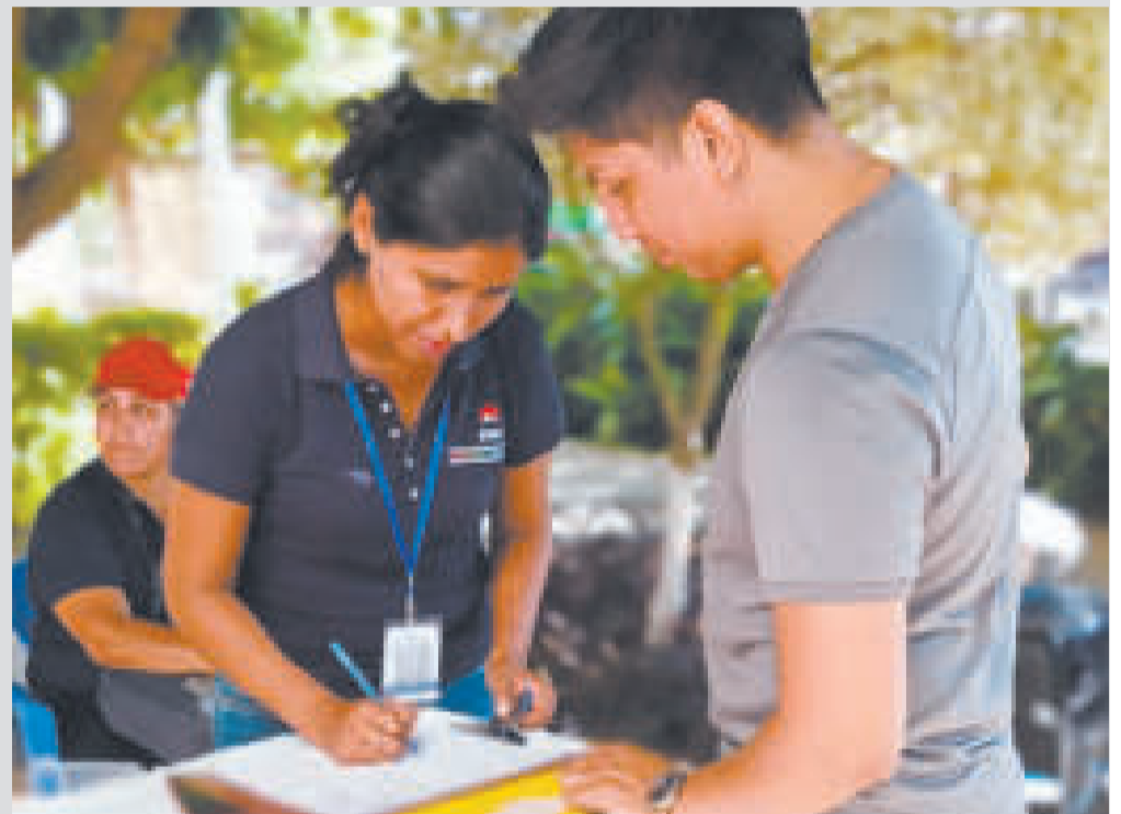
Inscripción de un censista voluntario en Montero, en el departamento de Santa Cruz.

Reiteró además que el proceso censal cumple con el cronograma, y dijo que el apoyo de la población es fundamental con su participación como censistas voluntarios o abriendo la puerta al censo en marzo.