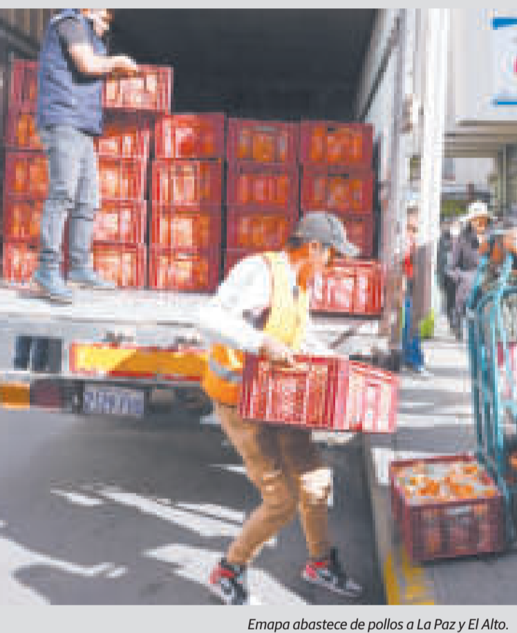
Emapa abastece de pollos a La Paz y El Alto.