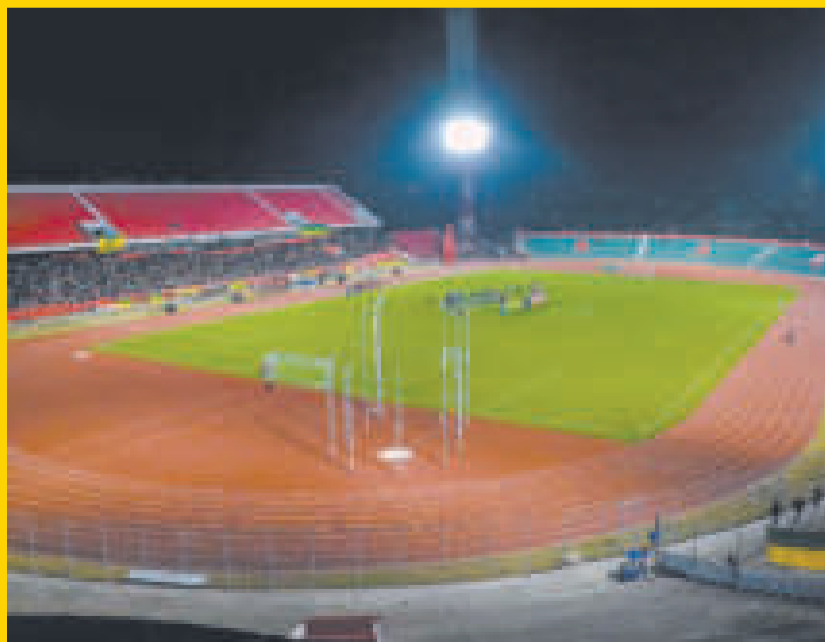
El estadio IV Centenario de Tarija fue aprobado para recibir partidos internacionales.