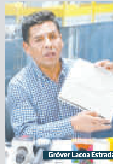
Gróver Lacoa Estrada

Los puentes aéreos trasladarán 40 mil piezas de pollo el fin de semana, anunció el viceministro de Comercio y Logística Interna, Gróver Lacoa.