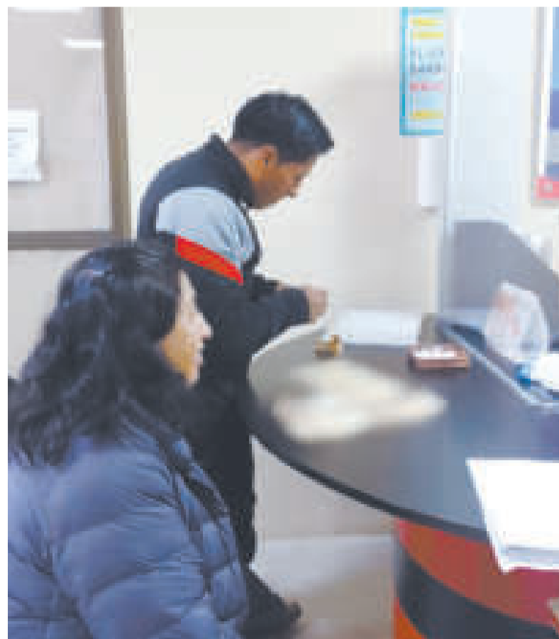
Una trabajadora que hizo valer sus derechos laborales.