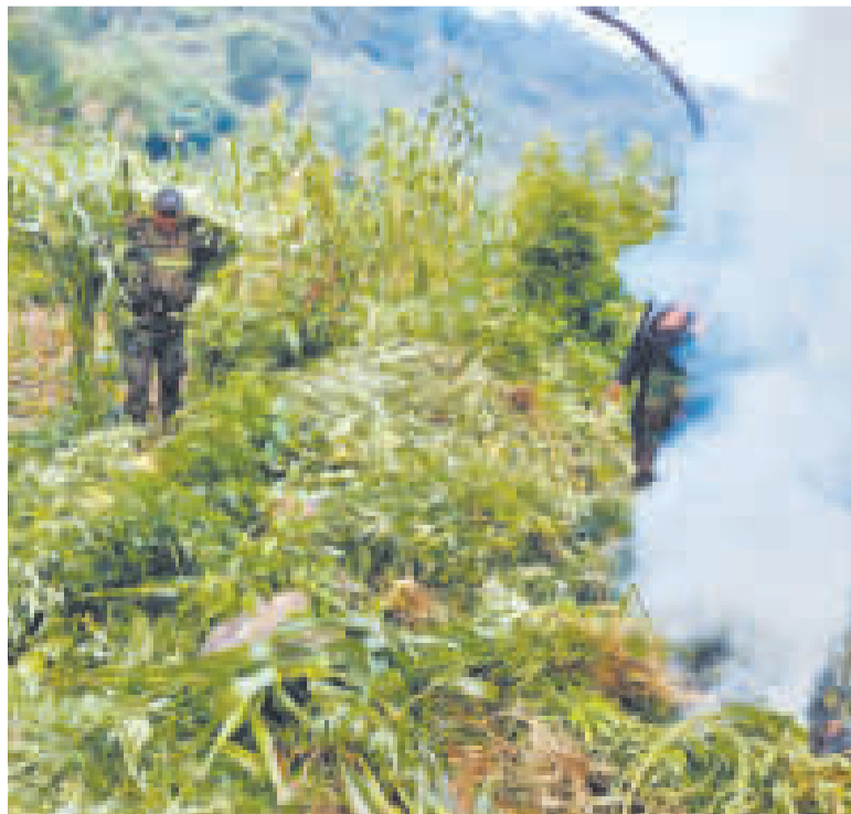
Destrucción de la marihuana secuestrada.

En otro caso, tres ciudadanos bolivianos fueron aprehendidos en inmediaciones de la Carretera Bioceánica, en Santa Cruz, por posesión de seis kilos 500 gramos de pasta base de cocaína.