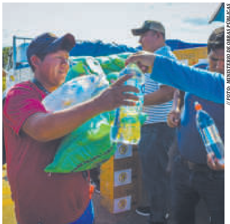
Entrega de ayuda humanitaria a los transportistas en Cochabamba.

DE ENERO se instaló el bloqueo principalmente en Cochabamba.