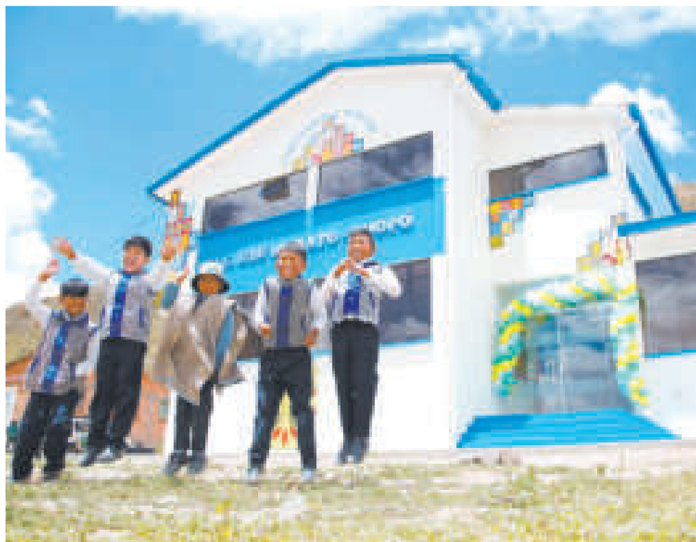
La unidad educativa que entregó el presidente Arce tiene equipamiento de laboratorio.

los rincones del país, seguiremos haciendo todos los esfuerzos para cumplir con nuestra población y el mandato constitucional (...) Hemos construido más de 5.600 metros de red primaria, instalación de una Estación Distrital de Regulación (EDR) y más de 42 mil metros de red secundaria”, detalló.