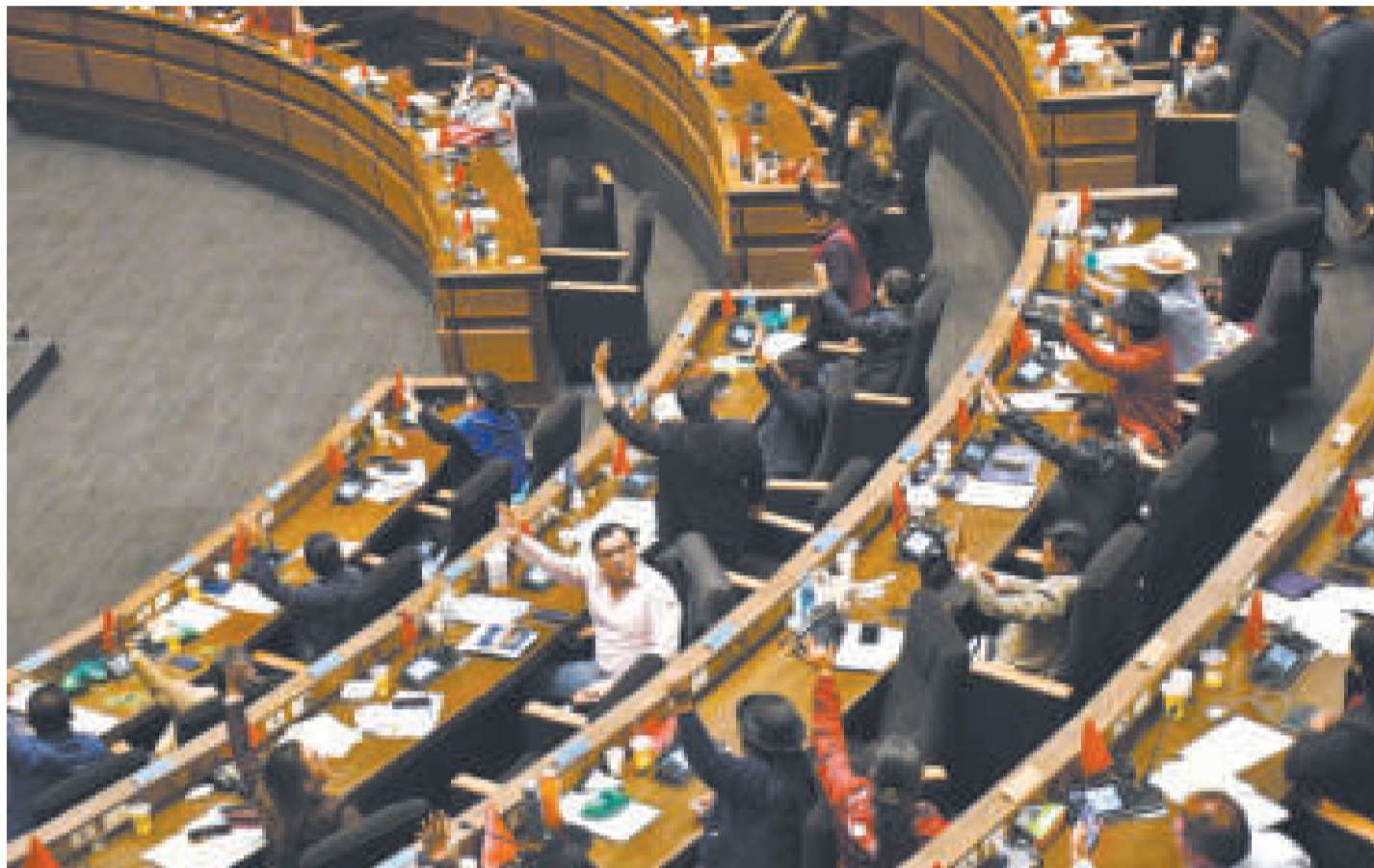
Una de las sesiones en la Cámara de Diputados de la Asamblea Legislativa.

También está el contrato de préstamo NOS. 5801/OC-BO y 5802/KI-BO para el Programa de Electrificación Rural III del 6 de diciembre de 2023, entre el Estado Plurinacional y el Banco Interamericano de Desarrollo - BID, por un monto de hasta $us 200.000.000; b) el convenio de préstamo 9611-BO para el Pro-