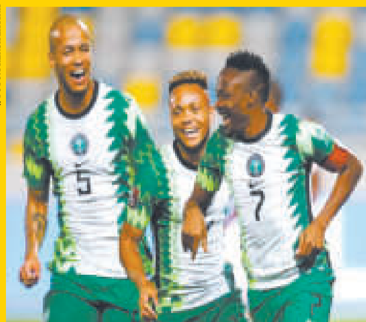
Jugadores de la selección de Nigeria festejan la clasificación a la final.