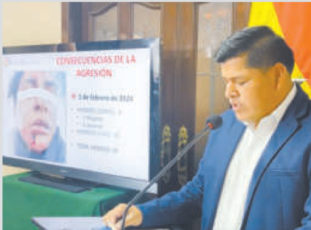
El viceministro Jaime Mamani durante un informe sobre policías heridos en un desbloqueo en Caracollo, Oruro.