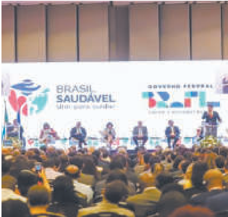
Brasil lanza el plan nacional para eliminar 12 enfermedades socialmente determinadas.