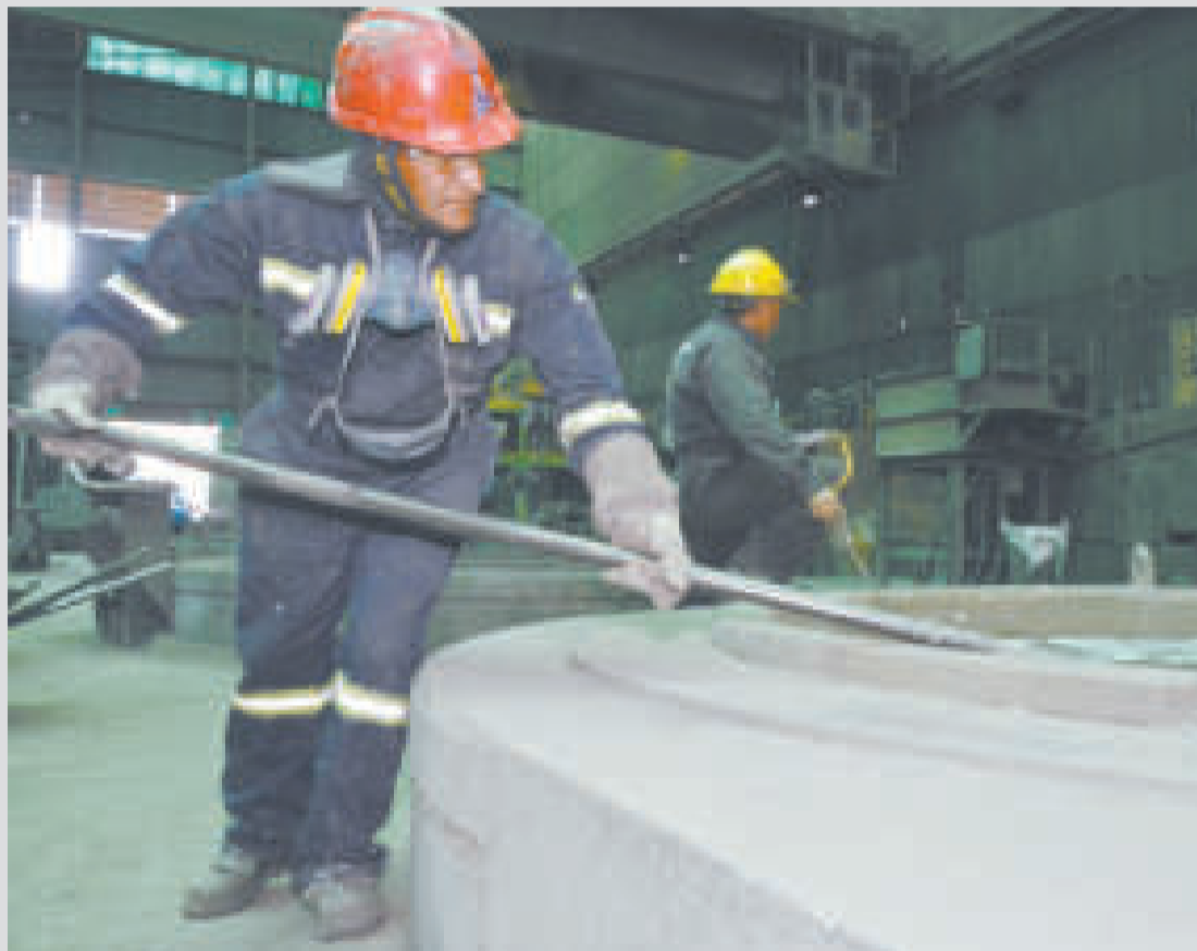
La firma tendrá una capacidad de tratamiento de 150 mil toneladas (t) de concentrados de zinc por año y 65 mil t/año de zinc metálico.

para el pueblo orureño, ya que se podrá crear empresas que puedan abastecer de los insumos y servicios, y así evitar que se los tenga que importar. Generará unos 500 empleos directos y 2.000 indirectos.