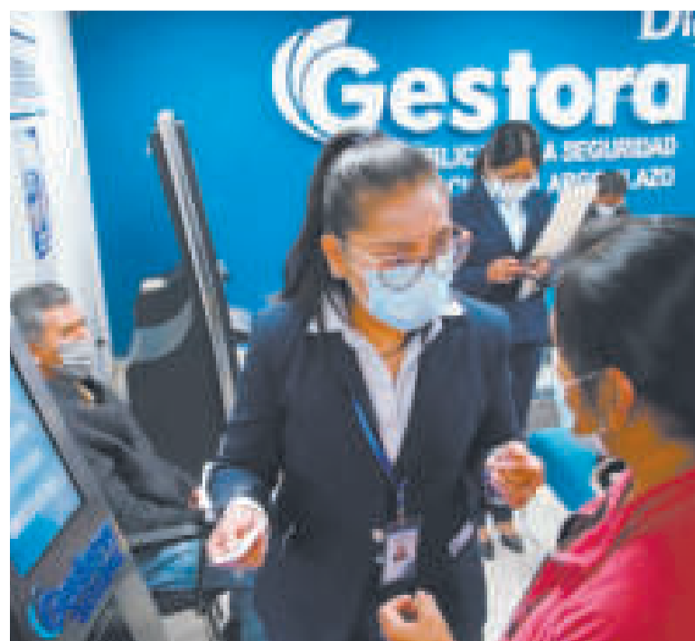
Oficinas de la Gestora Pública.

"Todo el detalle respecto a estas inversiones se puede encontrar en la Bolsa Boliviana de Valores (BBV) y en la página web (de la empresa estatal), porque nosotros le estamos dotando a la Gestora una gestión transparente", señaló Durán.