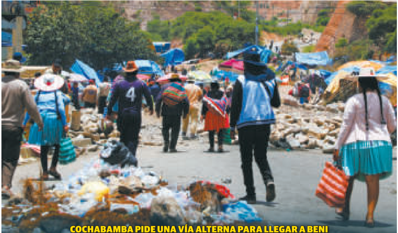
COCHABAMBA PIDE UNA VÍA ALTERNA PARA LLEGAR A BENI

Las medidas de presión de Evo provocan pérdidas por cerca de $us 1.000 millones