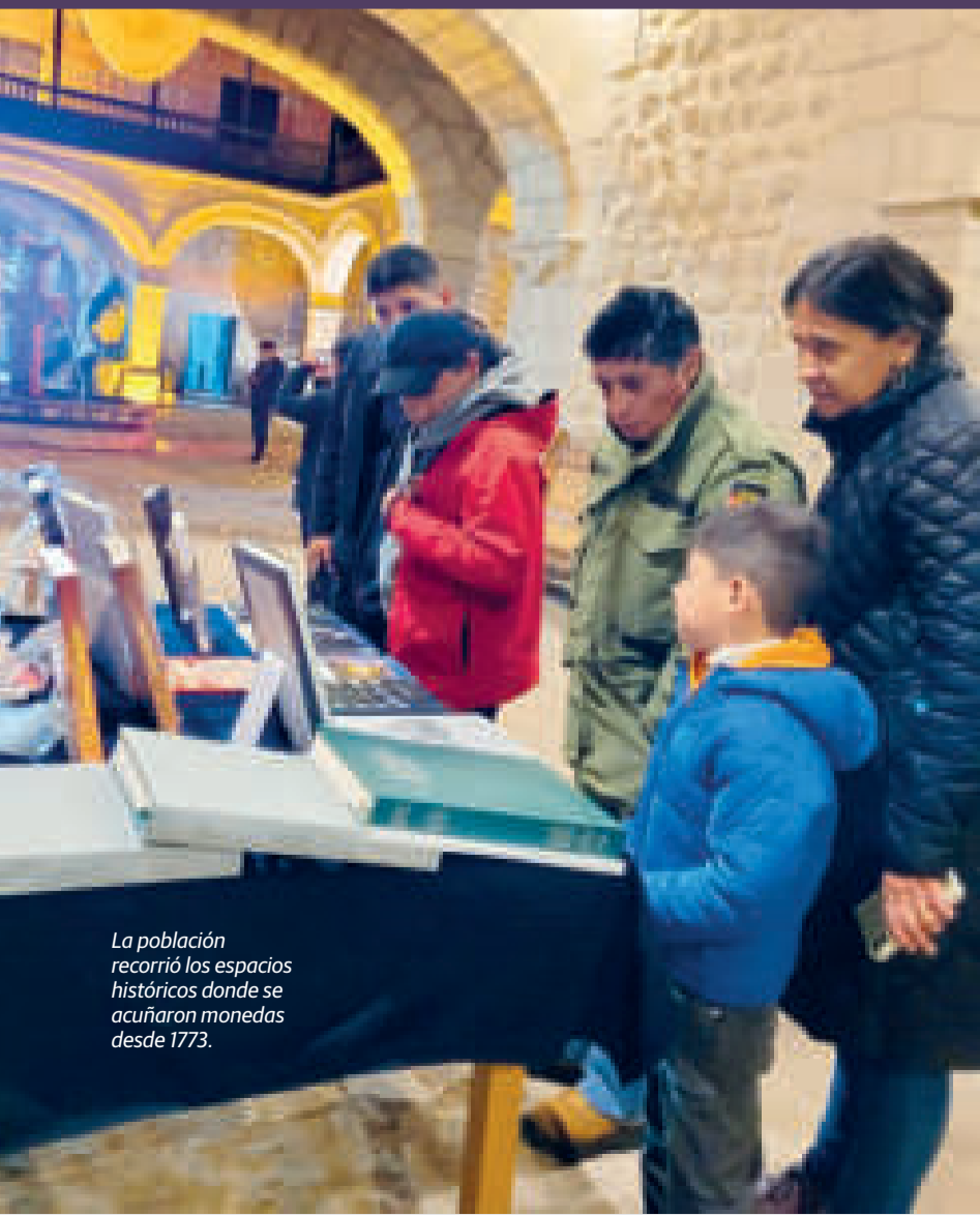
La población recorrió los espacios históricos donde se acuñaron monedas desde 1773.