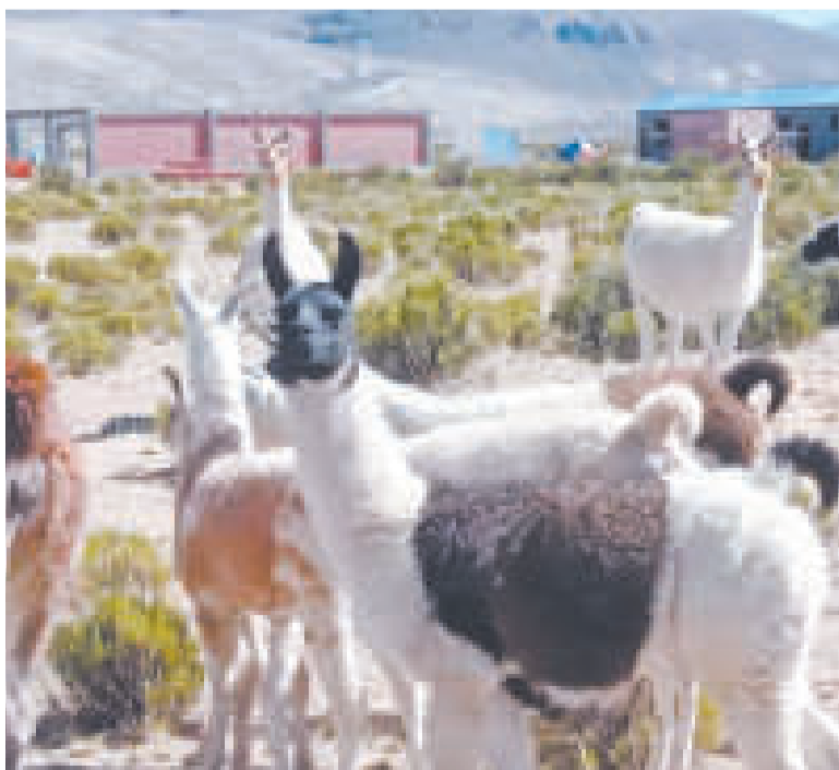
La producción camélida es un ámbito importante de financiamiento.