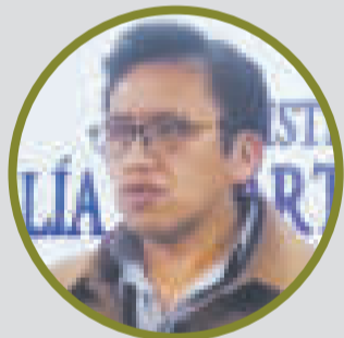
EL FISCAL CARLOS RENÁN CORTEZ dio detalles sobre el hallazgo de sustancias sólidas, aparentemente oro.

Explicó que el informe de intervención policial hace mención a la aprehensión de dos personas, un boliviano y una ciudadana peruana, por la posesión de los paquetes en el interior de un vehículo marca Toyota.