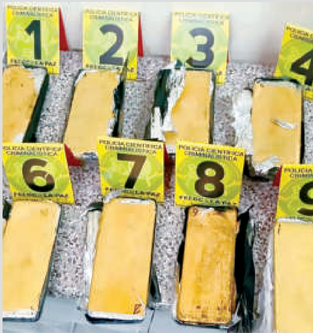
Los bloques de oro son exhibidos por la FELCN.