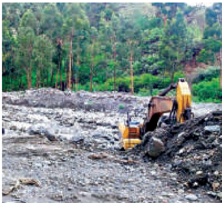
Maquinaria en pleno trabajo en el municipio de Tiquipaya.

El departamento de Cochabamba tiene 49 municipios que están en alerta naranja.