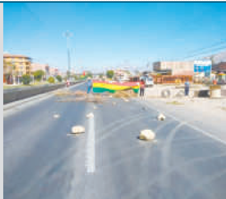
Los bloqueos afectaron a todo el país.

Para prevenir un perjuicio similar en el futuro, este sector presentó tres propuestas. La primera está enfocada en una vía alternativa de circulación.