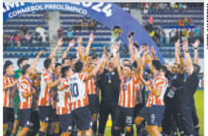
Seleccionados paraguayos festejan el título y la clasificación a las Olimpiadas 2024.

Un dato sobresaliente de la definición del campeonato sudamericano en Caracas fue la conducción del experimentado entrenador paraguayo Carlos Jara Saguier, que con 73 años mostró su total vigencia.