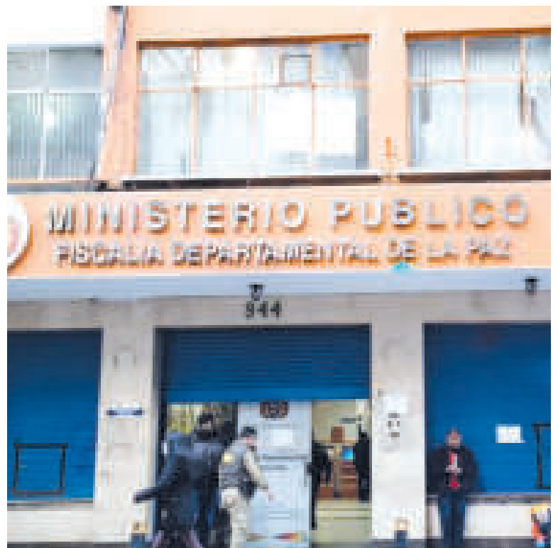
Ingreso principal a la Fiscalía Departamental de La Paz, en la calle Potosí.

en el hecho, una está aprehendida y la otra arrestada.