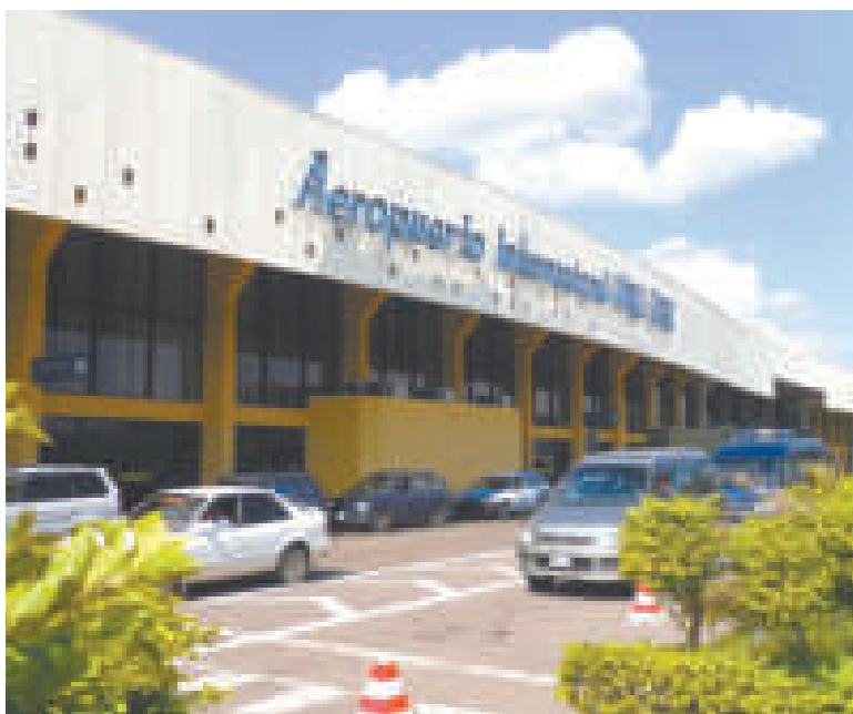
Infraestructura del aeropuerto de Viru Viru en Santa Cruz.