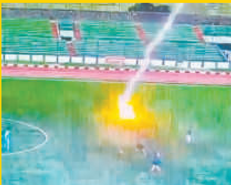
Instancia en la que cayó el rayo sobre el campo de juego en un partido en Indonesia.