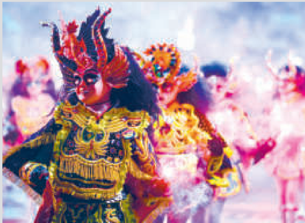
La diablada es una de las danzas más esplendorosas del fastuoso carnaval orureño.