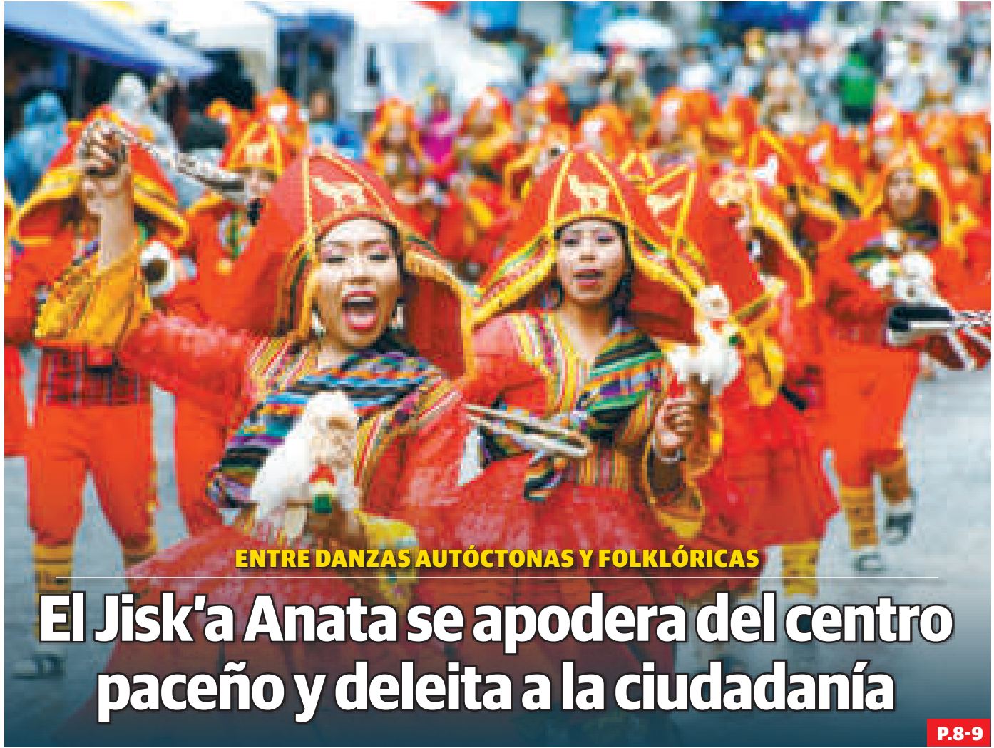
ENTRE DANZAS AUTÓCTONAS Y FOLKLÓRICAS