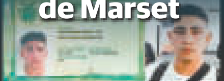
Pasaporte de la República de Uruguay