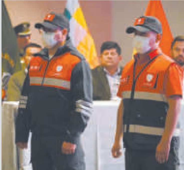
Uniformes que deberán lucir los trabajadores de las empresas de seguridad.