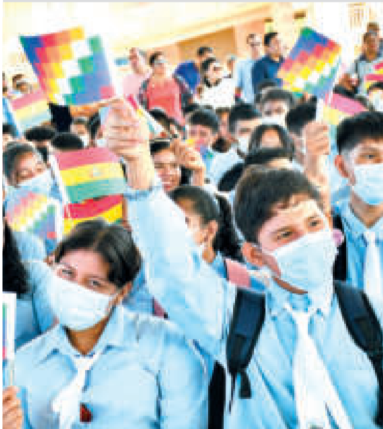
Estudiantes de Trinidad durante la inauguración de año escolar 2024.