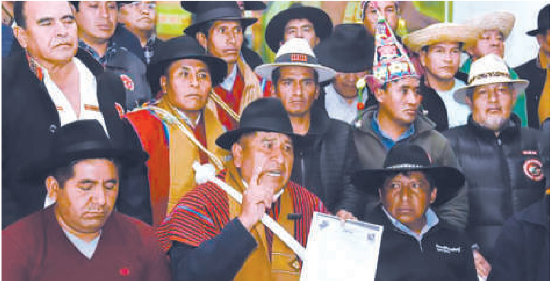
Dirigencia campesina nacional en conferencia de prensa.