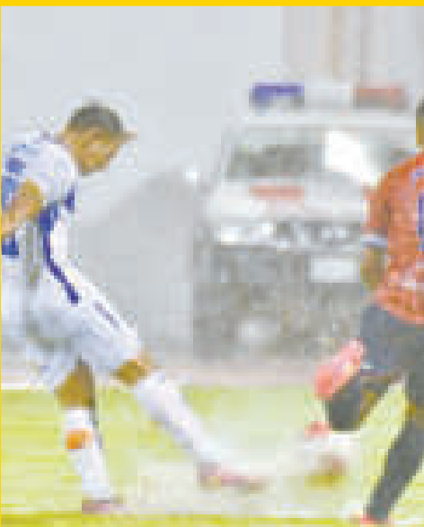
Así quedó el campo de juego del Jesús Bermúdez.

Por el mal estado del campo de juego, que quedó anegado de agua por la torrencial lluvia que cayó sobre la ciudad de Oruro, los delegados de los clubes Gualberto Villarroel San José y Wilstermann, junto a los comisarios de la Federación Boliviana de Fútbol, decidieron suspender el compromiso para hoy, a las 11.00 en el mismo escenario.