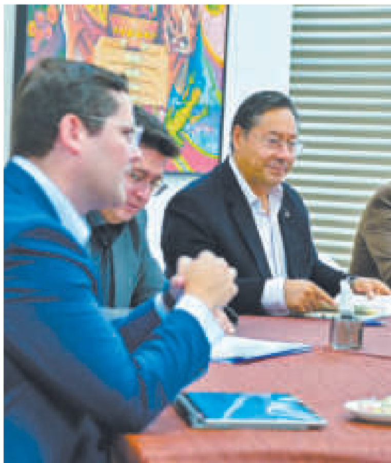
El mandatario Luis Arce y el presidente de la Cainco, Jean Pierre Antelo.

El presidente Arce apuntó, a través de redes sociales, que en la reunión con los empresarios de la Cainco se les explicó “el actual boicot económico que sufre el país por parte de grupos políticos que solo buscan sus intereses personales y no de la mayoría nacional, y manifestamos que no permitiremos que sigan afectando el bolsillo del pueblo boliviano”.