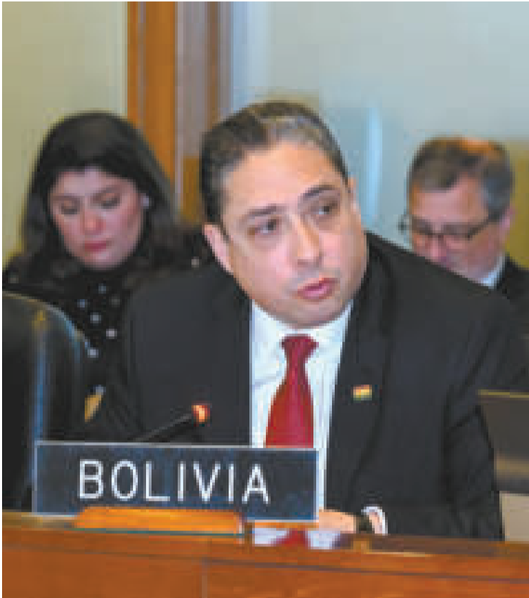
El embajador ante la Organización de los Estados Americano (OEA), Héctor Arce.