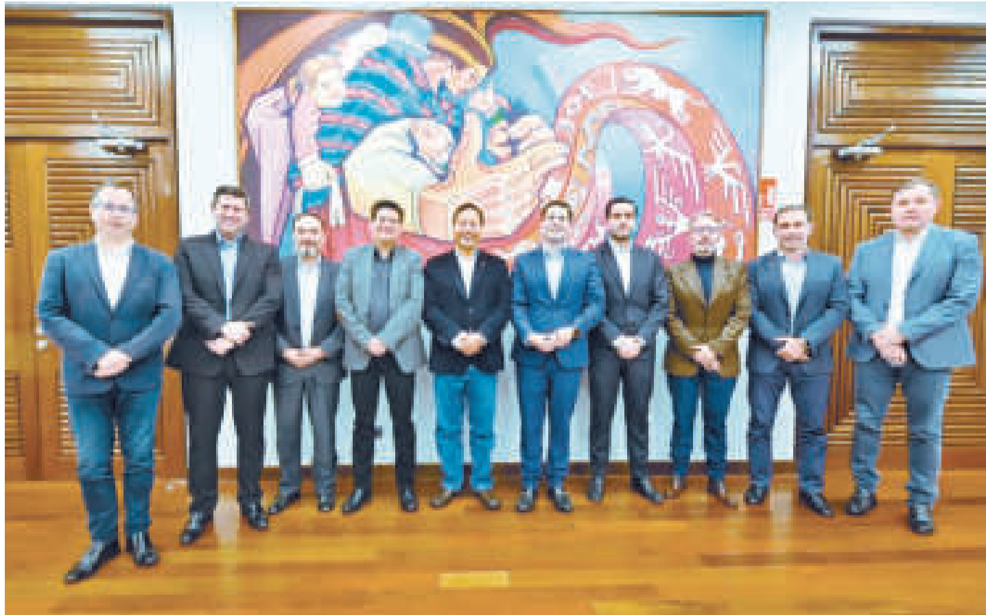
El presidente Luis Arce (c), el ministro de Economía, Marcelo Montenegro, y el portavoz Jorge Richter con el directorio de la Cainco en la Casa Grande del Pueblo.

Por su parte, el ministro de Economía, Marcelo Montenegro, apuntó al finalizar el encuentro: “Ha sido una reunión muy productiva en términos de ver perspectivas, escenarios positivos, congruencia y convergencia de trabajos que se pueden