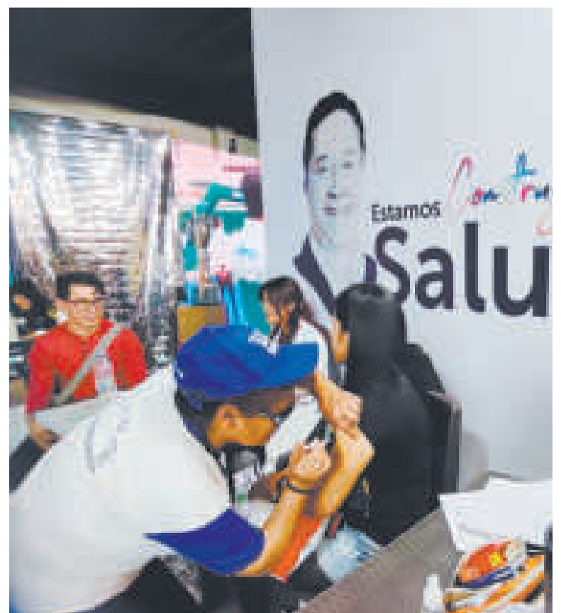
La vacunación desempeña un papel crucial en la prevención de complicaciones graves por el virus.

Enfatizó en la importancia de mantener la precaución y seguir con las medidas de bioseguridad, como el uso adecuado del barbijo ante cualquier síntoma de infección respiratoria, el lavado frecuente de manos y el distanciamiento social. Resaltó la relevancia de la vacunación para prevenir complicaciones graves relacionadas con la enfermedad.