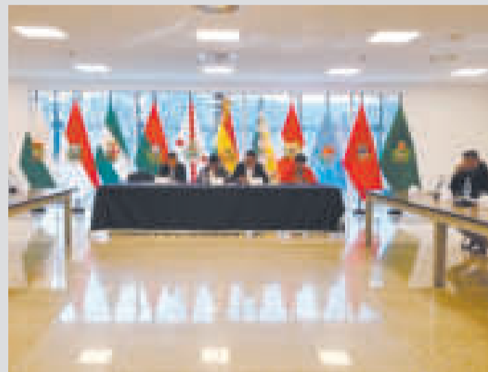
Comisión Mixta de Justicia Plural, Ministerio Público y Defensa Legal del Estado.

“El monto total a requerirse como presupuesto adicional