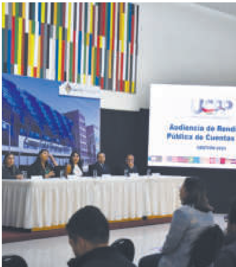
La rendición pública de cuentas de la gestión 2023.