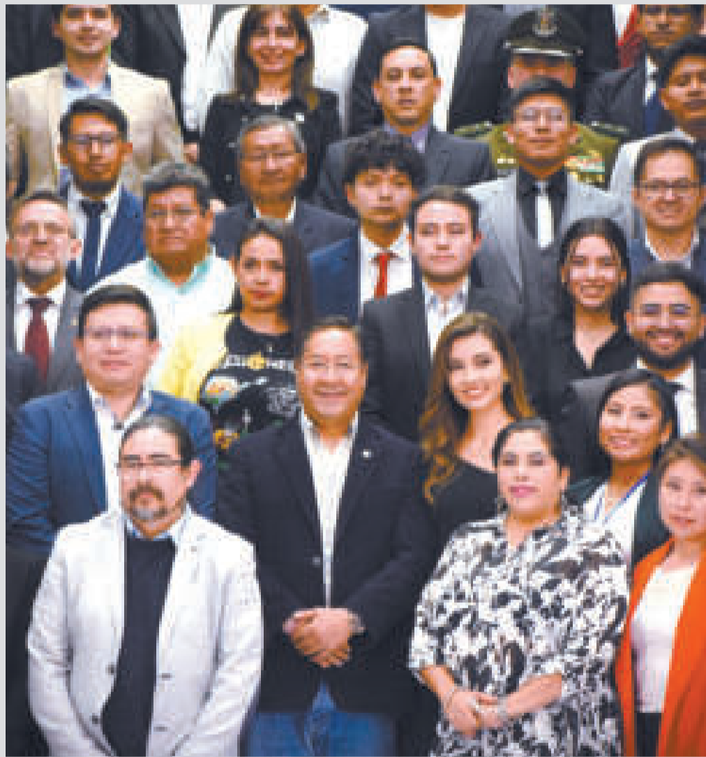
El presidente Luis Arce junto a los premiados en la Casa Grande del Pueblo, en La Paz.