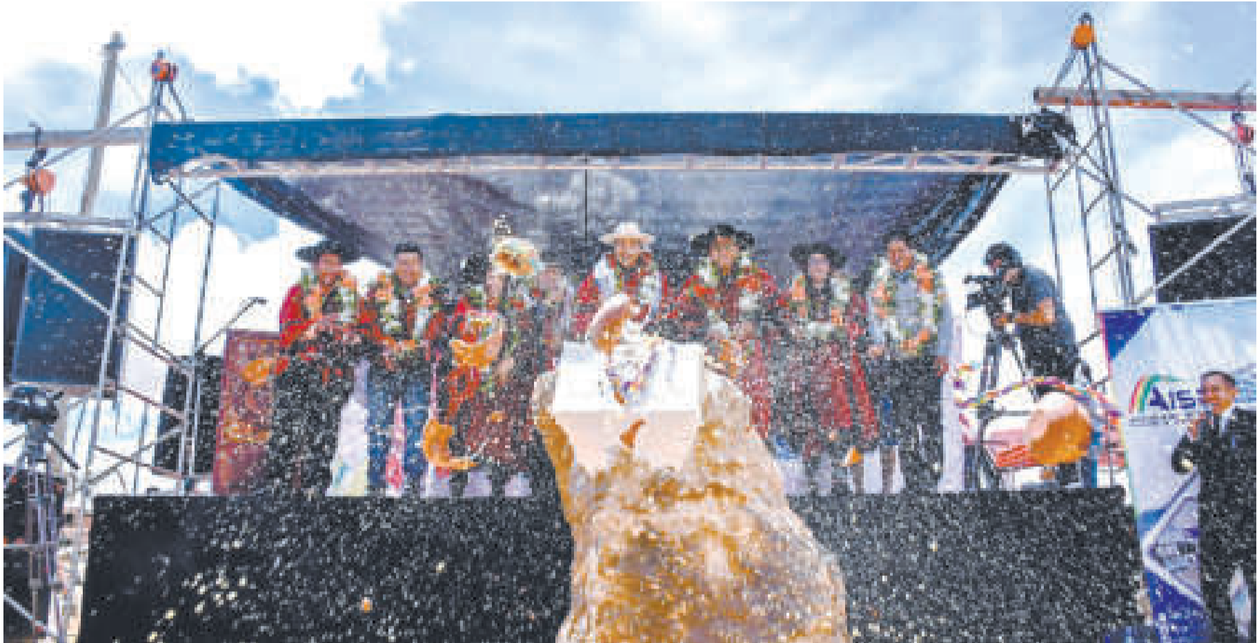
El presidente Luis Arce, acompañado de la Ministra de Salud y Deportes, empezó las obras del nuevo hospital de segundo nivel de Villazón.