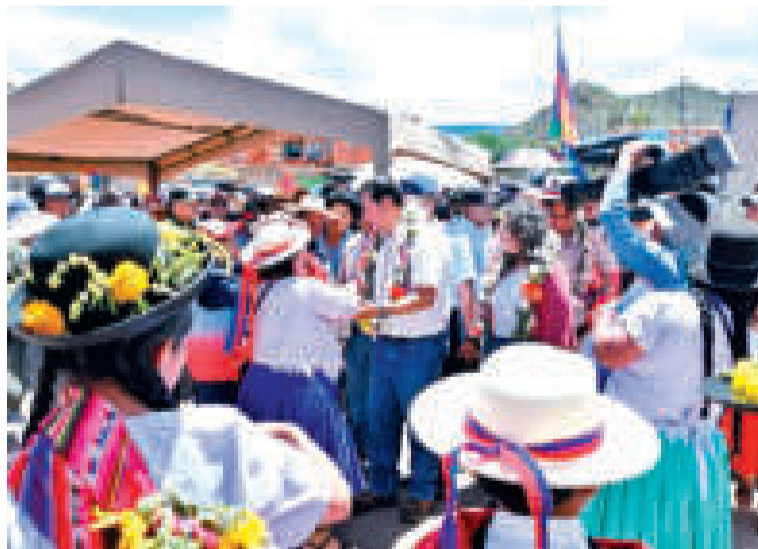
La población de Tupiza le expresó su gratitud al presidente Arce por la obra de salud.

La Ministra de Salud y Deportes señaló que la obra es el resultado de un esfuerzo conjunto, de la voluntad política del mandatario por fortalecer el sistema de salud en todos