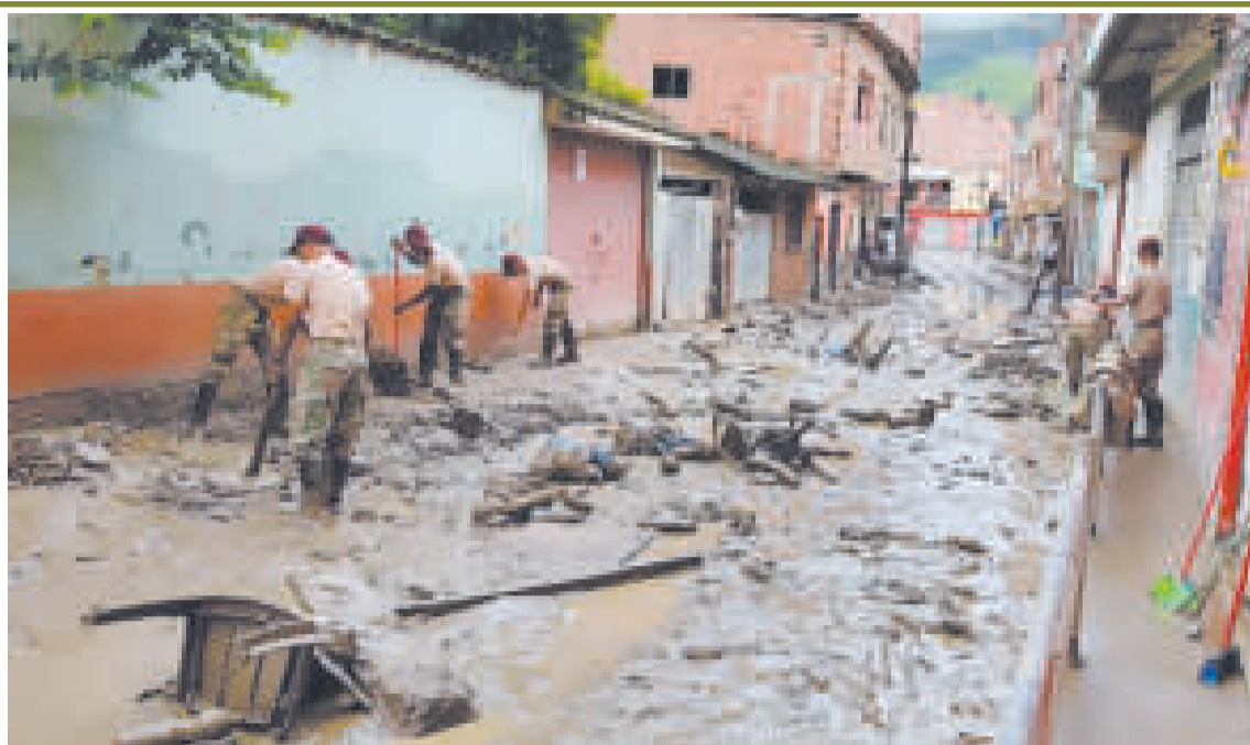
Efectivos militares en labores de limpieza en el municipio de Guanay, al norte de La Paz.