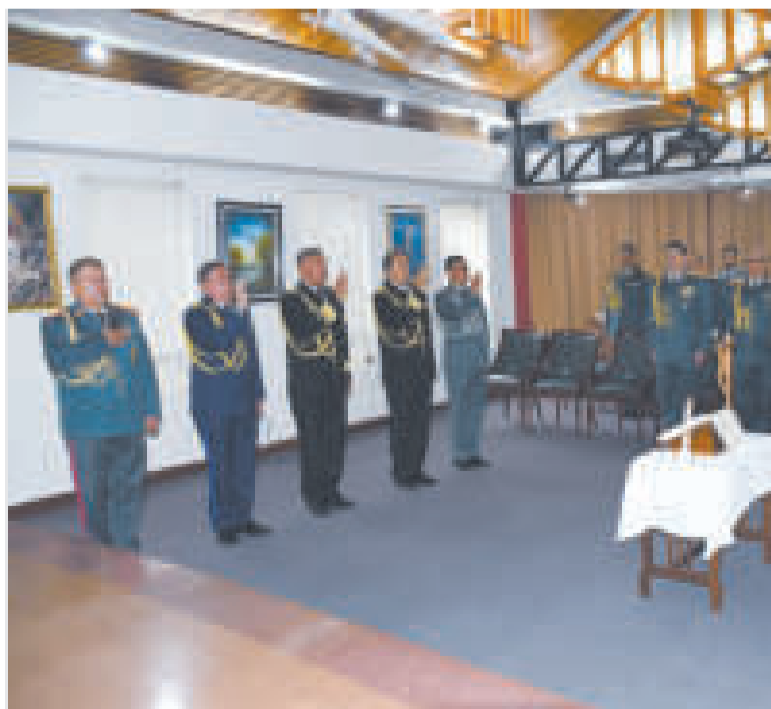
Posesión de las nuevas autoridades del Consejo Superior.