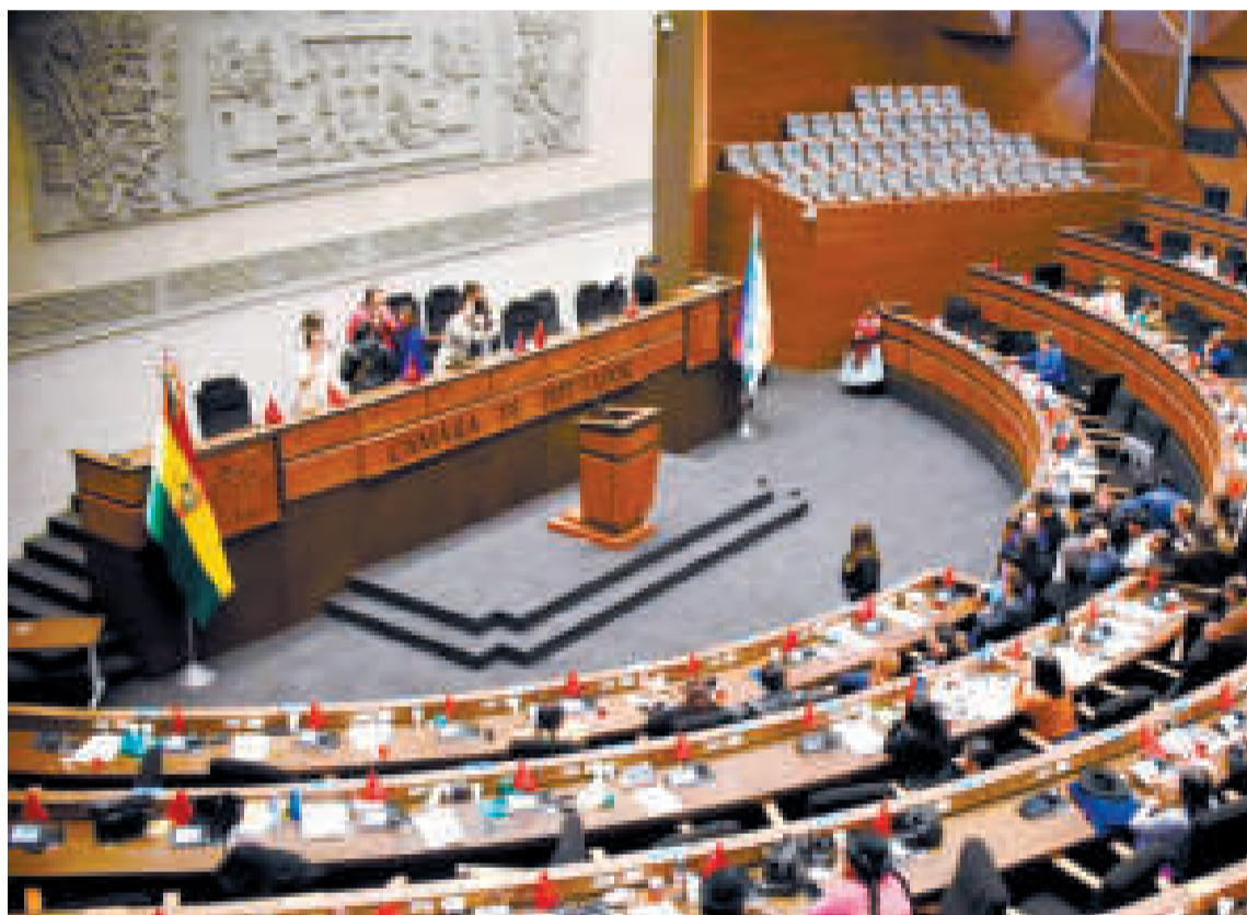
La sesión de la Cámara de Diputados se inició a las 14.51 de ayer martes.