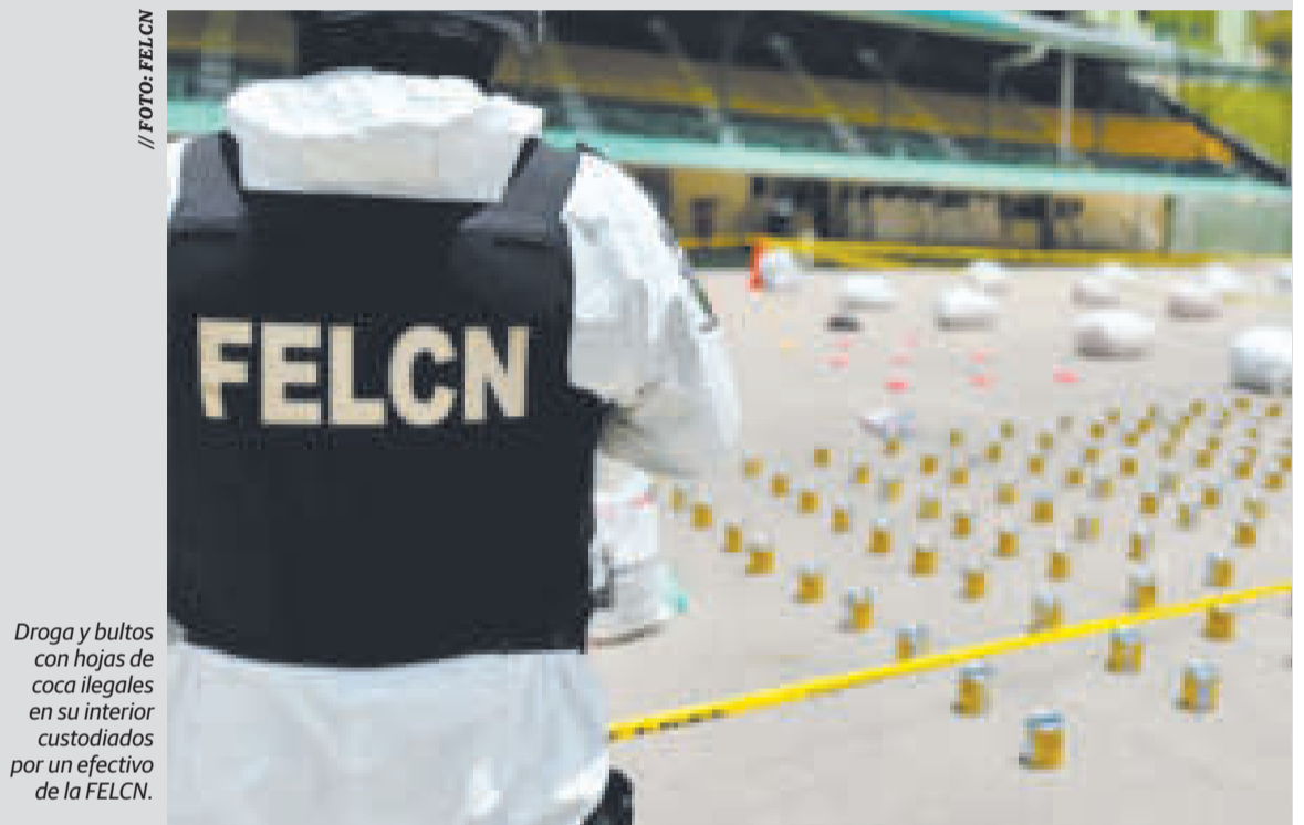
Druga y bultos con hojas de coca ilegales en su interior custodiados por un efectivo de la FELCN.

En dos operativos, el 24 de febrero, en la carretera La Paz-Oruro, la FELCN incautó 5.000 libras de hoja de coca ilegal que iban en 100 bultos, elemento que fue secuestrado inmediatamente para evitar su desvío al narcotráfico.