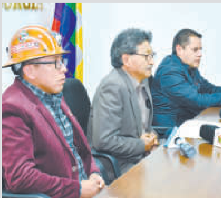
El Ministro de Minería (centro) en conferencia de prensa.