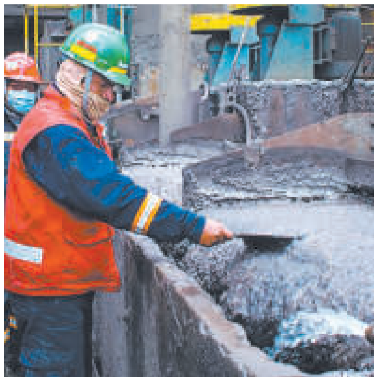
Tratamiento del concentrado de zinc en la minera Colquiri.

MIL TONELADAS MÉTRICAS serán comercializadas por separado y generarán recursos adicionales.