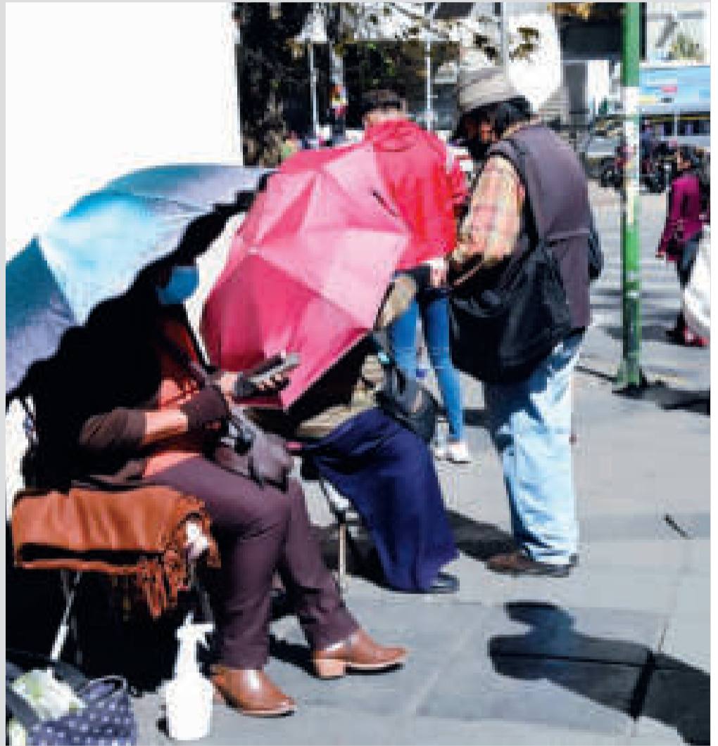
En el mercado informal el tipo de cambio disminuye paulatinamente.