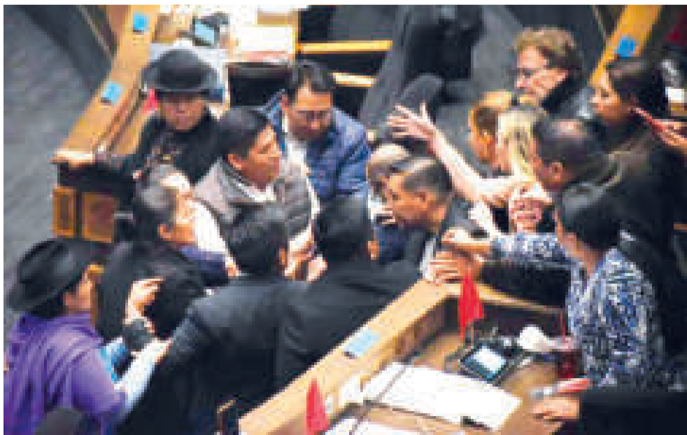
Legisladores opositores y de la nueva derecha protagonizan discusiones en plena sesión de Diputados.

Evistas y las opositoras CC y Creemos pactaron en noviembre de 2023 para encaminar la cuarta elección consecutiva de Andrés Rodríguez como presidente del Senado. Desde entonces actúan articuladamente en temas como el bloqueo a los créditos.