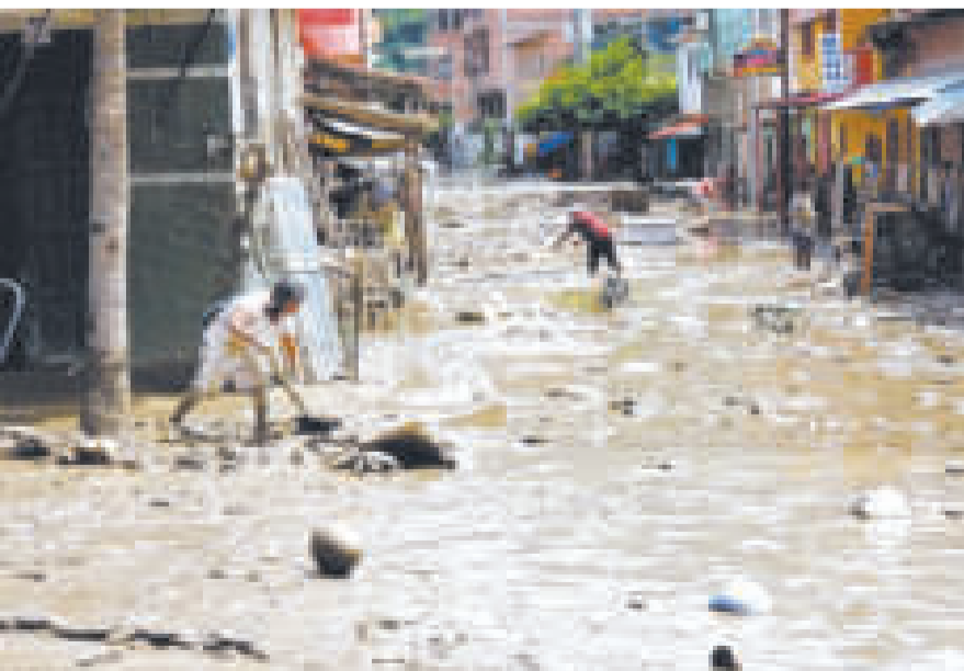
Pobladores de Guanay, en La Paz, en plena limpieza de sus calles cubiertas con lodo.