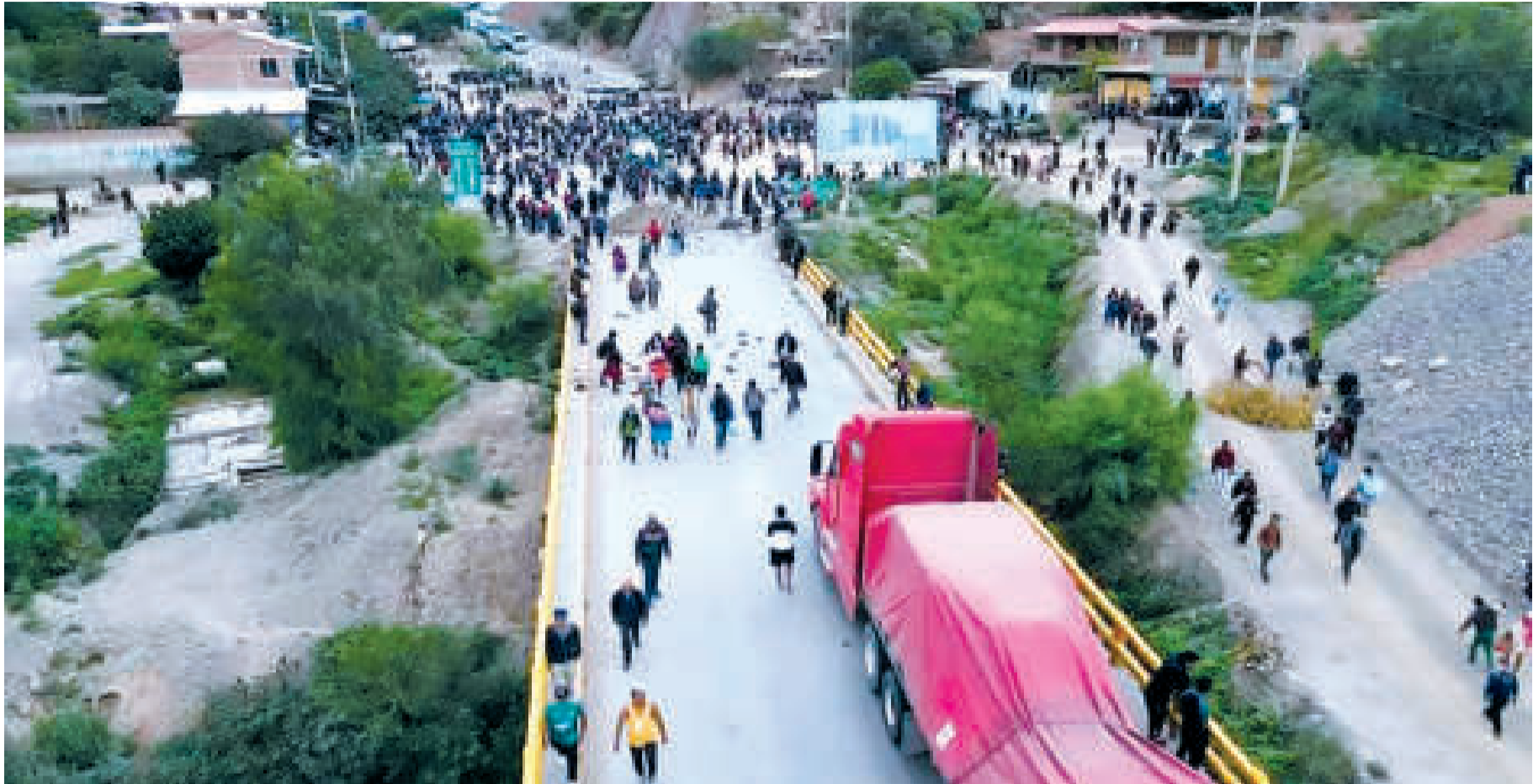
Un punto de bloqueo antes del carnaval.