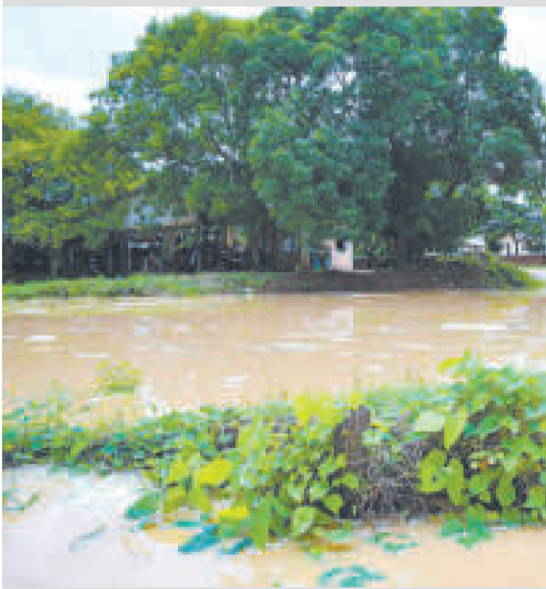
Las inundaciones causadas por las lluvias han afectado principalmente a Pando.