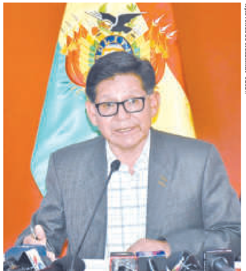
El ministro de Educación, Édgar Pary, en conferencia de prensa.

El ministro destacó varios puntos importantes abordados durante la reunión. Entre ellos resaltó la organización del Congreso Educativo Nacional, previsto para octubre de este año, con la participación del presidente Luis Arce, así como de las dos confederaciones nacionales del magisterio, la Junta de Padres y Madres de Familia y la Federación de Estudiantes. Además se trató el reinicio del Programa de Formación Complementaria para actores del Sistema Educativo Plurinacional (Profocom-SEP).