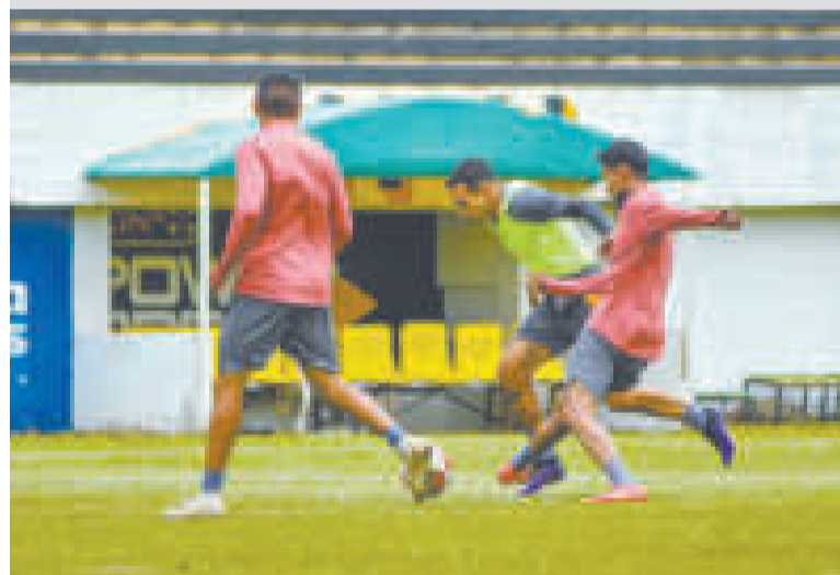
El cuadro atigrado cerró prácticas en Achumani antes del viaje a Villa Tunari.