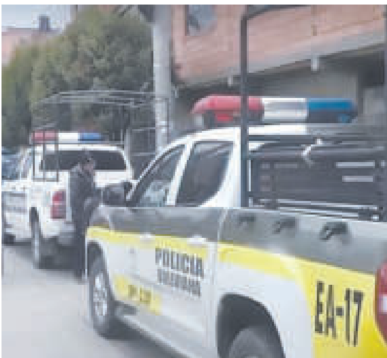
Presencia policial en la vivienda situada en la zona de Ciudad Satélite, en El Alto.