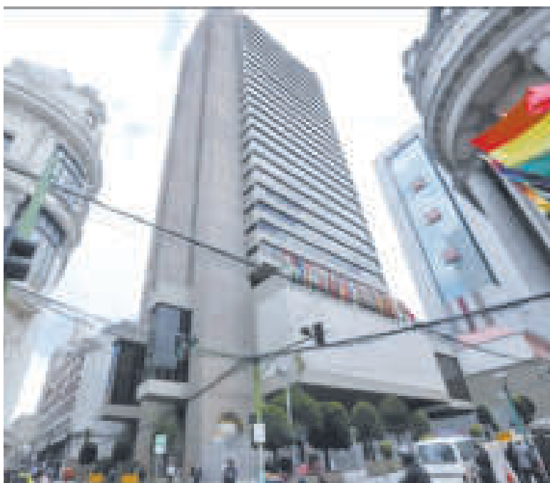
Infraestructura del Banco Central de Bolivia.