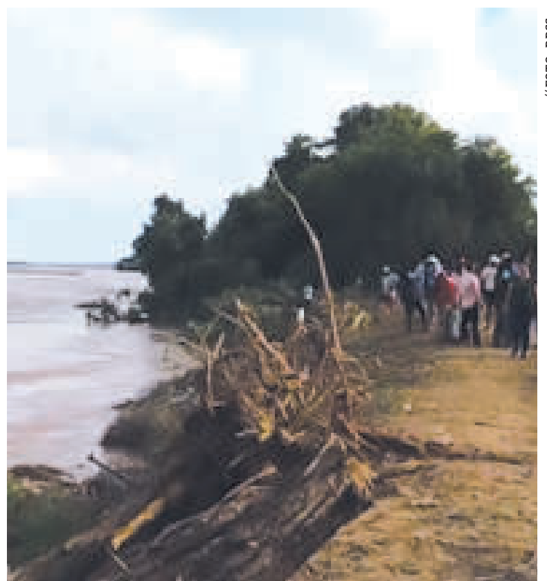
Las aguas del Río Grande cerca de una vía en Santa Cruz.

El objetivo de la inspección fue verificar el estado de los colmatadores, espacios amplios donde se reúne todo el material sólido para evitar posibles desbordes.