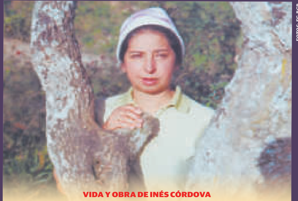
VIDA Y OBRA DE INÉS CÓRDOVA

Inés Córdova nació el 15 de diciembre de 1924 en Potosí. Sus inicios en el arte se ubican en su niñez con su encuentro con la arcilla, tiempo después ingresaría a la Escuela de Bellas Artes, tuvo como primer maestro a Jorge de la Reza.