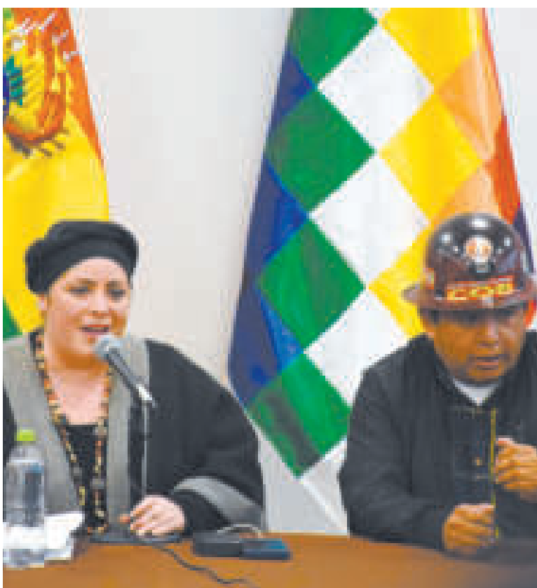
La ministra de la Presidencia, María Nela Prada, junto al ejecutivo de la COB.

En esa dirección, destacó la necesidad de “hacer una evaluación de la implementación” del Sistema Único de Salud (SUS), pero también definir la fecha del Congreso de Seguridad Social.