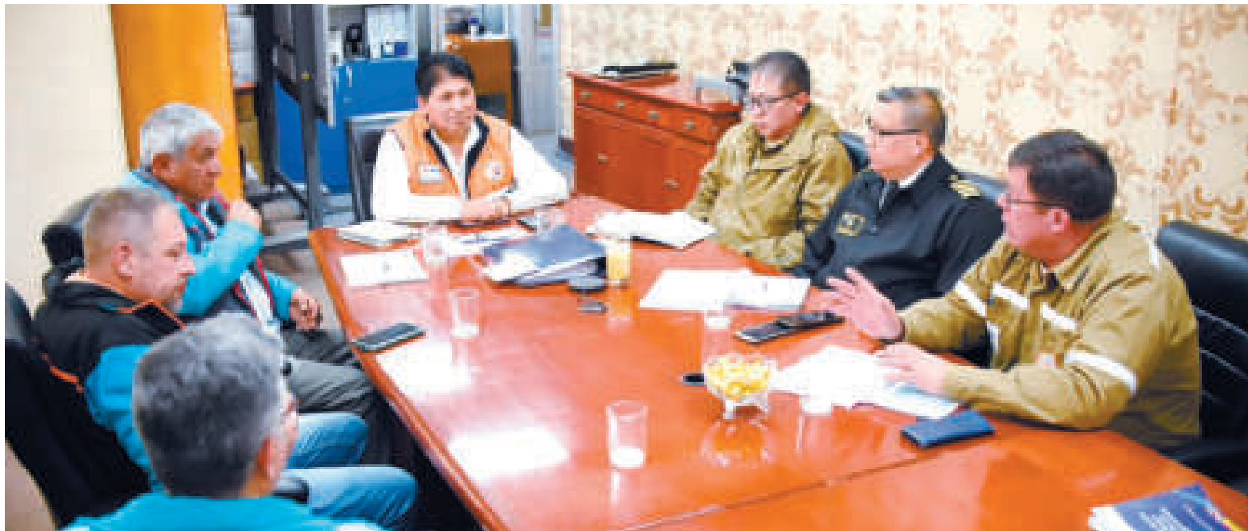
Autoridades municipales, de las Fuerzas Armadas y estatales se reunieron para coordinar acciones ante las emergencias en La Paz.