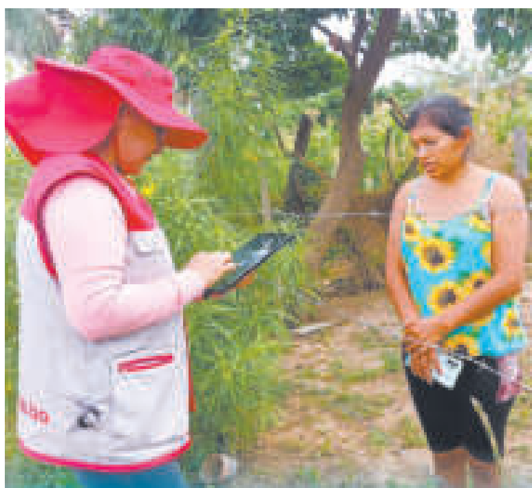
Una funcionaria del INE durante un relevamiento de datos.