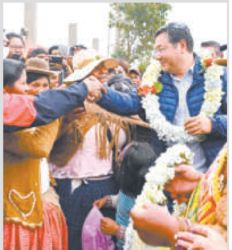
El presidente Luis Arce en la ciudad de El Alto.

||||| Luis Arce Catacora Presidente de Bolivia