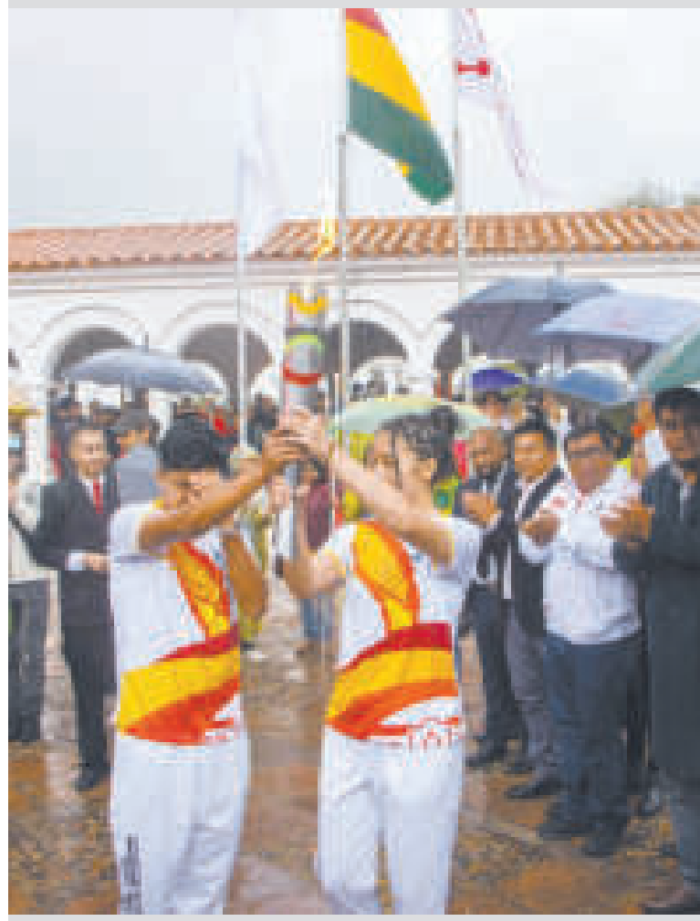
Comienza el recorrido del fuego bolivariano llevando un mensaje de paz y unidad.

El Ministerio de Salud y Deportes dispuso tres escenarios para las competencias: el Polideportivo Garcilazo, la Piscina Olímpica Sucre y el Poligimnasio Max Toledo, a los que se efectuó el mantenimiento correspondiente de infraestructura.