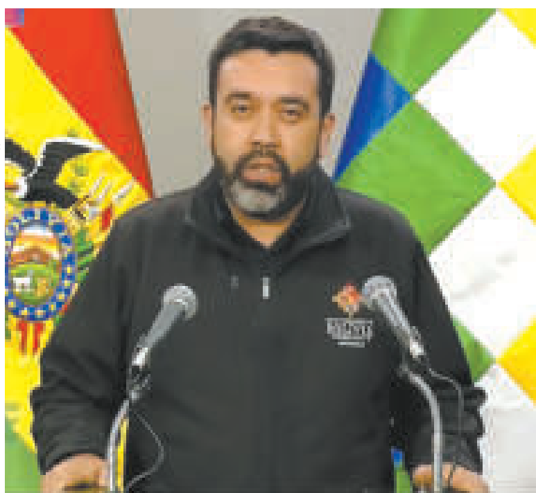
El viceministro Álvaro Ruiz anoche en conferencia de prensa en La Paz.