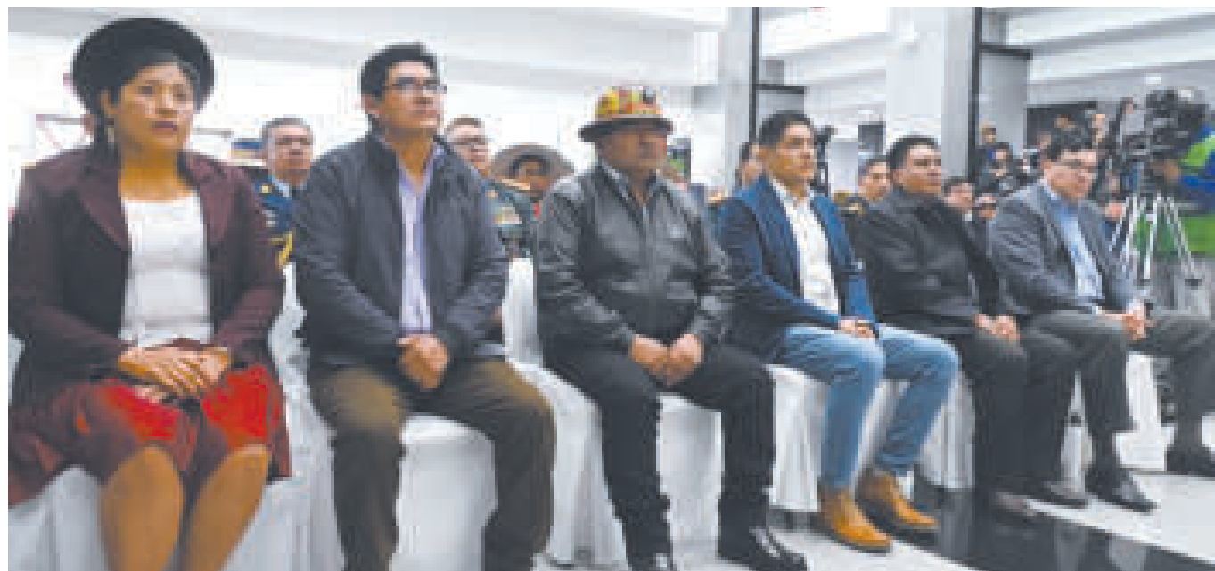
Las flamantes autoridades.

“Son los ajustes que el Presidente considera importantes en este momento, porque son sectores también de nuestra población, son sectores que están pidiendo acelerar el trabajo y es precisamente lo que se