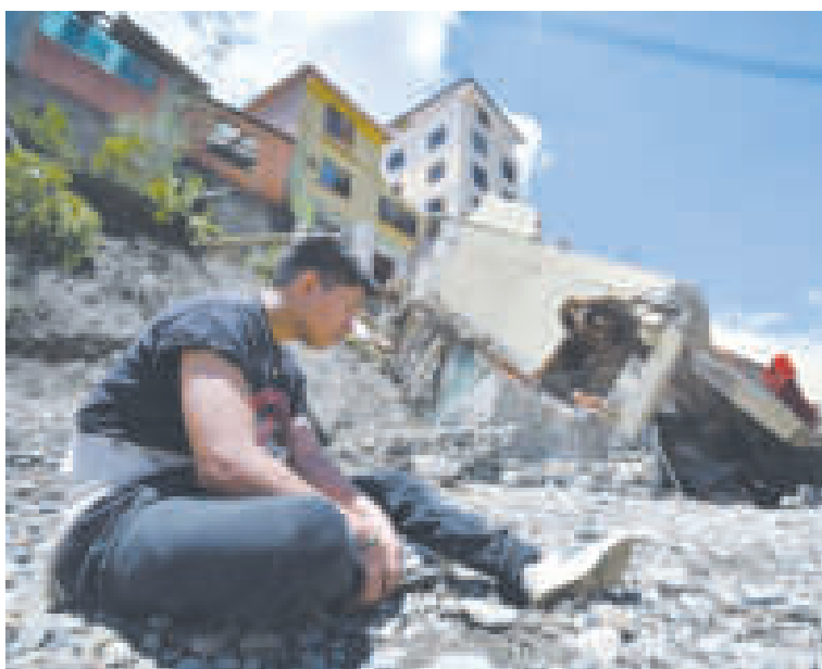
Vecinos después del deslizamiento en Irpavi II.