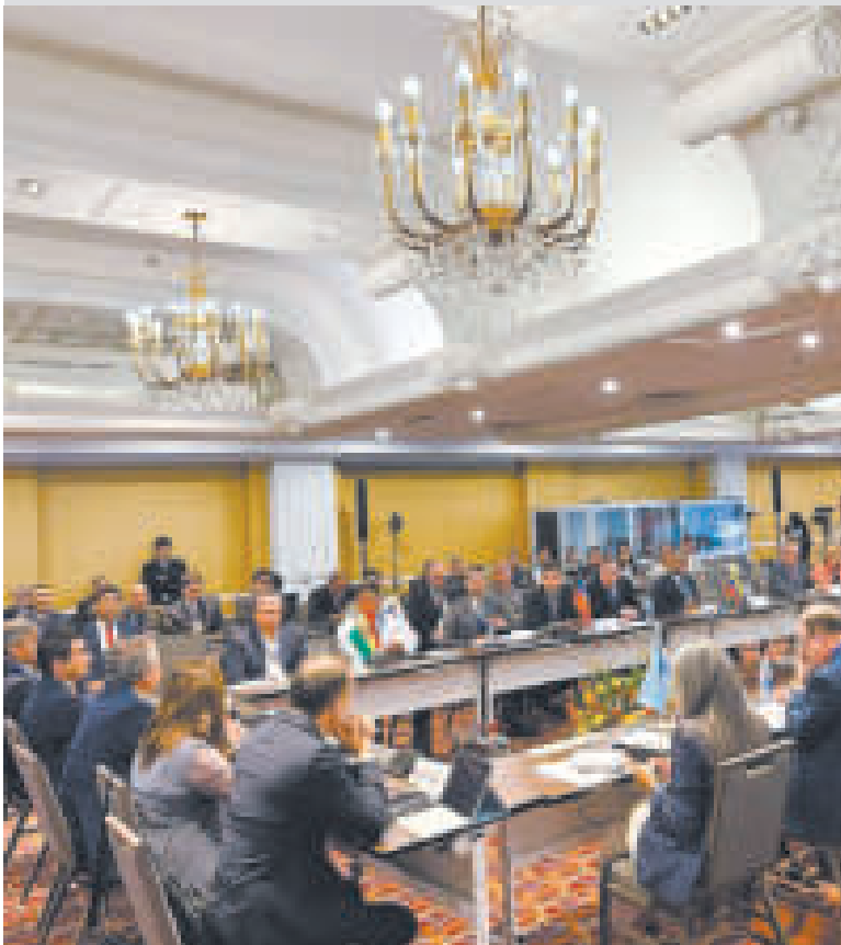
Encuentro de representantes de países sudamericanos en Lima.