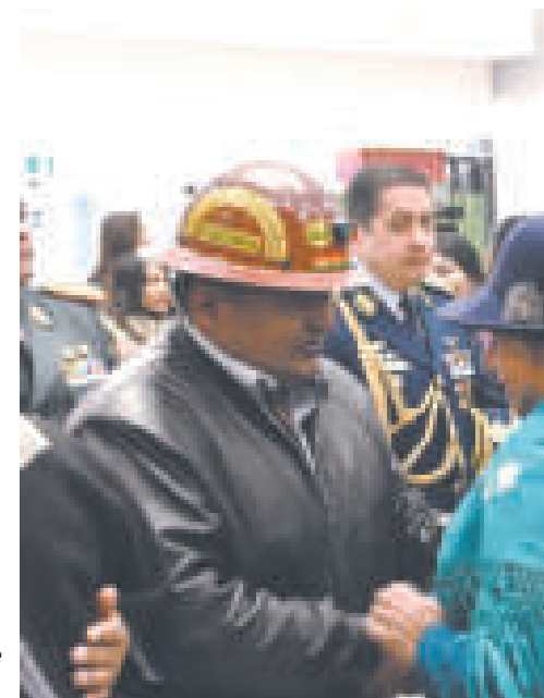
El nuevo gabinete recibe apoyo.