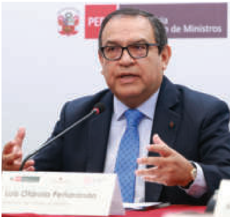
El presidente del Consejo de Ministros de Perú, Alberto Otárola, renunció a su cargo.