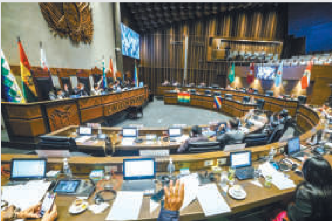
Cámara de senadores.