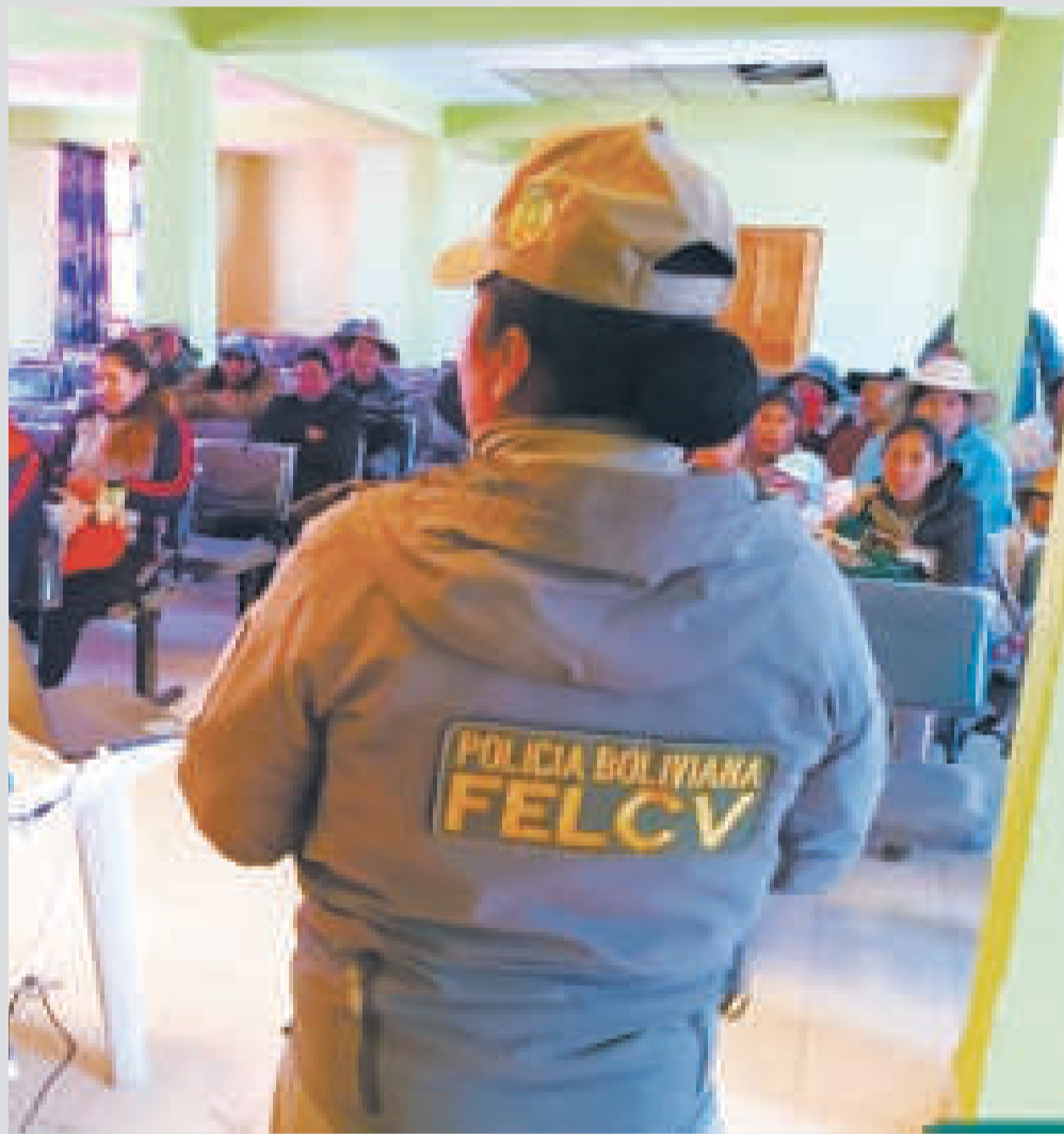
Una funcionaria de la FELCV durante un curso de información a mujeres.