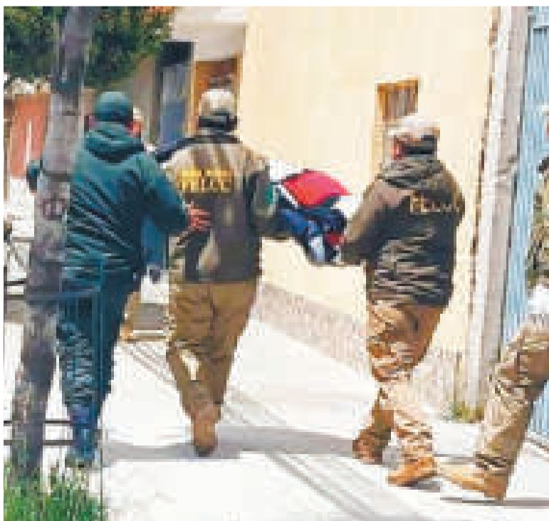
Personal de la FELCC en la casa ubicada en la zona de Ciudad Satélite.