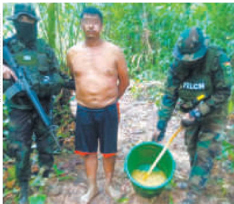
Efectivos de la FELCN con un aprehendido en medio de las tareas de interdicción.