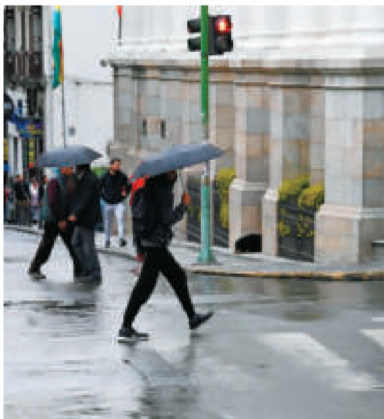
Las lluvias, que están causando estragos en el país, continuarán en marzo.

Mientras la segunda alerta naranja, que está vigente hasta el lunes, prevé desbordes en los ríos de Tarija, Chuquisaca, Potosí, Santa Cruz, Cochabamba, Pando, Beni y norte y Yungas de La Paz.