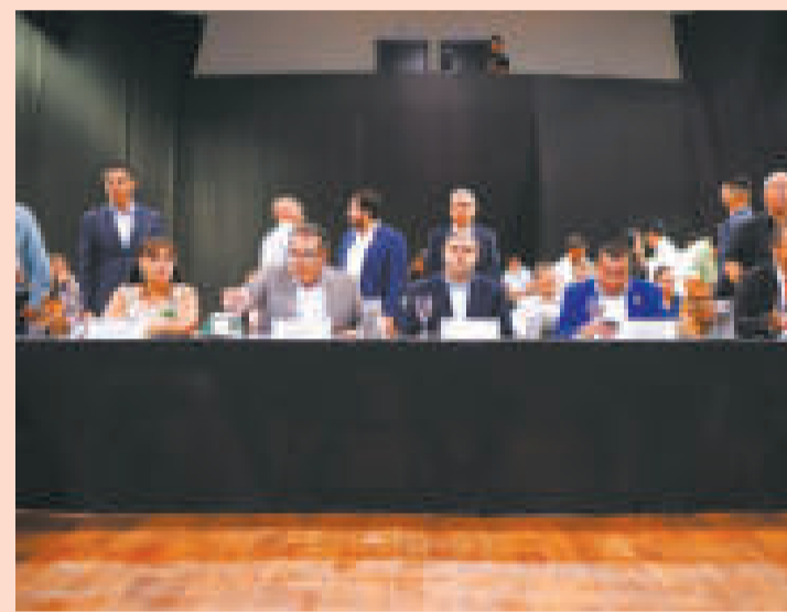
La reunión de los líderes cívicos cruceños.

En la reunión de líderes cruceños donde estuvieron instituciones públicas y privadas, además de políticos, se acordó trabajar en 10 temas, de los que seguidores del gobernador Luis Fernando Camacho quedaron relegados.