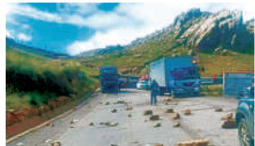
El municipio de Ocurí, en Potosí.

, denunció que seguidores de Evo Morales vés de amenazas de muertes y agresiones.