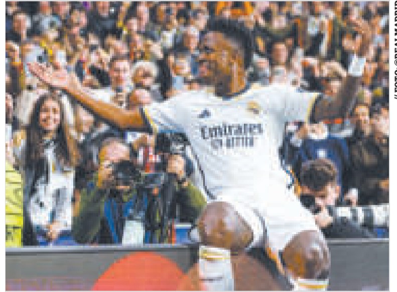
Vinicius Jr. celebra su gol que le dio la clasificación al Real Madrid.

Los goles del suizo Manuel Akanji a los cinco minutos, el argentino Julián Álvarez (nueve) y el noruego Erling Haaland (45+3) sellaron un 6-2 a favor de los ingleses en el marcador global. Por los daneses, el noruego Mohamed Elyounoussi perforó las redes a los 29.