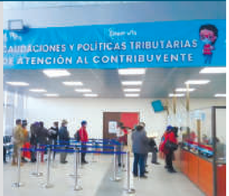
Las cifras muestran estabilidad económica.

“Sin embargo, gracias a las medidas para la reconstrucción de la economía impulsadas desde el Gobierno, en tan solo dos años se logró superar el nivel prepandemia”, agrega la información.