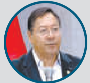
ARCE proyecta fomentar la generación de obras para la urbe alteña.

En ese sentido, tres años después, el crecimiento de la recaudación tributaria 2023 supera en 56% respecto a 2020.