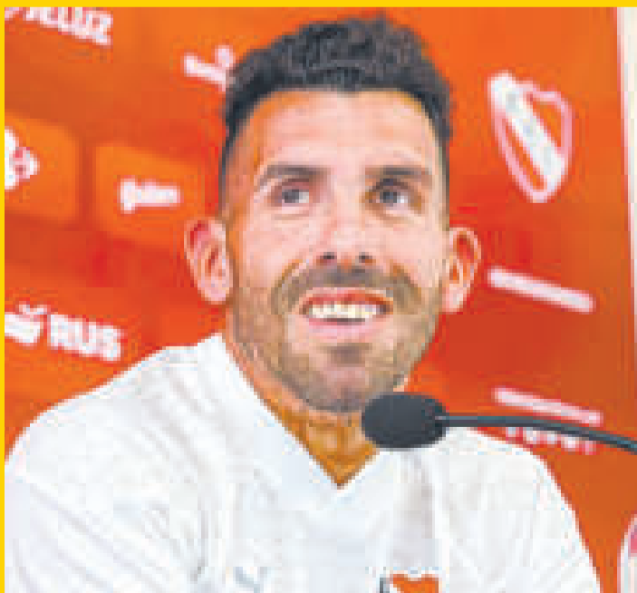
Carlos Tevez, técnico de Independiente, será demandado.