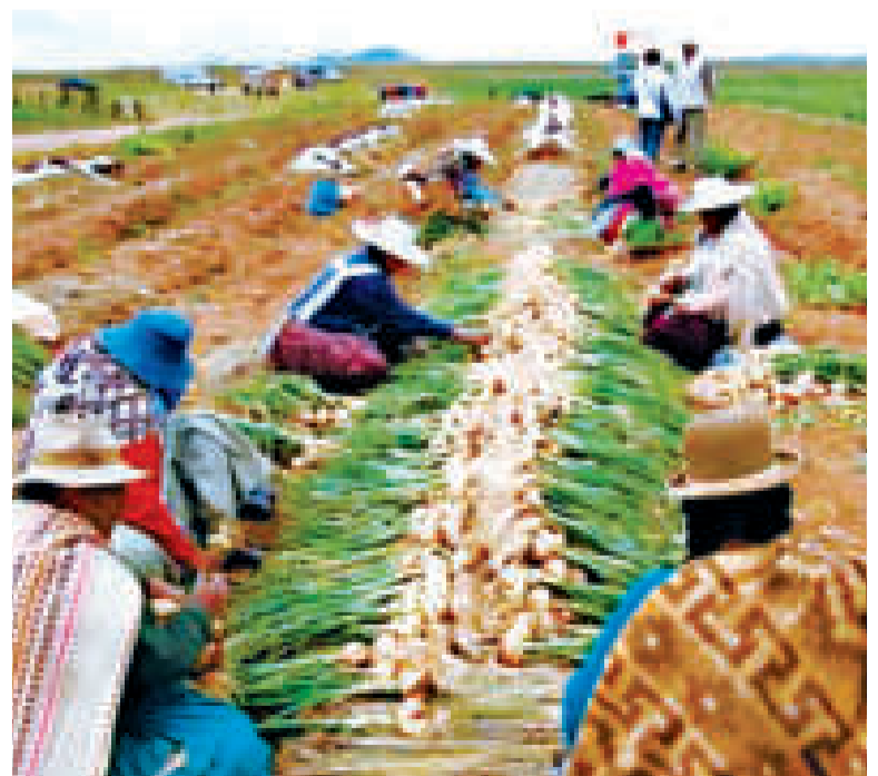
El fomento a la producción será una prioridad.

Por mandato del presidente Arce, el Gobierno buscará alcanzar la sustitución de importaciones a través de varias estrategias que beneficiarán a los productores en general.