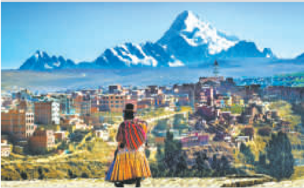
La población alteña genera una conciencia tributaria importante.