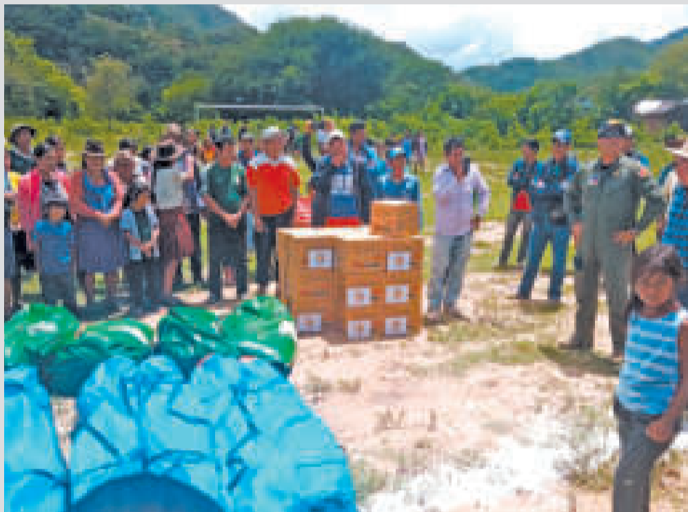
Entrega de ayuda humanitaria en la comunidad El Dorado.