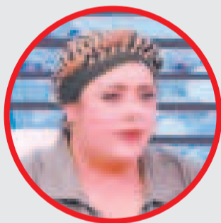
LA MINISTRA DE LA PRESIDENCIA, María Nela Prada.

“Esto ya es realmente una mitomanía absoluta, otra más de las mentiras que ha señalado Evo Morales en relación a que sería un pacto entre el Gobierno y la derecha para tener elecciones primarias abiertas, pero hay que recordar que no se puede mentir ni subestimar al pueblo boliviano”, aclaró la ministra Prada, en contacto con Bolivia TV.