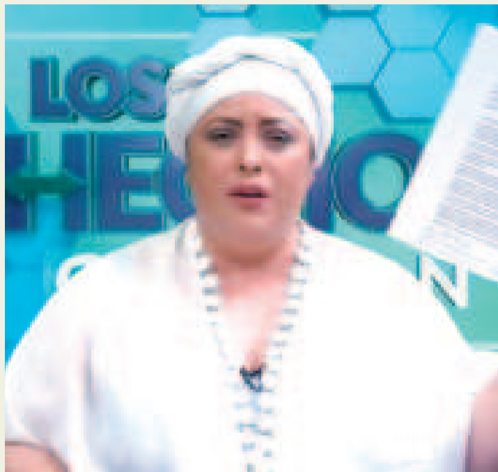
La ministra María Nela Prada en el programa 'Los hechos cuentan'.