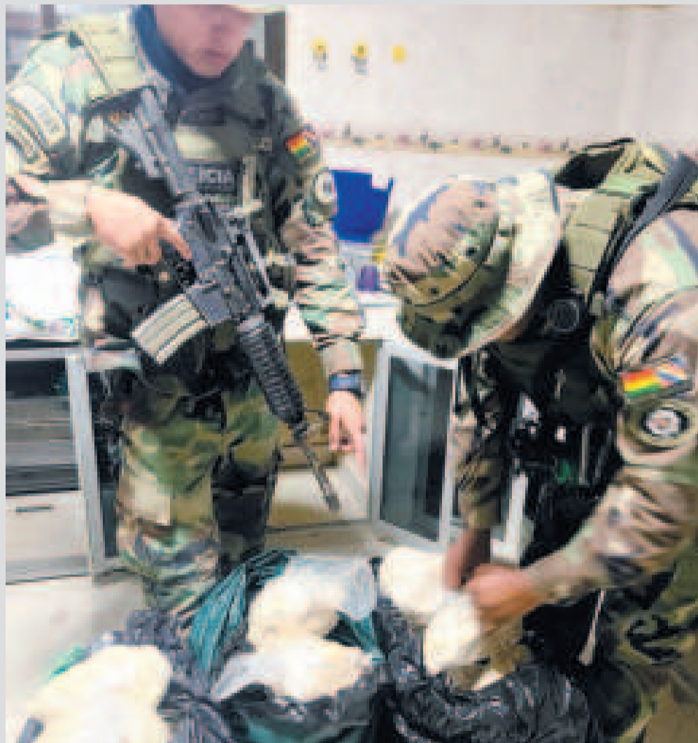
Incautación de droga en el trópico de Cochabamba.

El 5 de marzo, el ministro de Gobierno, Eduardo Del Castillo, informó que la Fuerza Especial de Lucha Contra el Narcotráfico (FELCN) destruyó 25 fábricas de elaboración de pasta base de cocaína, además de 5,8 mil litros de cocaína líquida, equivalentes a 219,3 kilogramos de clorhidrato de cocaína en la provincia Chapare, Cochabamba, donde Evo Morales mantiene respaldo político.