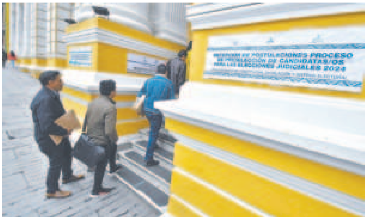
Concluyó la etapa de postulación en la Asamblea Legislativa.

Ahora, los postulantes deben acreditar el cumplimiento de 15 requisitos, nueve comunes y seis específicos, de