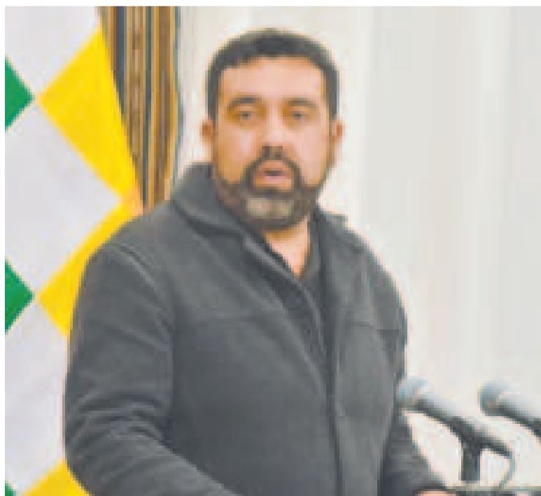
El viceministro de Autonomías, Álvaro Ruiz.