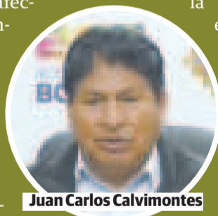
Juan Carlos Calvimontes

El municipio de Palca también se benefició con la ayuda de Defensa Civil. El viceministro de Defensa Civil, Juan Carlos Calvimontes, explicó que Palca se declaró en emergencia municipal, por lo que se activó la ayuda desde el Gobierno central con la movilización de efectivos militares.