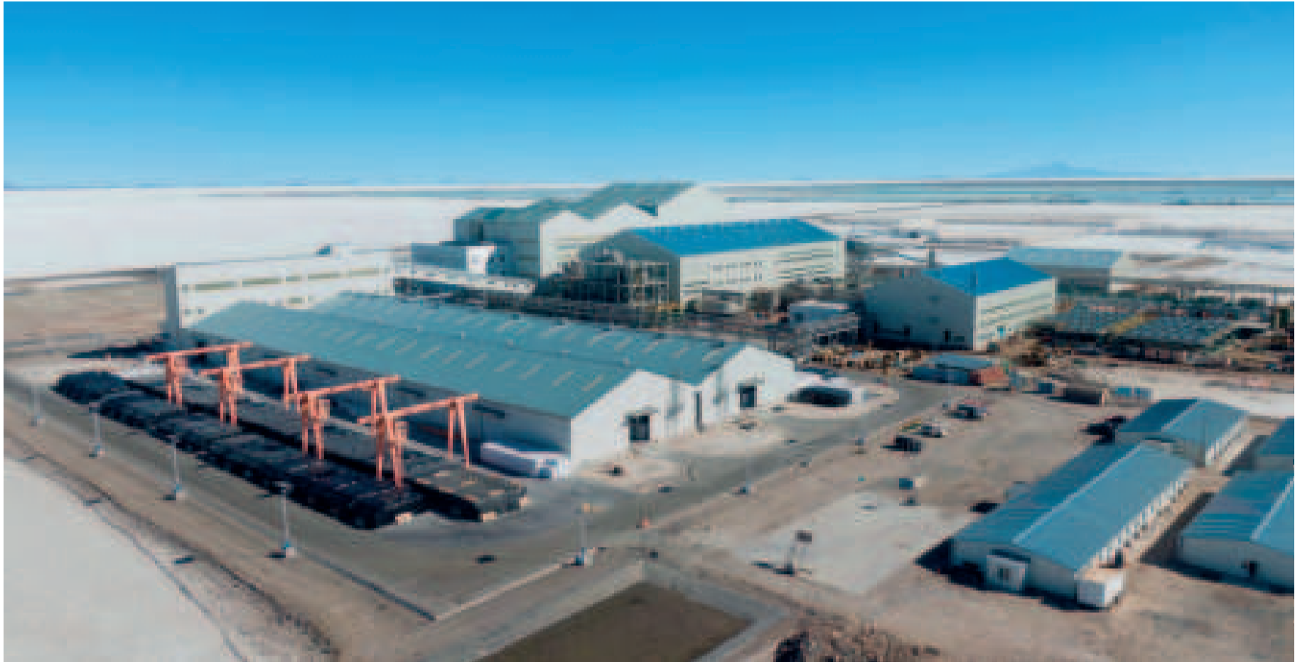
La primera Planta Industrial de Carbonato de Litio del país fue inaugurada en diciembre de 2023.