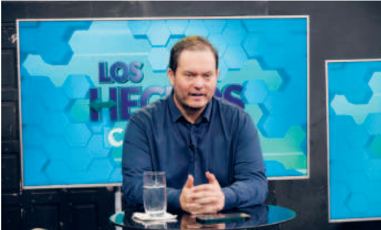
YPFB prevé elaborar estudios diferenciados tanto para el parque automotor del oriente como del occidente del país, antes de aplicar ajustes en las mezclas de etanol con combustibles fósiles.