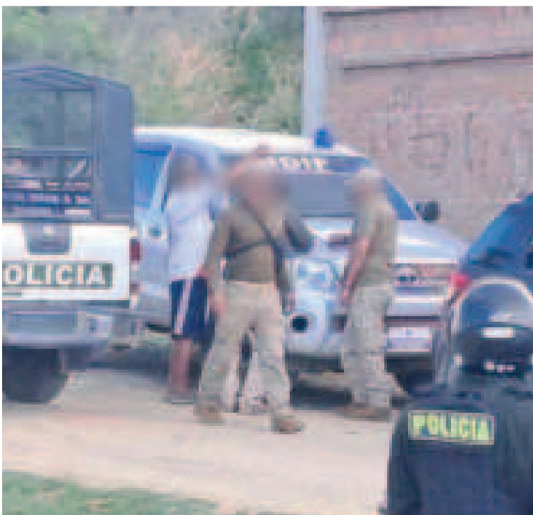
Una mujer fue encontrada sin vida en el interior de un motel en Santa Cruz.