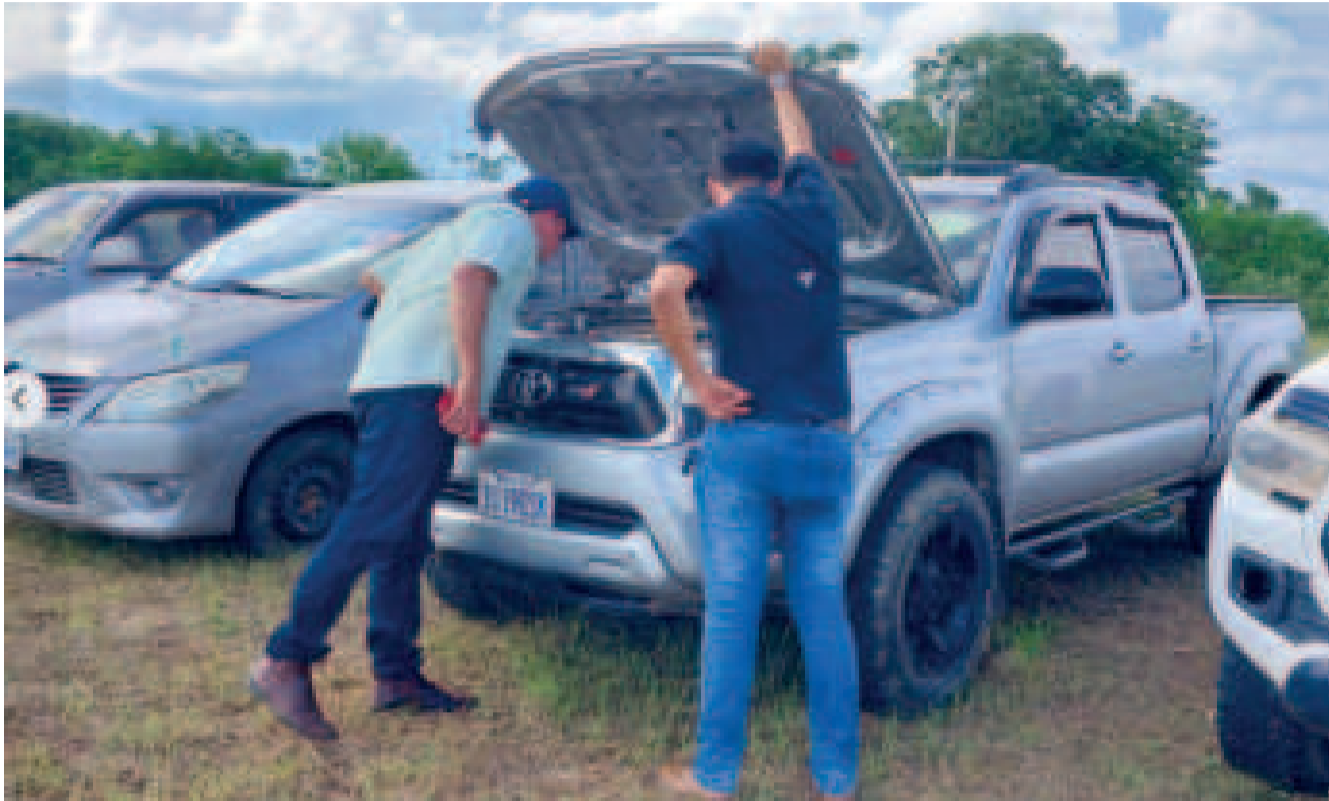
Vehículos incautados al narcotráfico son ofertados en una subasta pública en Santa Cruz.