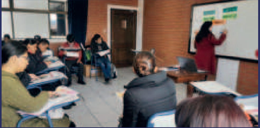
Los voluntarios reciben capacitación en La Paz.

De forma gratuita y fácil, los censistas voluntarios continúan