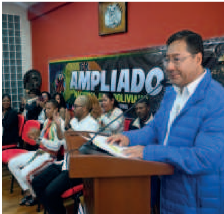
El presidente Arce en el Primer Ampliado Nacional del Pueblo Afroboliviano.

Además recordó que el presidente Arce aceptó la propuesta de colaborar en el marco del Decenio de los Pueblos Afrodescendientes, declarado por las Naciones Unidas, con el compromiso de construir la Casa de la Memoria del Pueblo Afroboliviano como la realización de un anhelado sueño que pronto se convertirá en una tangible realidad que permitirá recordar el pasado y orientarse hacia un futuro más inclusivo y justo.