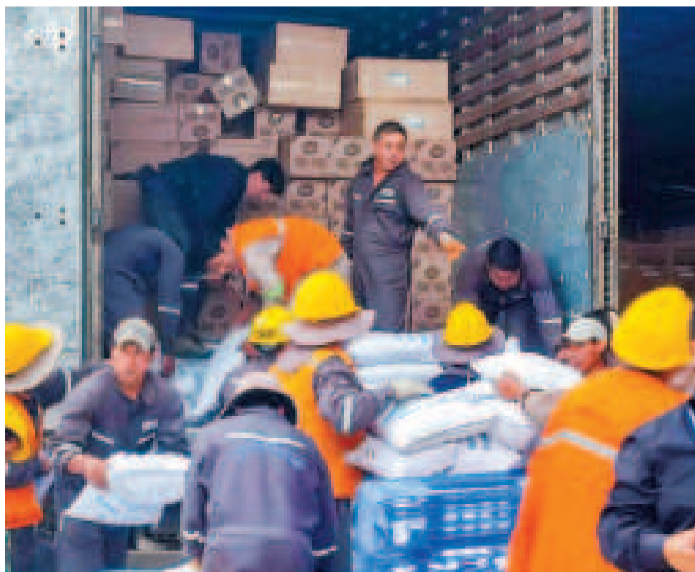
Las labores de control policial continuarán en empresas que importan semillas.

trabando, y que en el mercado informal se comercializan en las llamadas “bolsas blancas”, por lo que hay menos semilla certificada en el mercado nacional.