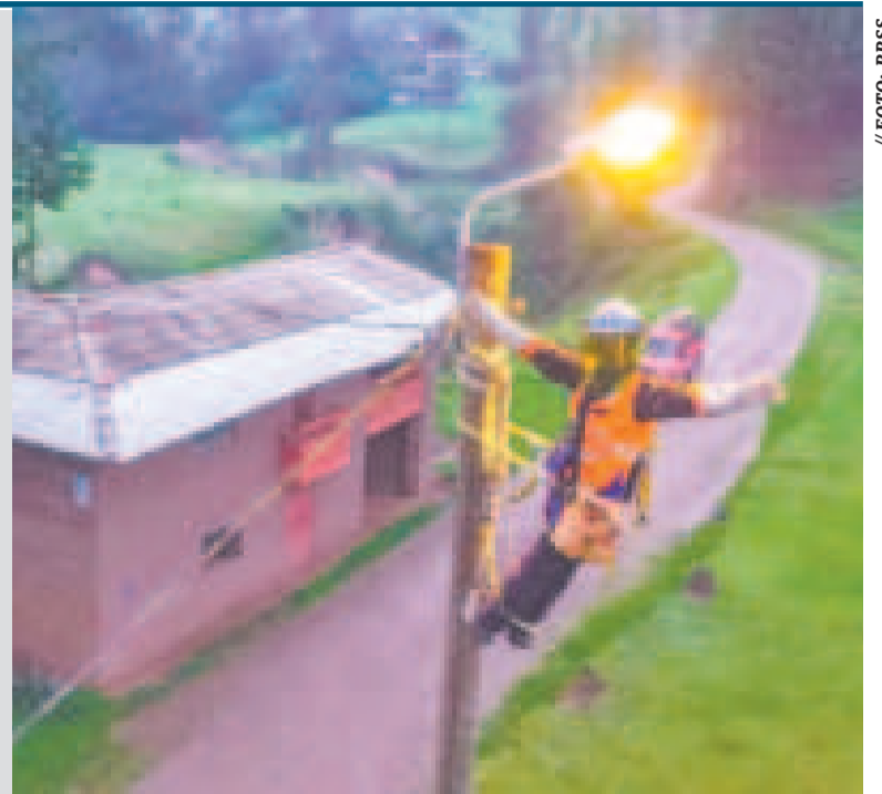
Algunos de los proyectos paralizados son de electrificación rural.

Para el Gobierno, el retraso que fomentan algunos asambleístas tiene el objetivo de sabotear la administración económica del presidente Luis Arce, sin embargo también atenta contra la buena imagen que se tiene del país en el exterior.