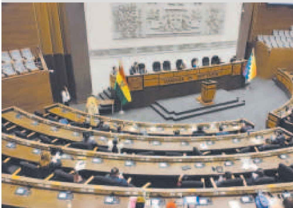
La Asamblea Legislativa Plurinacional.

LOS PROYECTOS DE FINANCIAMIENTO externo están dirigidos a la población, con el objetivo de resolver los problemas en electrificación rural o en tramos carreteros.