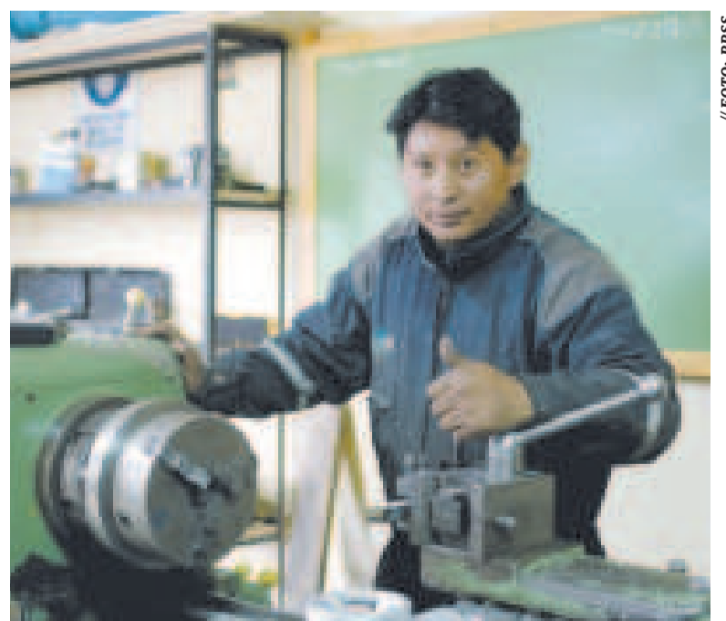
Cada vez son más jóvenes los que lideran los emprendimientos.

El Seprec facilita la inscripción de empresas para los emprendedores a través de trámites virtuales, contribuyendo a la reducción de costos de los mismos y a un proceso más ágil y eficiente.