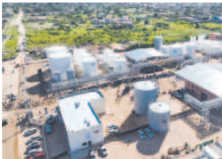
La Planta de Biodiésel en Santa Cruz.

“Vamos a tener cuatro plantas de reciclaje de aceite usado o grasas usadas y tendremos, además, cuatro plantas de aceite de palma y macororó. Así, ya no tendremos que importar diésel y esos recursos se destinarán a otras obras”, explicaba Siles.