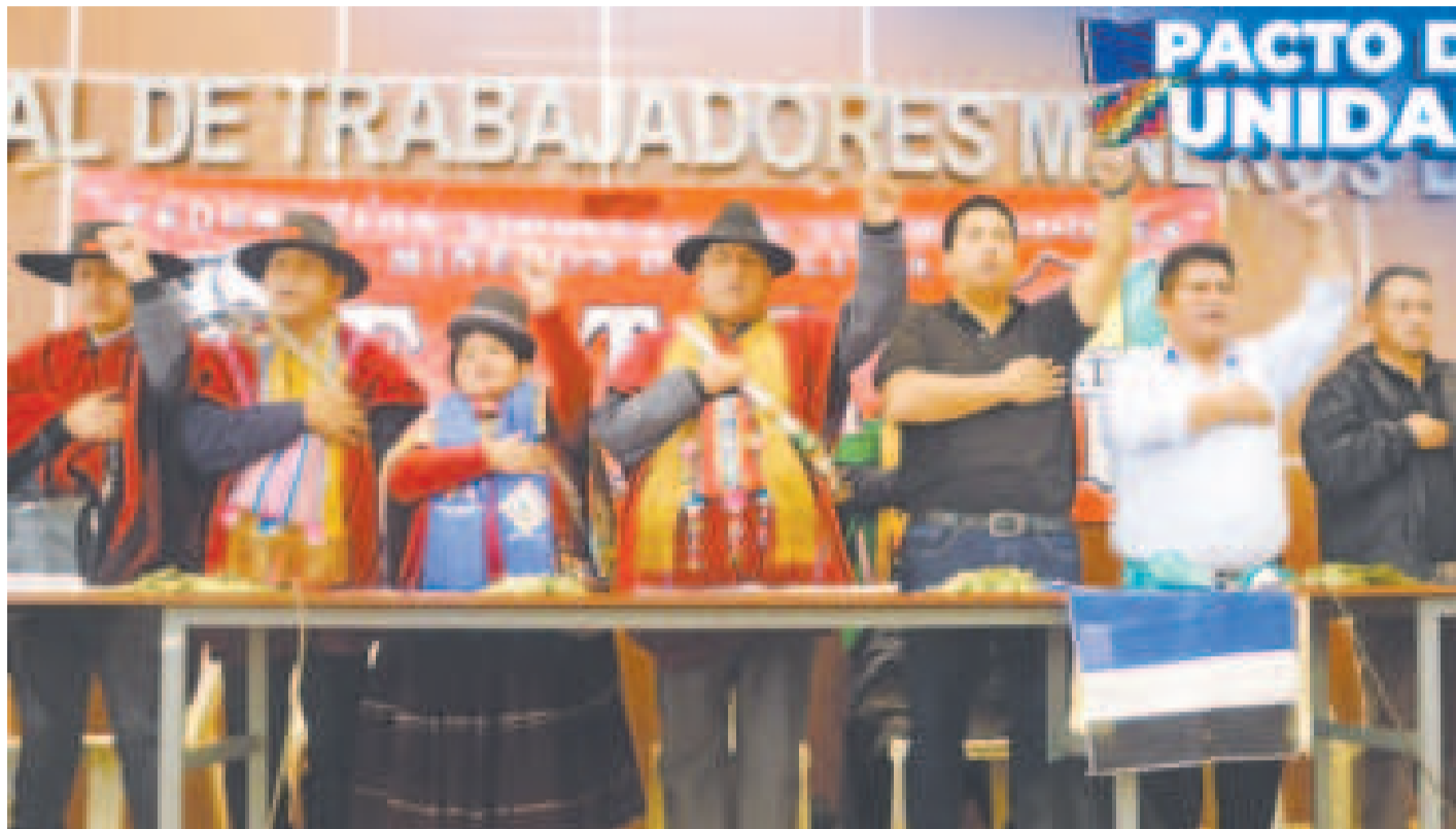
Representantes de las organizaciones fundadoras del MAS-IPSP.