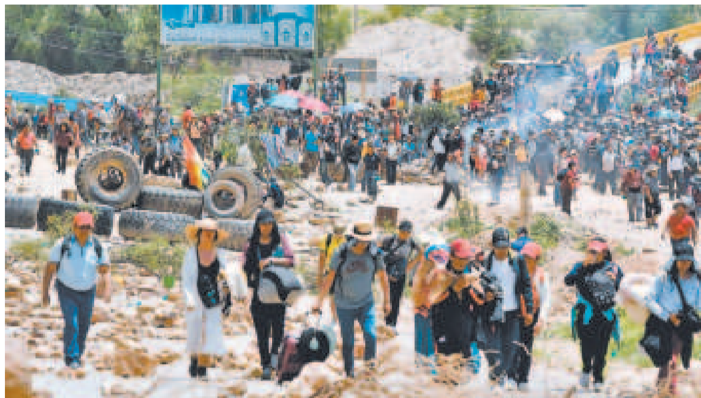
Bloqueo de una vía por grupos ligados a Evo Morales en enero de este año.

En enero de este año, grupos ligados al dirigente cocalero del Chapare bloquearon las carreteras y causaron una pérdida de $us 981 millones.