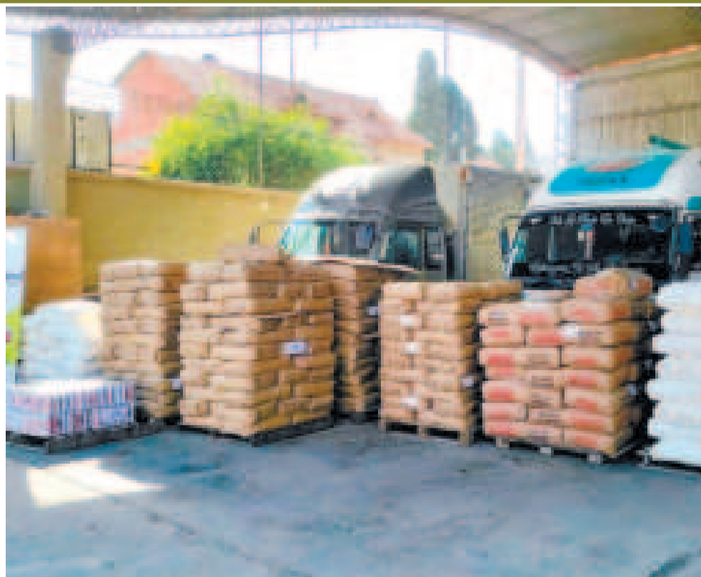
Mercadería ilegal incautada.