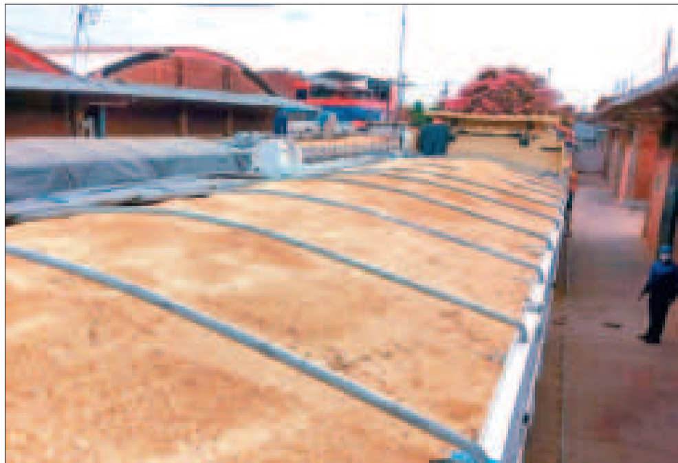
Semilla decomisada en un control aduanero en Santa Cruz.

Datos del Iniaf muestran que a Bolivia ingresan semillas ilegales transgénicas no autorizadas, por Argentina, vía con-