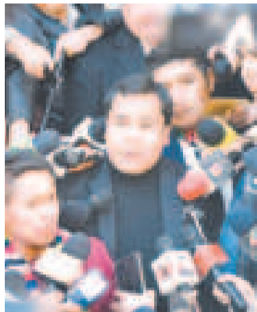
El presidente de Diputados, Israel Huaytari