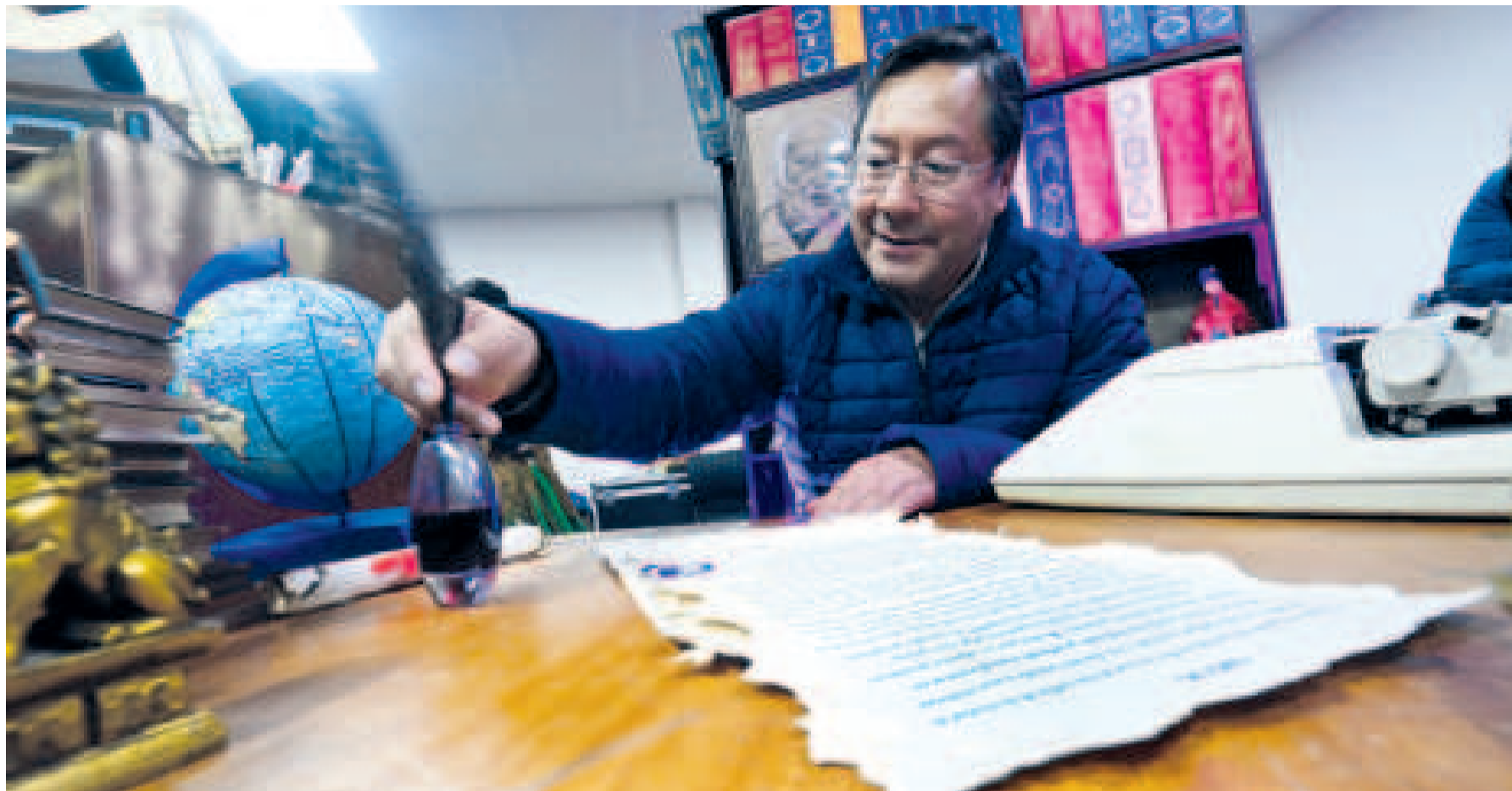
El Presidente firma el registro en la primera Feria del Libro de El Alto.