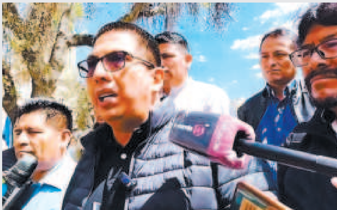
La dirigencia de la CSCIB en conferencia de prensa.

El X Congreso del MAS-IPSP convocado por el Pacto de Unidad en El Alto es imparable, a pesar de los ataques de Evo Morales y de su rechazo al consenso que exige el TSE, afirman los fundadores del Instrumento Político.