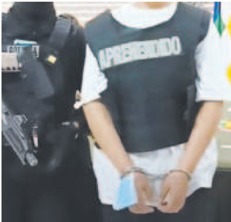
La mujer fue presentada en la FELCC de la ciudad de Santa Cruz.