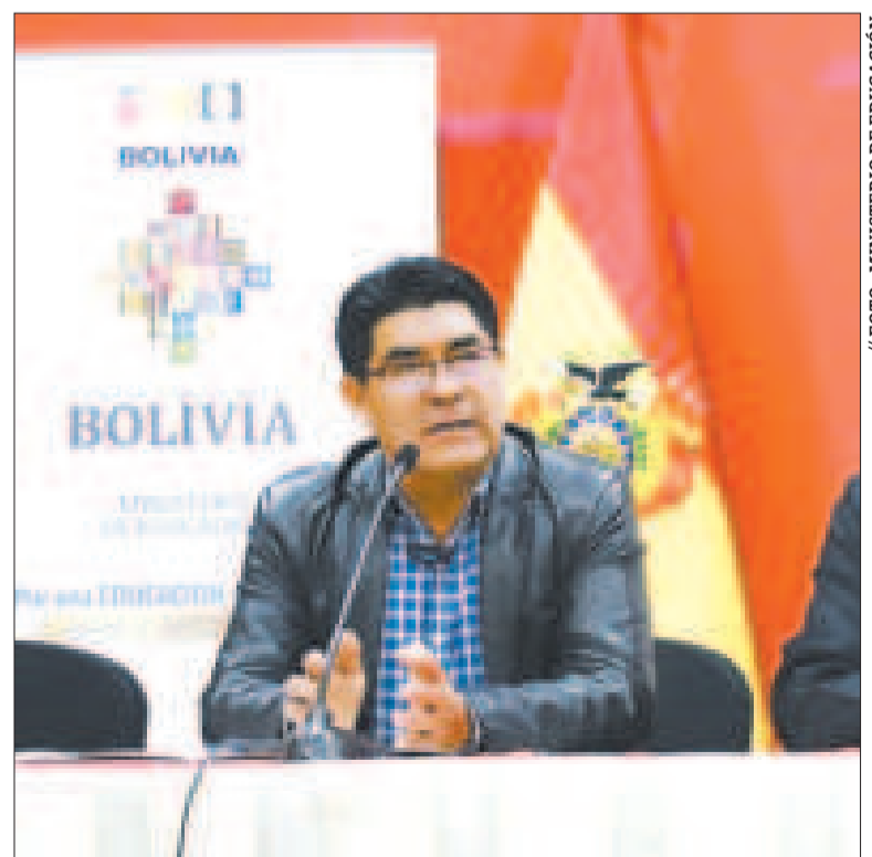
El ministro Omar Véliz informa sobre los avances en el diálogo con los maestros urbanos.

HORASSE extendió la reunión entre el Ministerio de Educación y los maestros urbanos, ayer en La Paz.