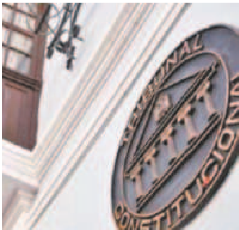
El Tribunal Constitucional en la ciudad de Sucre.