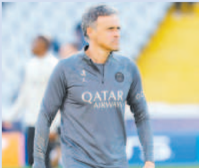
Luis Enrique, técnico del equipo francés del PSG.