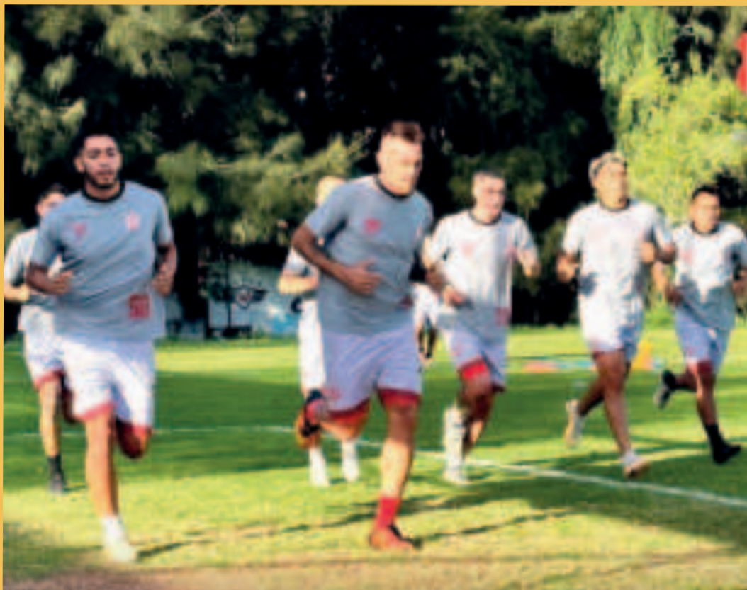
Jugadores de Independiente en plena labor física antes del duelo contra San Antonio.