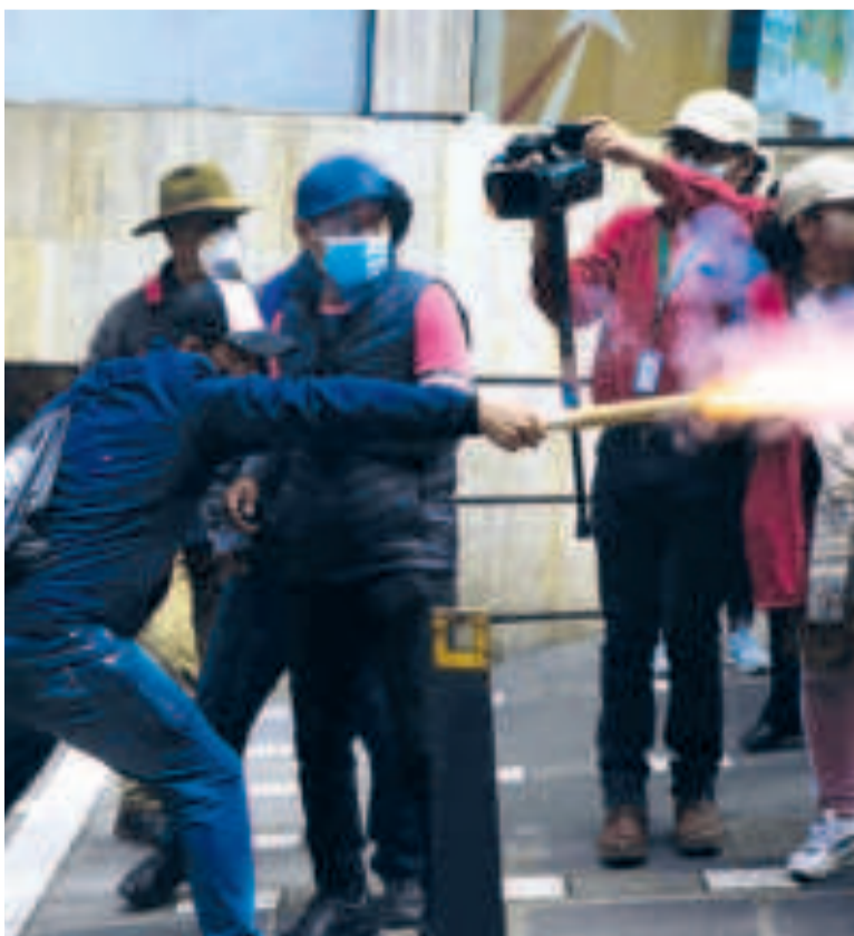
Maestros durante las protestas en La Paz.