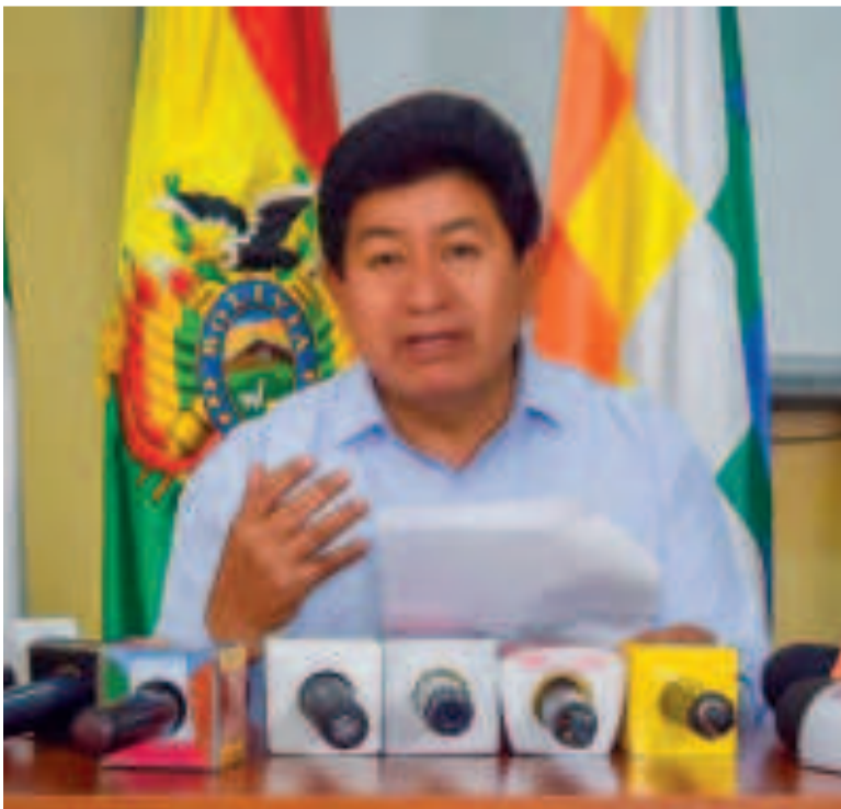
El ministro de Obras Públicas, Édgar Montaño, en rueda de prensa.