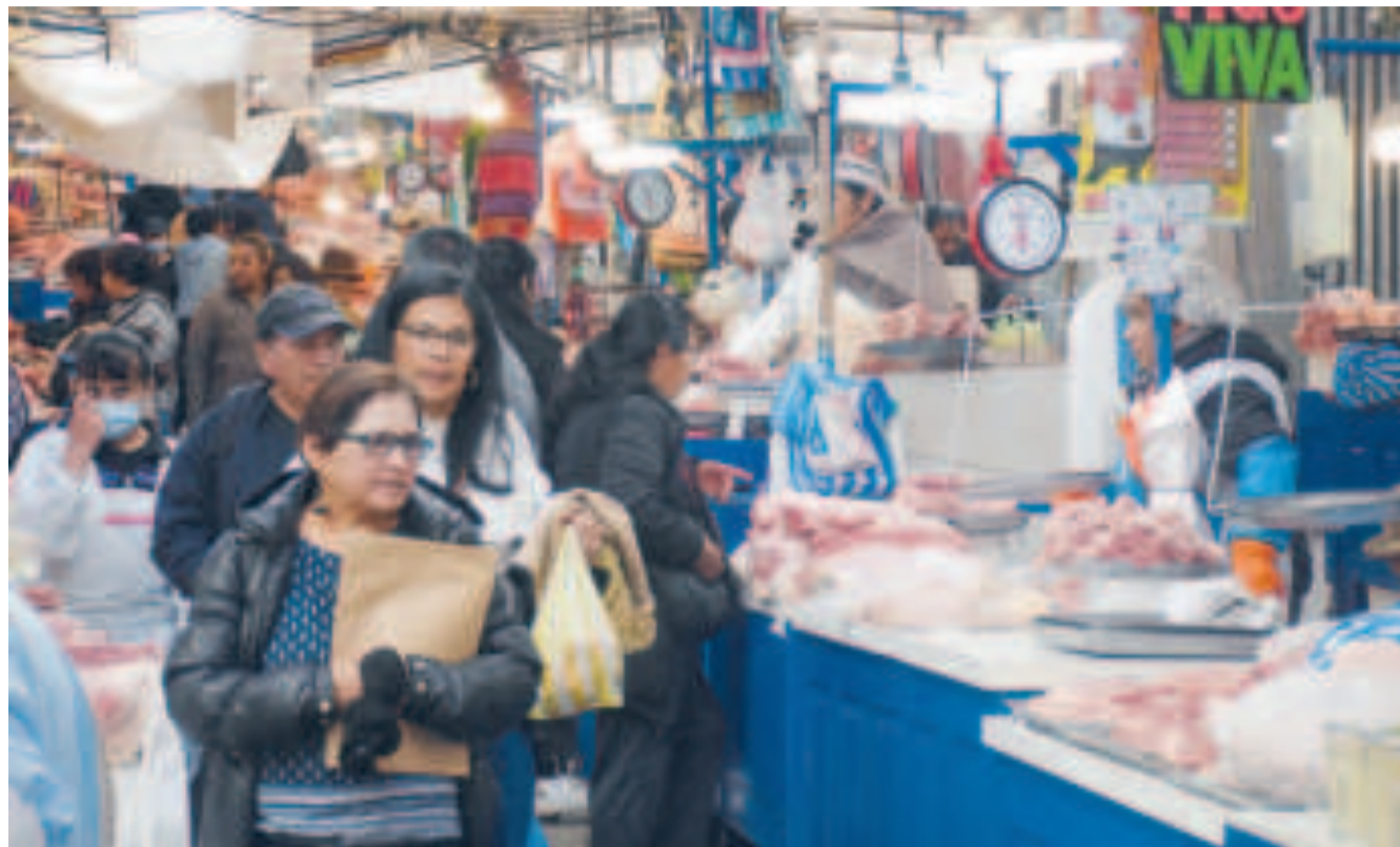
Un mercado popular con venta de productos y consumidores, en la ciudad de La Paz.