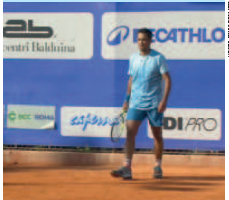
La tristeza de Hugo Dellien después de perder y quedar eliminado del torneo italiano.

Por llegar hasta las semifinales, Dellien ganó 22 puntos para el ranking ATP y se embolsó 3.565 dólares.