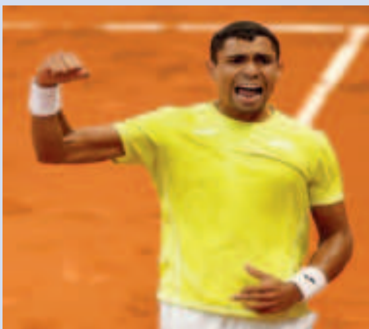
El festejo del brasileño Thiago Monteiro luego de vencer a Stefanos Tsitsipas.