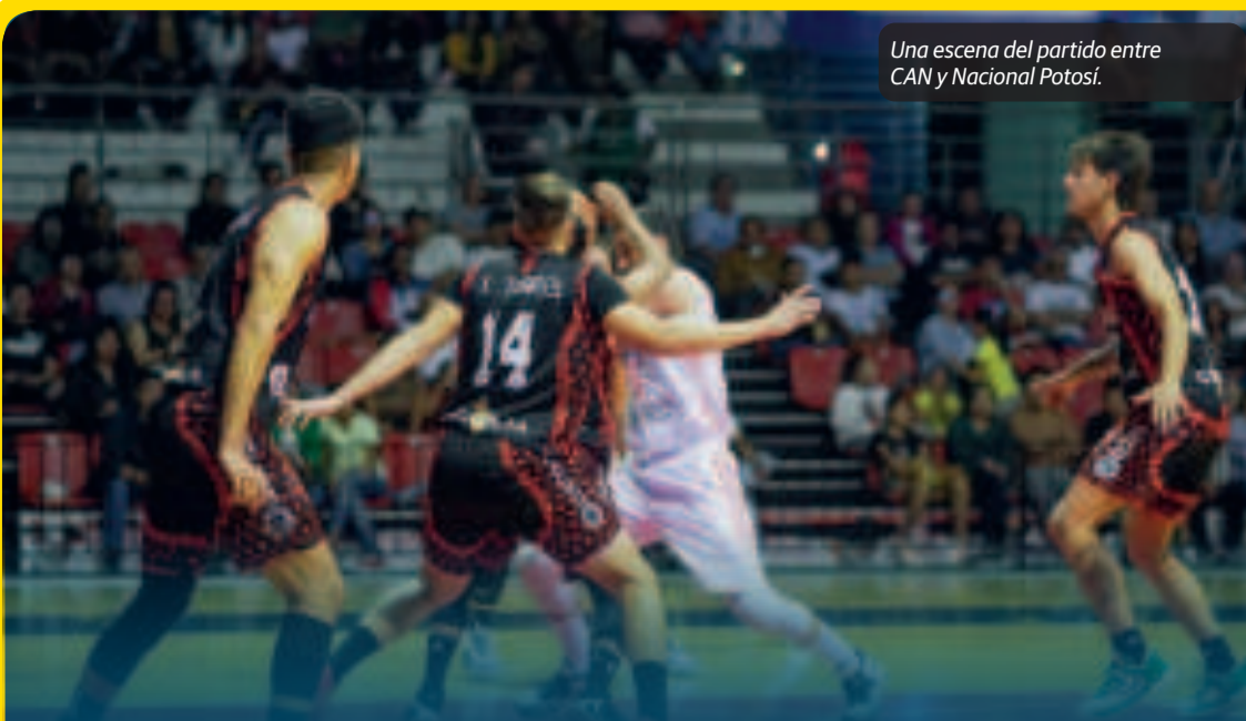
Una escena del partido entre CAN y Nacional Potosí.