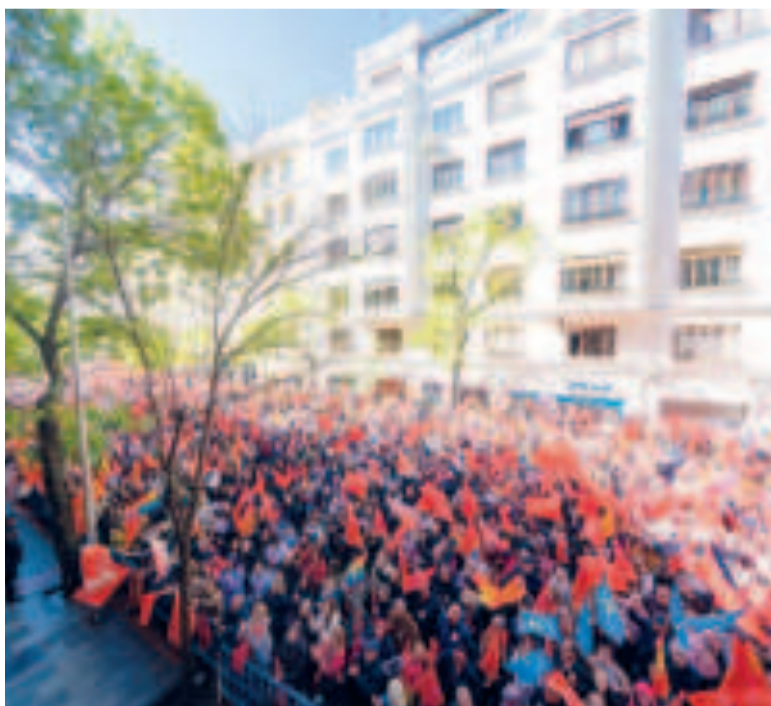
El Comité concluyó antes de tiempo para que sus integrantes se unieran a los 12 mil simpatizantes.