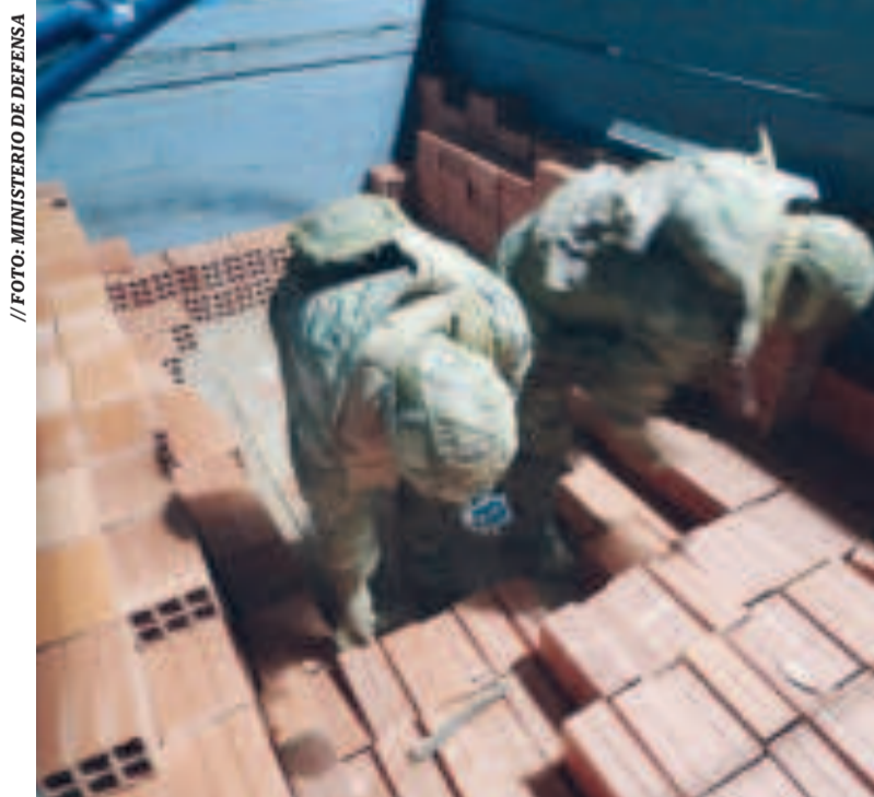
Militares detuvieron un camión con explosivos camuflados en ladrillos.

La Policía y la Aduana realizan las respectivas investigaciones para determinar el origen y destino de los explosivos decomisados en la frontera Perú-Bolivia.