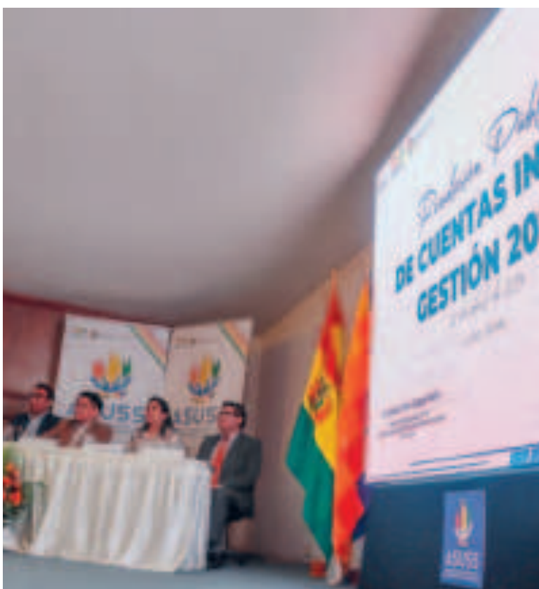
Autoridades de la entidad durante la rendición pública de cuentas.