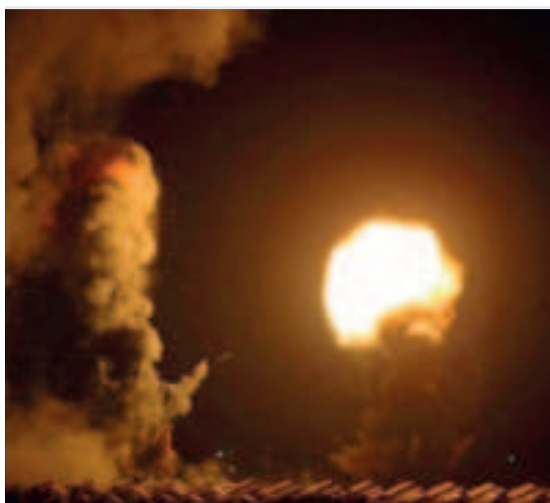
La Defensa Civil de Gaza también señaló la disolución de los cadáveres de las víctimas.