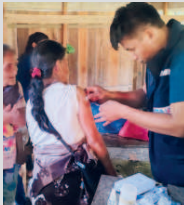
Mujeres yuracaré reciben atención médica.

Por otro lado, el Segip extendió 414 cédulas de identidad a la población en general de forma gratuita, y el Serecí facilitó 209 certificados de nacimiento.