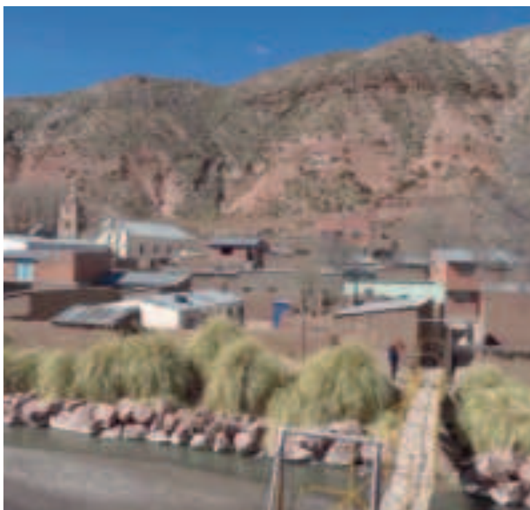
Una mujer fue víctima de feminicidio en Tupiza, departamento de Tarija.

Ante el hecho, llamaron a la Policía que procedió con el levantamiento del cadáver y aprehendió al autor confeso del crimen.