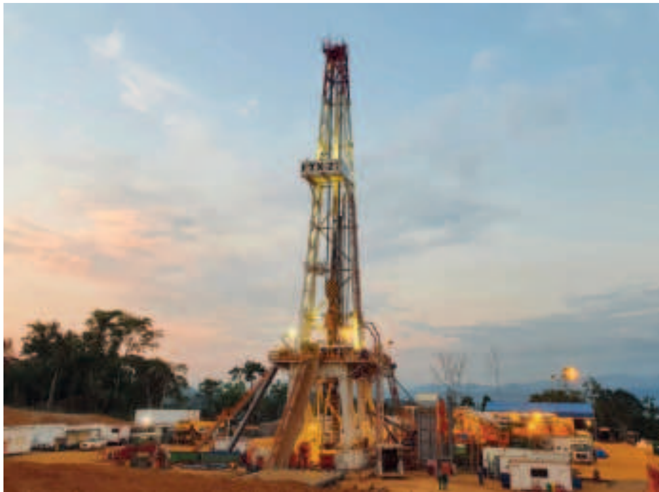
El pozo Mayaya Centro-X1 de Investigación Estratigráfica (MYC-X1 IE), ubicado en La Paz, en el área no tradicional Lliquimuni de la zona del subandino norte de Bolivia.

El presidente de la estatal petrolera, Armin Dorgathen, destacó que la provisión al país y a los mercados de exportación está garantizada.