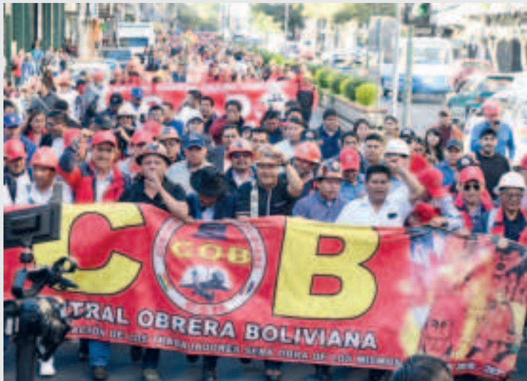
El presidente Luis Arce en la celebración del Día del Trabajador.

la sed de poder”, señaló el mandatario en Cochabamba, durante una concentración multitudinaria por el Día del Trabajador en la plaza 14 de Septiembre.