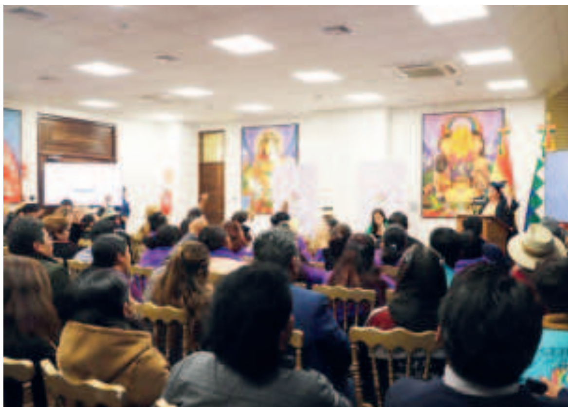
La ministra de la Presidencia, María Nela Prada, en su alocución.

La Ministra hizo un llamado a los legisladores para que prioricen estos proyectos de ley y trabajen en su pronta aprobación, en beneficio de toda la sociedad boliviana.