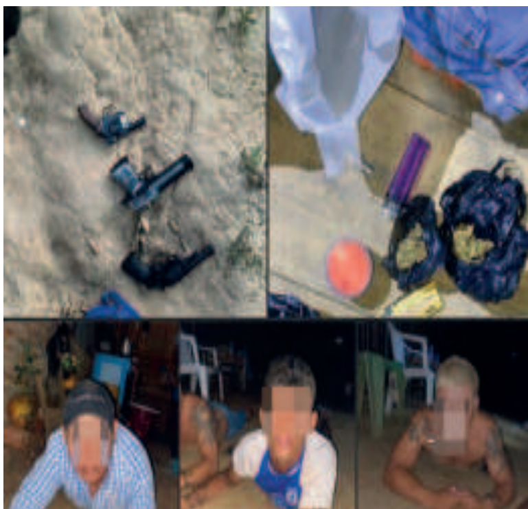
Banda de delincuentes que operaba en Cobija, Pando.

De acuerdo con los antecedentes, al igual que en Pando como en Santa Cruz, departamentos donde se vio la presencia de organizaciones criminales, se ejecuta una serie de operativos en todo el territorio boliviano para desarticular estas organizaciones criminales que están relacionados en operaciones de narcotráfico, atracos y asesinatos, como “ajustes de cuentas”.