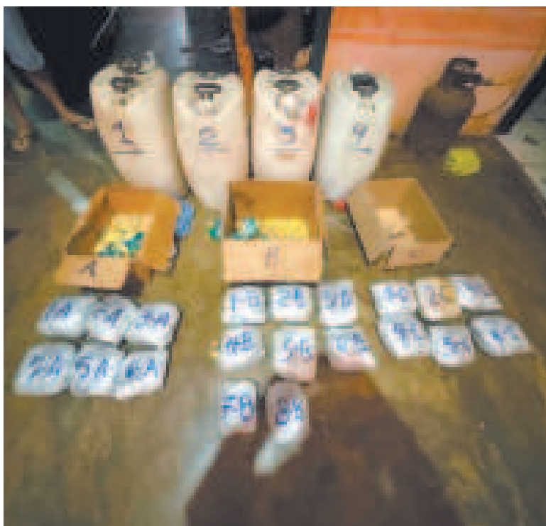
Marihuana y gasolina de aviación comisadas en Guayaramerín.