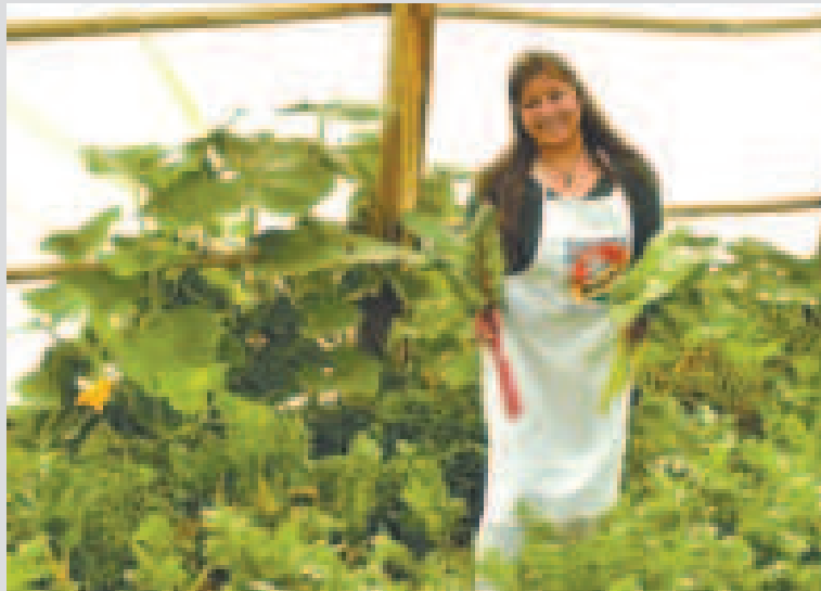
Las tasas de interés de los créditos se determinan de acuerdo con el tamaño de la actividad económica.

Por ello, estos préstamos se otorgan a tasas de interés reguladas en función del tamaño de la actividad económica del prestatario, las cuales pueden ser del 6% para la grande y mediana empresa, del 7% para la pequeña empresa y del 11,5% para la microempresa. "Lo anterior destaca la importancia de las actividades económicas del sector productivo como motor para el crecimiento sostenible del país", informó la ASFI.