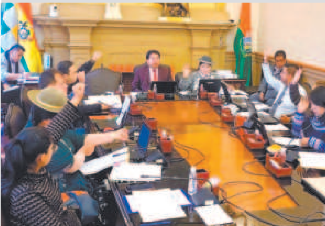
El Concejo Municipal de La Paz durante una sesión.

La fecha fue establecida por asociaciones de padres y diversas organizaciones no gubernamentales para concienciar sobre los riesgos del acoso escolar y los métodos para evitar la violencia en los centros escolares, y para establecer un protocolo de actuación ante casos de este tipo. La causa se representa con un lazo de color púrpura.