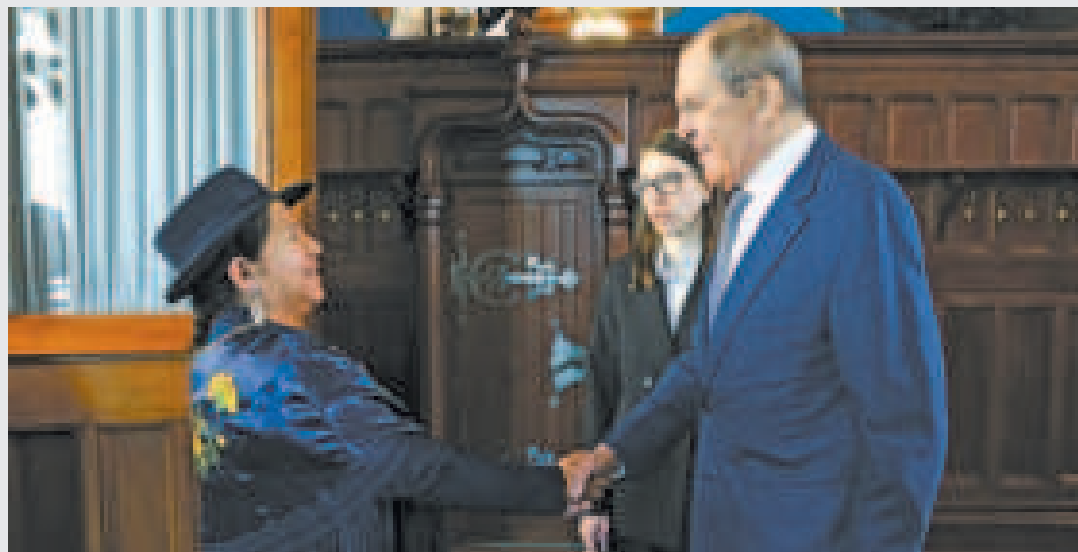
Los cancilleres de Bolivia y Rusia, Celinda Sosa y Sergey Lavrov.

Las declaraciones de Rusia en apoyo a la incorporación de Bolivia a los Brics generó expectativas positivas dentro del Estado Plurinacional, donde ven el posible ingreso al bloque como una oportunidad para avanzar en el plan industrializador encarado por el gobierno de Luis Arce. ¿Qué podría aportar y cómo se podría beneficiar la nación sudamericana si se consolida su ingreso?