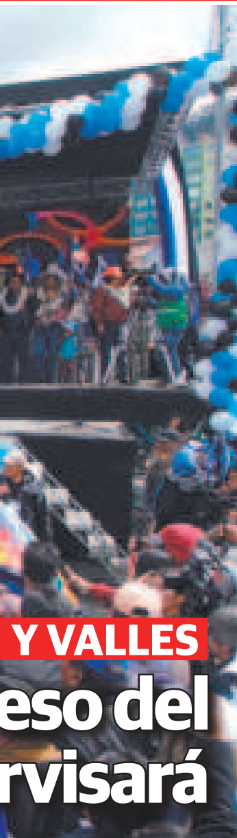
Militantes y simpatizantes del MAS-IPSP hacen ondear las banderas azules.