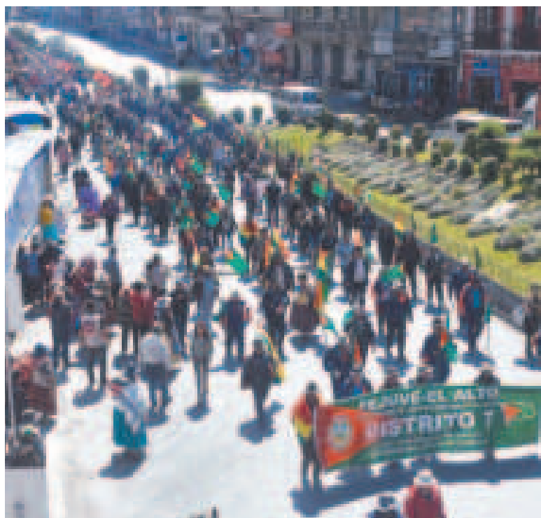
La marcha de la Fejuve de El Alto que llegó a la ciudad de La Paz el martes.