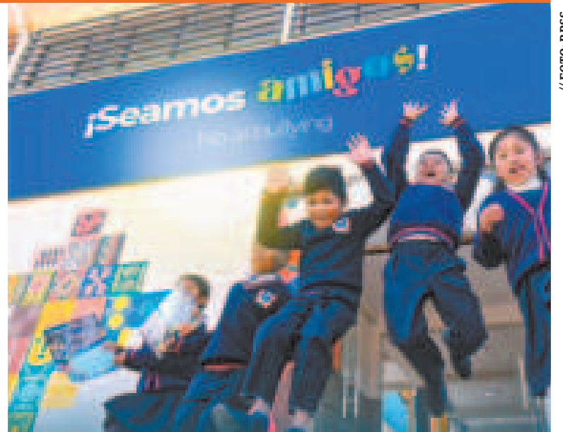
El 2 de mayo se celebra el Día Internacional de Lucha contra el Acoso Escolar.

Hoy en la tarde se conocerá a la nueva directiva. El panorama es incierto, ya que los concejales de Por el Bien Común - Somos Pueblo no solo han hecho públicas sus críticas a Arias, quien es el líder de su plataforma política, sino que incluso han llegado a procesarlo judicialmente. Lo mismo sucede entre ellos como colegas.