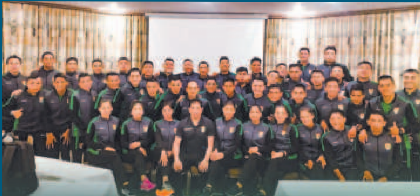
Los nuevos árbitros del fútbol boliviano podrían adelantar su debut para dirigir partidos de la División Profesional.

La agremiación de los árbitros pide respeto a su trabajo y una reunión con el titular federativo para hacerle conocer las condiciones de su actividad y pedir una explicación por la decisión que asumió al traer colegiados del extranjero para dirigir partidos locales.