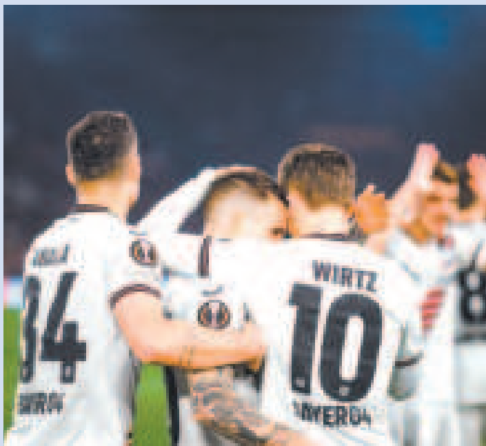
Jugadores del Bayer Leverkusen celebran la victoria de visitante.