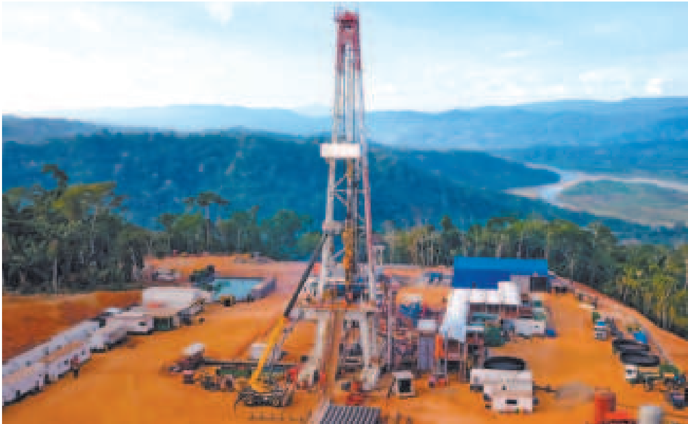
Actividad del personal de YPFB en el pozo Mayaya Centro-X1 para la investigación estratigráfica (MYC-X1 IE).