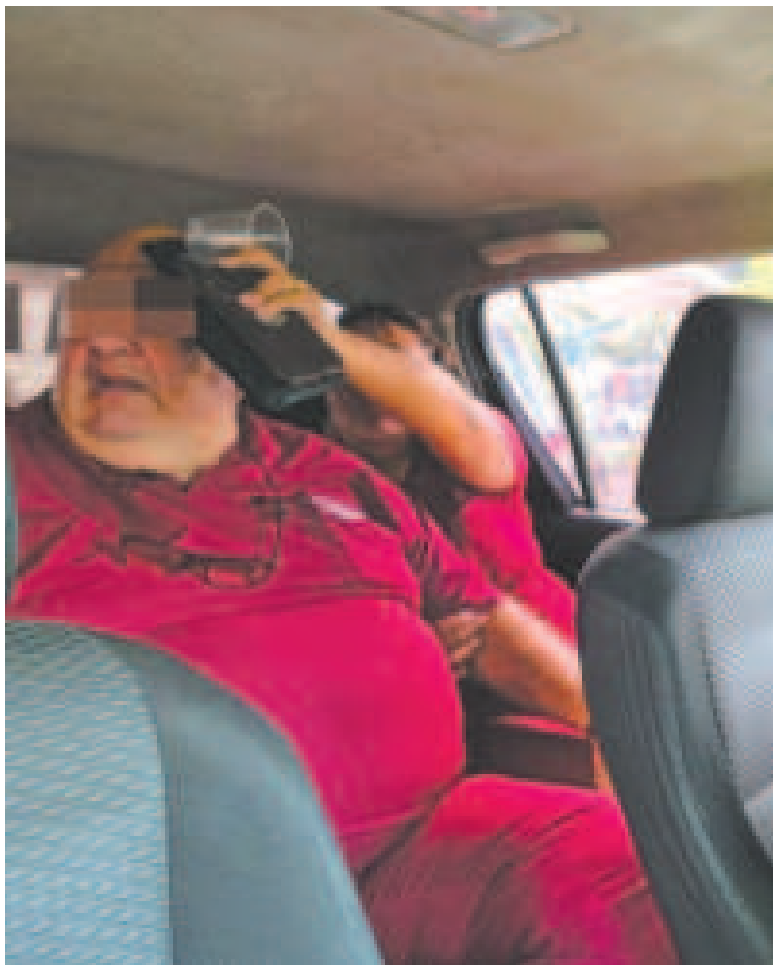
El Ministerio Público abrió la investigación por homicidio culposo.