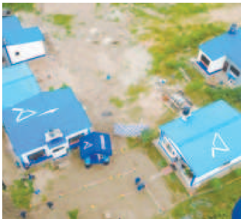
Viviendas sociales entregadas por el Gobierno.