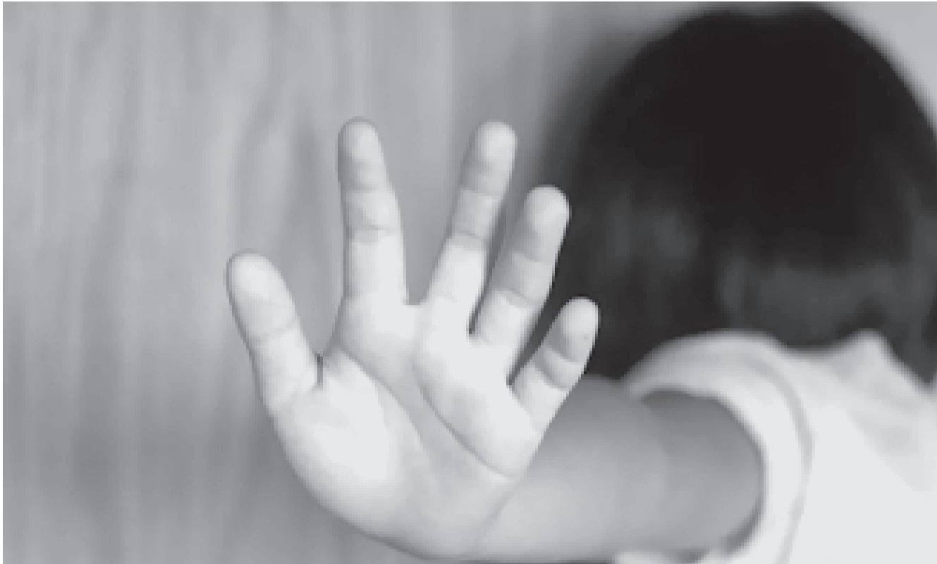
Los niños en situación de vulnerabilidad precisan leyes para su protección.