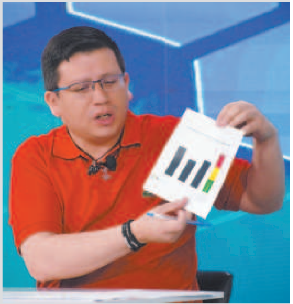
El ministro de Planificación, Sergio Cusicanqui, en entrevista.