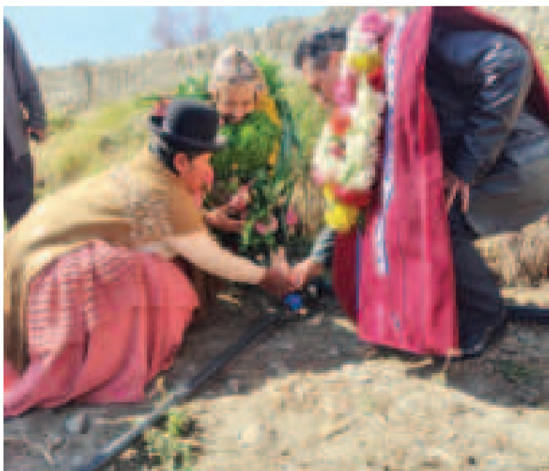
Las autoridades verifican el funcionamiento del sistema de riego.