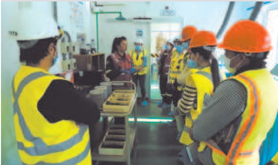
La visita de la delegación de empresas extranjeras a predios de Cityt MAT REB de YLB.