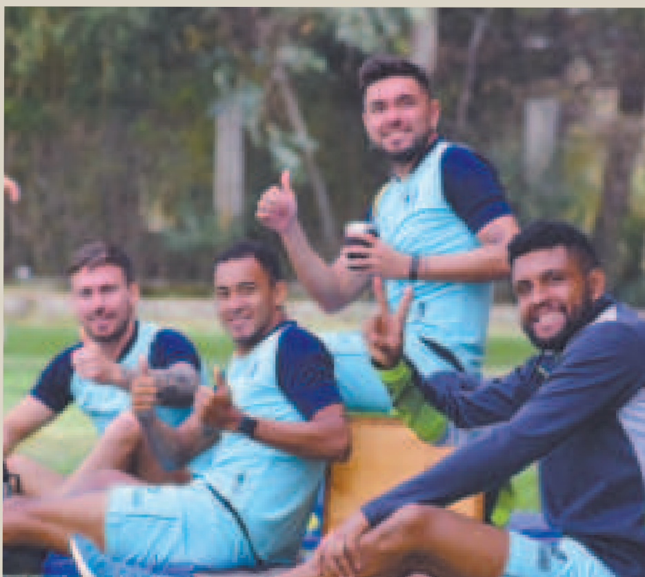
La confianza de los integrantes del equipo de Tomayapo por arrancar con una victoria en el Clausura.

Real Tomayapo y Gualberto Villarroel San José darán el puntapié inicial al torneo Clausura de la División Profesional del fútbol boliviano. El partido de la primera fecha se disputará hoy en el estadio IV Centenario de Tarija desde las 20.00.