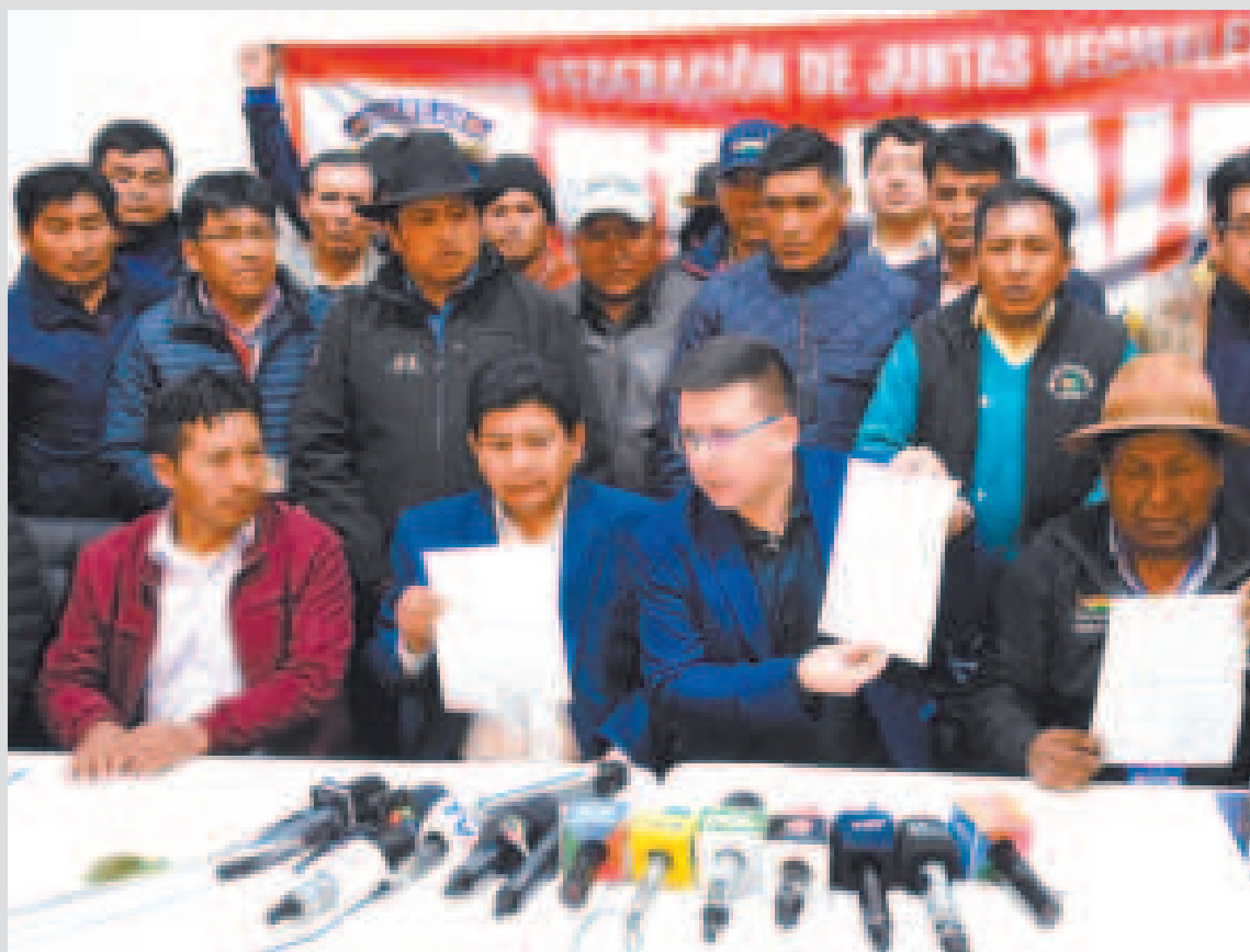
Representantes del Gobierno y de la Fejuve de El Alto durante la firma del acuerdo.

Los programas de enlosetado tienden a inyectar re-