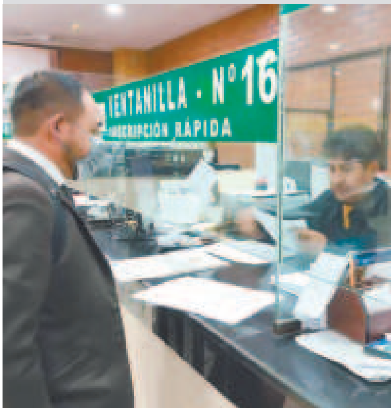
Una ventanilla de DRRR.