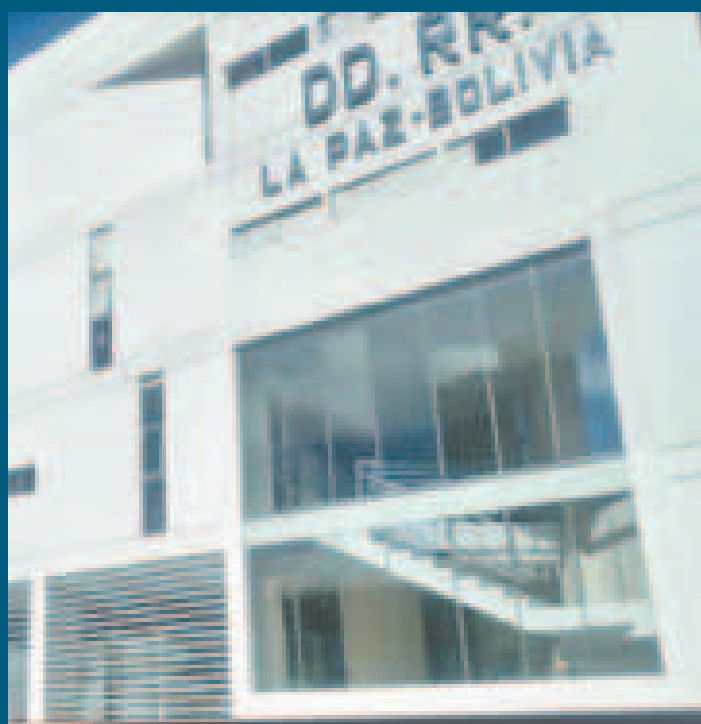
Oficinas de Derechos Reales en la zona Miraflores de La Paz.

Detalló además que la meta es contar con “Derechos Reales fortalecido, automatizado y sistematizado para que no haya posibilidad de que una casa, un departamento o un terreno tengan tres o cuatro dueños”, pero —añadió— “al parecer hay intereses a los que les conviene que esto siga así”.