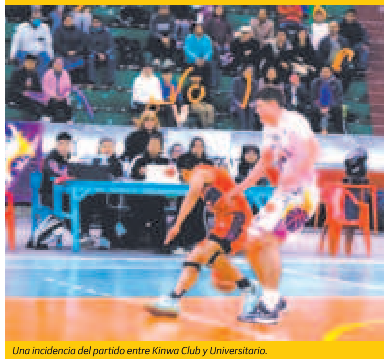
Una incidencia del partido entre Kinwa Club y Universitario.