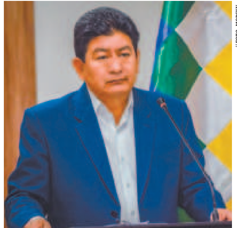
El ministro de Obras Públicas, Edgar Montaño, en conferencia de prensa.