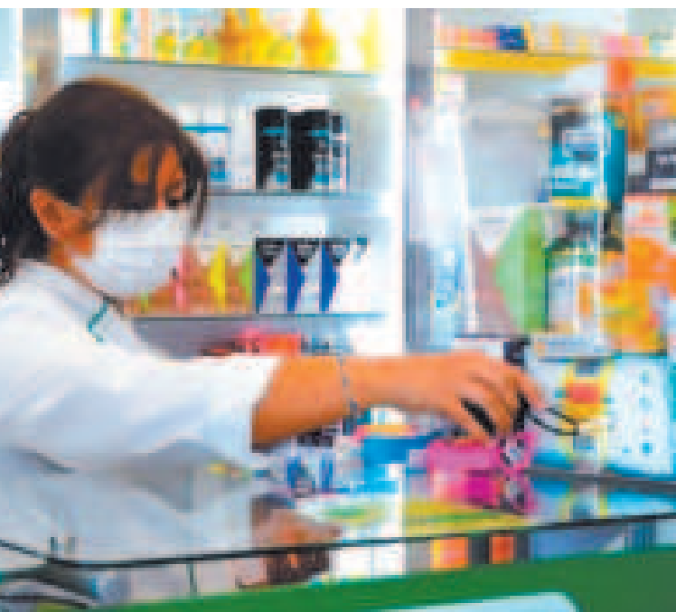
Las farmacias están llamadas a mantener los precios de los medicamentos sin incrementos.

“La industria nacional no ha dejado de producir. Estamos abasteciendo igual, de manera regu-