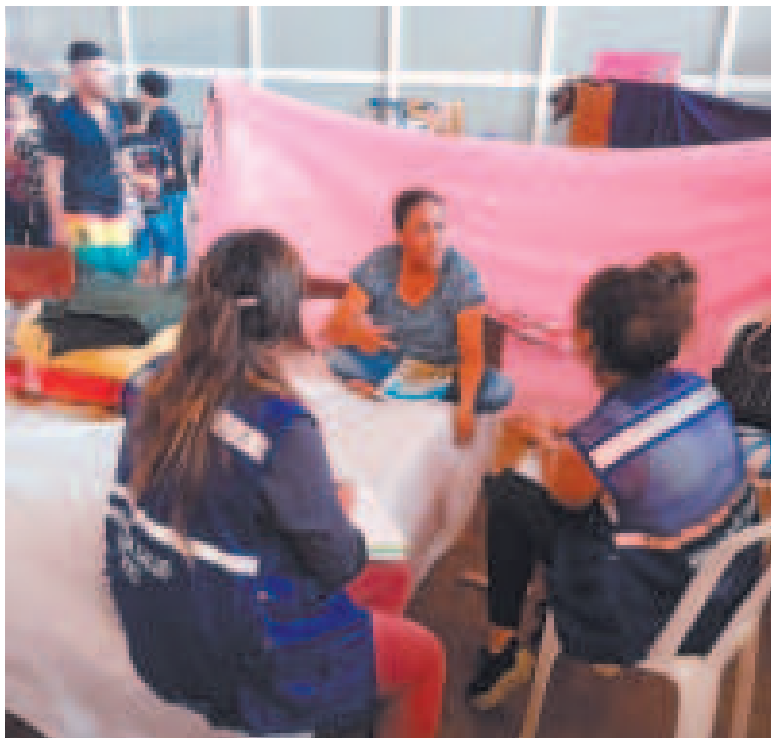
El personal de respuesta en desastres y emergencias recibió capacitación.