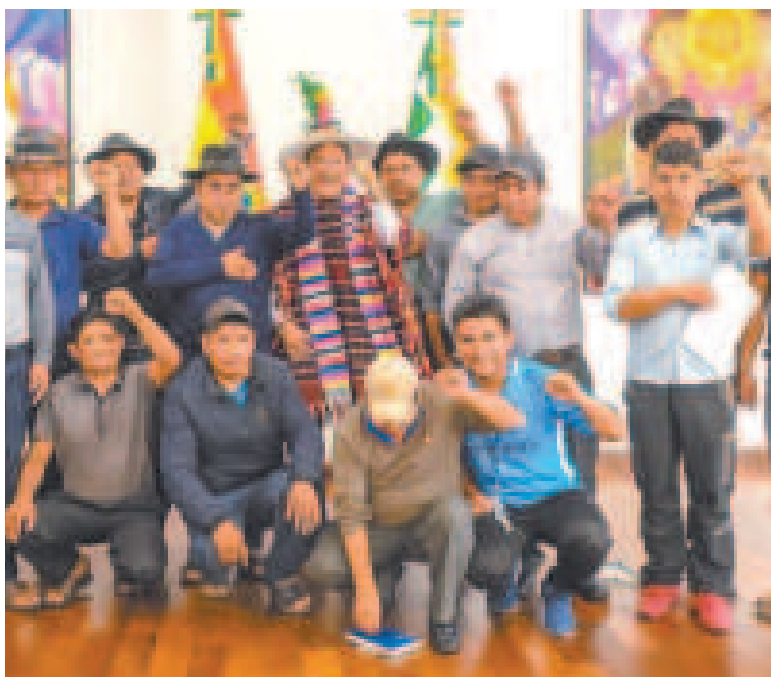
El presidente Luis Arce con delegados de organizaciones sociales de Chuquisaca.