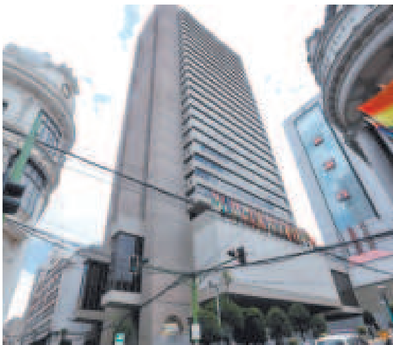
El Banco Central de Bolivia profundiza las políticas económicas.