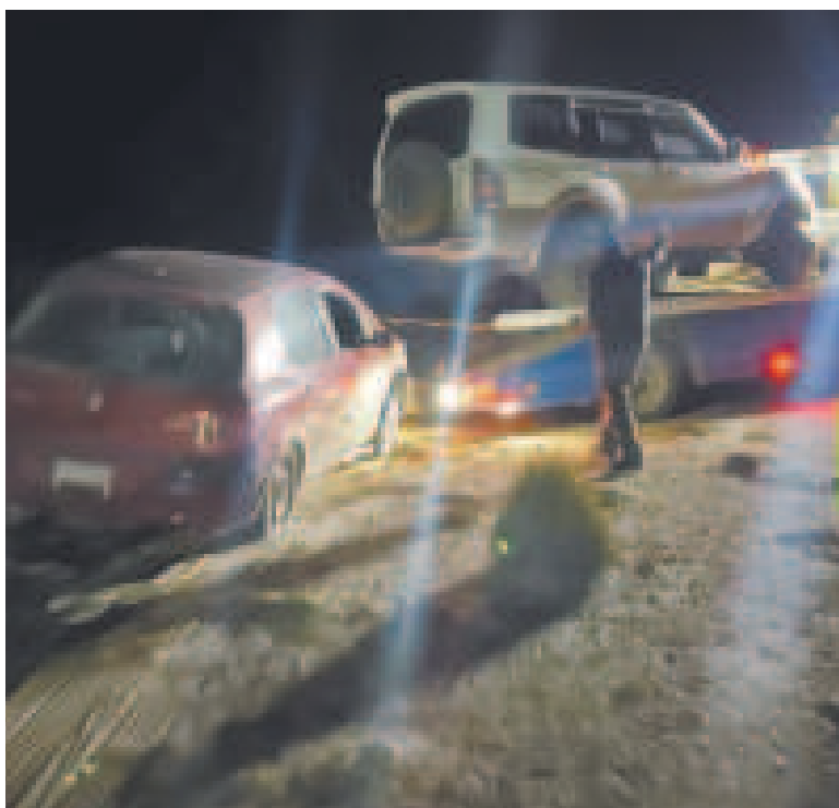
Vehículos indocumentados identificados por efectivos militares.