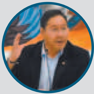
La población de Bolivia experimenta un crecimiento económico con estabilidad de precios.

Según sus datos, solo Paraguay mostró un crecimiento muy alto como el de Bolivia, llegó a 4,9%; Brasil alcanzó 2,1%; Uruguay registró un 2,0%, estos dos últimos tuvieron un crecimiento moderado en este periodo.