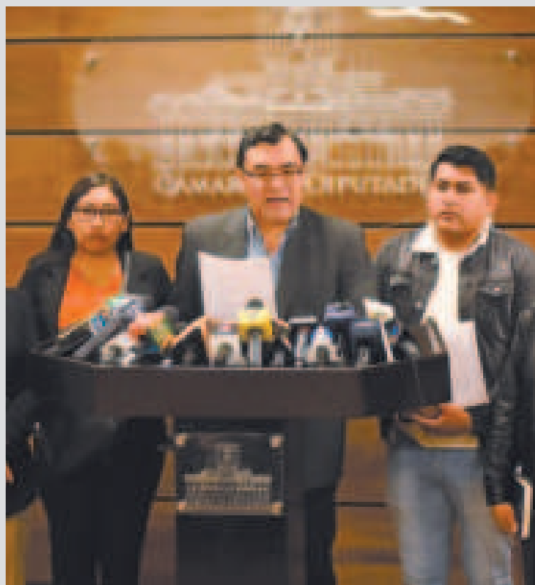
Conferencia de prensa de la Bancada Nacional del MAS-IPSP.

“El interés mayor que tenemos en la bancada del sector renovador del MAS, y por encargo del presidente Lucho, es allanar el camino, hacer los esfuerzos para encaminar el proceso”, dijo en Panamericana.