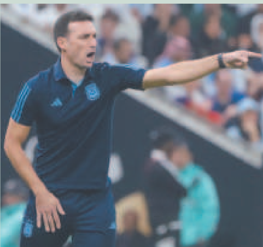
El técnico de Argentina, Lionel Scaloni, no dirigirá a su selección por estar suspendido.