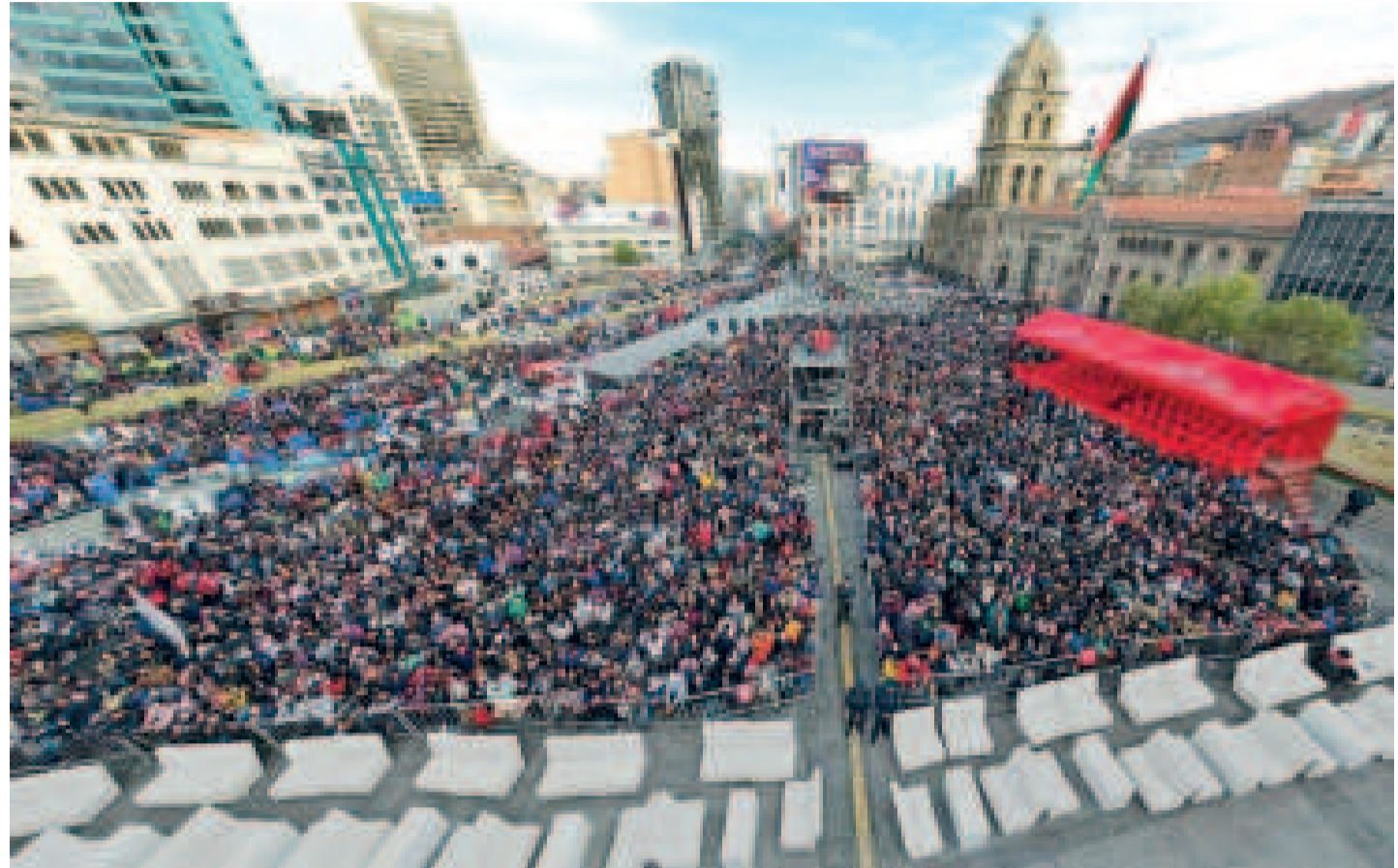
La tradicional verbena paceña se desarrollará en un lugar alternativo este año.

Por su parte, el secretario municipal de Culturas, Améri-