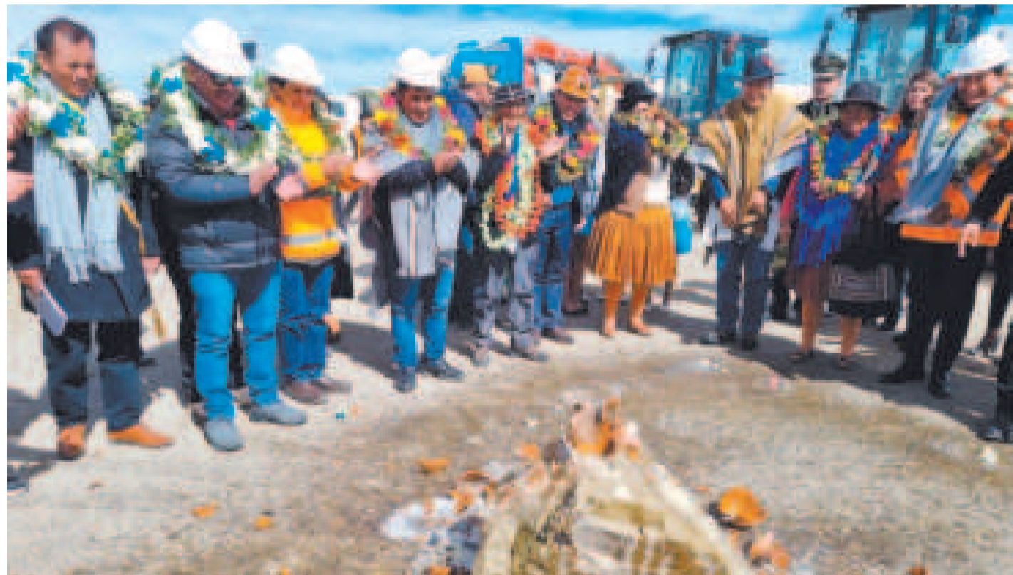
La tradicional ch'alla de las obras del aeropuerto La Joya, con presencia del presidente Arce y otras autoridades.

“Con estas obras no solo se mejorará la infraestructura aeroportuaria, sino que también se incrementará la seguridad y la comodidad de los pasajeros”, destacó el director de Naabol.