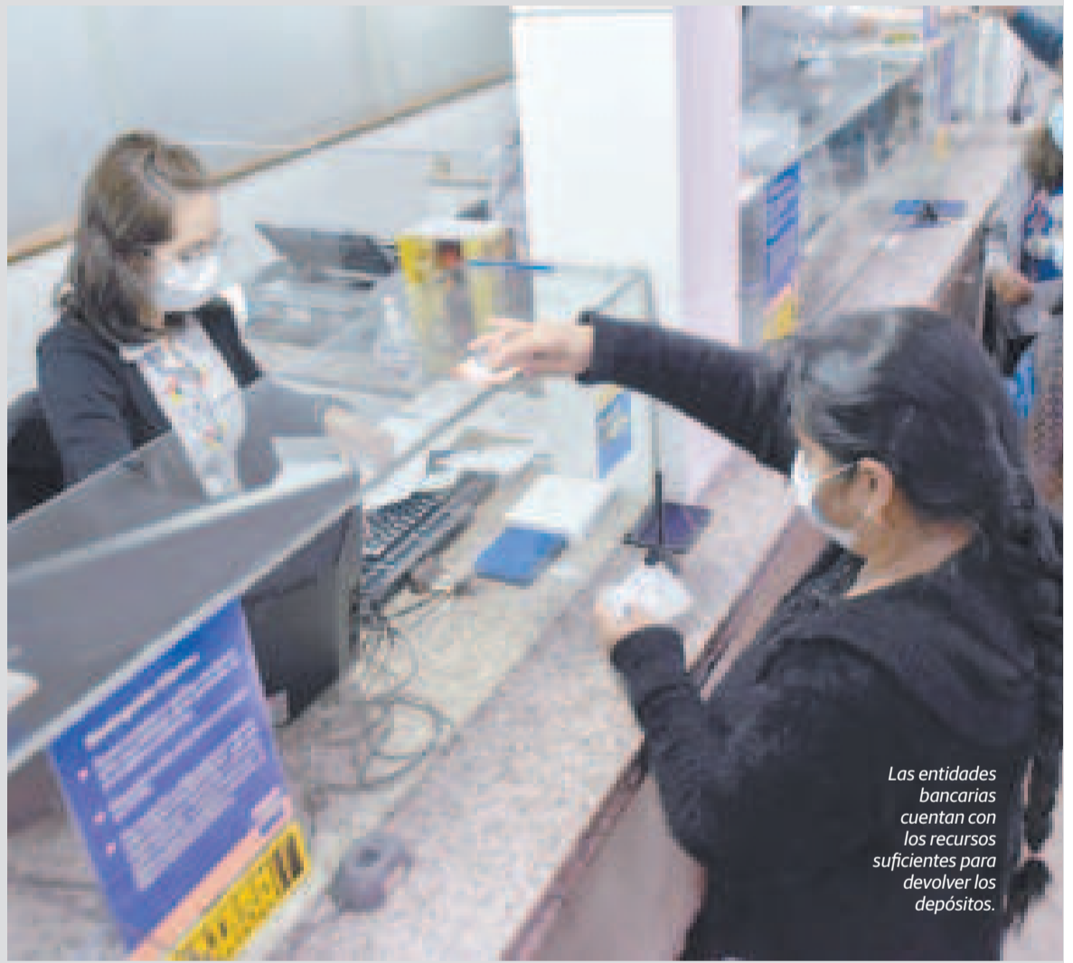
Las entidades bancarias cuentan con los recursos suficientes para devolver los depósitos.