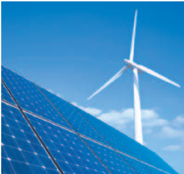
Fuentes de energía solar y eólica.