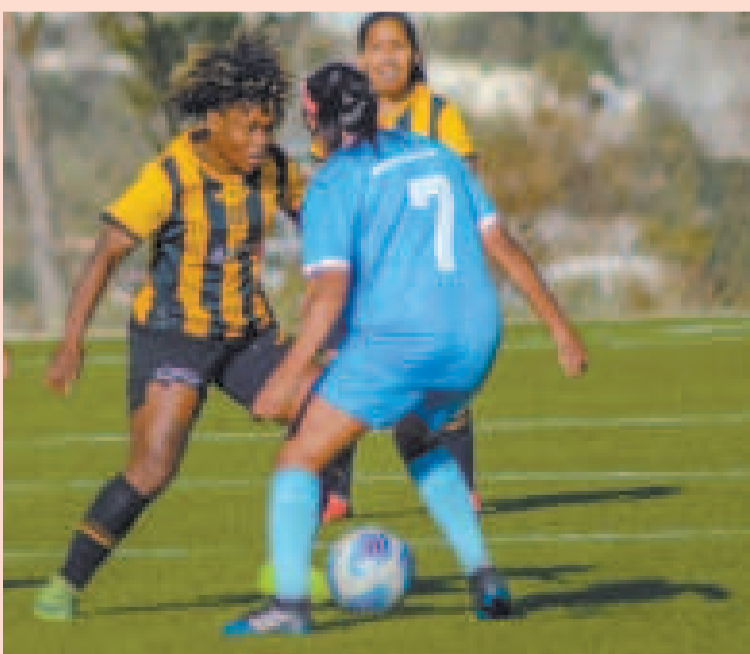
Una incidencia del clásico paceño femenino que se jugó en Ananta.