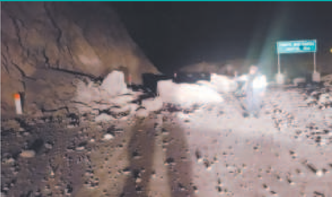
La autopista Panamericana Sur quedó incomunicada.