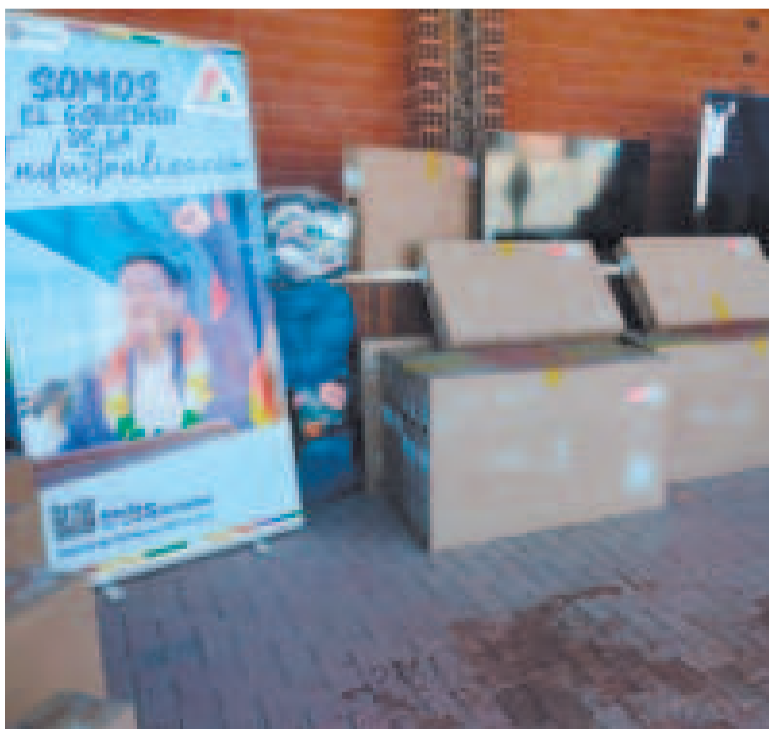
Parte de los televisores que fueron decomisados en el departamento de Cochabamba.

La Aduana Nacional anunció que intensificará los operativos de control para frenar este delito en todo el país.