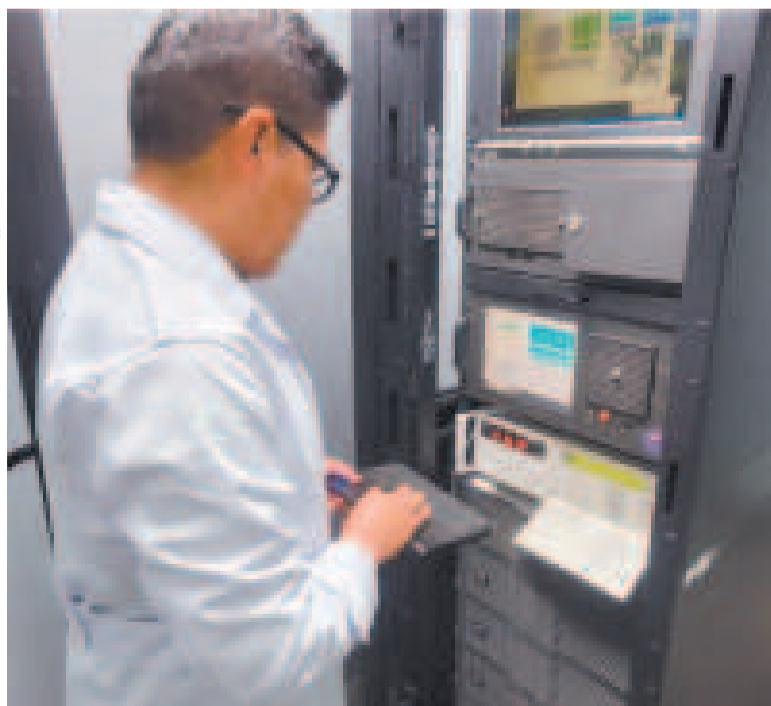
Uno de los relojes atómicos que marca la hora oficial en Bolivia.