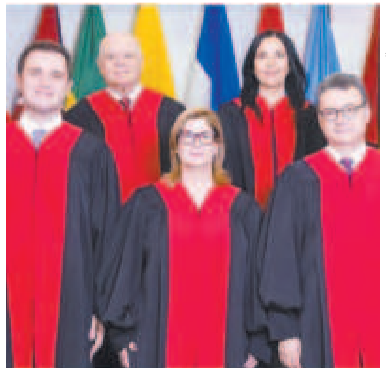
Integrantes de la Corte Interamericana de Derechos Humanos.