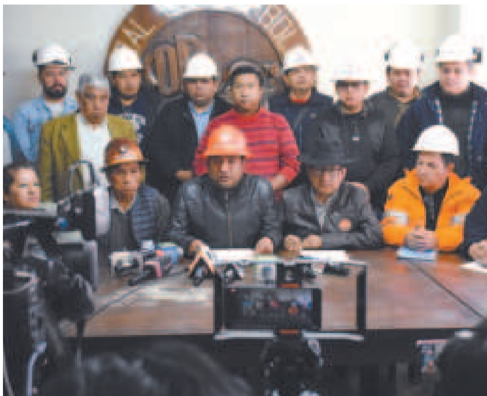
La dirigencia de la COB en conferencia.

El ente matriz de las organizaciones se reunirá en un ampliado la próxima semana para definir estrategias.