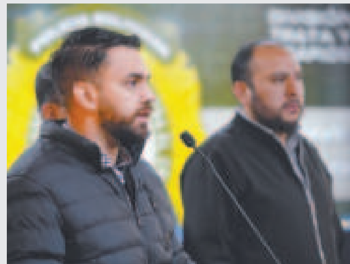
El ministro de Gobierno, Eduardo Del Castillo, durante una rueda de prensa.

Sin embargo, evitó dar mayores detalles en la medida que continúan las investigaciones. “Son elementos que están siendo investigados en este momento por la Policía Boliviana, no vamos a adelantar mayores