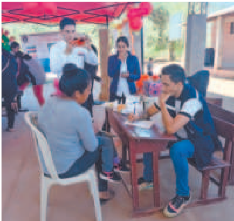
Personal de salud durante la feria de atención integral.