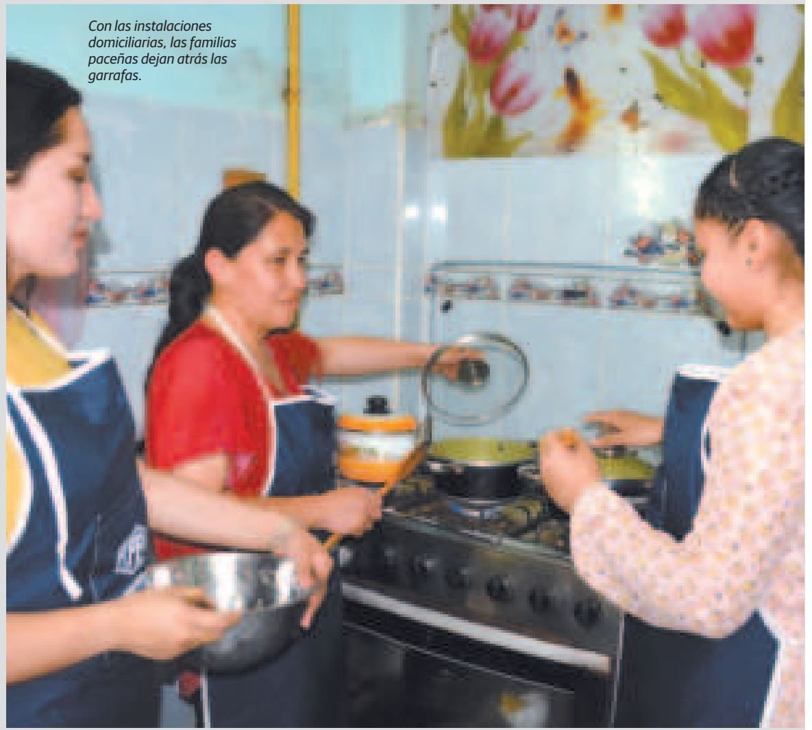
Con las instalaciones domiciliarias, las familias paceñas dejan atrás las garrafas.

La Planta de GNL, instalada en Río Grande, Santa Cruz, procesa gas natural para producir GNL, que se transporta a través de cisternas criogénicas hasta la ESR de Coroico, donde el GNL retoma nuevamente el estado gaseoso y es entregado por cañería a los domicilios de este municipio paceño. “Con esta moderna tecnología, las familias yungueñas se beneficiaron de un servicio básico mediante un combustible continuo y además mejoraron su calidad de vida”, agregó la gerente.