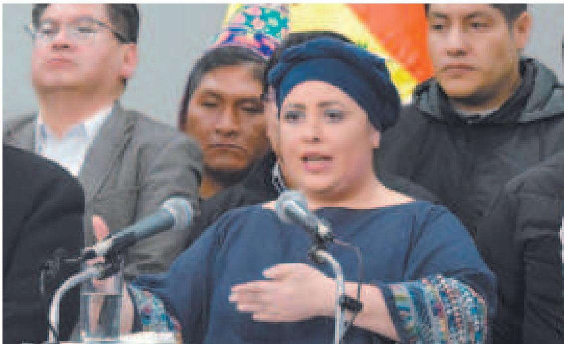
La ministra de la Presidencia, María Nela Prada.

Sectores de Vallegrande, Santa Cruz, se declararon en emergencia para defender la gestión del presidente Arce.