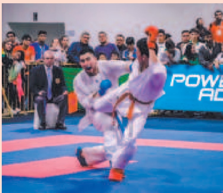
Una incidencia del Sudamericano de Karate, que se disputa en Santa Cruz.