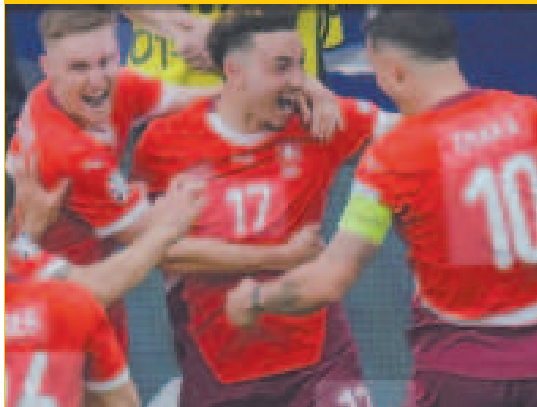
Jugadores de Suiza celebran el pase a cuartos de final.

De esta manera, la selección italiana se despidió de la competencia.