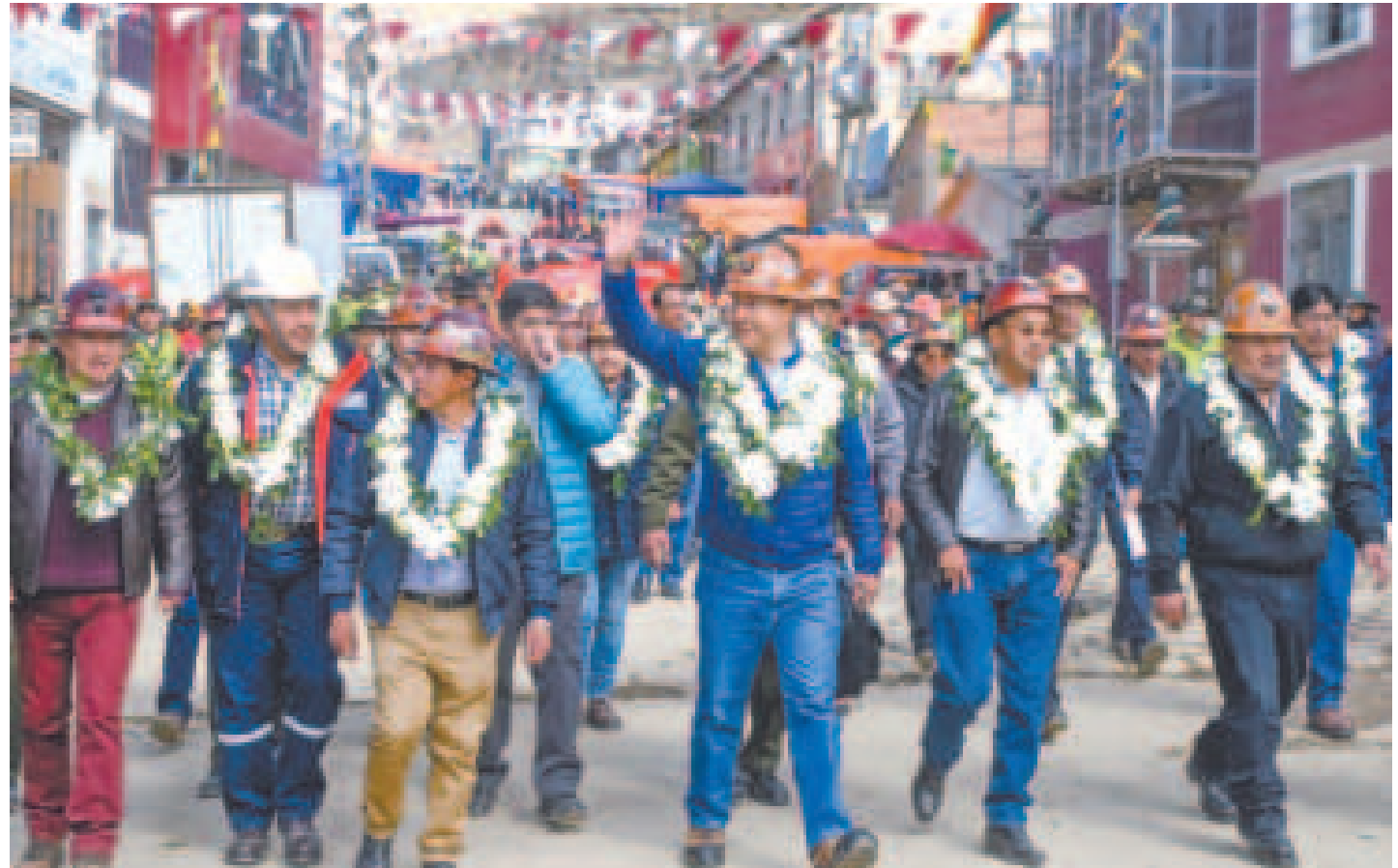
El presidente Luis Arce con los mineros.

“El ala evista piensa que Evo es el único líder, presidente y que puede hacerlo todo. Esa es la estructura que