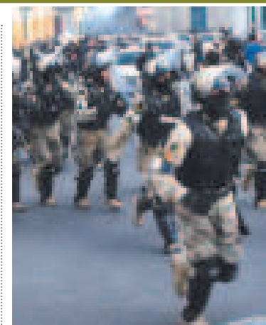
Militares en la plaza Murillo.