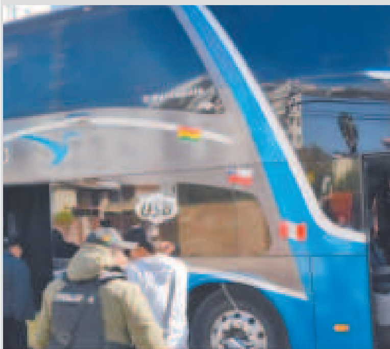
Requisa al bus en el que se halló droga que era trasladada a Chile.