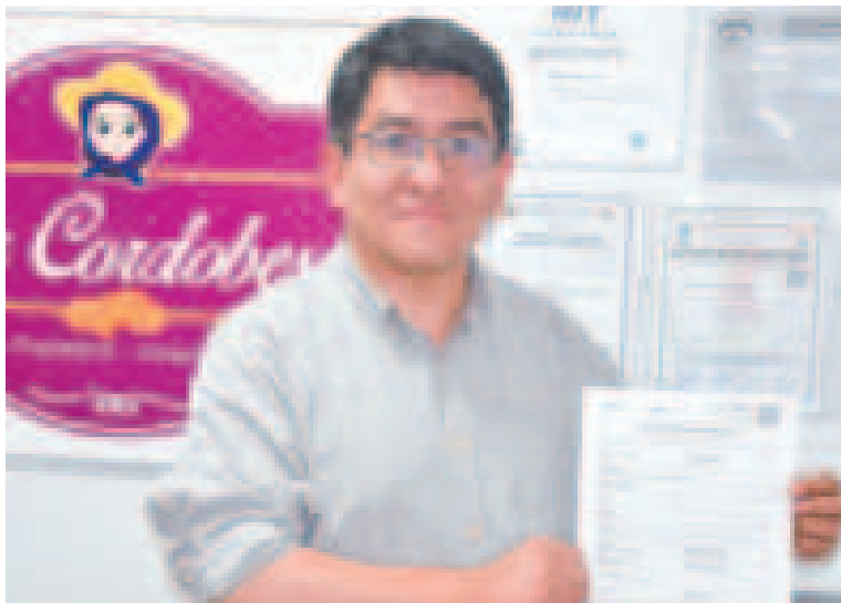
Las unidades económicas cuentan ahora con una guía para registrarse en el Seprec.