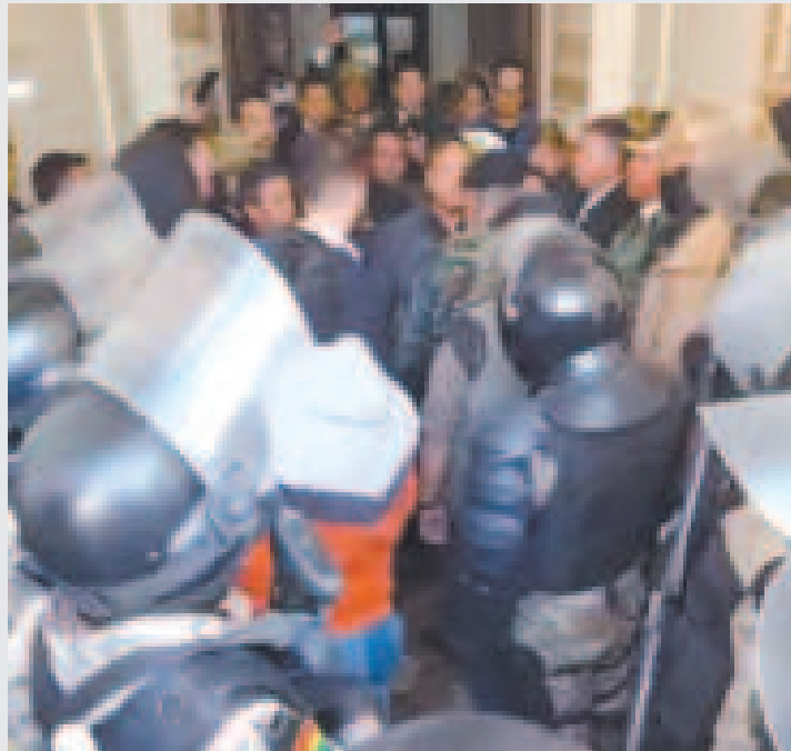
El presidente Arce frente al general Juan José Zúñiga en puertas del Palacio Quemado.

El miércoles, la incursión de una unidad militar desde Challapata hasta la sede de gobierno para tomar el poder, liderada por el entonces comandante Juan José Zúñiga, causó zozobra y miedo en la ciudadanía paceña que se volcó al kilómetro cero con el objetivo de hacer frente a los soldados que se habían apostado en las cuatro esquinas de plaza Murillo y defender la democracia.