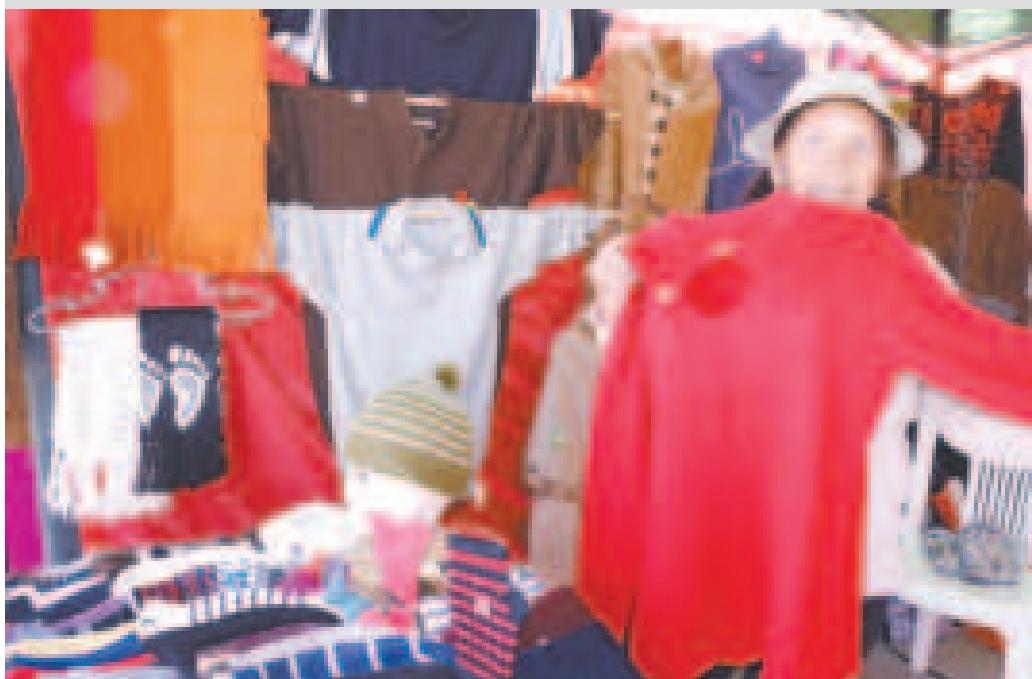
Se expuso una infinidad de prendas de vestir de lana de llama y alpaca.

mente valorada por la calidad de sus productos, la comercialización directa del productor al consumidor y la conveniencia de las compras facilitadas mediante servicios digitales como la banca y la Billetera Móvil”, agregó el director del programa.