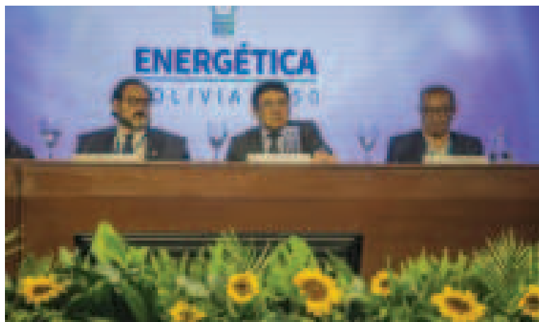
El ministro de Hidrocarburos y Energías, Franklin Molina (centro).

Según la experta, hay un mercado en el que los multila-