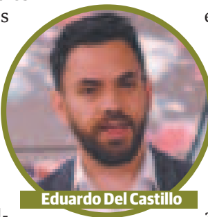
Eduardo Del Castillo

Del Castillo argumentó que existen todavía personas que planificaron el golpe de Estado en varios recintos militares, y que actualmente continúan confabulando contra el Gobierno.