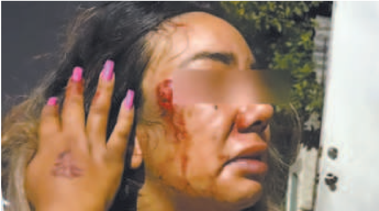
Una mujer víctima de violencia familiar.