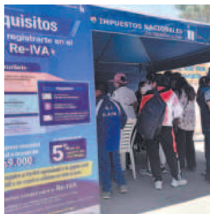
Las ferias tributarias se harán en todos los departamentos del país.

Estas modalidades de ferias se desarrollan bajo el impulso del gobierno del presidente Luis Arce, en coordinación con los gobiernos autónomos municipales de cada región y otras instituciones públicas y privadas, con el objetivo de canalizar información y afianzar la interacción entre las entidades estatales y la población.