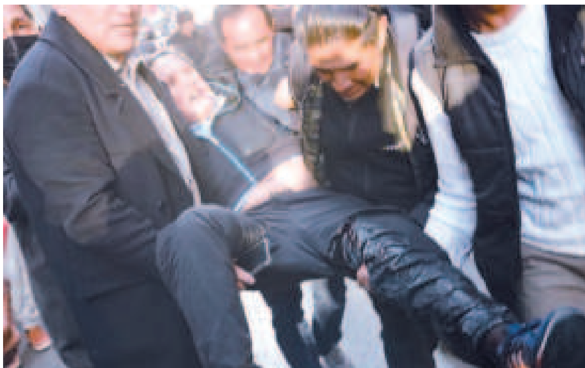
Un herido con balín luego de la toma de la plaza Murillo por un grupo militar.

“Sin lugar a dudas hay intereses externos sobre nuestros recursos naturales, no únicamente el litio; sino, como lo ha señalado nuestro Presidente, tierras raras, otro recurso natural estratégico (...) Esto no puede no ser un elemento a considerarse dentro de los afanes de desestabilización”, dijo.