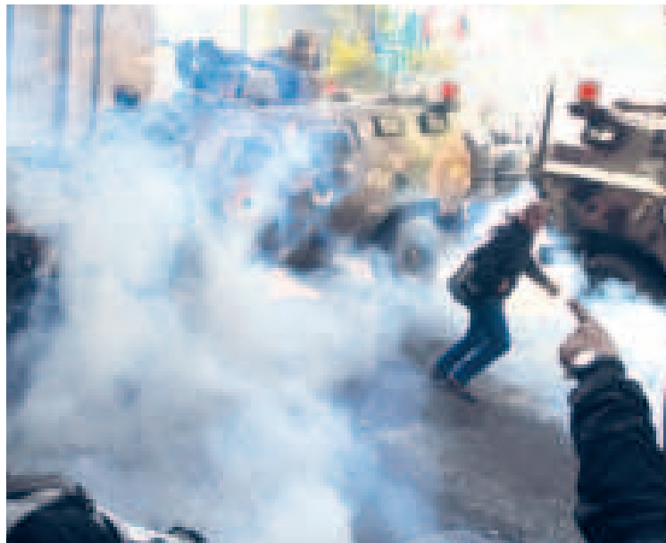
La irrupción militar cerca al Palacio Quemado, anexo a la Casa Grande del Pueblo.

Ante ello, Arce advirtió de que todos los implicados en el