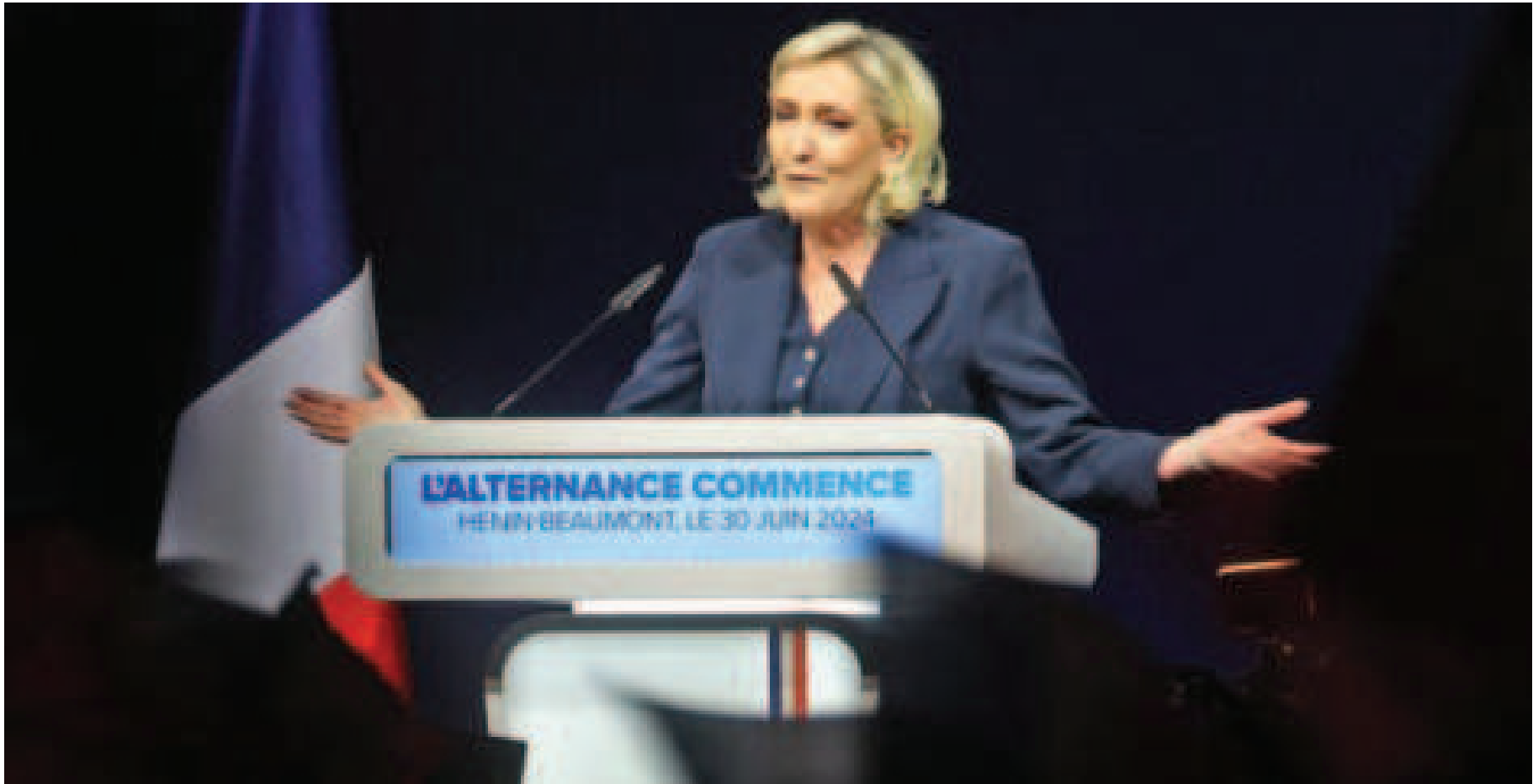
Marine Le Pen festejó en la primera vuelta pero debe revalidar el domingo.