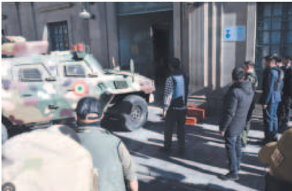
Una tanqueta choca contra la puerta principal del Palacio Quemado para derrumbarla y permitir el acceso de los militares.

“El señor Zúñiga había dado incluso la instrucción de disparar a la gente que se encontraba en inmediaciones del Palacio Quemado y de la Casa Grande del Pueblo. El comandante de la Octava División, de acuerdo a algunos hallazgos, le dice que no iba a acatar esa orden y Zúñiga lo amenaza con replegarlo del cargo. Y ese comandante le dice: ‘¿Qué más falta? ¿Qué más podemos hacer? ¿Dispararle al