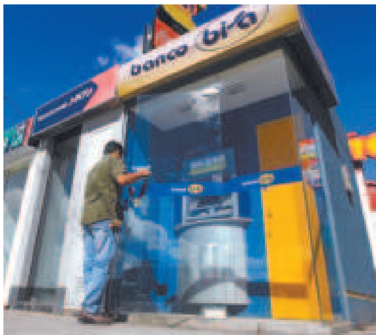
Los cajeros y las entidades financieras ya no muestran filas ni demanda alta.