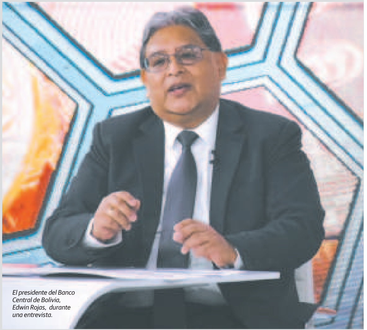
El presidente del Banco Central de Bolivia, Edwin Rojas, durante una entrevista.

“En este caso, dieron una muy buena evaluación a la aplicación de la Ley 1503 en términos de poder fortalecer nuestras reservas internacionales a partir de la compra de oro nacional”, detalló Rojas.