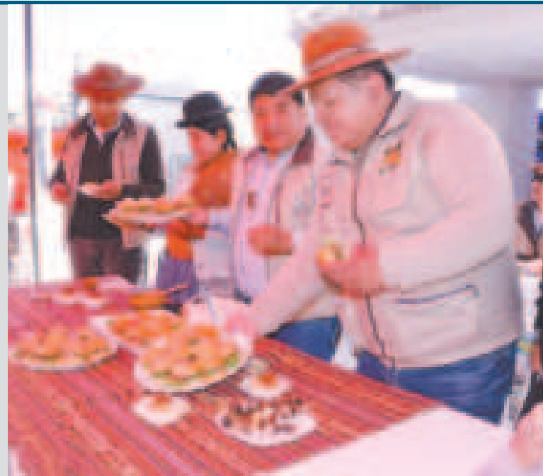
Los productos gastronómicos en las ferias.

“Las poblaciones de Oruro, Potosí y El Alto, en La Paz, mostraron un gran interés en nuestras ferias. Además de adquirir