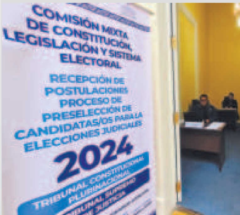
La convocatoria a las elecciones judiciales en el Legislativo.