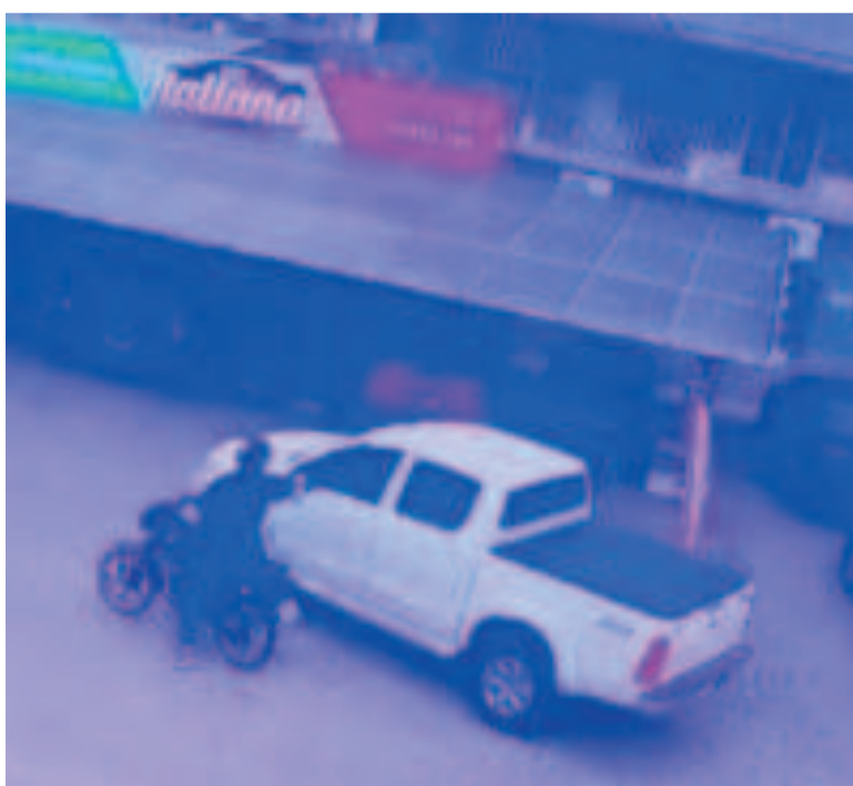
Imágenes de una cámara de seguridad muestran el momento en que fue abatido.