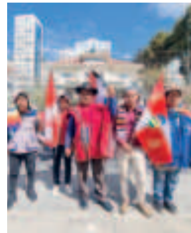
Vigilia en el TSE.

En este mes, y a propósito del aniversario de La Paz, el Gobierno entrega e inicia obras de desarrollo económico y social en varias regiones del departamento. Fue en la sesión por el aniversario departamental donde se oficializó, justamente, el descubrimiento del megacampo de hidrocarburos en el norte de La Paz, Mayaya XI.