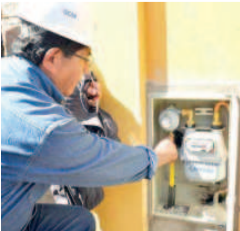
Un trabajador verifica la conexión de gas domiciliario.