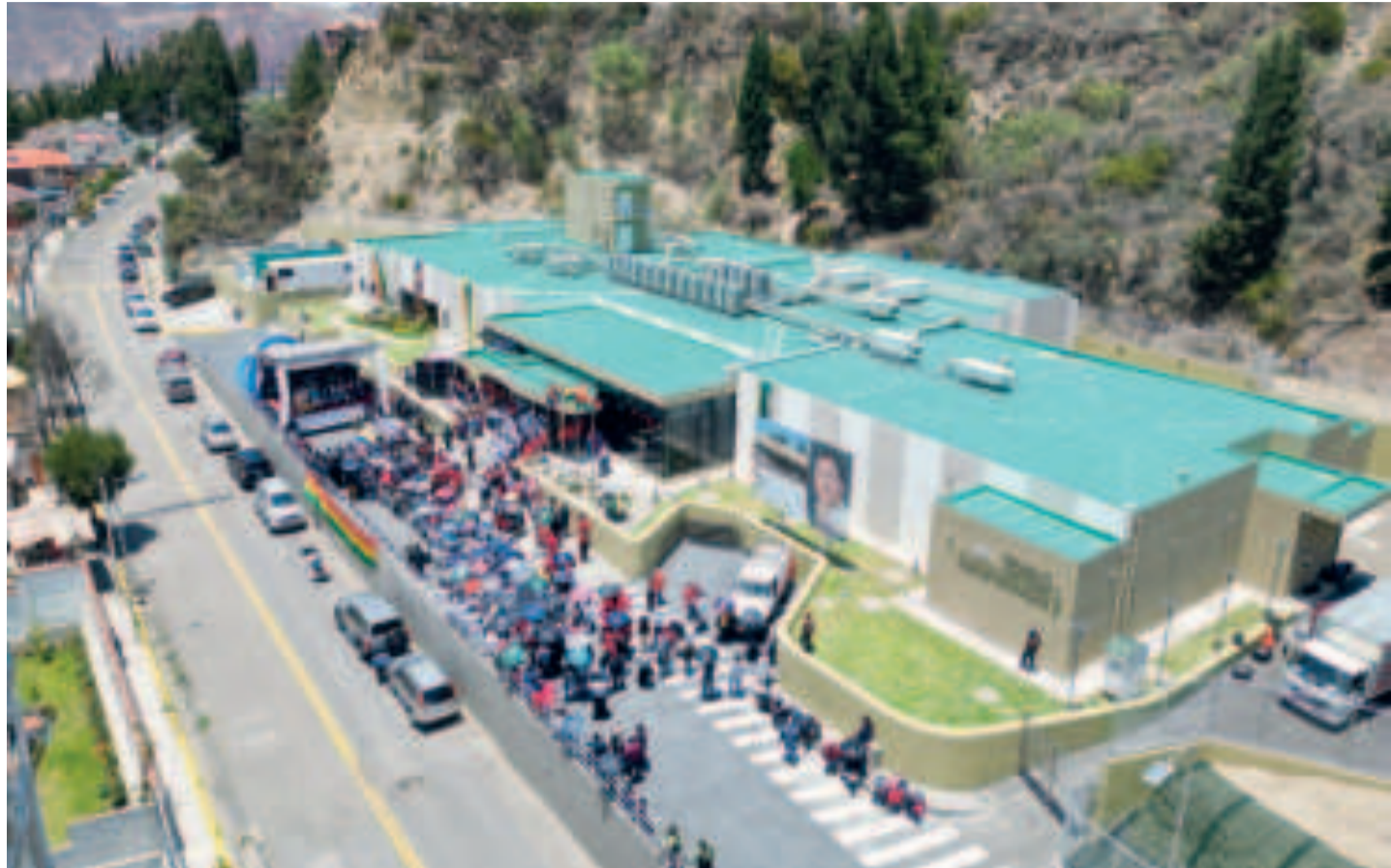
El CMNyR La Paz se inauguró hace siete meses.

El Centro de Medicina Nuclear y Radioterapia La Paz implementó un programa integral de terapia del dolor que incluye una amplia gama de tratamientos y técnicas diseñadas para proporcionar alivio efectivo y mejorar la calidad de vida de los pacientes oncológicos. Entre los servicios ofrecidos se encuentra el uso de analgésicos opioides y no opioides, ajustados y titulados adecuadamente para cada paciente, de forma que se pueda maximizar la efica-