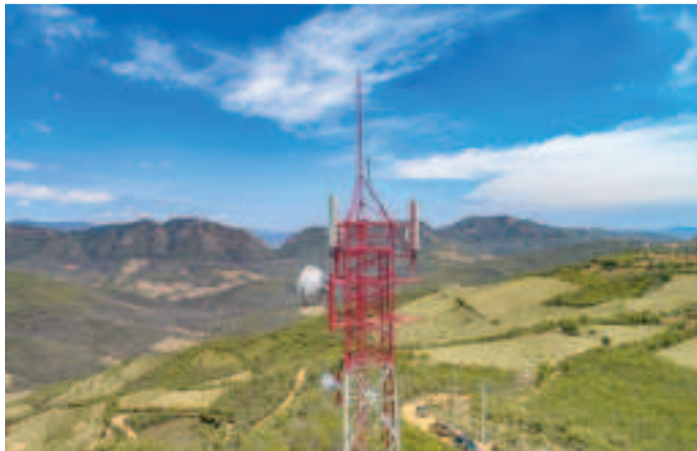
Una antena de radio base instalada por Entel.