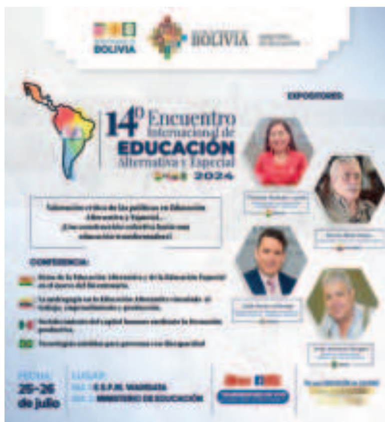
Expertos internacionales serán parte de este evento.