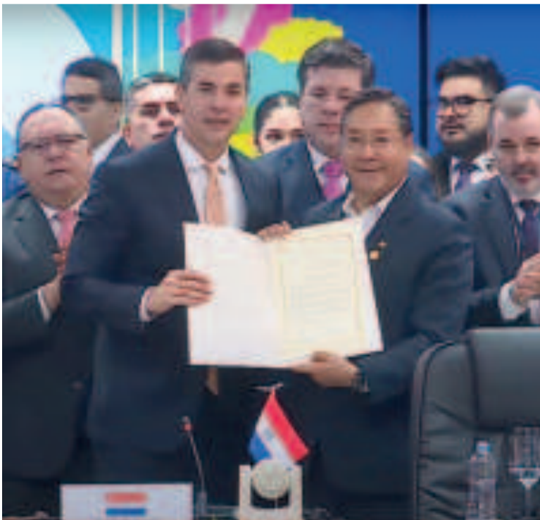
El presidente Luis Arce entrega la adhesión al Mercosur a su par Santiago Peña.