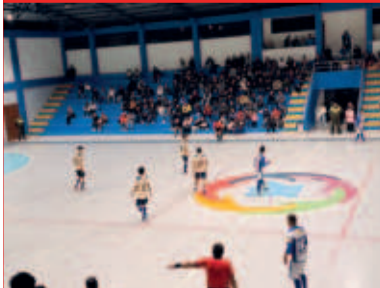
Una escena del partido entre Víctor Muriel y Redag.

La Liga tendrá una pausa por la participación de la Selección Sub-17, rama masculina, en el Campeonato Sudamericano que se lleva adelante desde el 17 hasta el 25 de julio, en la ciudad paraguaya de Luque, y la actuación de la Sub-20 y la Mayor en la Liga Sudamericana, del 24 al 28 de julio, en la ciudad de Los Ángeles, Chile.