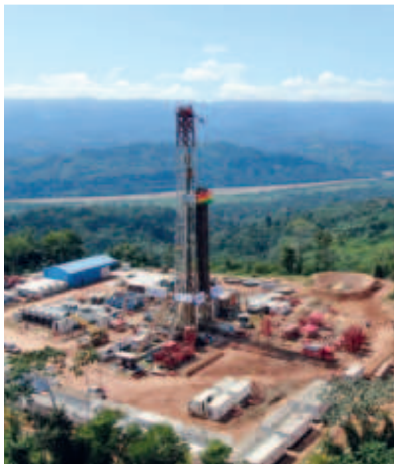
El megacampo hidrocarburífero Mayaya X1, en el norte de La Paz.