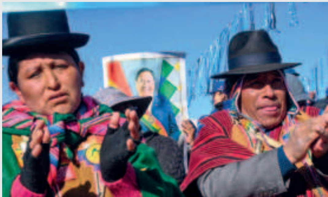
Una fotografía del presidente Luis Arce en la entrega de obras en Viacha.

“El pueblo boliviano nos ha enseñado que hay que respetar la unidad y defender la democracia”, afirmó el mandatario en la industrial ciudad de Viacha, vecina de El Alto, donde inauguró la construcción de la Planta Procesadora de Productos, Subproductos y Derivados Cárnicos, que demandará una inversión de más de Bs 10 millones, y destacó la importancia de estos valores para la nación.