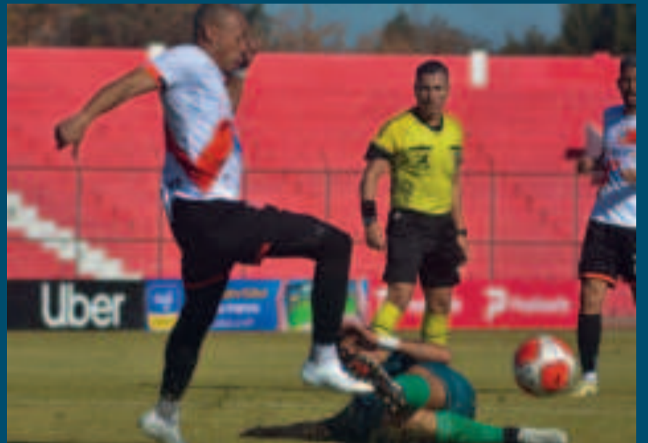
Una escena del cotejo que se disputó en el estadio IV Centenario de Tarija.

En el retorno a la competencia, la banda roja tiene problemas para encontrar el gol y el triunfo. Su juego carece de contundencia, reacciona tarde y esto puede generar mayores contratiempos.