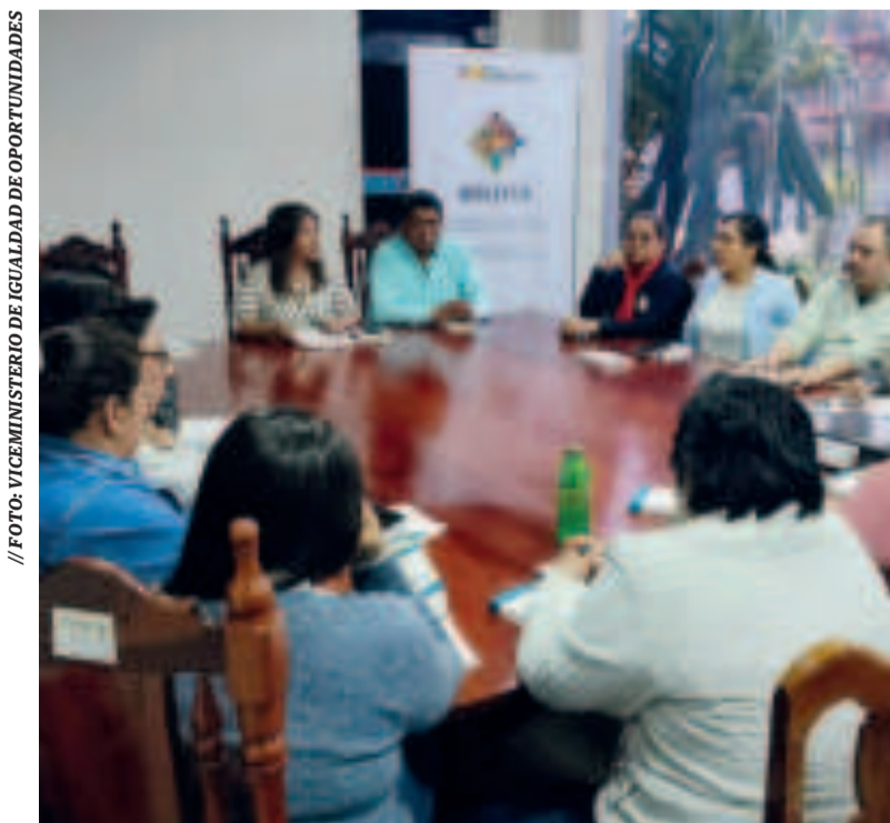
Mesa Departamental del Sistema Penal para Adolescentes.