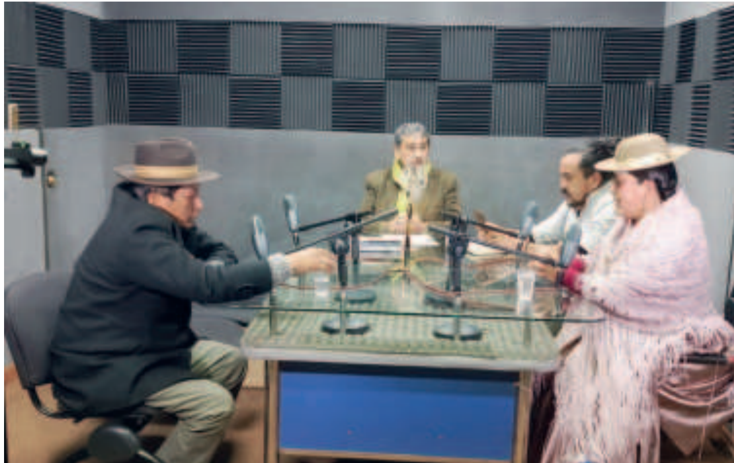
Panelistas invitados al programa de las RPO.

“¿Qué moral tienen para criticar?”, cuestionó a los opositores de la derecha. Recordó que durante el gobierno de facto de Jeanine Añez se paralizó toda inversión y se condujo al país a una grave crisis económica. Además, señaló que el expresidente Morales, a pesar de contar con