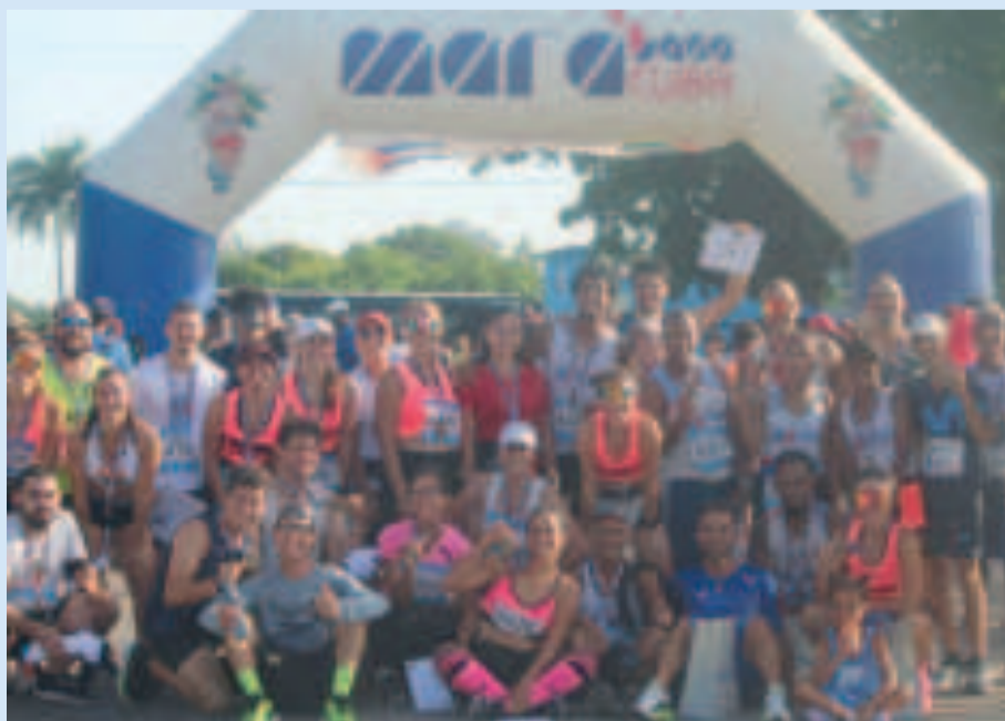
Atletas que participaron en la carrera Por la Paz Mundial, que se desarrolló en Cuba.