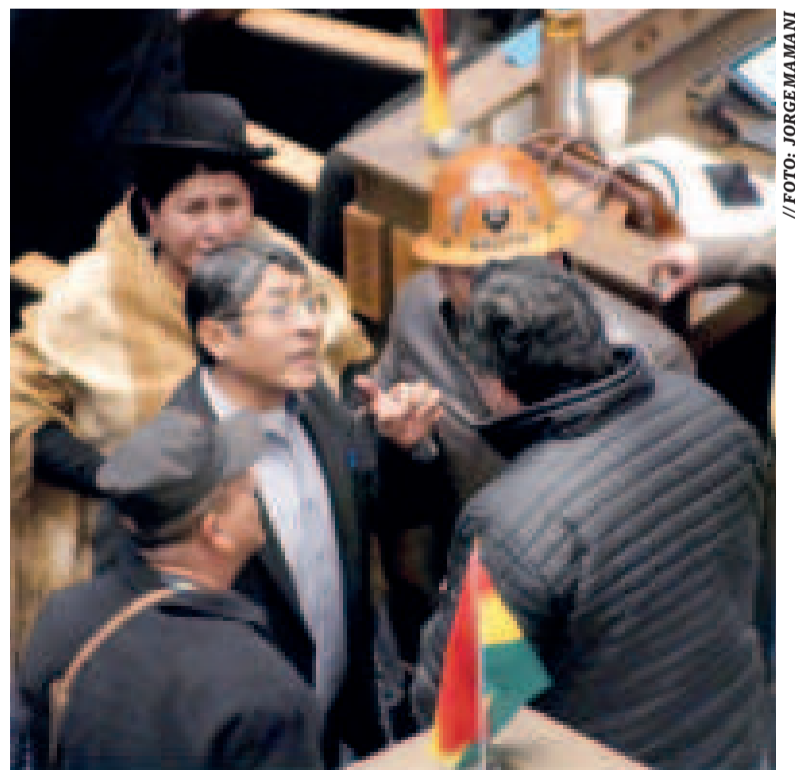
Las discusiones volvieron a la Asamblea Legislativa.

transitoria electoral que dice que una declaratoria desierta no puede ser regional.