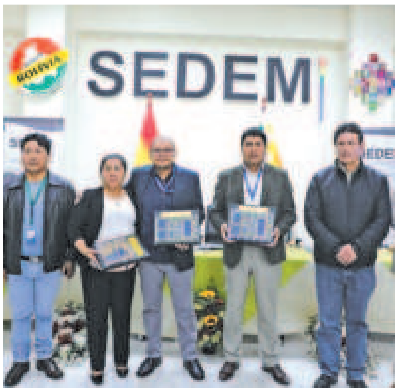
El evento de celebración de la creación de la Empresa de Abonos y Fertilizantes.

La Empresa Estratégica de Producción de Abonos y Fertilizantes es una entidad que contribuye al desarrollo y fortalecimiento de la actividad productiva agropecuaria a través de la producción y comercialización de insumos agrícolas, bajo el principio de garantizar la seguridad alimentaria con soberanía en el país.