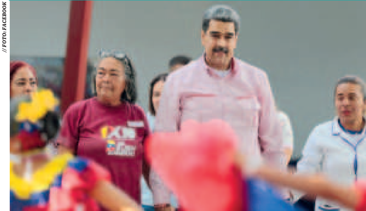
Nicolás Maduro antes de las elecciones presidenciales del 28 de julio.