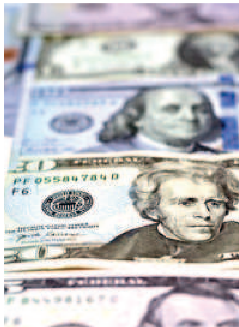
El dólar se mantuvo a flote por acciones de la Reserva Federal.