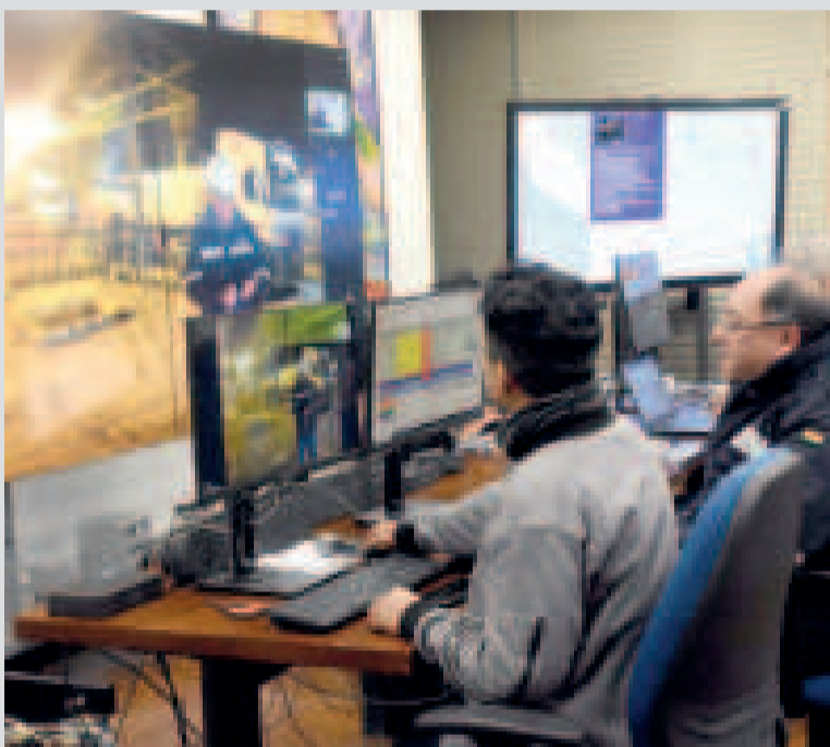
Centro de Monitoreo instalado en la Casa Grande del Pueblo.