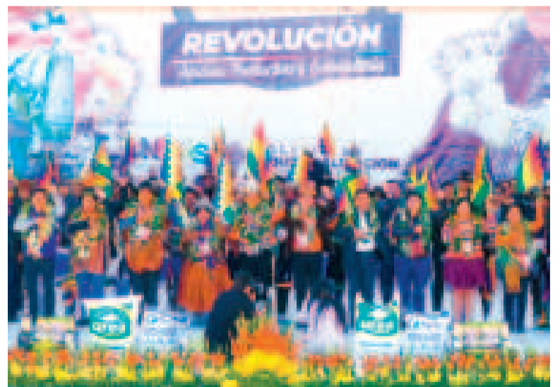
El acto por el Día de la Revolución Agraria.

“Rendimos homenaje a la histórica lucha de nuestro valiente y combativo sector campesino por mejores condiciones de vida, territorio y derechos”.