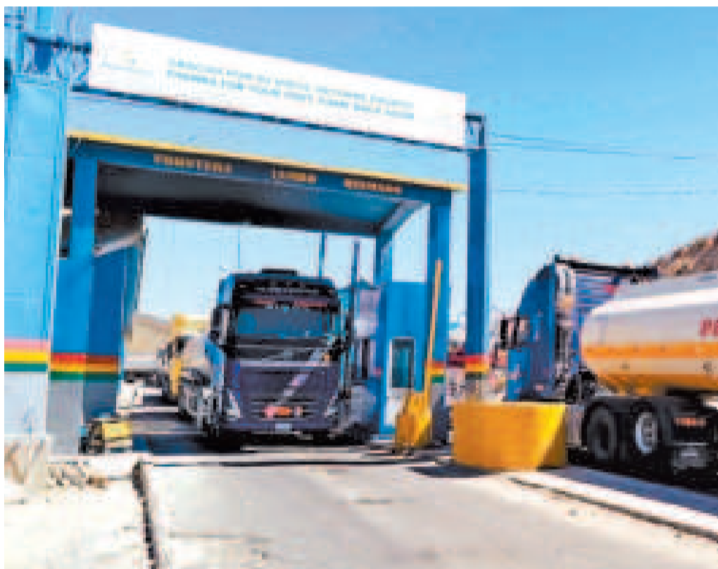
El ingreso y salida de camiones cisternas en el paso fronterizo de Tambo Quemado, Oruro, ayer.

Según lo previsto, hasta las 22.00 de ayer ingresaron al país 100 camiones cargados del combustible al país.