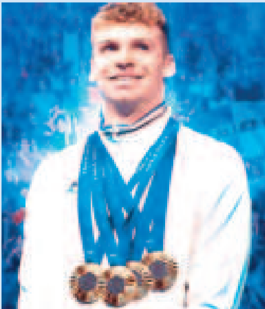
El francés Léon Marchand se exhibe con sus cuatro oros.

Cuatro medallas de oro hicieron vibrar a Francia. "Una noche mágica con la que he soñado toda la semana", confesó la sensación de los Juegos Olímpicos, Léon Marchand, la gran figura de la natación de París 2024.