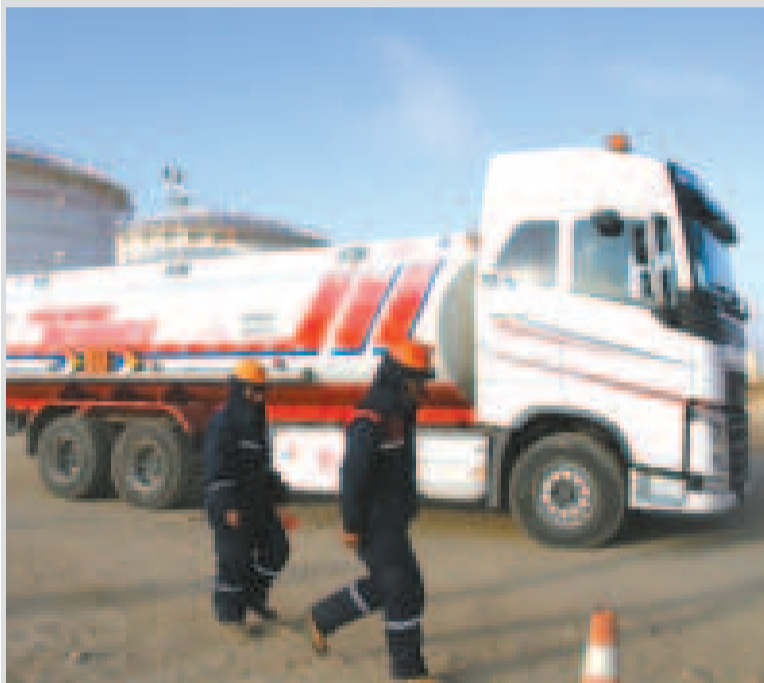
Despacho de carburantes para La Paz.