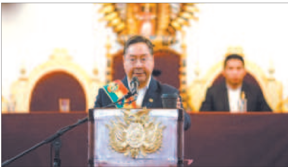
El presidente Luis Arce en la Sesión de Honor en Sucre.

"Estamos en un momento de análisis constitucional entre el Ejecutivo, el TSJ (Tribunal Supremo de Justicia) y el TCP. El Presidente anunció el referendo porque está facultado para convocarlo con las reglas de juego actuales, pero queremos cualificarlo, mejorar el proceso, y si la Asamblea Legislativa quiere participar, está invitada, lo que no vamos a permi-