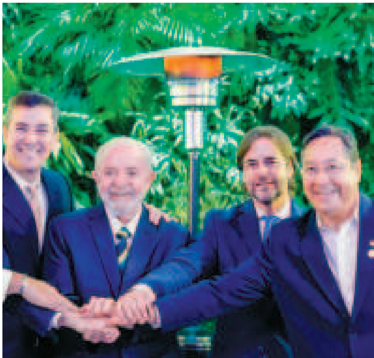
Los presidentes Santiago Peña, Lula da Silva, Luis Lacalle y Luis Arce.