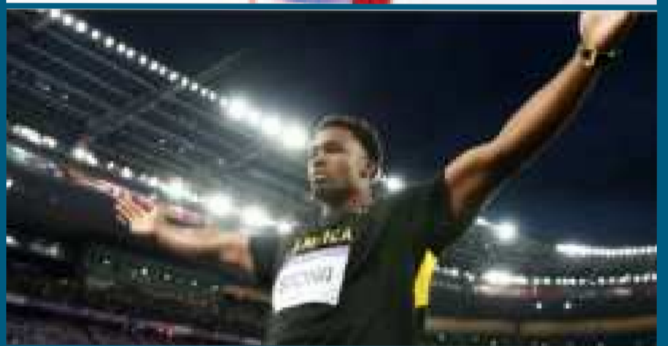
El estadounidense Hall y el jamaicano Stona enloquecieron a los aficionados en el Stade de France