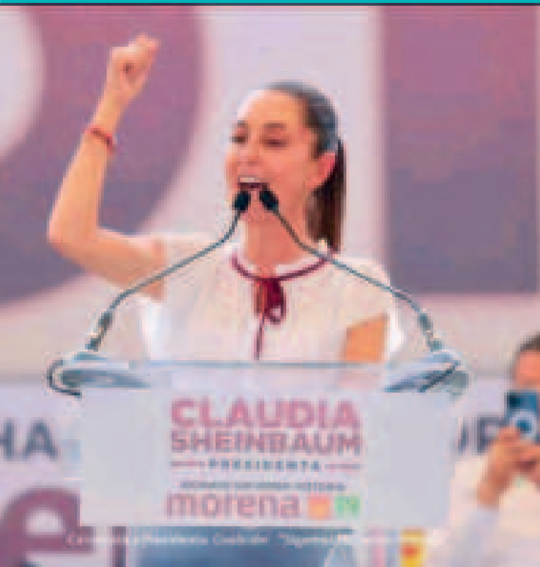
La presidenta electa de México, Claudia Sheinbaum.