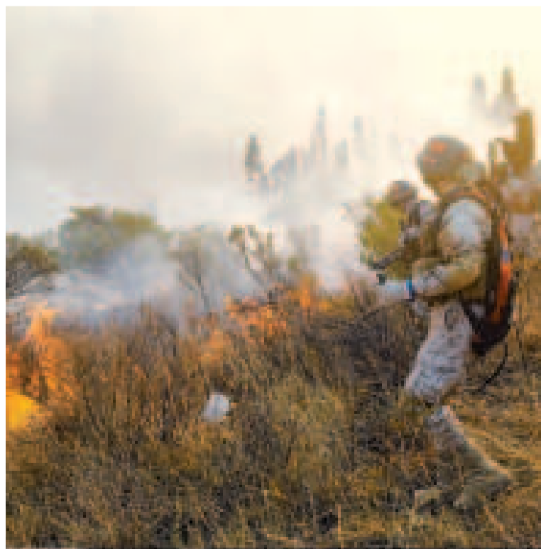
Bomberos forestales del Ejército en tareas de sofocación.

fueron movilizados en los municipios afectados por los siniestros.