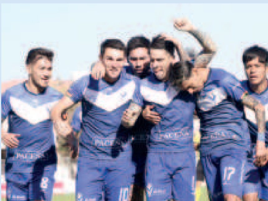
Jugadores de Gualberto Villarroel San José festejan el empate en condición de visitante.