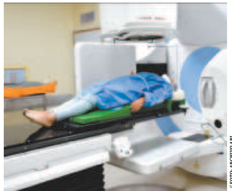
El Centro de Medicina Nuclear y Radioterapia en la ciudad de El Alto.

“Esto nos permite decir que va a ser un trabajo no solamente internacional, no solamente de expertos externos que vienen, miran y dicen lo que se puede hacer; es realmente un trabajo de discusión, de trabajo conjun-