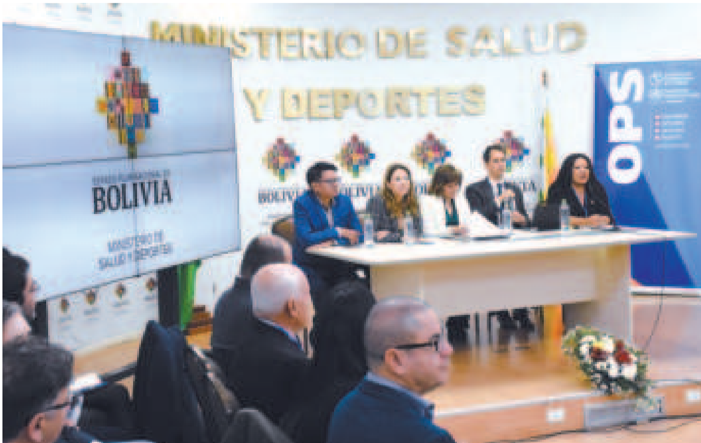
Lanzamiento de la evaluación imPACT, con representantes de las entidades nacionales e internacionales.