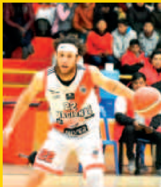
El equipo potosino de Nacional Potosí se prepara para festejar.

El quinteto de Nacional Potosí buscará hoy su segundo título de la de la Liga Boliviana de Básquetbol (Libobásquet) masculina frente al plantel de Básquet Tarija, en el tercer partido de definición del campeonato que se disputará esta noche en el coliseo Guadalquivir de Tarija desde las 20.30.