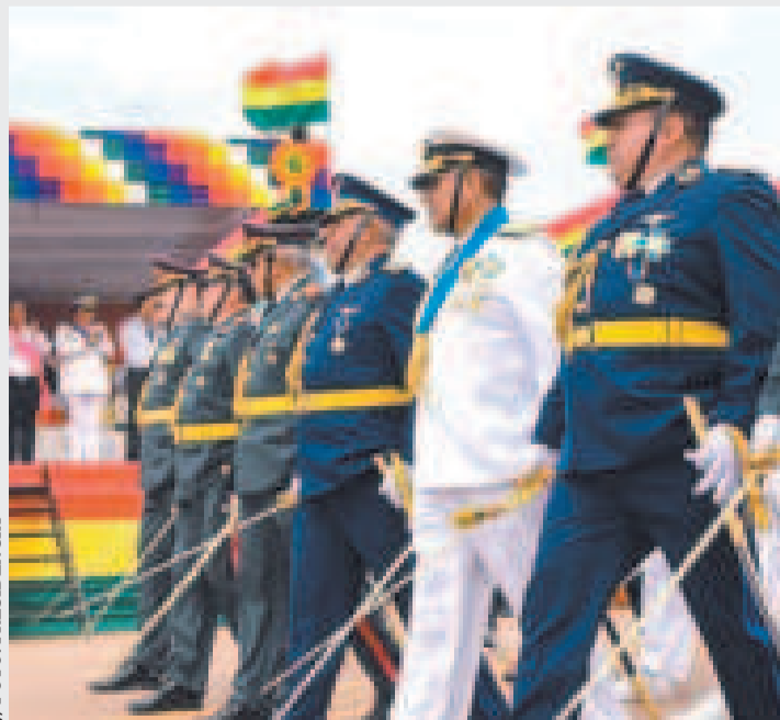
Jefes militares desfilan por el 199 aniversario de las Fuerzas Armadas (FFAA) de Bolivia.

Hoy, dijo, son una fuerza versátil y comprometida con el bienestar del pueblo y que, en este siglo, seguirá trabajando incansablemente para construir una Bolivia más justa, próspera y soberana.