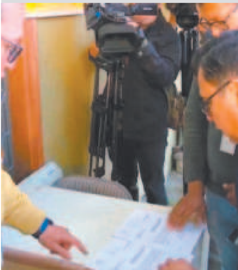
Entrega de la lista de candidatos judiciales al TSE.