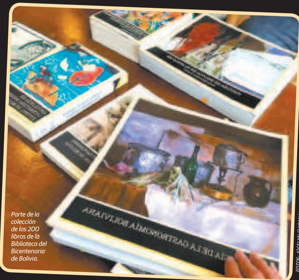
Parte de la colección de los 200 libros de la Biblioteca del Bicentenario de Bolivia.

Finalmente, invitó a la comunidad lectora a participar en las presentaciones del viernes y el sábado en la Feria Internacional del Libro de La Paz. Los interesados pueden acceder a más información en el espacio 28 de esta feria.