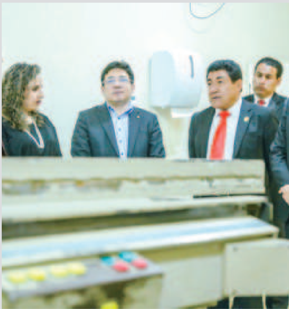
Los ministros de Salud (Izq.) y de Hidrocarburos (Cen.), además de autoridades del Instituto Nacional de Cancerología, durante la entrega.