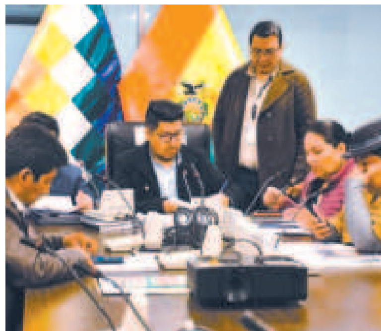
La Comisión de Planificación en sesión.

El dirigente remarcó que la Asamblea debe estar acorde con el contexto actual de la economía.