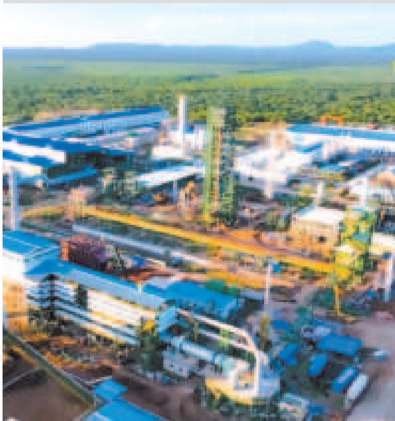
Parte del complejo siderúrgico del Mutún, en Puerto Suárez, Santa Cruz.