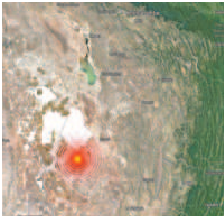
Pantalla del monitoreo del sismo registrado en Potosí y Tarija.