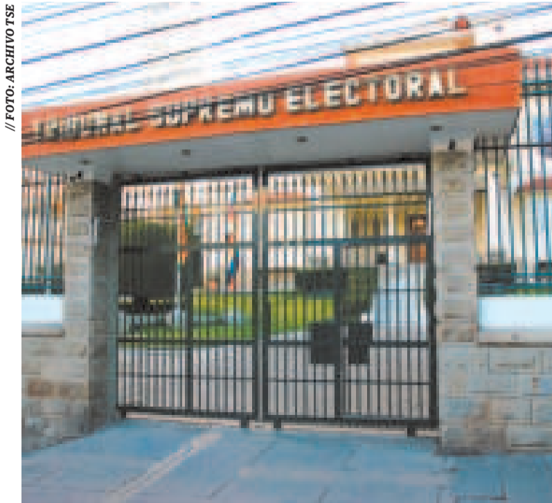
Frontis del TSE.