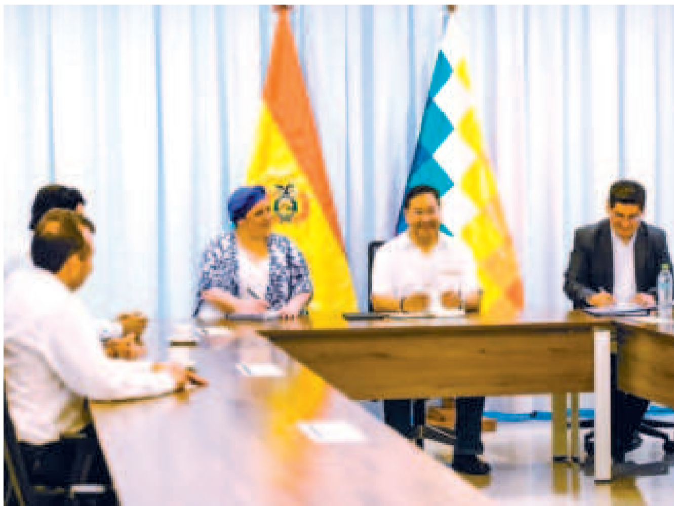
El presidente Luis Arce junto a ministros y representantes del sector privado de Santa Cruz, en un anterior encuentro.

La Cámara Nacional de Comercio y el Instituto Boliviano de Comercio Exterior anticiparon que participarán en el encuentro con el jefe de Estado Luis Arce.