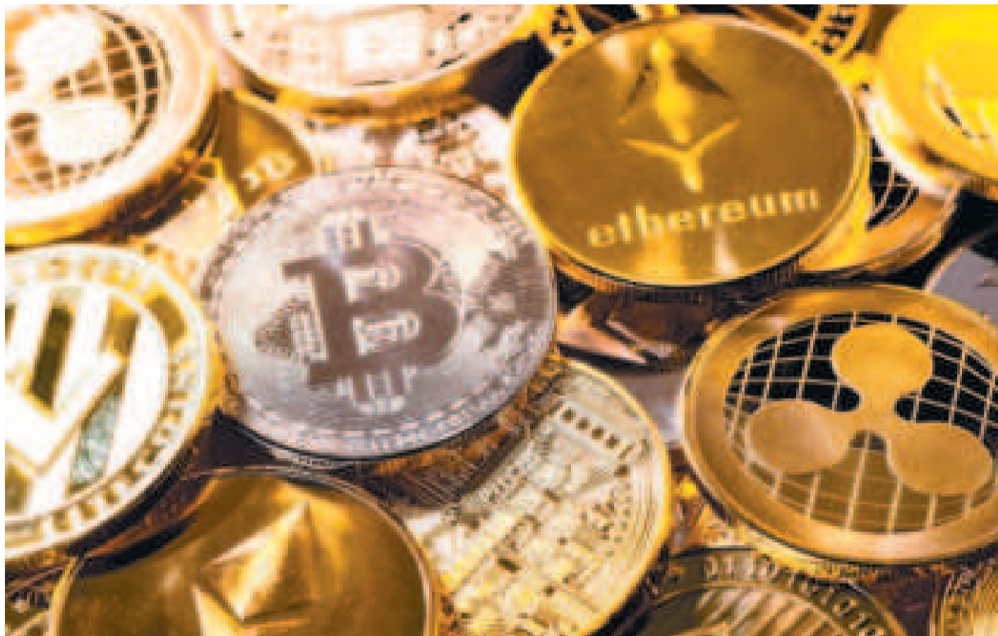
Representación de las monedas digitales.