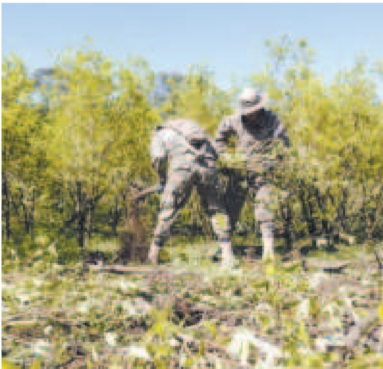
Efectivos de la FTC erradican cultivos de hoja de coca excedentarios.