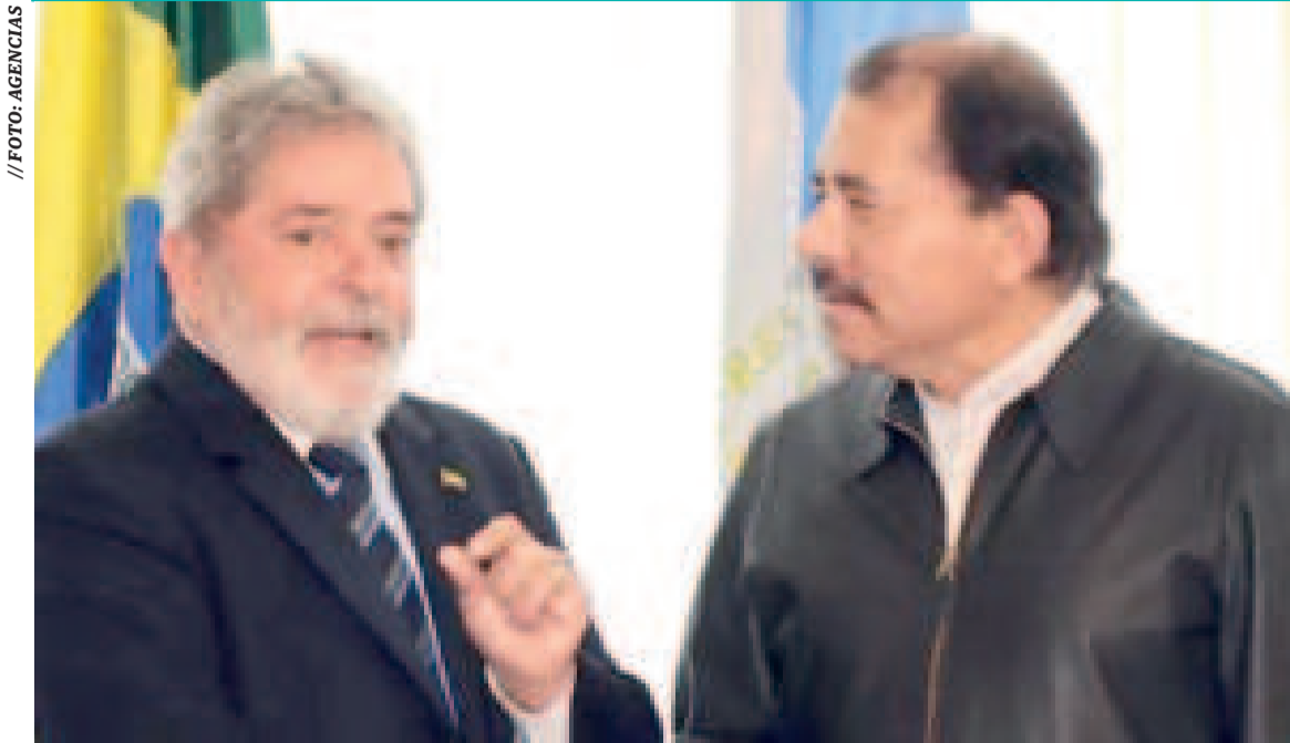
Los presidentes Lula y Daniel Ortega.