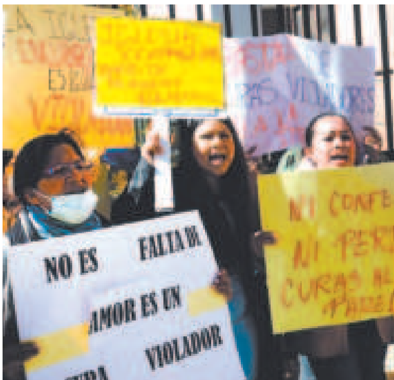
Protesta con pancartas contra jesuitas en el caso de pederastia.