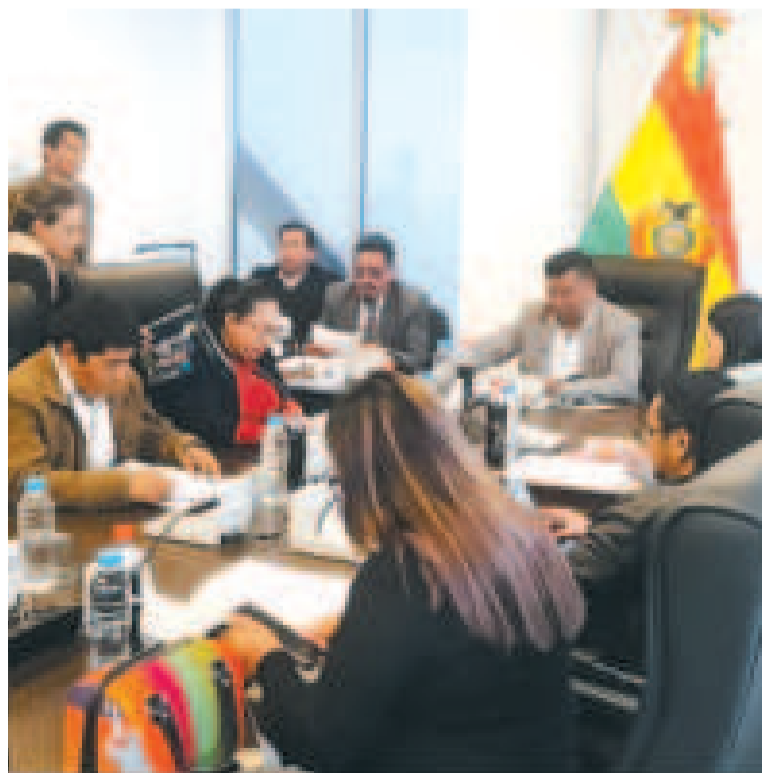
Sesión de la Comisión de Justicia Plural de la Cámara Baja.

DÍAS tendrá como plazo la presentación de postulaciones para fiscal general del Estado.