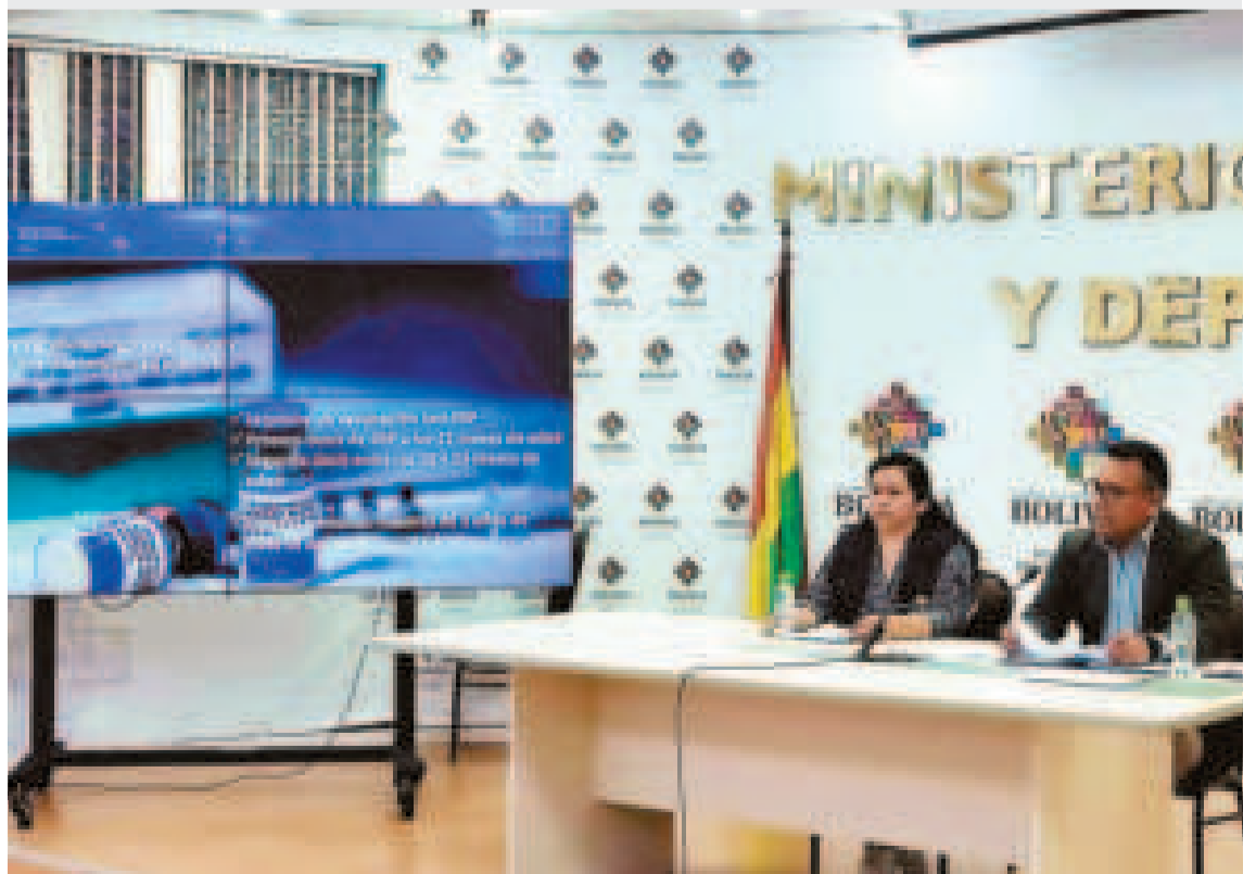
Autoridades del Ministerio de Salud y Deportes en conferencia de prensa, ayer.