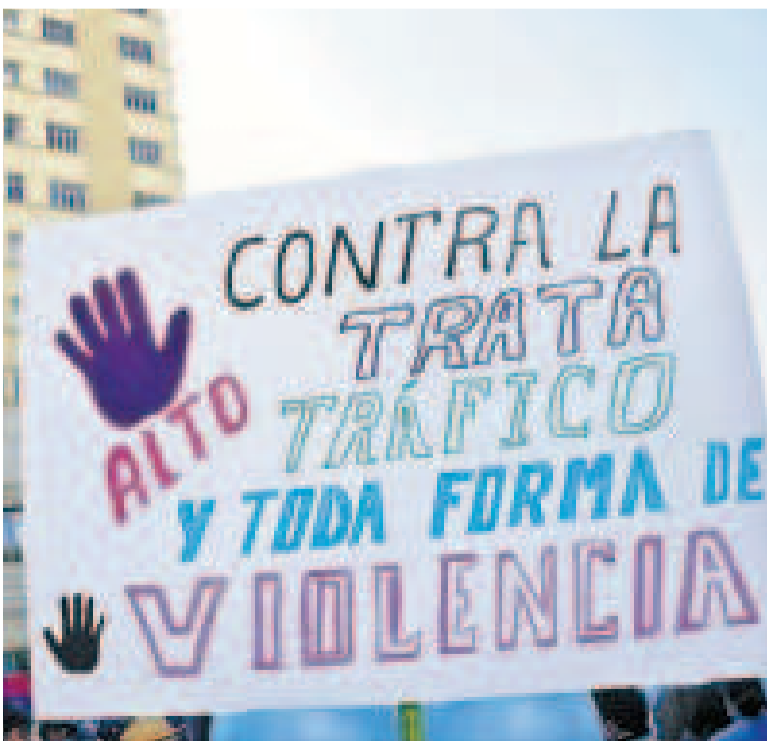
Una protesta contra la trata y tráfico de personas en La Paz.