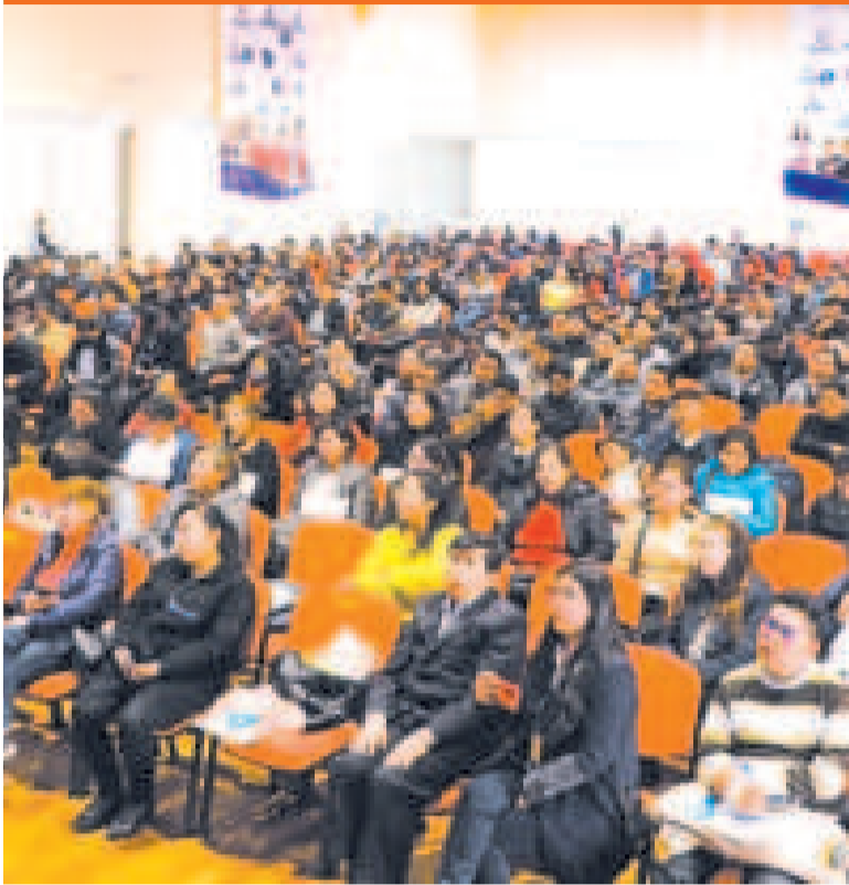
Más de 600 participantes en el taller organizado en el Ministerio de Educación.