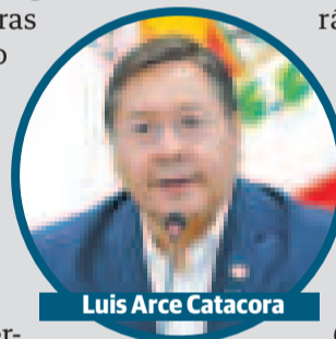
Luis Arce Catacora

“Estamos consolidando uno de los proyectos estratégicos más importantes en la historia de #Bolivia”, posteó.