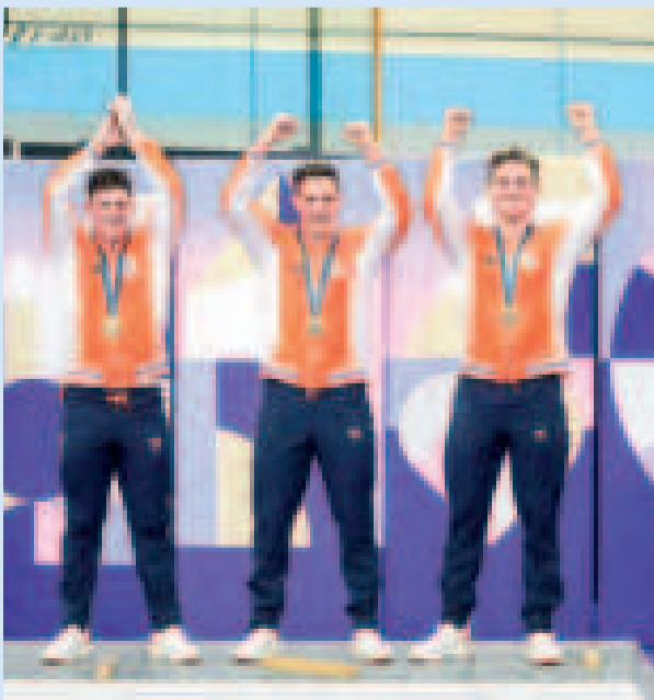
Equipo de Países Bajos de ciclismo.

El velódromo de Saint Quentin-Yvelines, en la periferia parisina, parece no tener remilgos en permitir el vuelo de los pedalistas en las competiciones. Lavreysen ya disfrutó de dos récords del orbe con sus compañeros Roy van den Berg y Jeffrey Hoogland, que batieron dos veces su propio récord mundial de velocidad masculina.