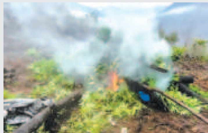
Marihuana incinerada por efectivos de la FELCN.

Luego de un exhaustivo análisis de información, la Fuerza Especial de Lucha Contra el Narcotráfico (FELCN) incineró seis toneladas (t) de marihuana y capturó a tres colombianos en el municipio de Cocapata, en el departamento de Potosí.