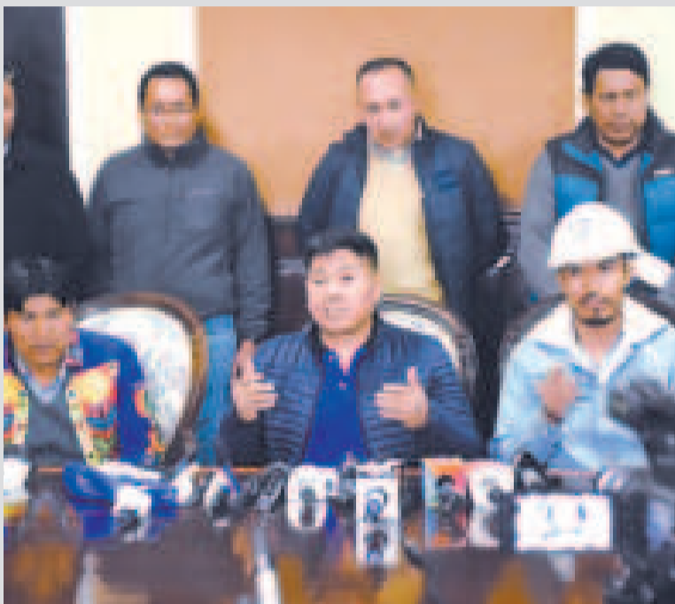
El presidente de la Dirección Nacional del MAS-IPSP, Grover García.