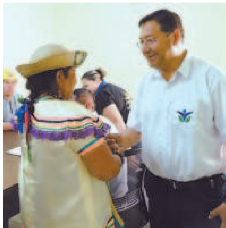
El presidente Arce con una mujer de un pueblo indígena de Beni.

habitan Bolivia y están en los valles, altiplano, chaco, el oriente y la amazonia.