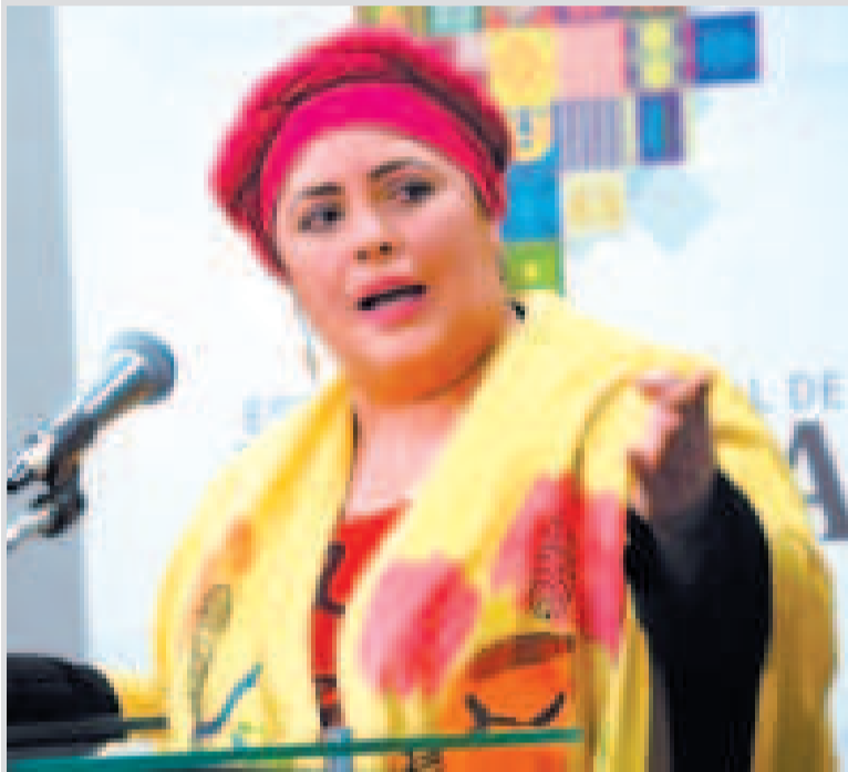
La ministra de la Presidencia, María Nela Prada.

El ministro de Justicia, Iván Lima, aseguró que el Presidente cumplirá con el mandato del pueblo. Reiteró la importancia de dar una salida constitucional a los conflictos en el país.