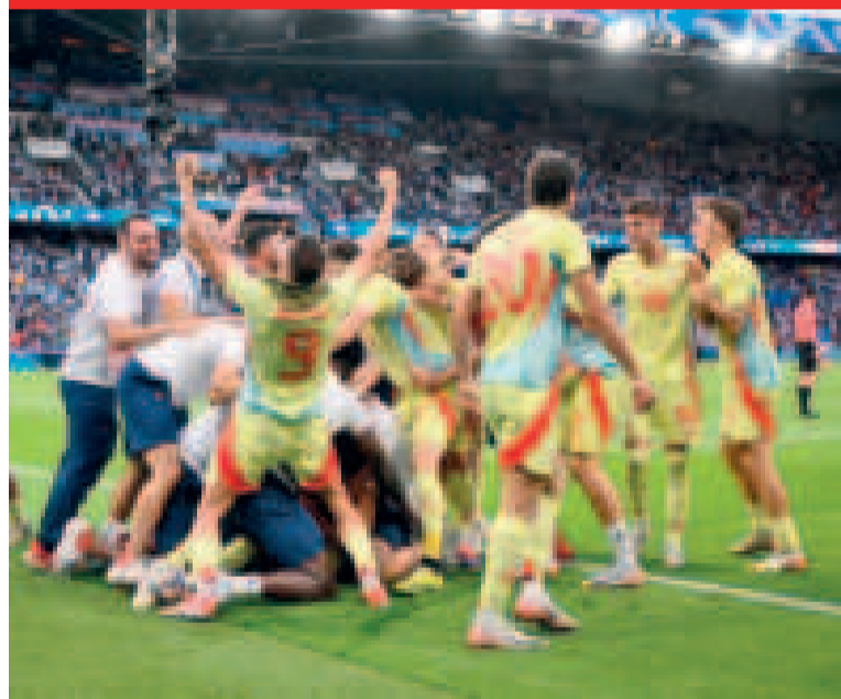
Seleccionados españoles de fútbol celebran la conquista del oro olímpico.

Aupados por su público, los franceses salieron a presionar y buscar una temprana ventaja en el marcador. Y lo lograron.