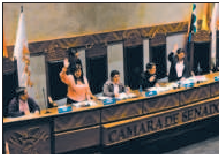
Testera del Senado, donde está el titular de esta Cámara, Andrónico Rodríguez.