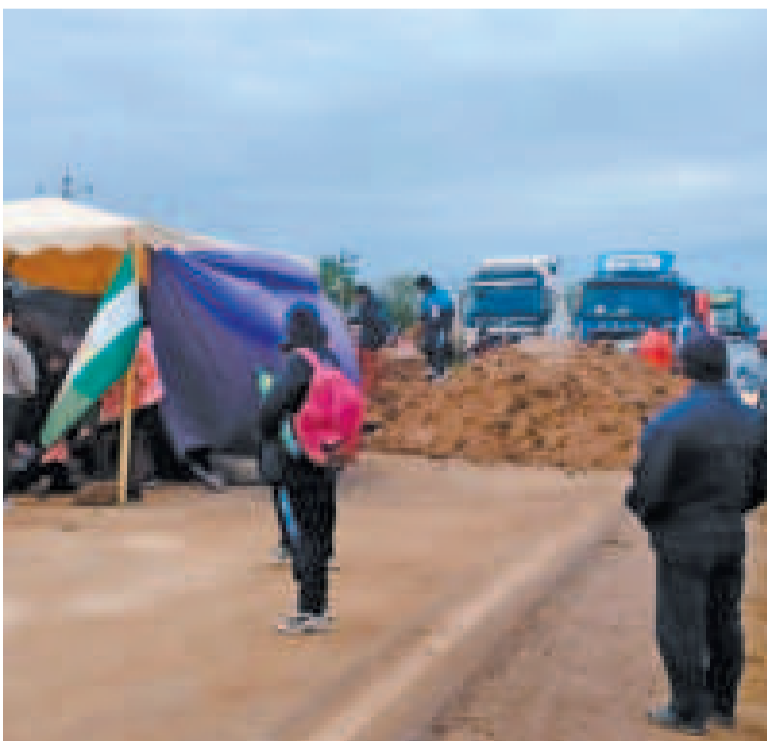
El bloqueo que persiste en San Julián, Santa Cruz.