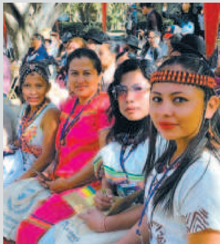
Parte de las representantes de los pueblos indígenas que acudieron a la cumbre.

Un segmento llamativo en el desarrollo de esta cumbre fue la preparación de recetas locales. Por primera vez en el país se reunieron más de 35 cocineras y cocineros indígenas de varios departamentos, quienes trajeron consigo ingredientes típicos de sus regiones que prepararon en cocinas al aire libre. Los sabores y aromas de los territorios fueron elementos que llamaron la atención y sorprendieron positivamente tanto a chefs visitantes como a los participantes en general.