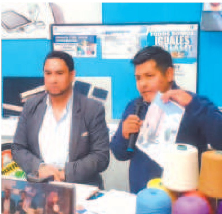
El viceministro de Políticas de Industrialización, Luis Siles (izq.), en conferencia de prensa.