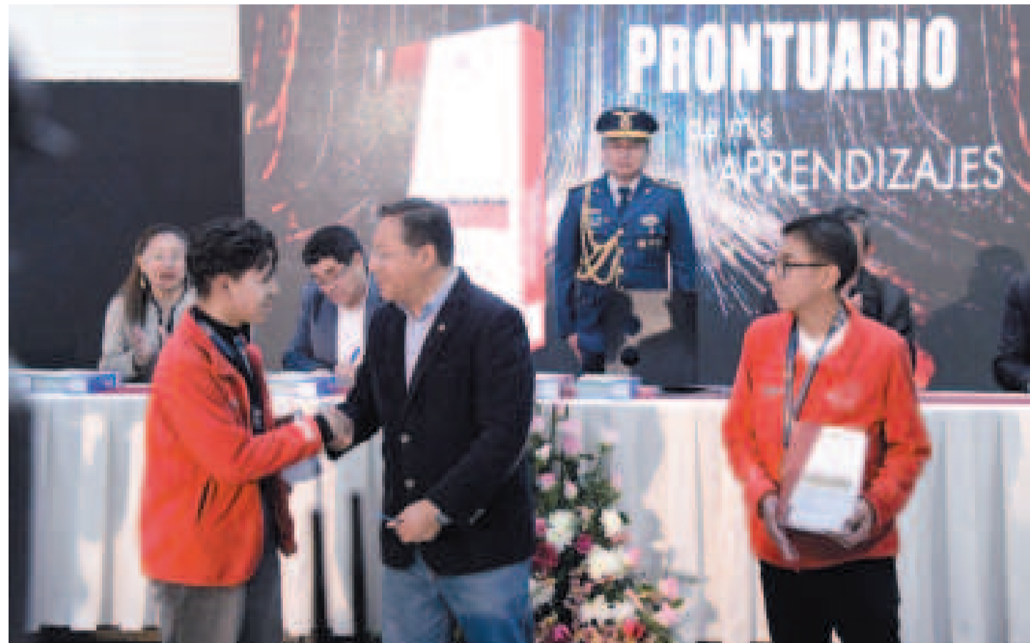
El presidente Luis Arce durante su intervención en la presentación del 'Prontuario de mis aprendizajes', en el campo ferial Chuquiago Marka.

El ministro de Educación, Omar Véliz Ramos, a su turno, resaltó que el prontuario será una estrategia metodológica para maestros y maestras para su planificación anual y la