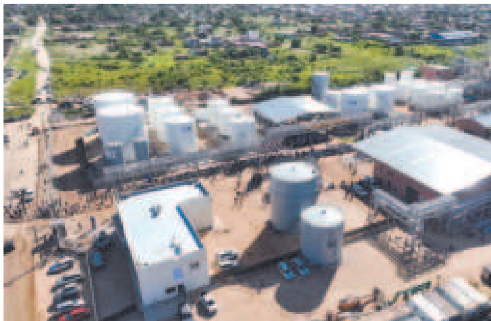
Planta de Biodiésel, en Santa Cruz.

“No hay que tener miedo de las decisiones que se tomen de manera conjunta con el pueblo. No hay nada más democrático que justamente realizar este tipo de consultas sobre temas de interés nacional y no como pasó en 2010, cuando el gobierno de Evo Morales lanzó un gasolinazo que generó una movilización nacional, que luego fue derogado”, recordó en entrevista con Bolivia TV.