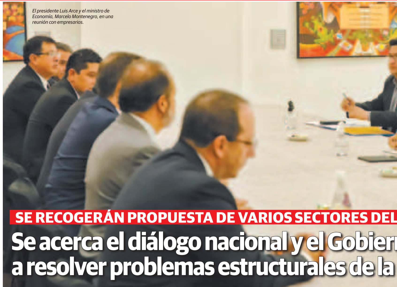
El presidente Luis Arce y el ministro de Economía, Marcelo Montenegro, en una reunión con empresarios.

Prada explicó que el mensaje presidencial del 6 de agosto y las medidas que anunció el Jefe de Estado van en la línea del Plan de Desarrollo Econó-