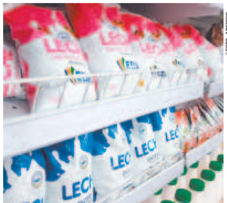
Leche fluida, bebidas lácteas, yogurt bebible y leche saborizada son los productos regulados.

Esta normativa, emanada de los ministerios de Desarrollo Rural y Tierras y de Desarrollo Productivo y Economía Plural, fija el precio para el consumidor final. La leche fluida tiene un costo mínimo de Bs 5,80 hasta Bs 6; bebidas lácteas en presentaciones de 120 ml, de Bs 0,45 a Bs 0,50; yogurt bebible en presentaciones de 80 ml y 90 ml, de Bs 0,45 a Bs 0,50; y leche saborizada en bolsa de 140 ml, de Bs 0,90 a Bs 1,00.