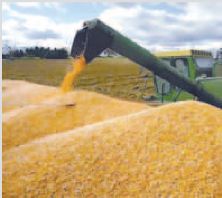
Producción agrícola en Santa Cruz.