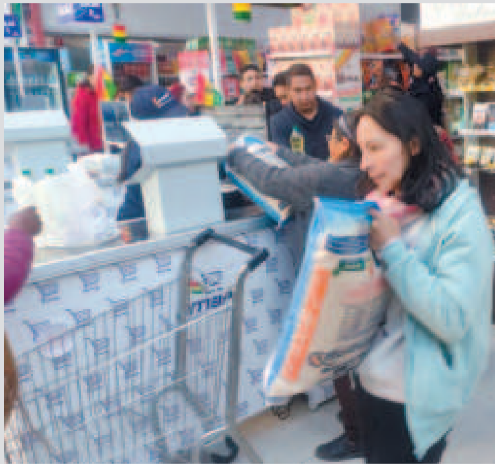
La población opta por comprar en Emapa porque ofrece precios justos.

El gerente anunció que se impulsarán las ferias móviles de Emapa para llegar a los barrios más alejados del país.