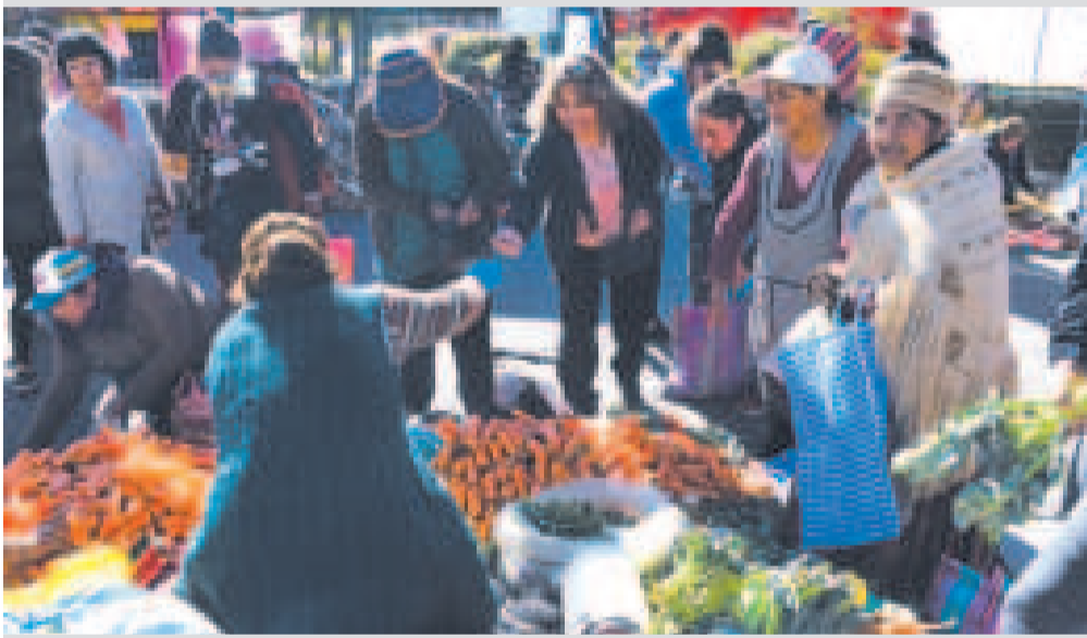
Las ferias del precio y peso justo llegarán a zonas alejadas.