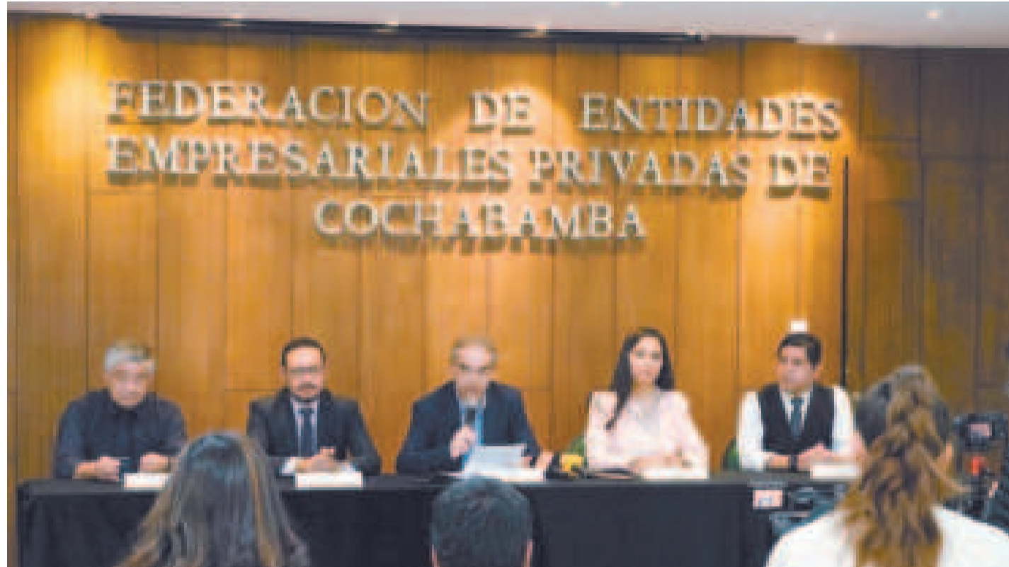
La directiva de la Federación de Empresarios Privados de Cochabamba.

La tercera propuesta es analizar e implementar medidas que impulsen el crecimiento de las exportaciones como fuente principal de divisas para el país, incluyendo aper-