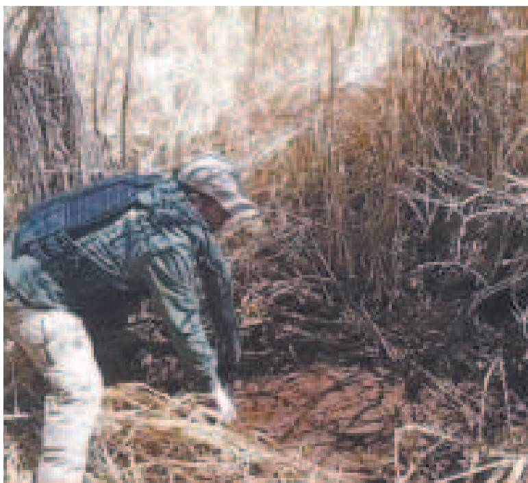
Personal de la FELCC en el sitio donde fue encontrado el cuerpo de la menor.