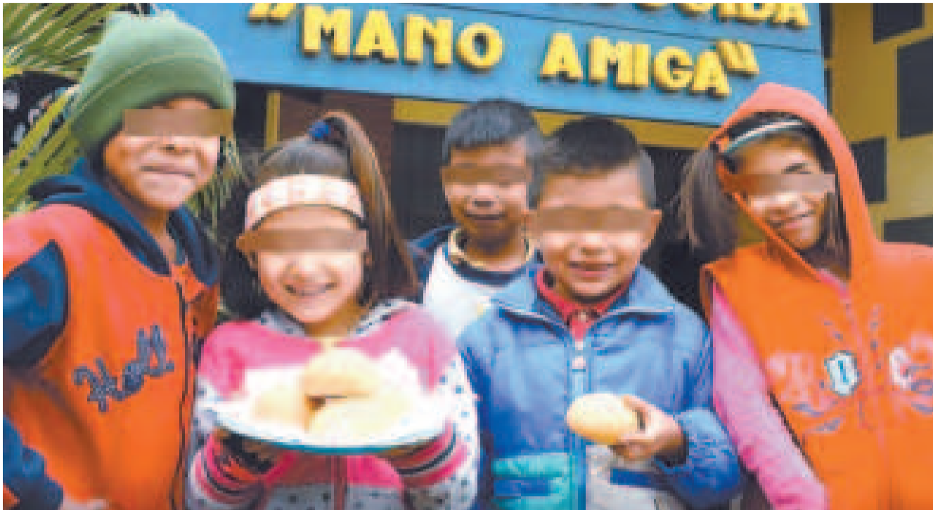
Niños de una casa de acogida en Santa Cruz de la Sierra.