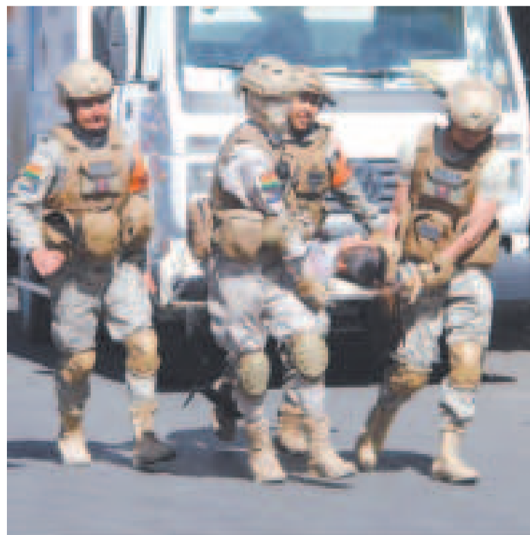
Equipos de emergencia en el simulacro trasladan a una persona herida a una zona segura.

DE LA MAÑANA del domingo, aproximadamente, comenzó el simulacro con activación de alarmas en la OTB Recoleta.