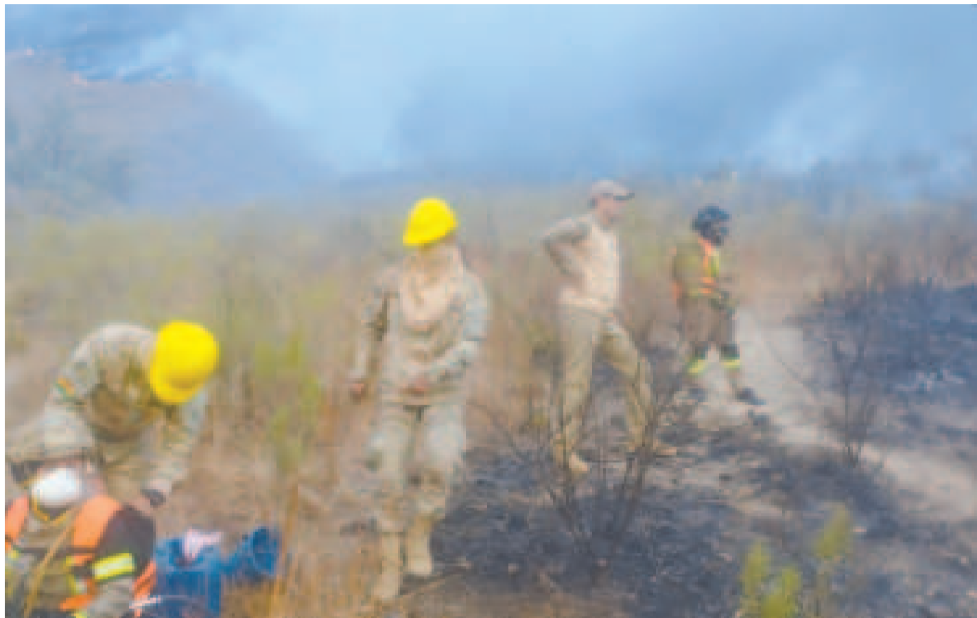
Bomberos forestales luego de sofocar un incendio en Santa Cruz.

Dos carros bomberos fueron utilizados para luchar contra las llamas y se incorporaron tres equipos de drones (vehículos no tripulados), sobre todo para vigilancia. Cuatro helicópteros se sumaron al combate contra los incendios, con los cuales se ejecutaron 312 descargas de agua en zonas con quemaduras, para ello se utilizaron 283.220 litros de agua.