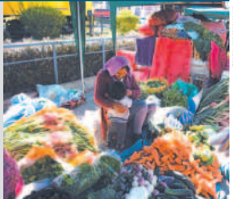
Una diversidad de productos se comercializa en las ferias.

“Vamos a estar llevando estas ferias continuamente. El miércoles llegamos a Oruro, el jueves estamos en Potosí y el viernes llegaremos hasta Sucre, en Chuquisaca. En