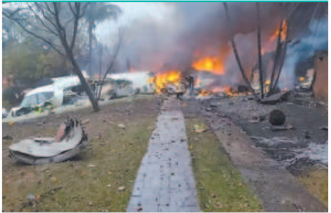
El avión siniestrado el viernes en la ciudad de Vinhedo, en Sao Paulo.