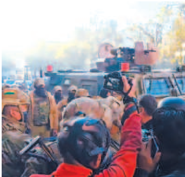
Militares toman la plaza Murillo con tanquetas, el 26 de junio.