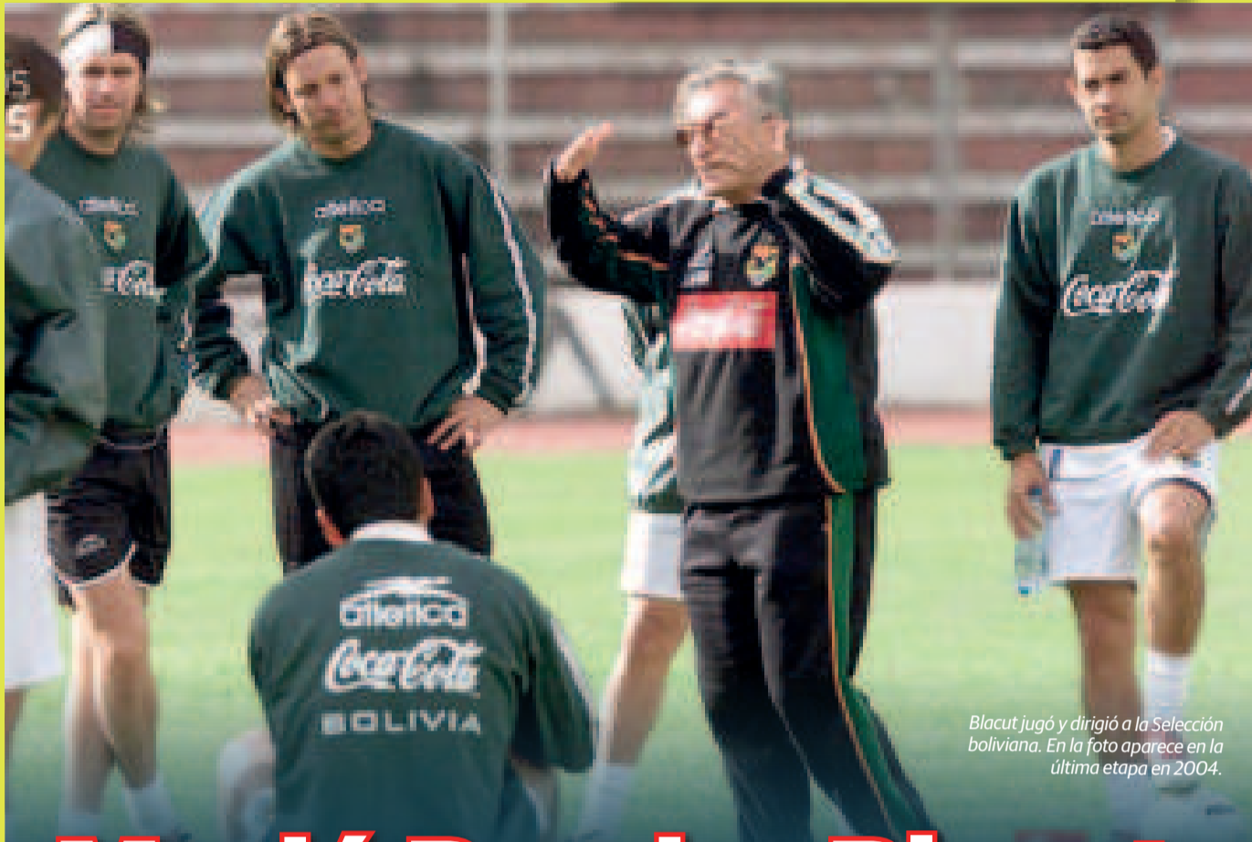
Blacut jugó y dirigió a la Selección boliviana. En la foto aparece en la última etapa en 2004.