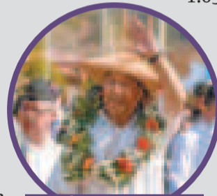
Luis Arce Catacora

construcción de la línea eléctrica de 69 kilovoltios, la inauguración de 205 viviendas dignas, enlosetados y un sistema de riego figuran entre las obras entregadas.