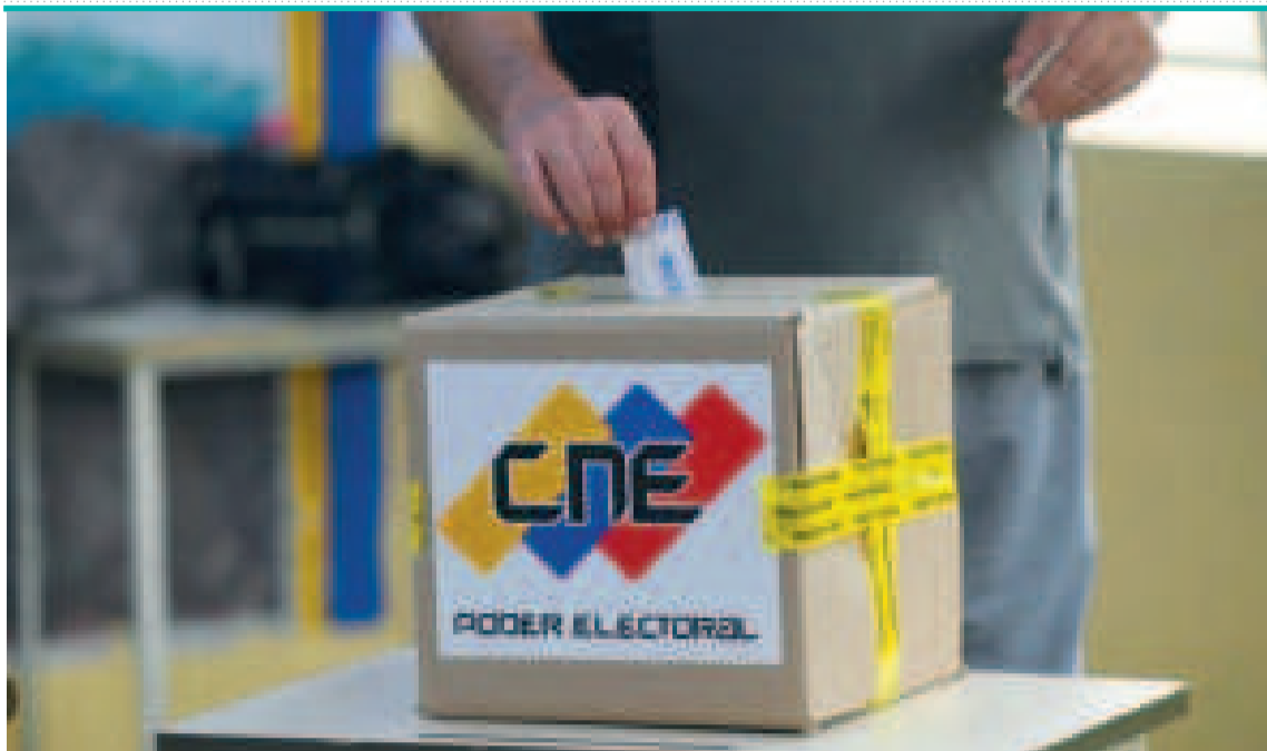
Las elecciones en Venezuela se desarrollaron el 28 de julio de 2024.