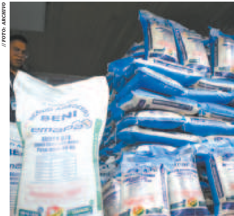
Sacos de arroz de la estatal Emapa.

Flores destacó que el Co- mité de Seguridad Alimenta- ria también es otra instancia que vela por el abastecimiento de productos de la canasta fa- miliar mediante operativos de control de precios de produc- tos agropecuarios, huevo, acei- te, pollo, entre otros, en merca- dos de abasto de las ciudades del país. “El Comité está con- formado por muchos ministe- rios y está haciendo el control de precios, operativos en las fronteras y otras acciones”.