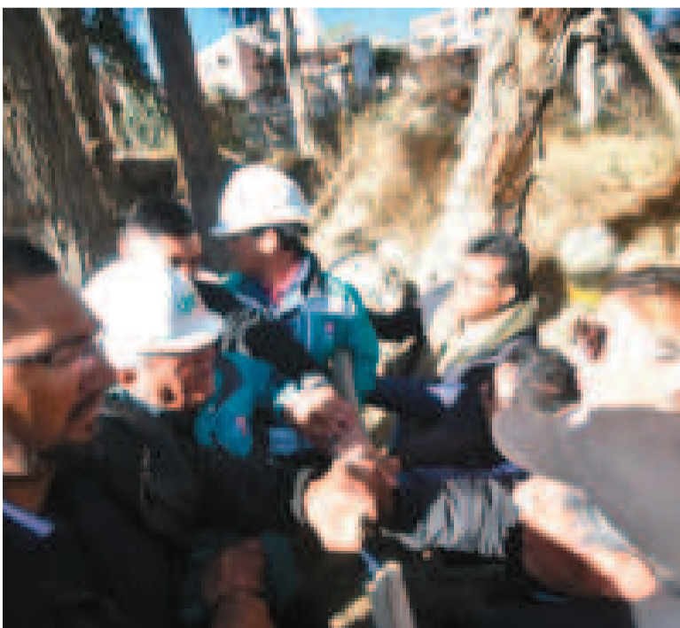
Vecinos impiden el paso del alcalde Arias al sector de Rosasani.