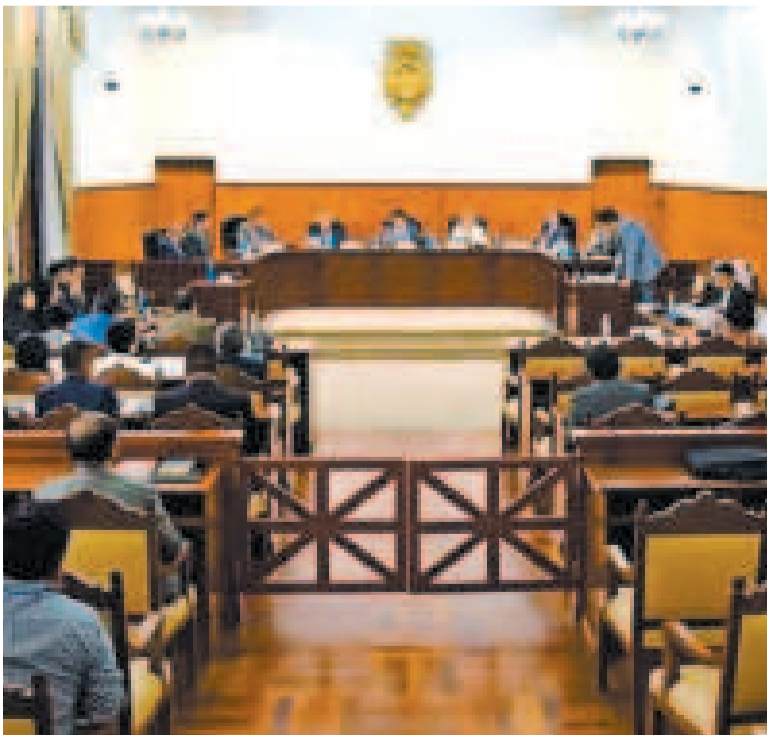
Juicio oral en el caso denominado Petrocontratos, en la ciudad de Sucre.