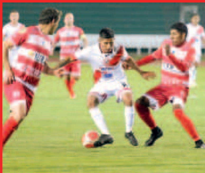
Una incidencia del cotejo que igualaron a tres goles Independiente y Nacional Potosí.