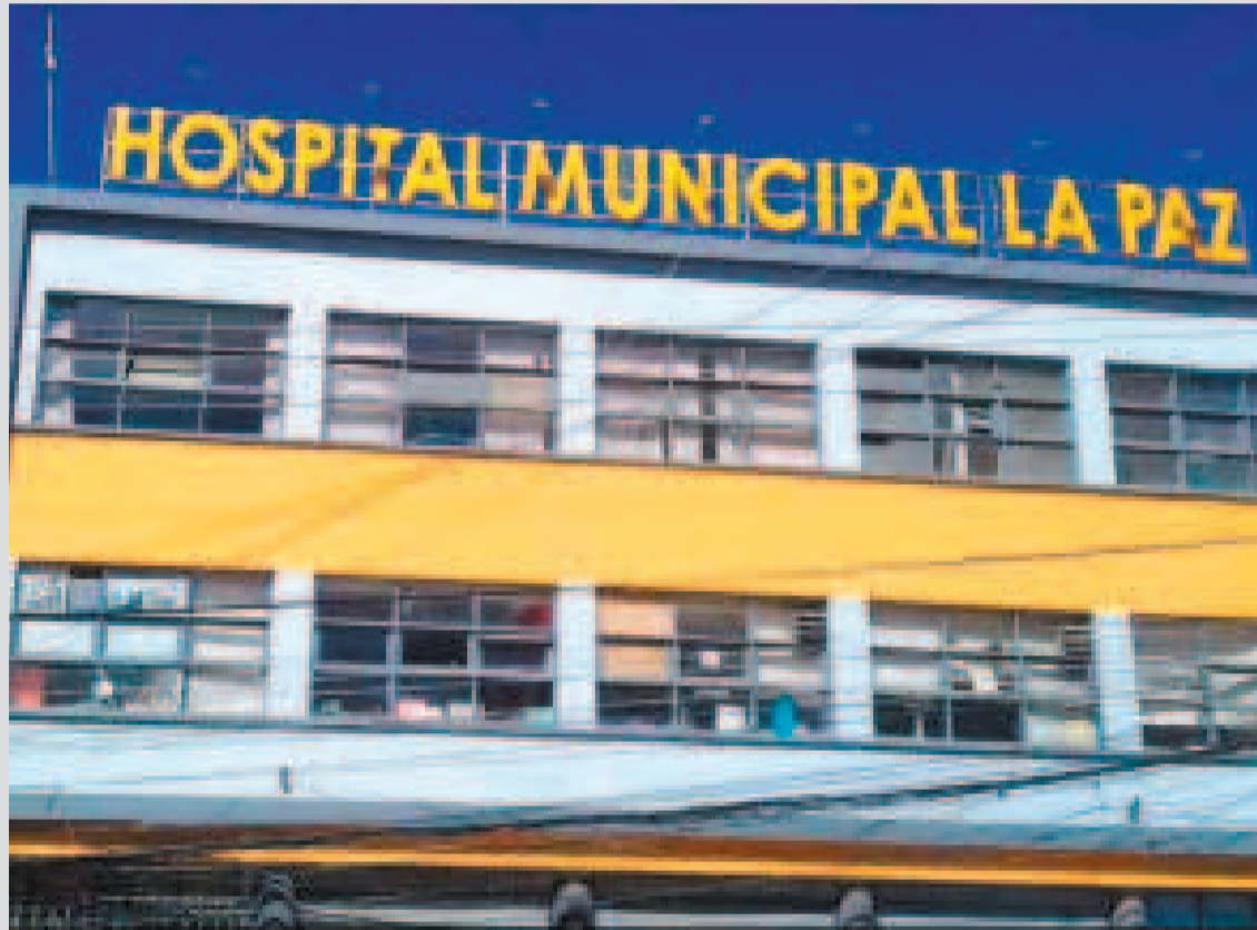
El hospital La Paz, que está bajo la administración de la Alcaldía de La Paz.

tuición para destituir o tomar acciones en el caso. “Nosotros, en el marco de los requisitos que establece la Ley 974, hemos remitido la denuncia a la instancia com-