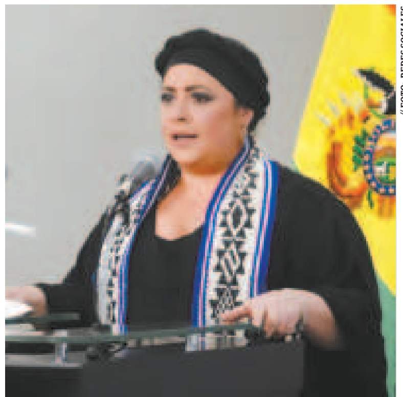
La ministra de la Presidencia, María Nela Prada.

DE AGOSTO es la fecha establecida para llevar adelante el diálogo económico y productivo en La Paz.