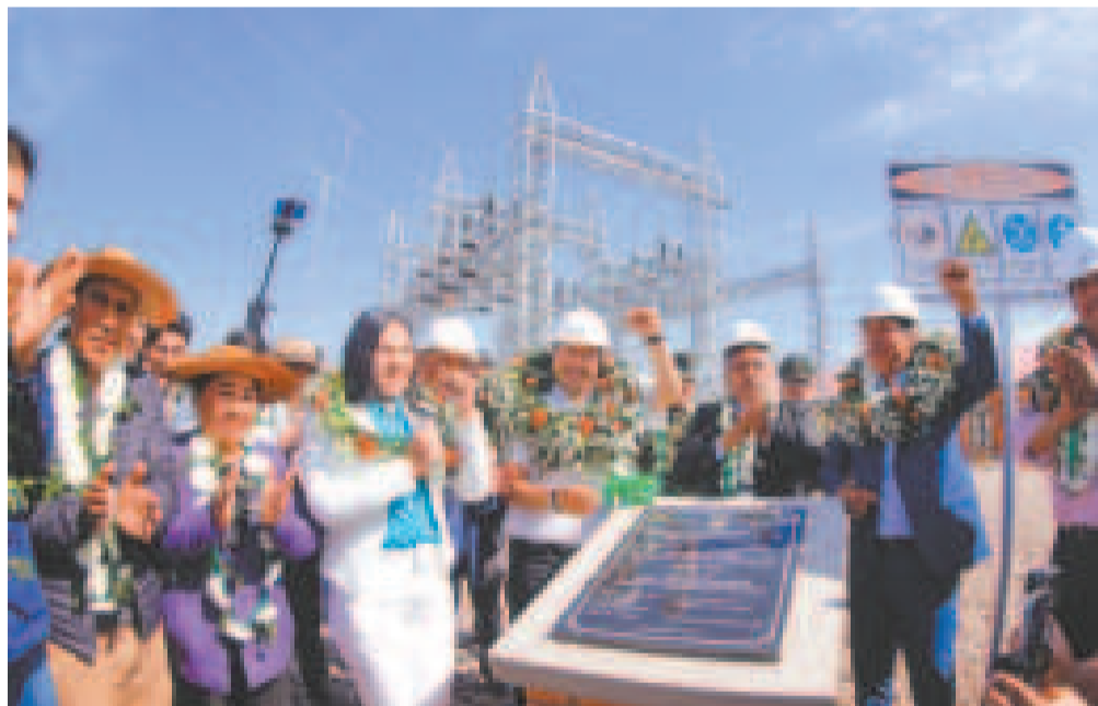
Presidente Arce entrega la construcción de la línea eléctrica de 69 kW Yaguacua-Caraparí.