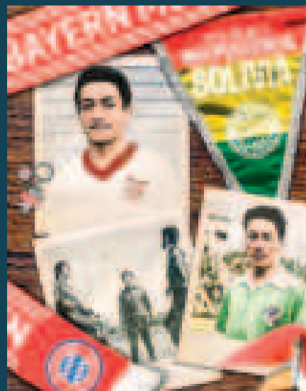
El mensaje del club Bayern Múnich en ocasión del 199 aniversario de la independencia de Bolivia.

dos años después fichó por el club Ferrocarril Oeste de la primera división del fútbol argentino, club en el que destacó y le valió el traspaso al club Bayern Múnich de Alemania (1965), que todavía no formaba parte de la Bundesliga, ascendió y estuvo vinculado hasta 1971, año en el que volvió a Bolívar, dos años más tarde emigró a Perú, donde jugó en Melgar de Arequipa, y retornó al país para defender la camiseta de The Strongest, donde cerró su carrera futbolística en medio de grandes logros.