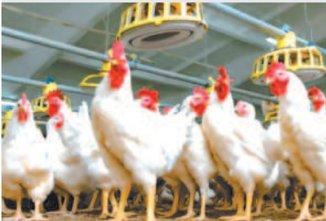
Pollos de una granja avícola.

Como ejemplo, afirma el periodista, está lo ocurrido en mayo de este año, cuando la Asociación de Naciones del Sudeste Asiático (Asean), una agrupación regional que aglutina a unos 600 millones de habitantes, anunció planes para desdolarizar su comercio transfronterizo y utilizar en su lugar monedas locales.