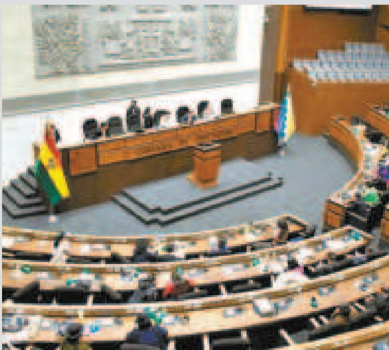
El pleno de la Asamblea Legislativa Plurinacional durante una sesión.