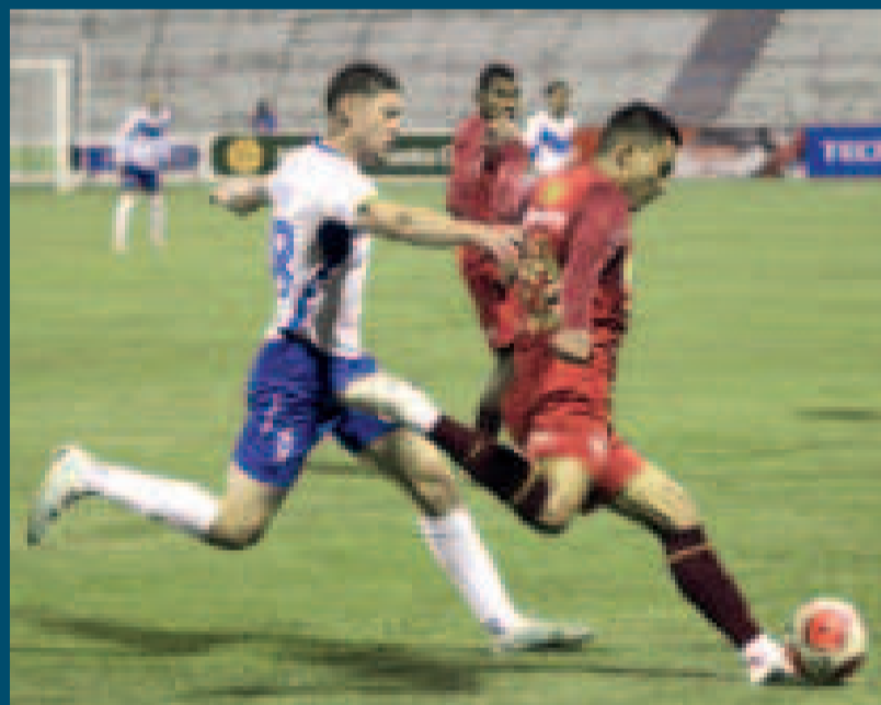
Una escena del encuentro que se disputó en el estadio Jesús Bermúdez, de Oruro.