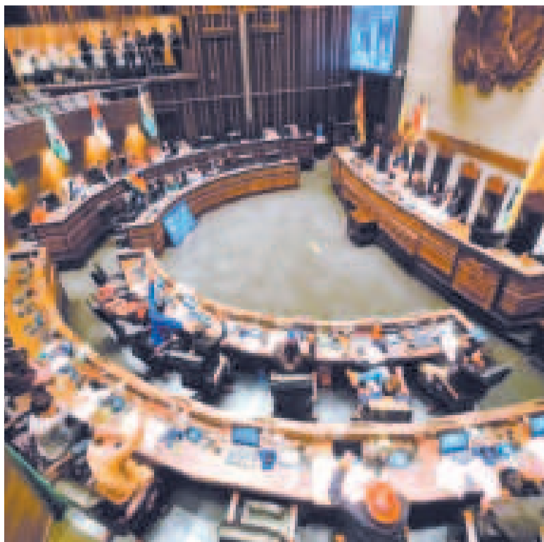
Una sesión en la Cámara de Senadores.

El presidente del Senado dejó en manos de la Comisión de Constitución de la Cámara Alta la inmediatez del tratamiento de la propuesta. “Por reglamento hay 15 días”, dijo.