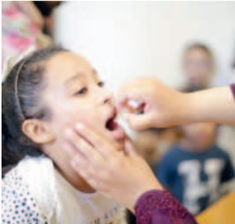
Campaña de vacunación antipolio en Gaza.