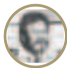
Armando Aquino Huerta

Publicados los resultados –preliminares– del Censo de Población y Vivienda realizado el 23/marzo/2024 por jóvenes, mujeres y hombres patriotas, avalado por el Centro Latinoamericano y Caribeño de Desarrollo (Cede) y otros organismos internacionales, políticos de la derecha fascista y golpista injustificadamente observan y rechazan dichos resultados para manipular y desestabilizar al gobierno constitucional y legítimo de Luis Arce Catacora, diciendo –desde ahora– “Fraude en las elecciones generales del 2025”. Situación que merece el análisis siguiente: