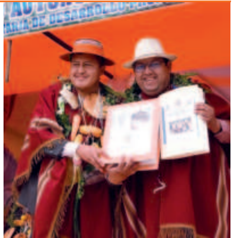
Autoridades durante el acto en Vitichi.

Hay tres etapas para la lactancia materna: la inmediata, que consiste en proporcionar el seno materno en los 60 minutos después de nacido el bebé; la lactancia exclusiva, que se brinda durante los primeros seis meses de vida, siendo el alimento único y primordial para el bebé sin ser necesario ni siquiera agua. Finalmente, la lactancia prolongada, consiste en continuar con la lactancia materna hasta los dos años de vida del bebé, acompañada de la alimentación complementaria, es decir, las papillas de frutas, verduras y/o cereales.