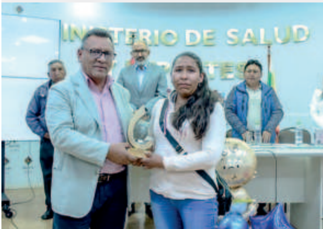
Acto de entrega de reconocimientos.

Finalmente, mencionó que el presidente Luis Arce, a través del Ministerio de Medio Ambiente y Agua, trabaja por su pueblo entregando obras de gran impacto.