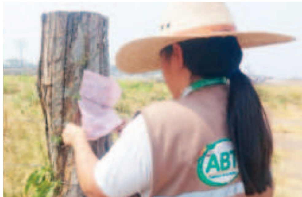
Funcionaria de la ABT coloca un comparendo en una propiedad en Santa Cruz.