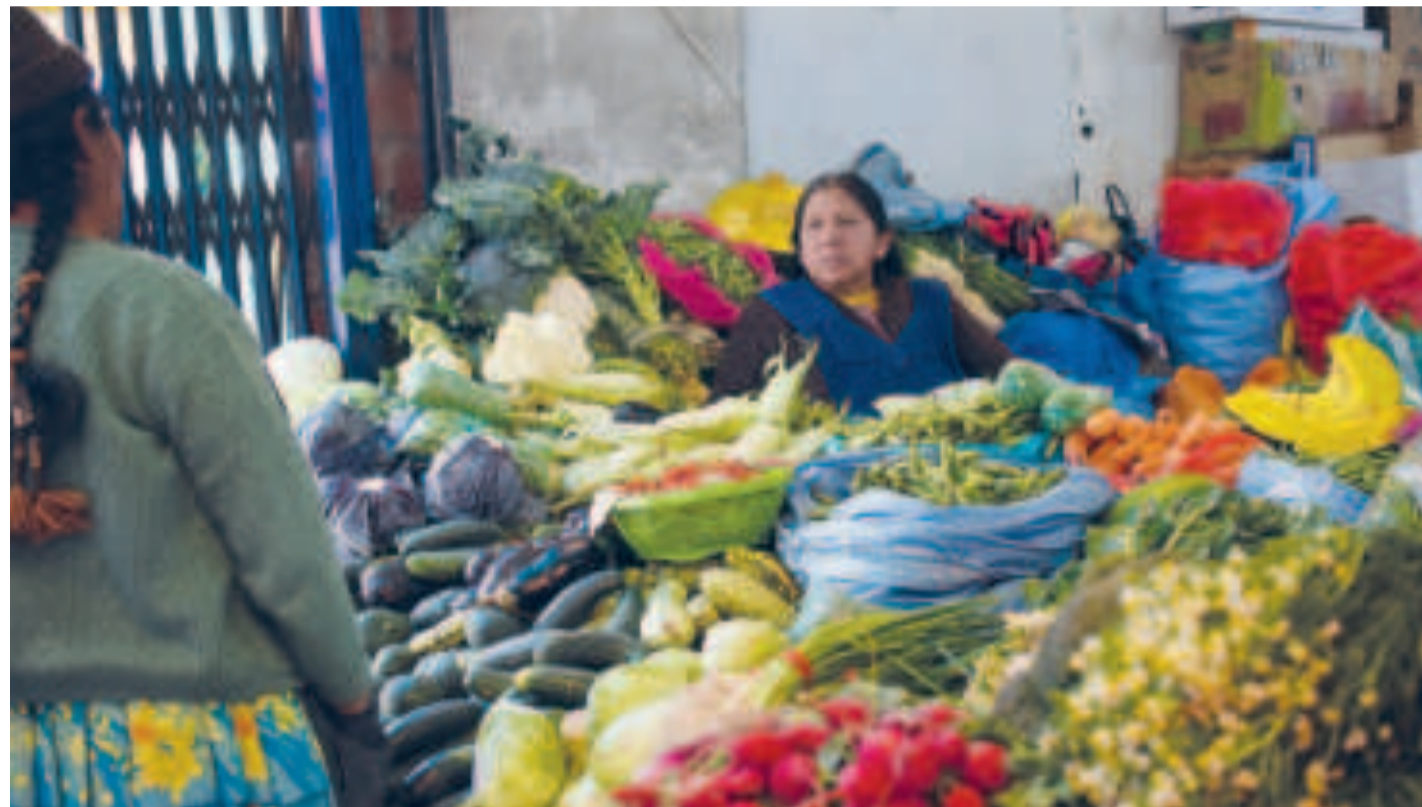
Venta de productos agropecuarios en un mercado popular en la ciudad de La Paz.

Entre los productos que reportan bajada de costos en Pando está la carne de cerdo, papa, yuca, cebolla, zapallo y aceite envasado.