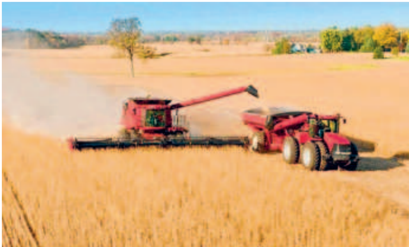
Actividad de cosecha agrícola con maquinaria pesada.