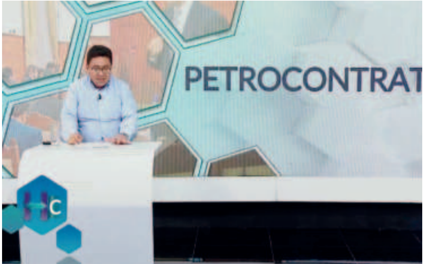
El procurador César Siles en estudios del canal 7, Bolivia TV.