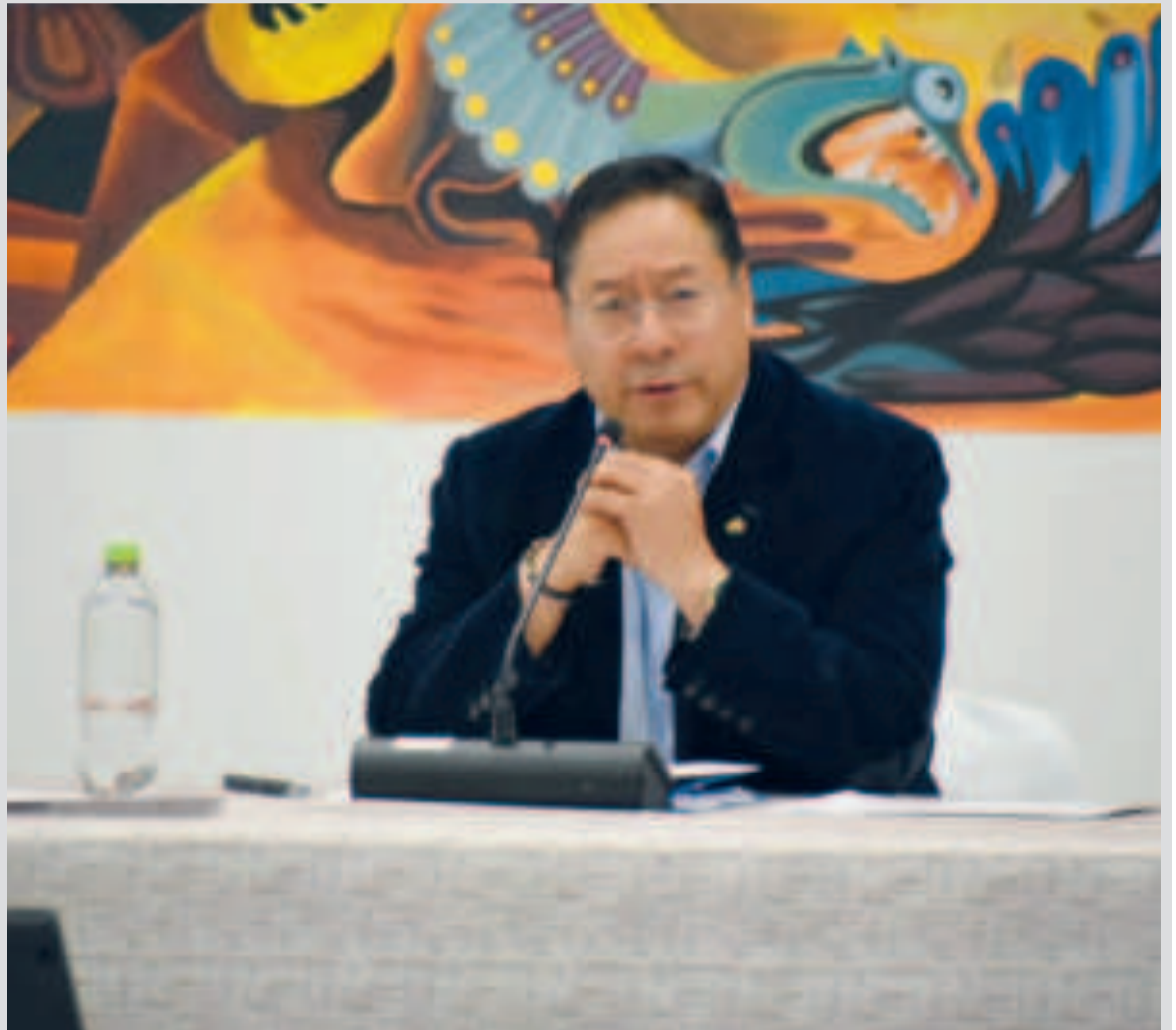
El presidente Luis Arce.

Este año, YPFB completará a más de 40 y se reportan resultados exitosos.