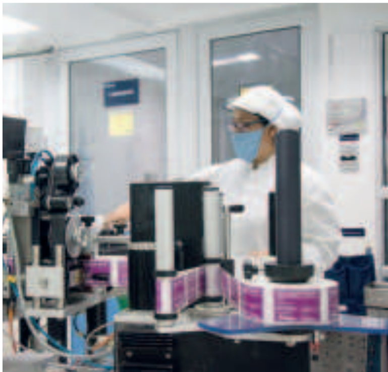
La industria farmacéutica Bagó.