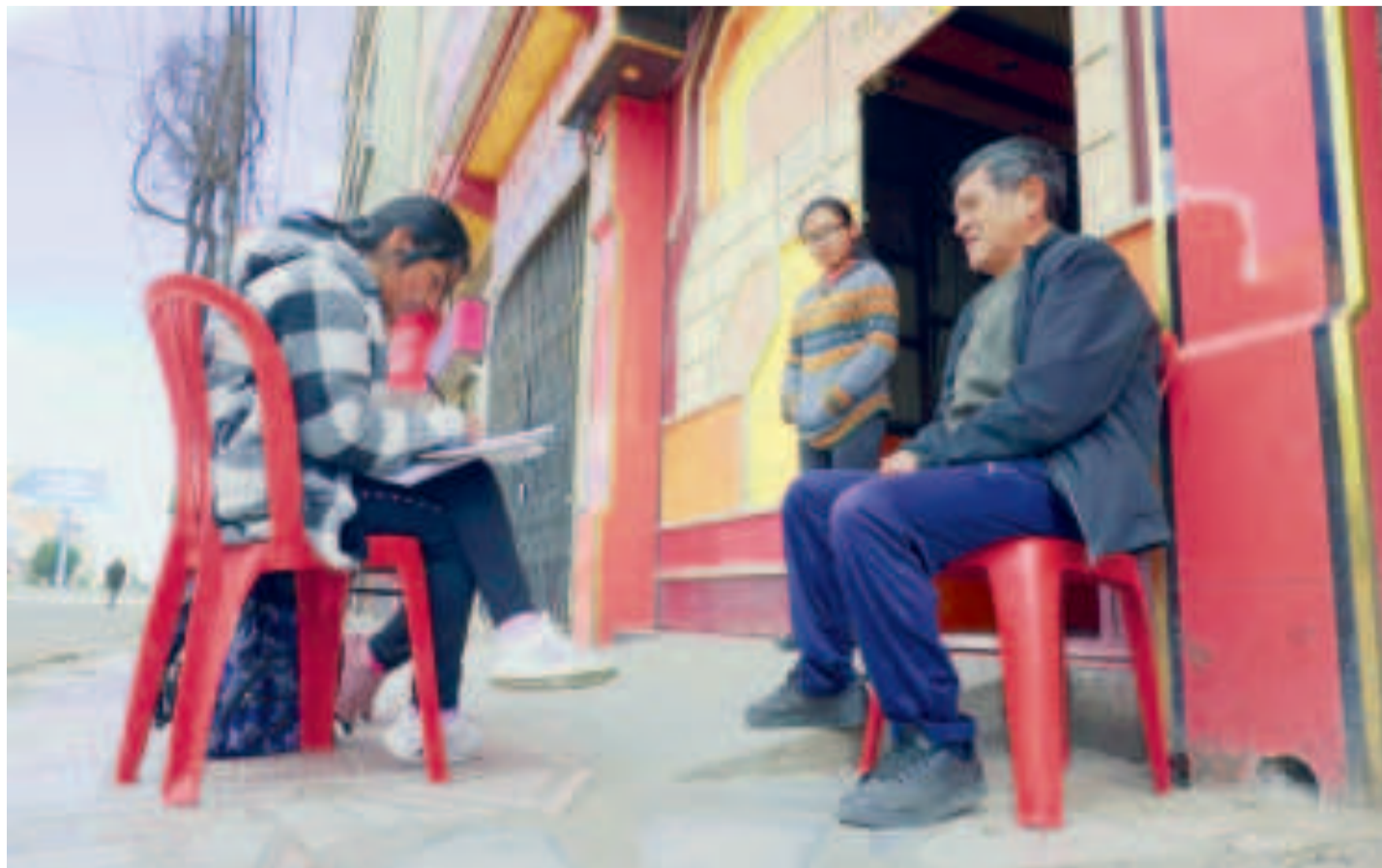
Una censista toma los datos a un habitante en la ciudad de El Alto durante el Censo 2024.