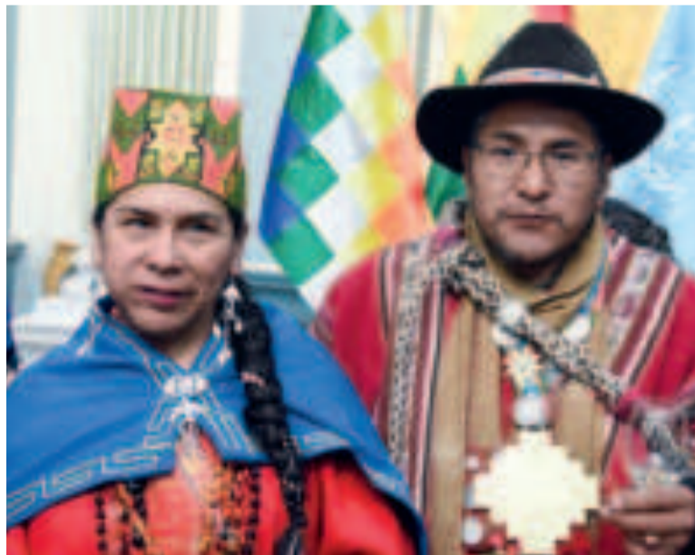
Representantes indígenas durante un acto.

La declaración insta a los Estados a adoptar medidas, en coordinación con los pueblos indígenas, que garanticen la protección de las mujeres, niños, niñas y jóvenes indígenas contra todas las formas de violencia y discriminación, así