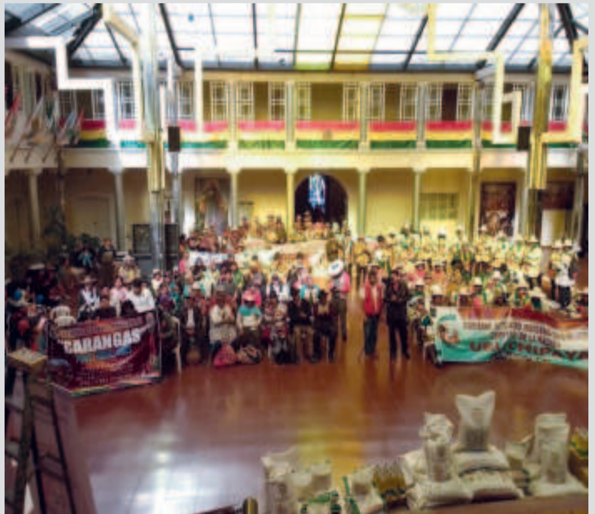
Acto de entrega de alimentos.

Se dio inicio además al pago de indemnizaciones en el marco del Seguro Agrario Minka, a familias agricultoras afectadas por eventos climáticos adversos, se benefició a 6.513 productores agrarios con un monto total de Bs 3.140.825,00. Estas compensaciones buscan mitigar las pérdidas que surgen en los agricultores y de esta manera apoyarlos en la recuperación de sus cultivos.