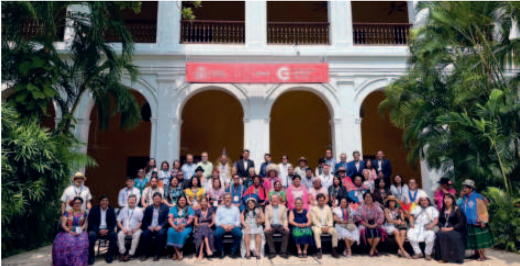
Representantes de gobiernos y de los pueblos indígenas que se reunieron en Cartagena.