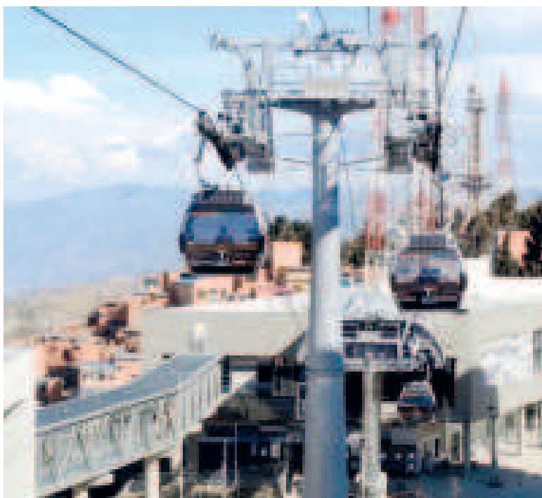
Las cabinas de la Línea Plateada de Mi Teleférico.