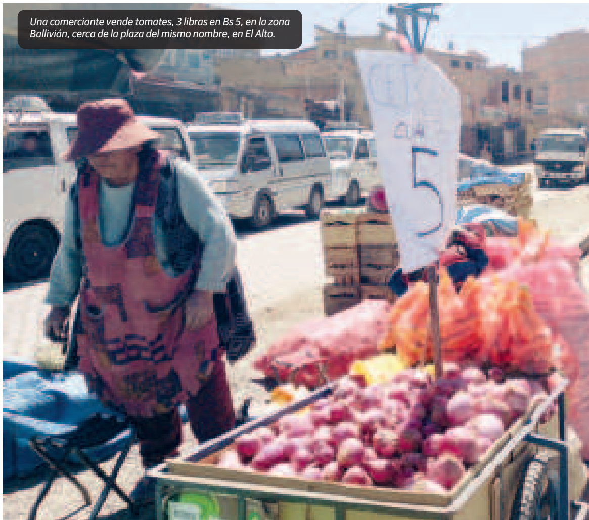
Una comerciante vende tomates, 3 libras en Bs 5, en la zona Ballivián, cerca de la plaza del mismo nombre, en El Alto.