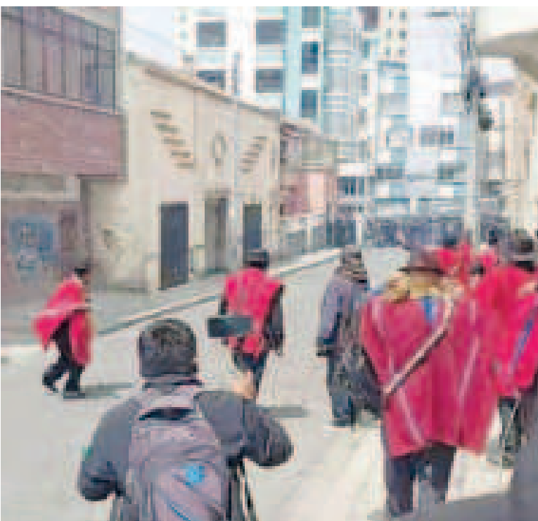
Un grupo de Ponchos Rojos atacó a efectivos policiales en un intento de toma de sede.