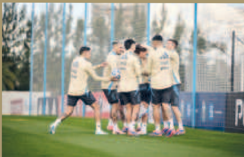
El entusiasmo de los seleccionados argentinos en el cierre de prácticas.

El seleccionado argentino viene de consagrarse campeón en la Copa América 2024 en Estados Unidos,