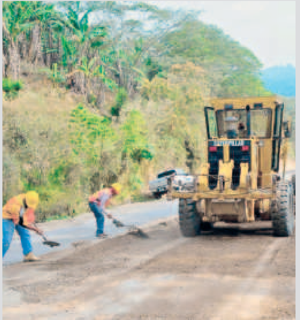
Las obras públicas tienen ahora una mayor posibilidad de ejecución.