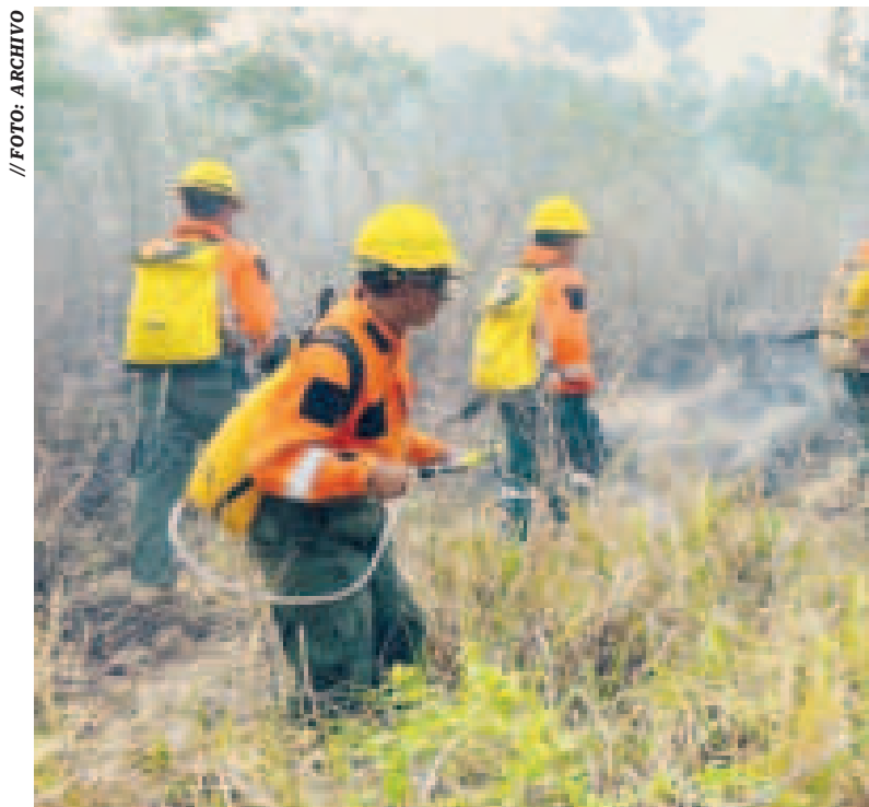
Bomberos forestales de las Fuerzas Armadas luchan contra los incendios.

Señaló además que el departamento está en emergencia y por ello ese tipo de medidas no deberían obstaculizar el trabajo de los bomberos forestales de las Fuerzas Armadas.