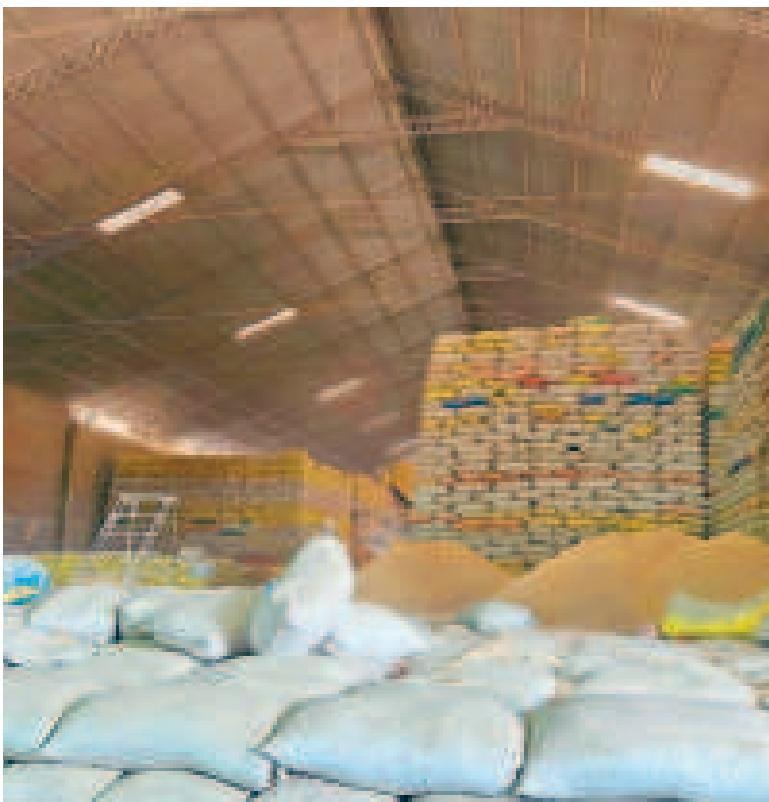
Arroz almacenado en los ingenios de Montero, Santa Cruz.