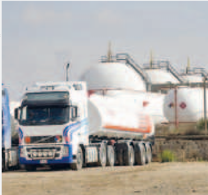
Camiones en lo que se importa hidrocarburos en Santa Cruz.

2005”, menciona el artículo primero de la norma.