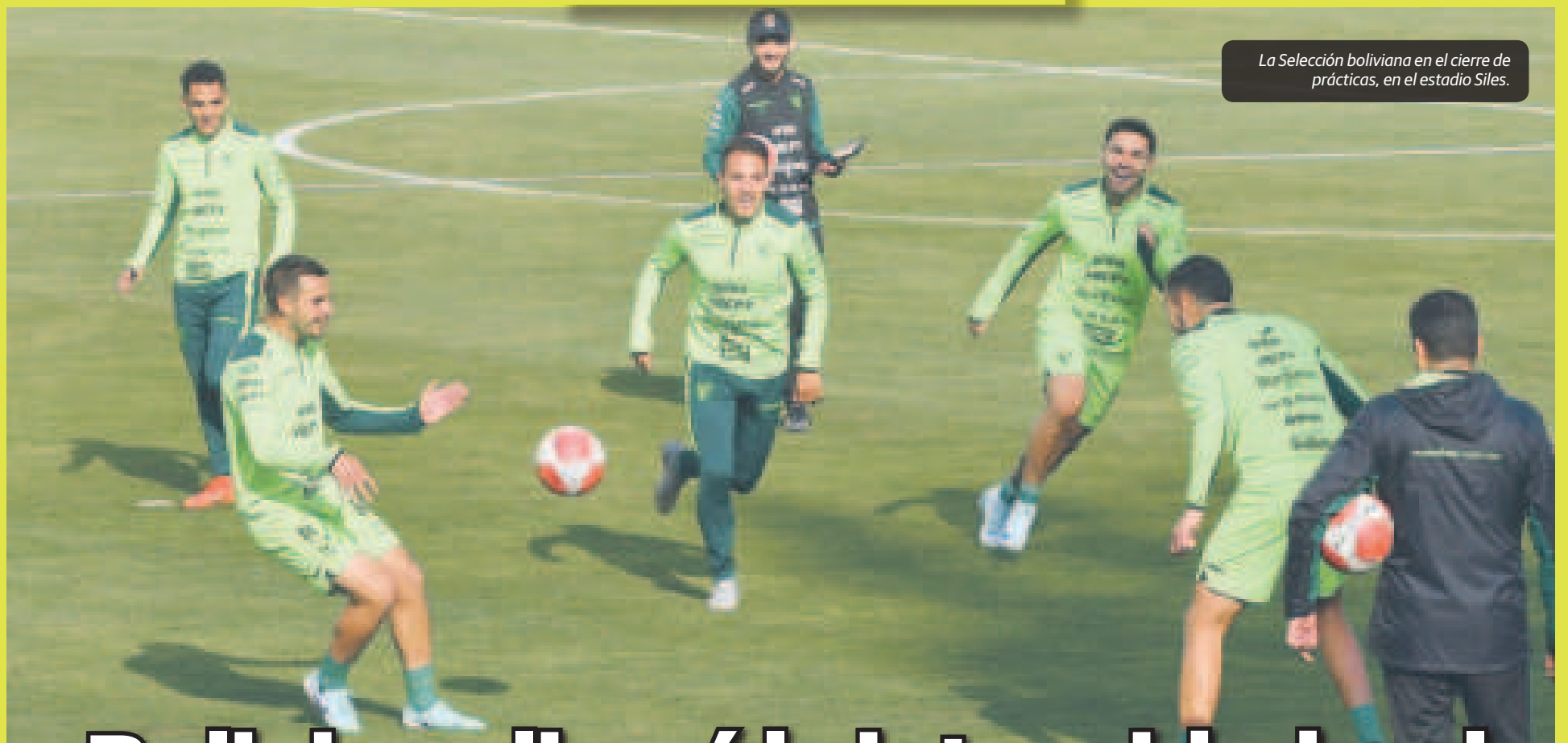
La Selección boliviana en el cierre de prácticas, en el estadio Siles.