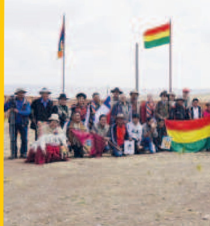
Bolivia, presente en la reunión de 2023.