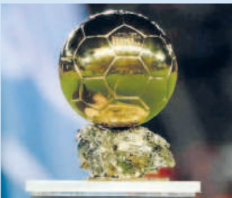
El Balón de Oro, uno de los premios más apetecidos por los futbolistas de jerarquía.