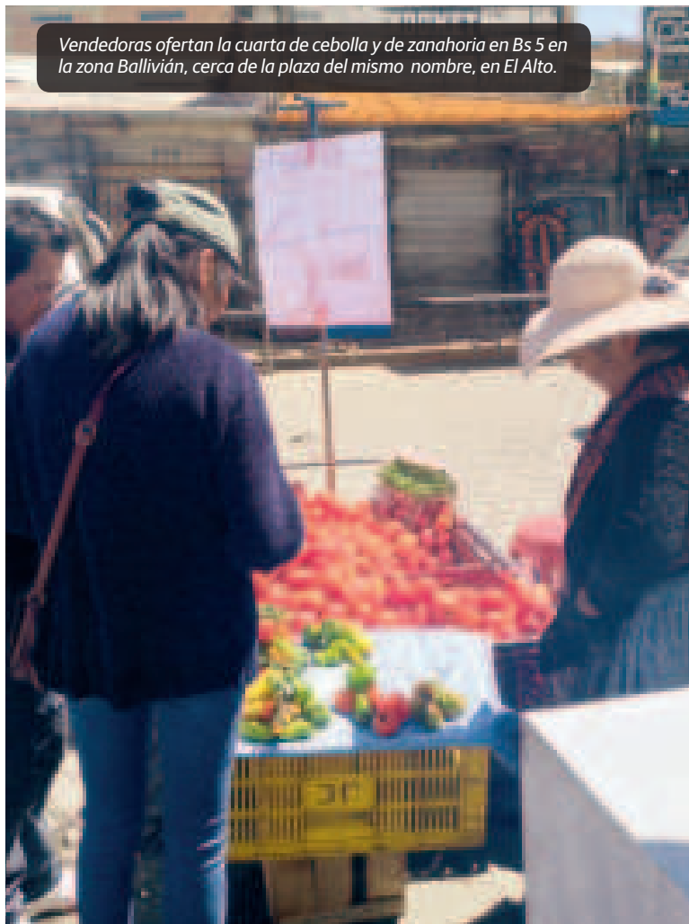
Vendedoras ofertan la cuarta de cebolla y de zanahoria en Bs 5 en la zona Ballivián, cerca de la plaza del mismo nombre, en El Alto.