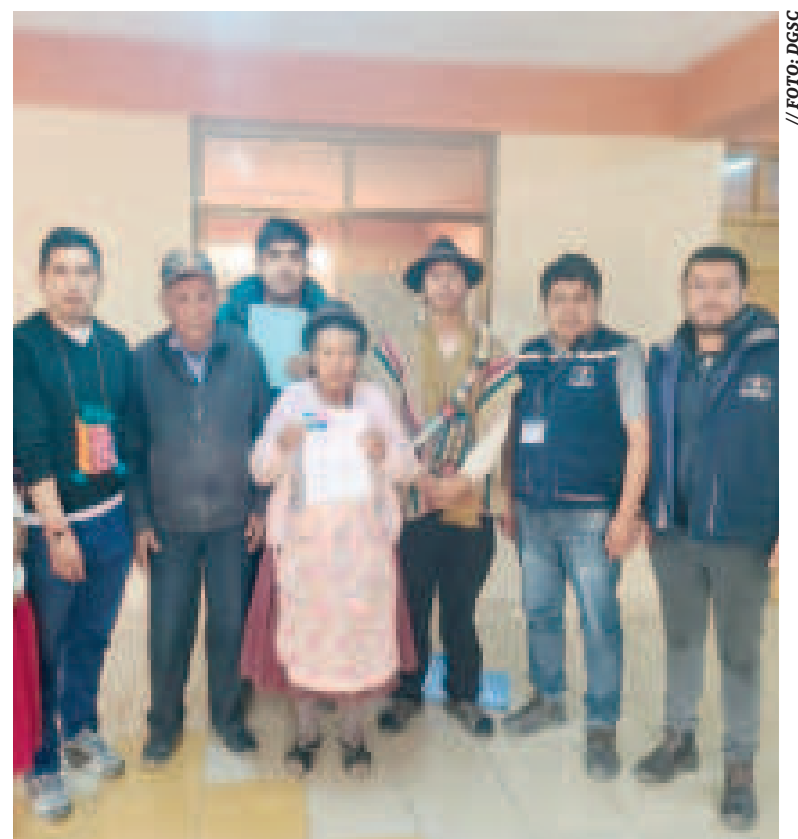
Los representantes de productores de quinua registrados y autoridades de la DGSC.

Esta dirección hace constantes jornadas de socialización y registro para los productores agropecuarios con el objetivo de garantizar el desarrollo de sus actividades productivas.