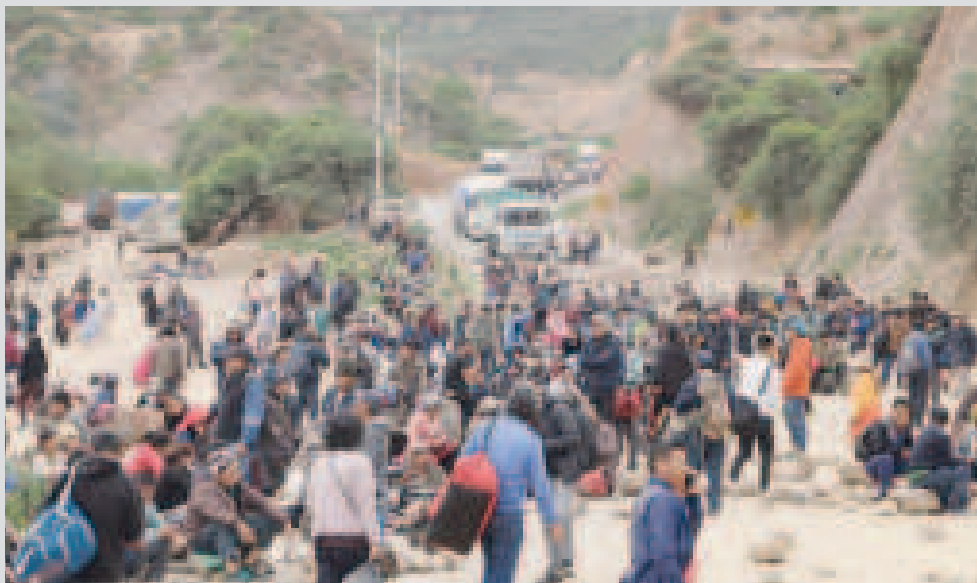
Un bloqueo promovido por afines a Evo Morales en una vía en Cochabamba, en enero de este año.

Grupos opositores como Evo Morales y otros, que dicen estar preocupados por la economía, coinciden en marchas, paros y bloqueos desde mediados de este mes. Para la diputada Deisy Choque, estas movilizaciones solo tienen el objetivo de desestabilizar el país para acortar el mandato del presidente Luis Arce.