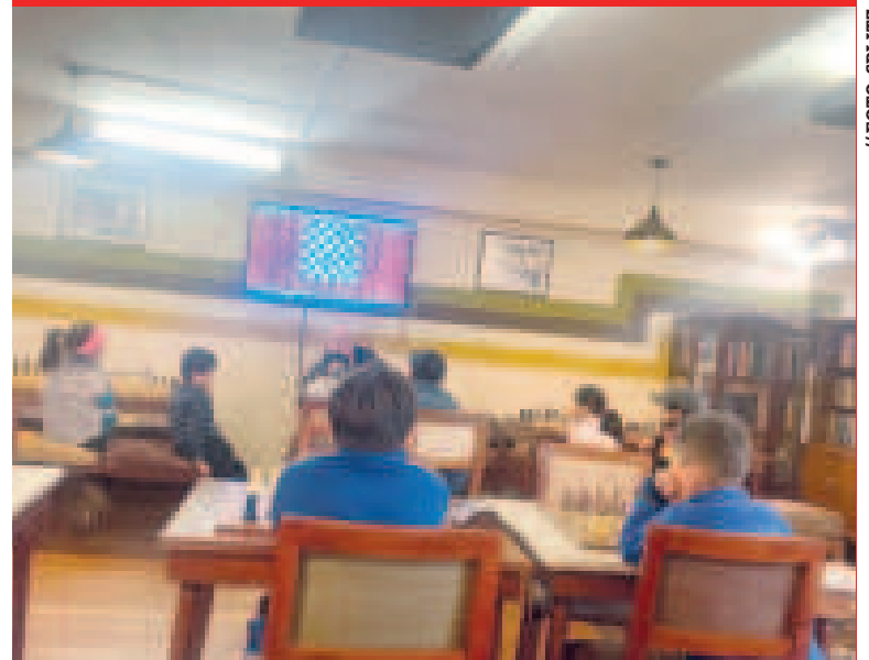
El club Blitz organiza un evento para encontrar nuevos talentos del ajedrez.

Se llevarán a cabo en las sucursales de Sopocachi, que se encuentra en la calle Bellisario Salinas, edificio Bellisario Salinas, mezzanine, oficina 11; y en Ciudad Satélite, Plan 482, avenida 19, calle José Agustín #1711.