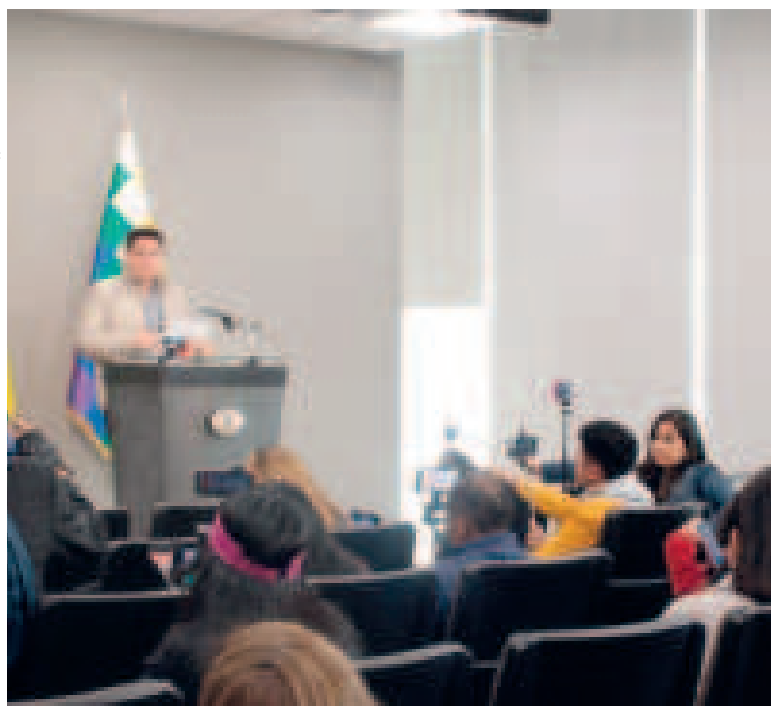
El ministro de Economía, Marcelo Montenegro, en conferencia de prensa.