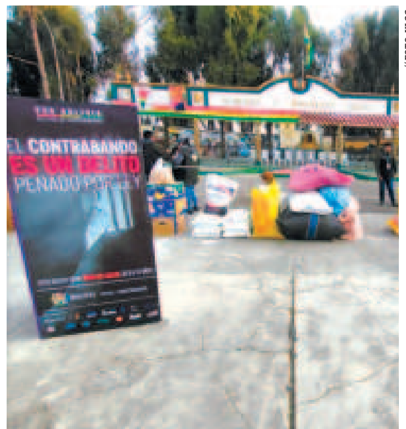
Los productos comisados que posteriormente fueron incinerados.

Además, cinco vehículos sin documentos fueron incautados.