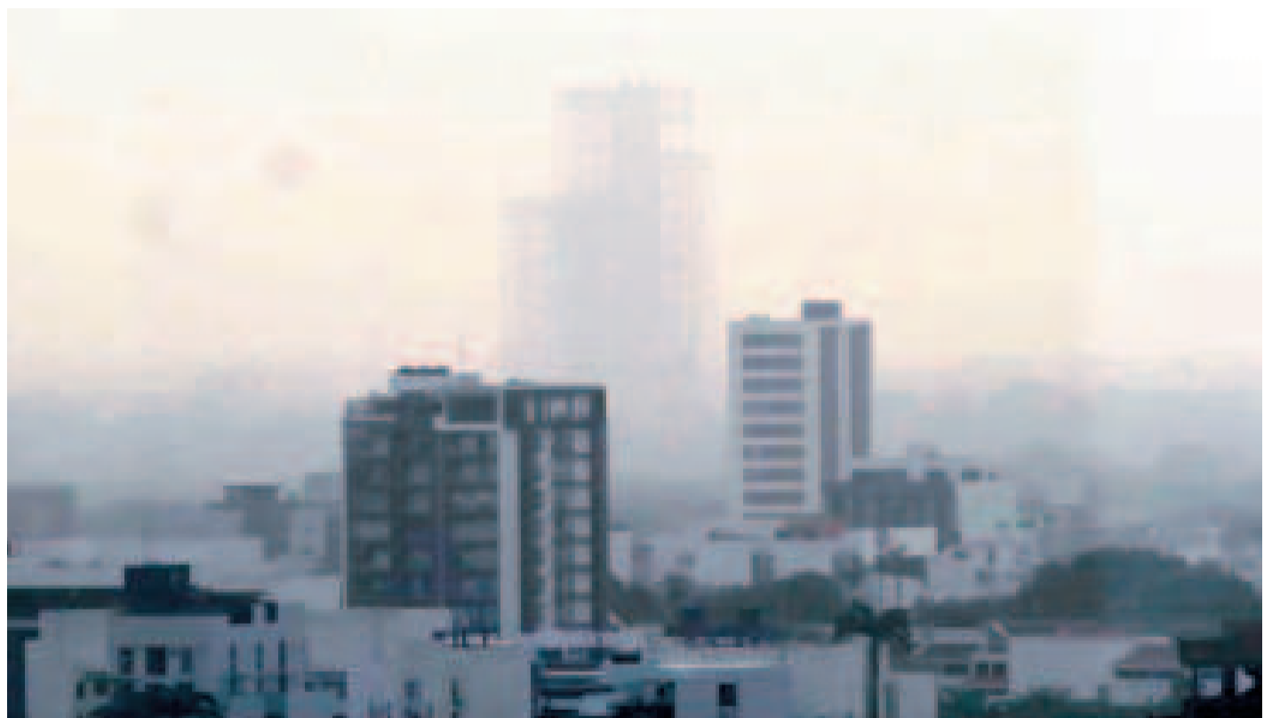
El humo cubre la ciudad de Santa Cruz de la Sierra.

Véliz sugirió a los gobiernos municipales emplear el decreto de emergencia nacional para contar con recursos y dotar de insumos de bioseguridad a las unidades educativas, con el fin de proteger la salud de los estudiantes.