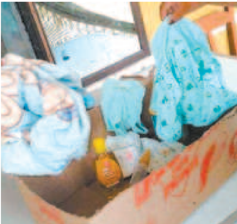
Uno de los bebés abandonados estaba en una caja de cartón.