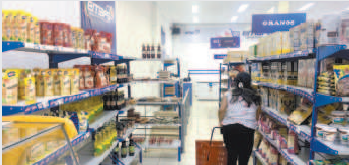
Emapa tiene una diversidad de productos de fabricación nacional.

Este ajuste en los precios ha generado largas filas en las