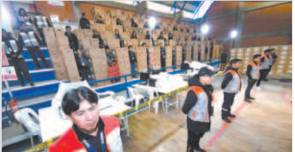
Los funcionarios que se encargan del análisis de las boletas del Censo 2024.

Además, se ha invitado a la Comisión Internacional de Alto Nivel, conformada por Naciones Unidas, el Fondo de Población (Unfpa) y el Centro Latinoamericano y