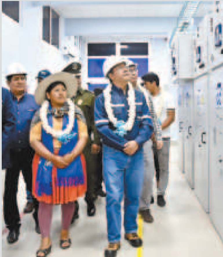
El presidente Luis Arce recorre las instalaciones de Elfec.