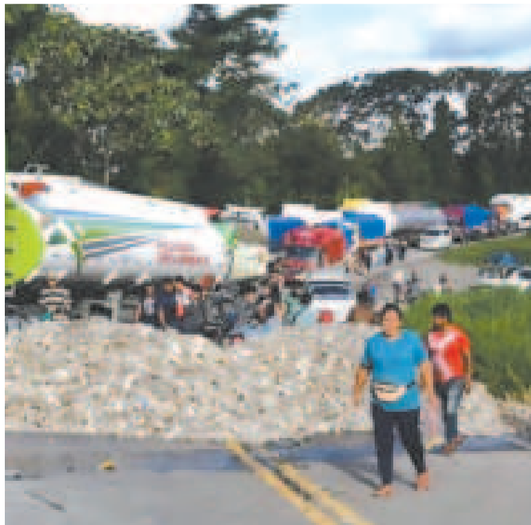
Un bloqueo de vías impulsado por los evistas.