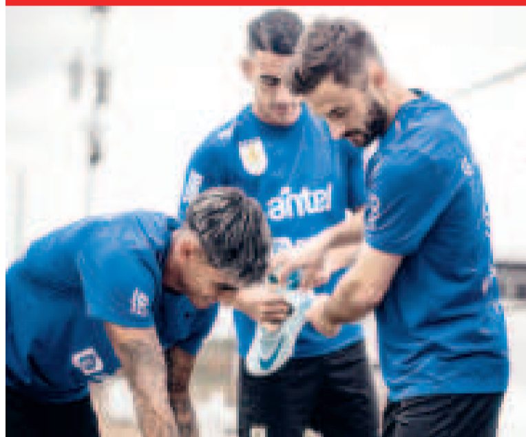
Jugadores de la selección uruguaya en el cierre de prácticas en Maturín.

La última vez que estos equipos se enfrentaron fue por las Eliminatorias rumbo al Mundial de Qatar. En febrero de 2022, la Celeste se impuso por 4 a 1 en el Estadio Centenario con goles de Rodrigo Bentancur, Giorgian De Arrascaeta, Edinson Cavani y Luis Suárez.