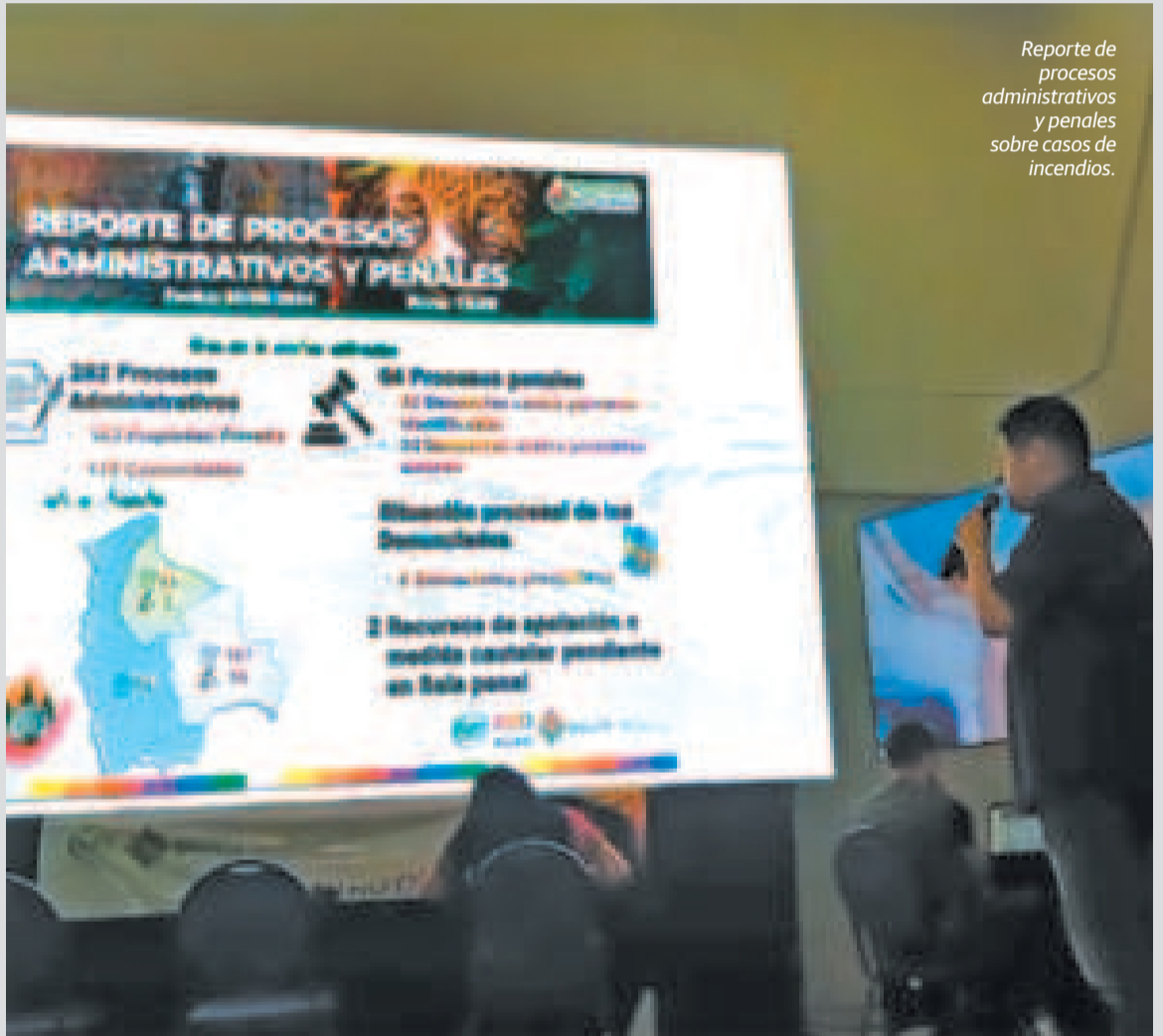
Reporte de procesos administrativos y penales sobre casos de incendios.

PROCESOS PENALES ESTÁN ACTIVOS. en 32 casos están identificados los responsables, y hay 282 procesos administrativos.