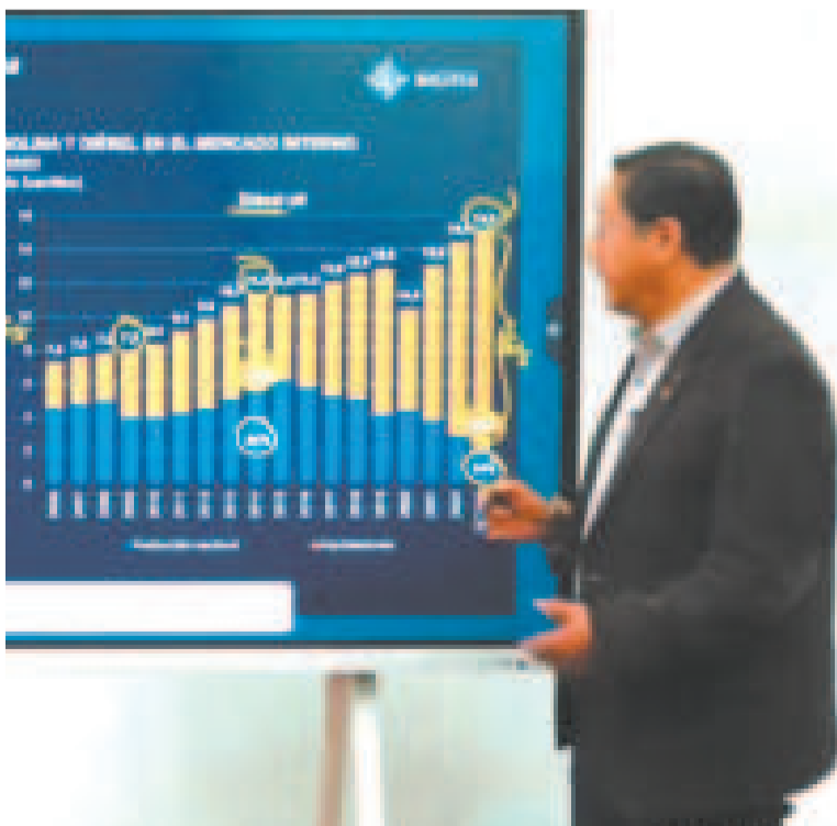
El presidente Luis Arce durante su mensaje a la nación.