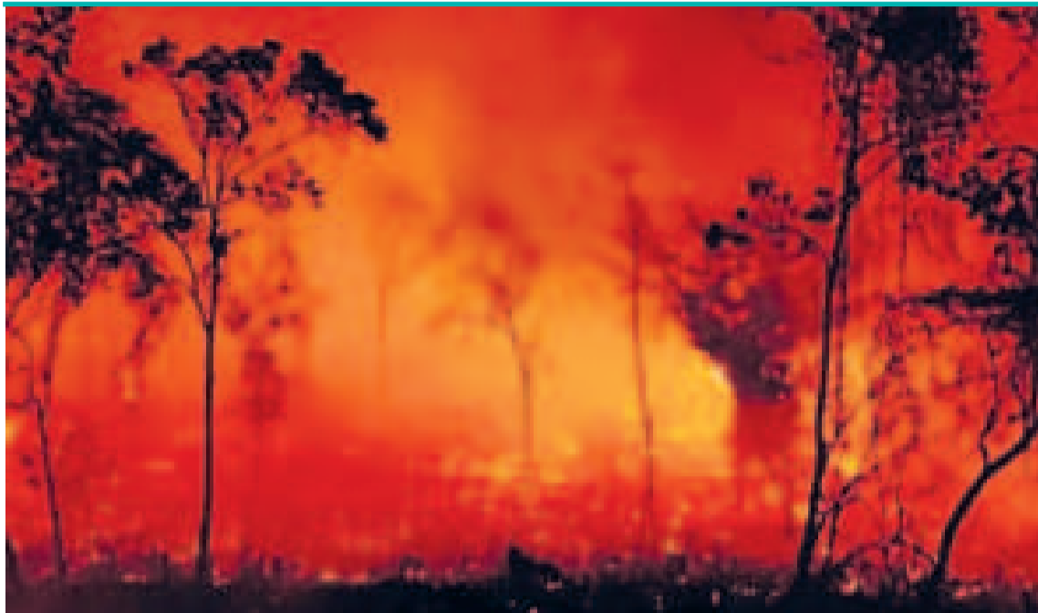
El fuego en Brasil llegó hasta la Amazonia.