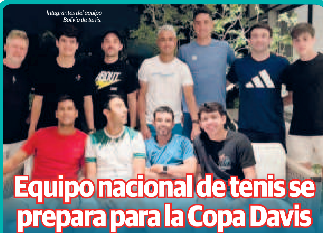
Integrantes del equipo Bolivia de tenis.