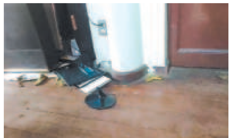
Destrozos en el interior de la COB luego del intento de toma de parte del evismo.