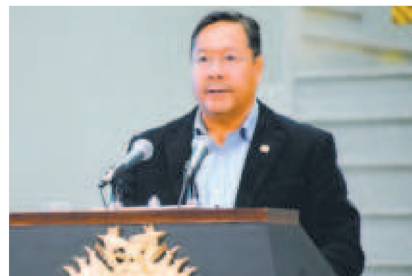
El presidente Luis Arce.

gará más ayuda internacional proveniente ar los trabajos en las áreas más afectadas.