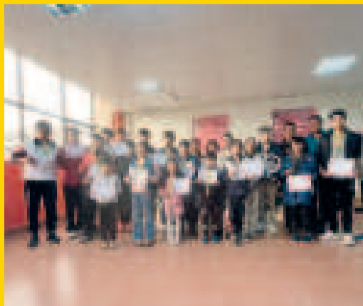
Los ganadores del campeonato nacional de ajedrez.