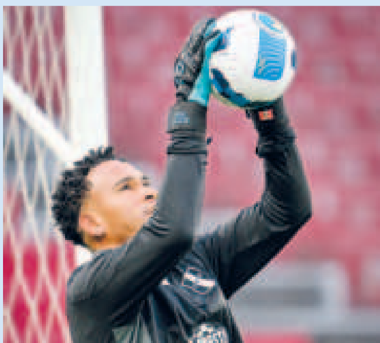
Pedro Gallese, la seguridad en el arco del seleccionado peruano.