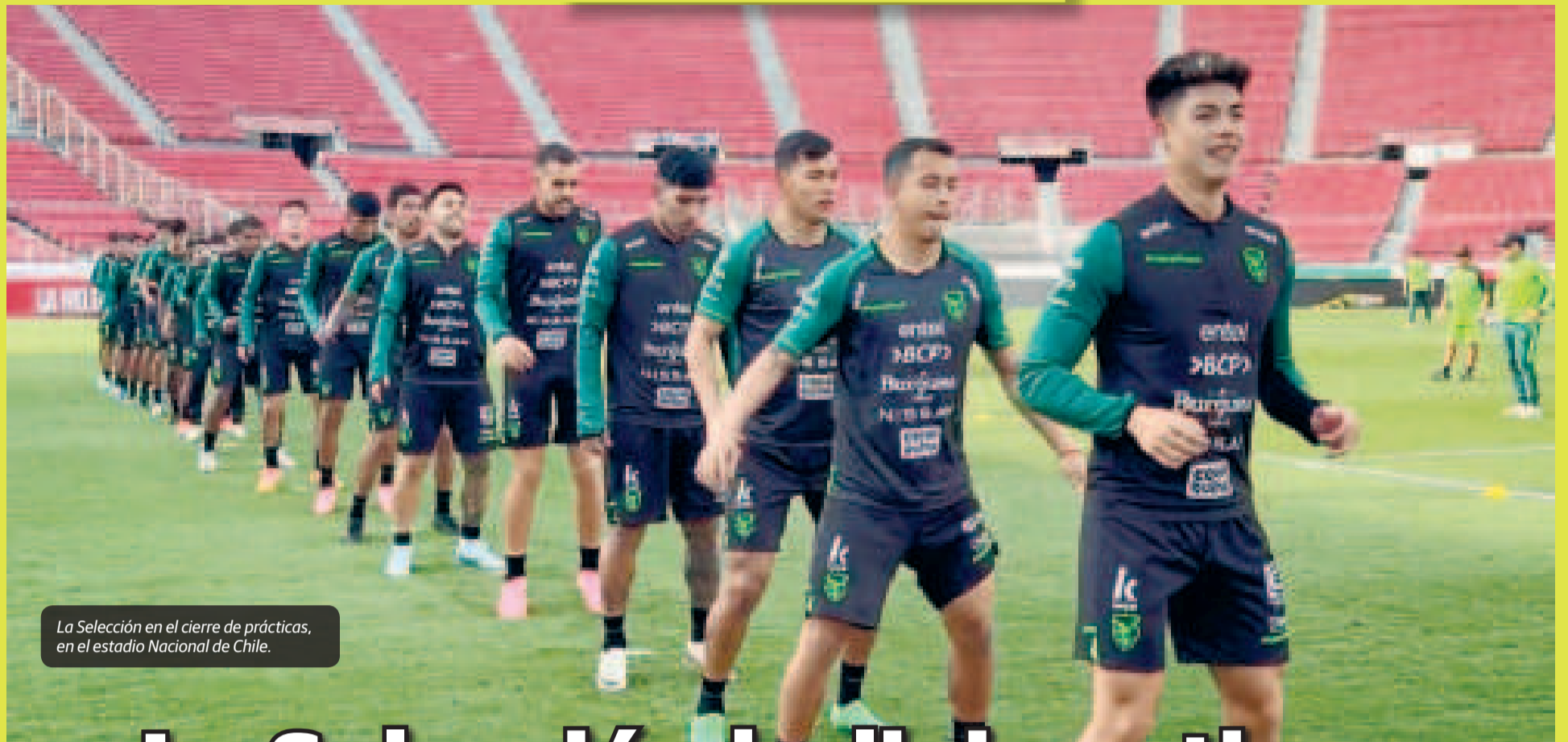
La Selección en el cierre de prácticas, en el estadio Nacional de Chile.