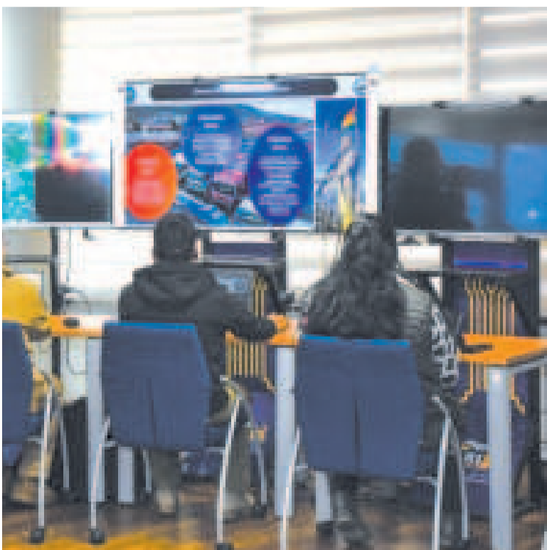
El Centro de Monitoreo de Seguridad Alimentaria activa acciones inmediatas.