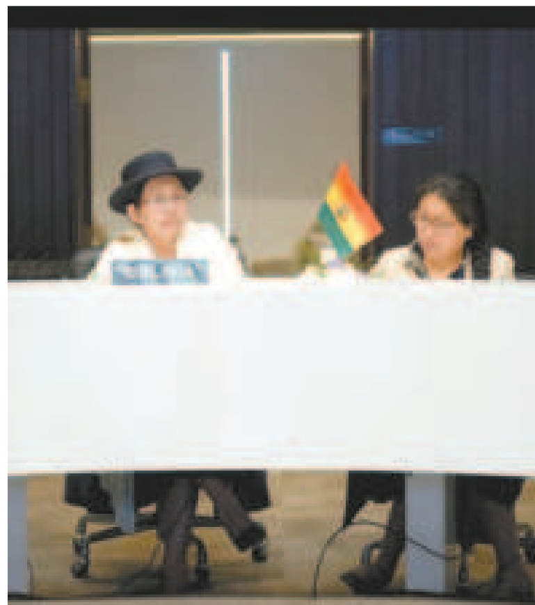
La canciller Celinda Sosa en la reunión de la Comunidad Andina.

Más de 70 incendios forestales fueron registrados hasta el domingo en Bolivia.