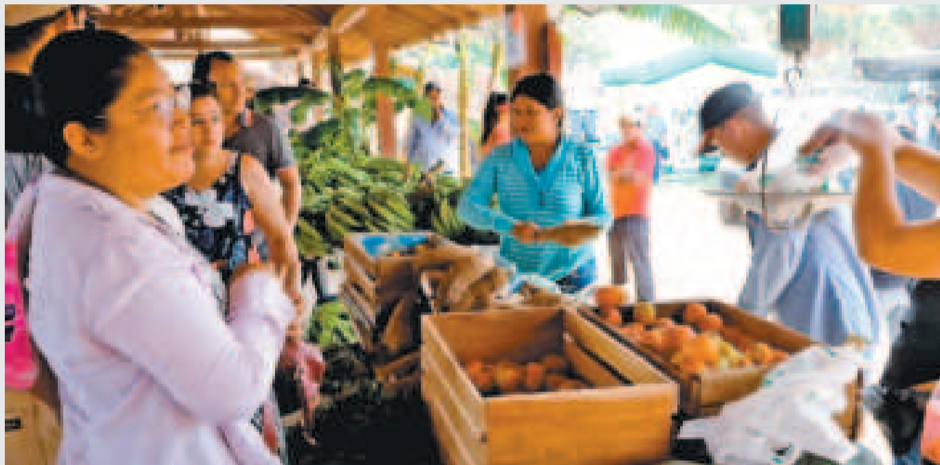
Las ferias Del Campo a la Olla tienen el fin de frenar la especulación de precios en los mercados del país.

Las familias de estas tres ciudades serán beneficiadas con estos eventos que buscan acercar los productos