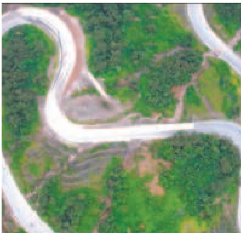
La carretera de doble vía El Sillar.