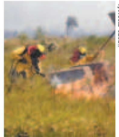
Incendio en Santa Cruz.