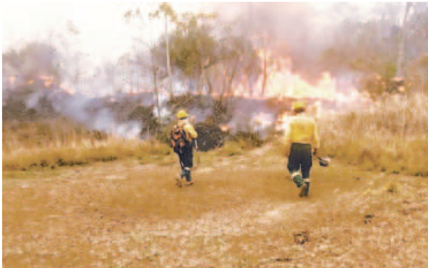
Fuego en Santa Cruz, la región más golpeada por los incendios forestales.