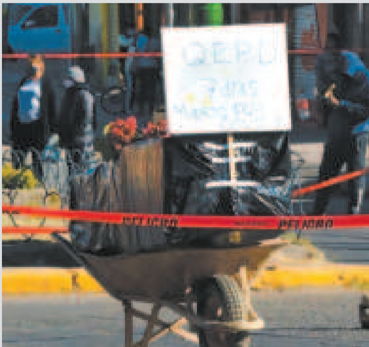
Una persona fallecida por el Covid-19 en una carretilla.