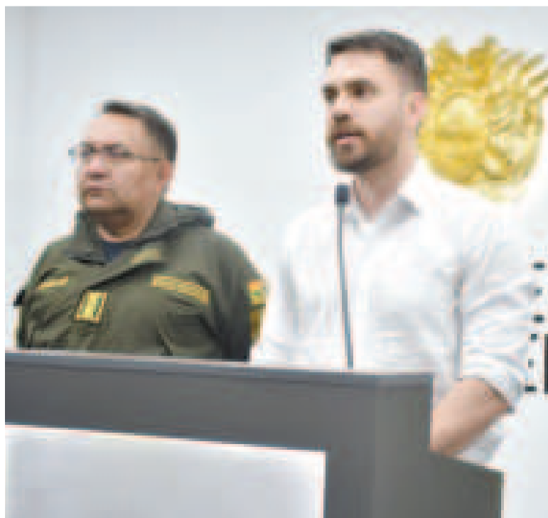
El ministro de Gobierno, Eduardo Del Castillo, en rueda de prensa.