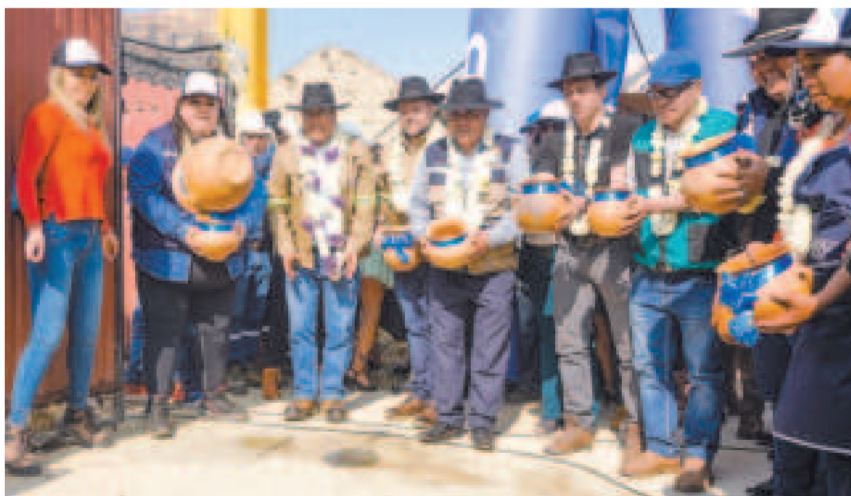
La ch'alla de la red de gas domiciliario en Arani.

Las viviendas cuentan con dormitorios, salas de comedor y living, todos los servicios básicos y además pueden ser ampliadas hacia arriba.