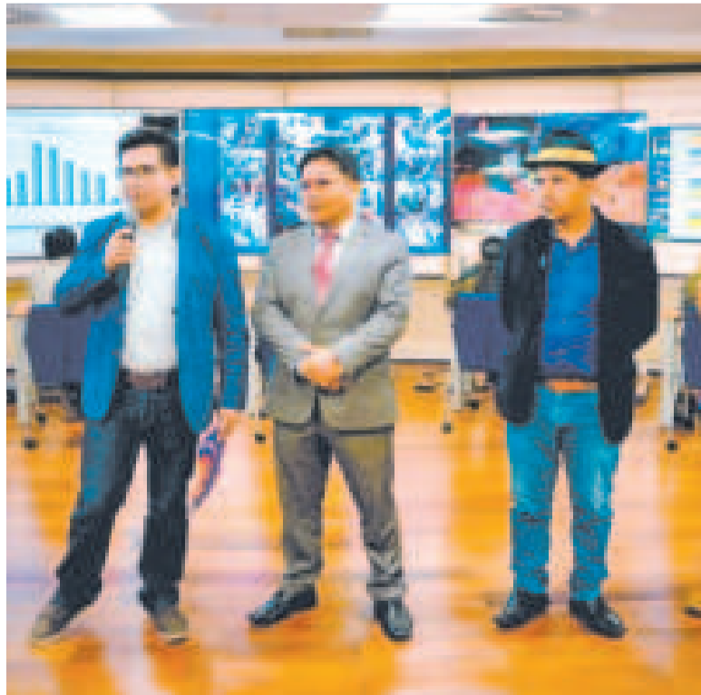
Representantes del Comité de Seguridad Alimentaria, desde el Centro de Monitoreo.