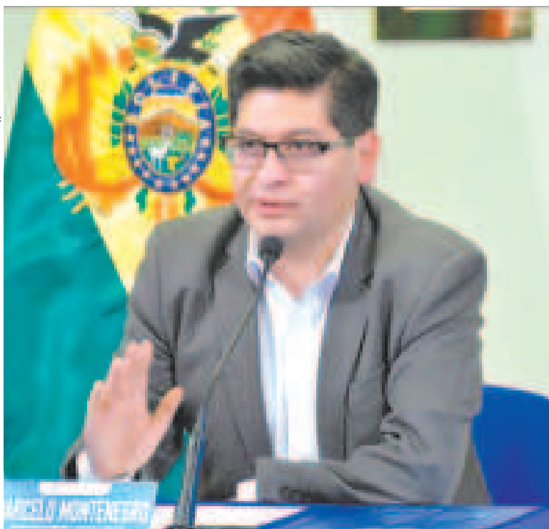
El ministro de Economía y Finanzas Públicas, Marcelo Montenegro.