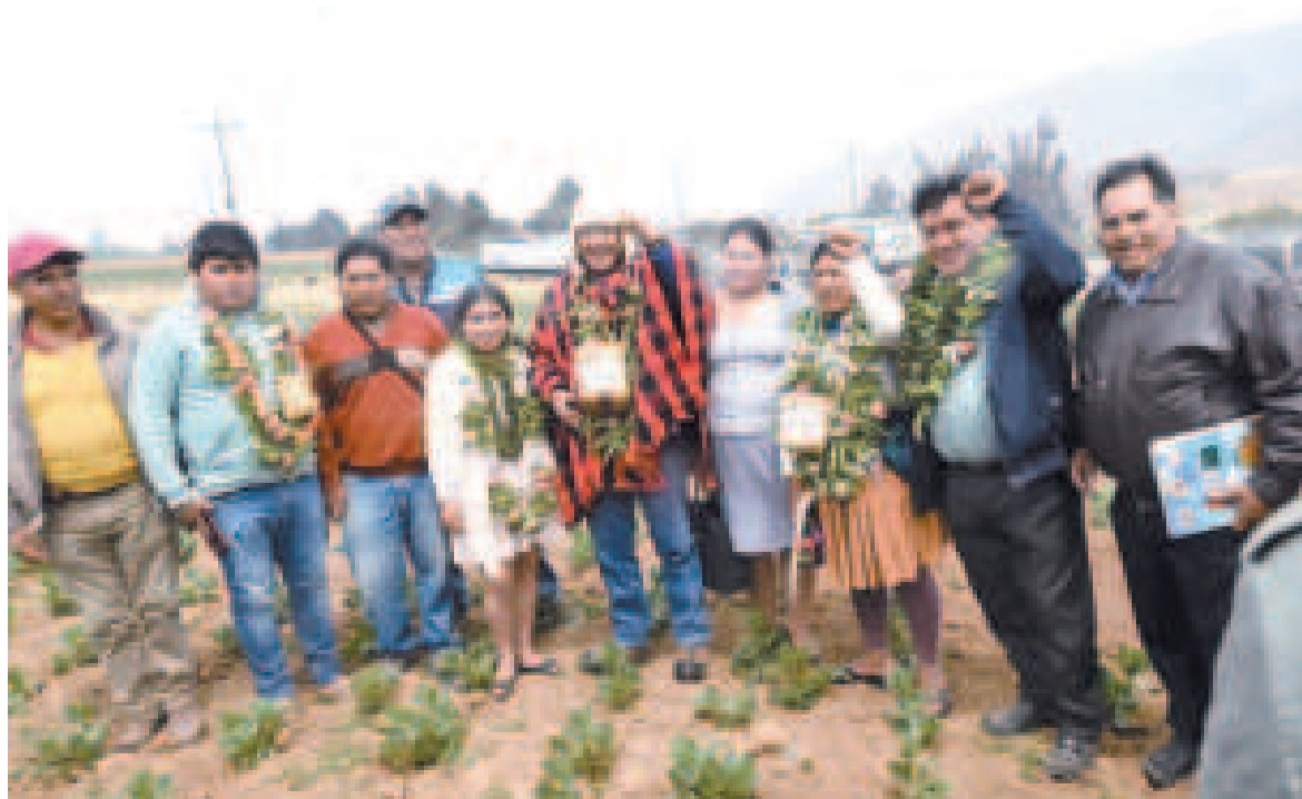
El presidente Luis Arce junto a los beneficiarios del sistema de agua subterránea.