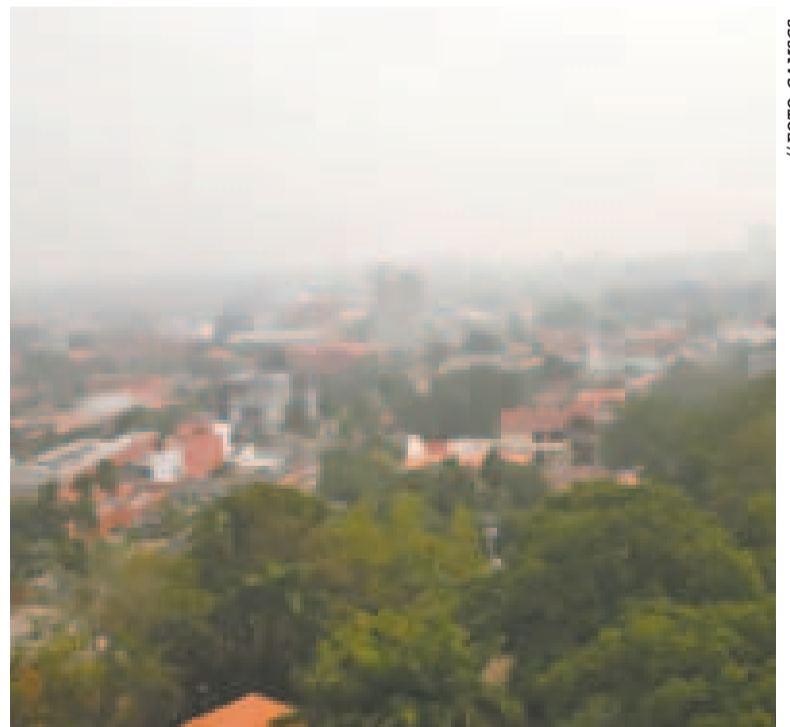
La humareda afecta a la ciudad de Santa Cruz.

Beni y Pando, que ahora enfrentan niveles de contaminación atmosférica clasificados como “muy malos” y “extremadamente malos”, según el Índice de Calidad del Aire (ICA) reportado por el Ministerio de Medio Ambiente y Agua.