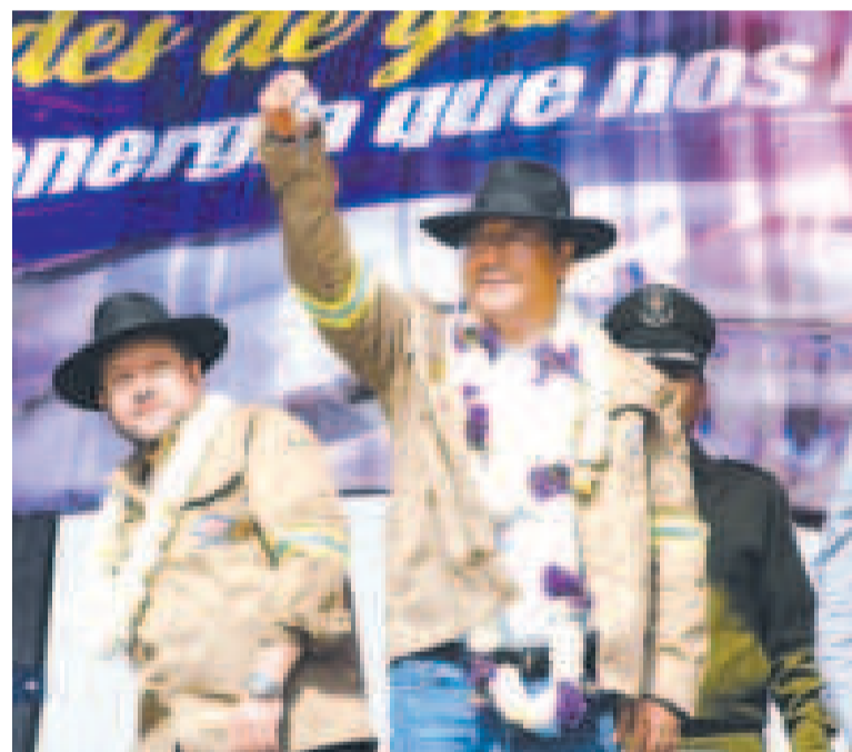
El presidente Luis Arce expone una de las llaves de las viviendas entregadas en Arani.

manos y hermanas sigan corriendo con sus garrafas detrás del camión. Ahora tienen gas directo en sus cocinas y esto repercute en los bolsillos, porque ahora es mucho más barato el gas natural”, destacó.