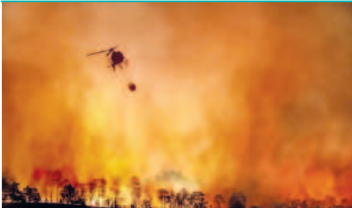
La Amazonia brasileña en una crítica situación por el fuego y la sequía.

// FOTO: MATTHAEUS | DESAFIOS CLIMATICOS RSS