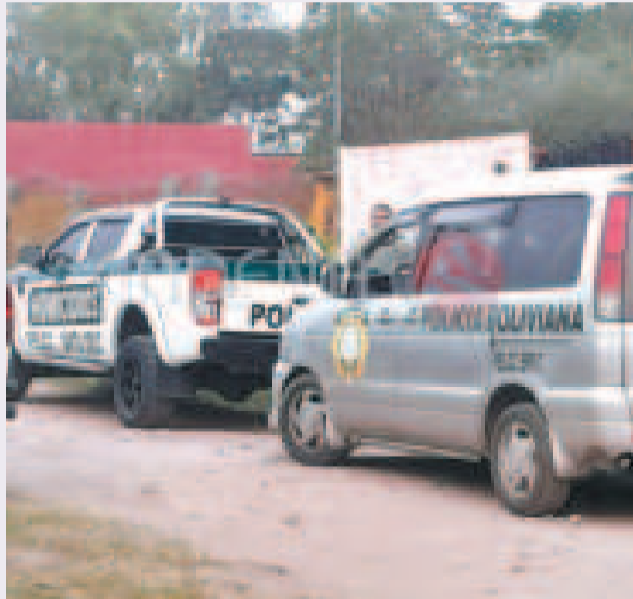
Un caso de infanticidio se registró en Pampa de la Isla, en Santa Cruz.

“Tenemos 24 hechos de infanticidio y 63 de feminicidio a nivel nacional. Estos cuadros nos muestran el avance de la violencia extrema que quita la vida de los niños y mujeres”, afirmó Lanchipa a la prensa.