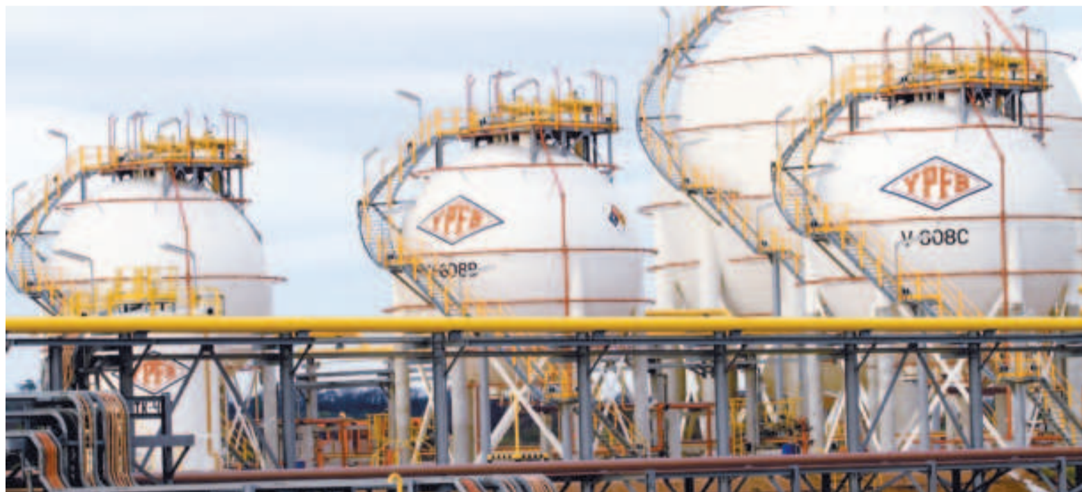
Parte de la infraestructura de la planta de Gran Chaco.

“Nuestra planta continúa operando y produciendo gas licuable de petróleo (GLP), gasolinas estabilizadas y gasolina rica en