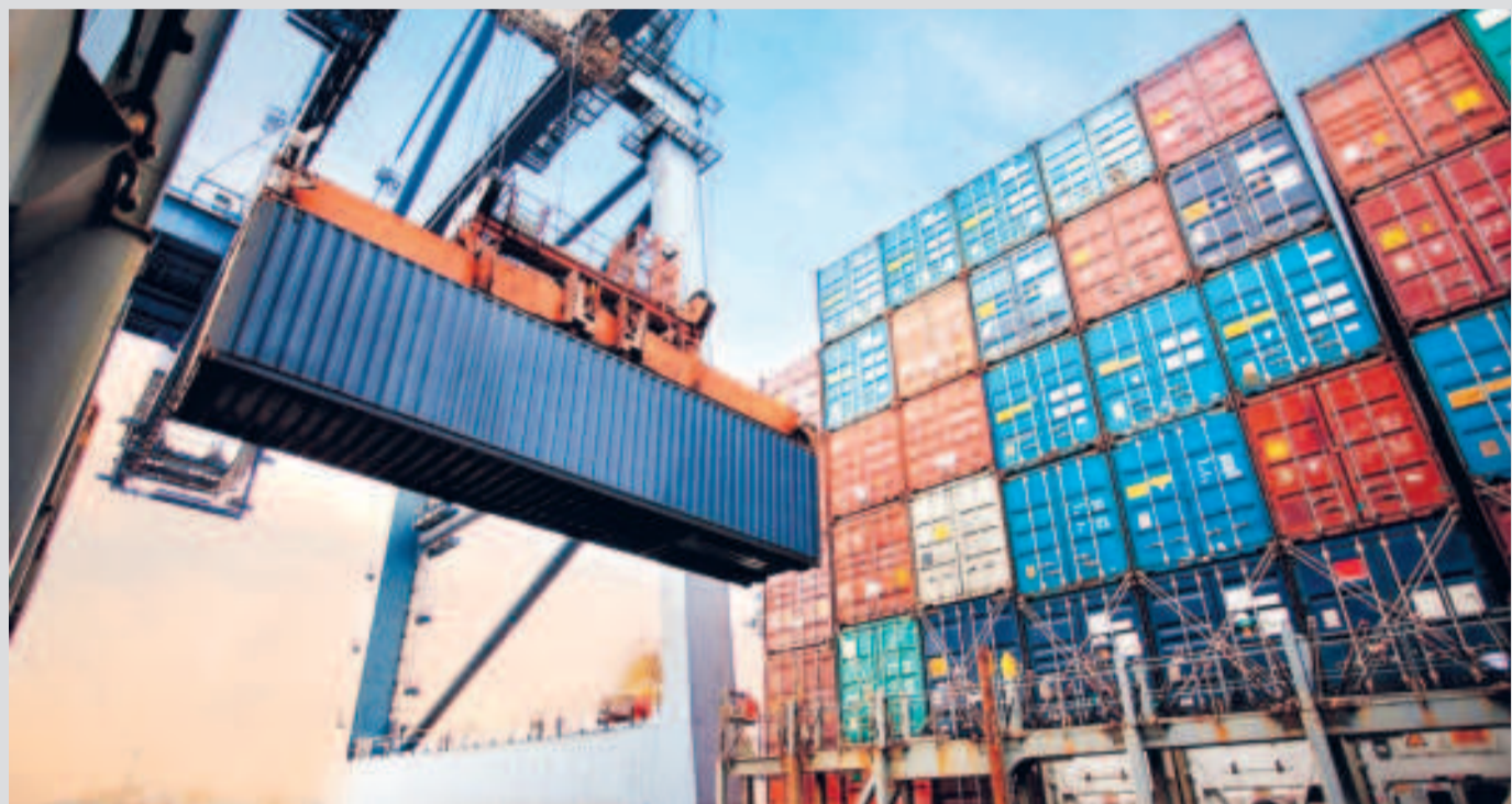
Se espera que el incentivo incremente el valor de las exportaciones.

Según el decreto, cualquier persona o empresa que exporte bienes con valor agregado y cuente con un contrato de venta o exportación será elegible para acceder a este fondo.