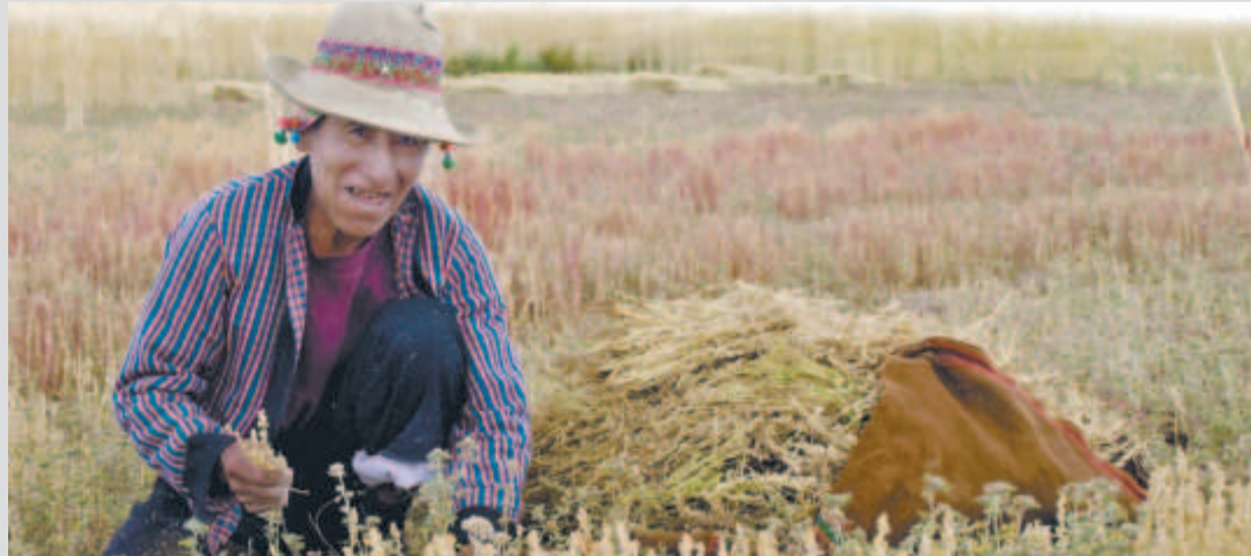
Se busca impulsar el cultivo de cañahua como un alimento estratégico.

En el marco de los esfuerzos del presidente Luis Arce para garantizar la seguridad alimentaria con soberanía en Bolivia, el Ministerio de Desarrollo Rural y Tierras anunció el lanzamiento de la Primera Convención Nacional de Cañahua, un evento que se celebrará los días 25 y 26 de octubre en la ciudad de Oruro, bajo el lema Cañahua: Energía que Transforma la Vida.