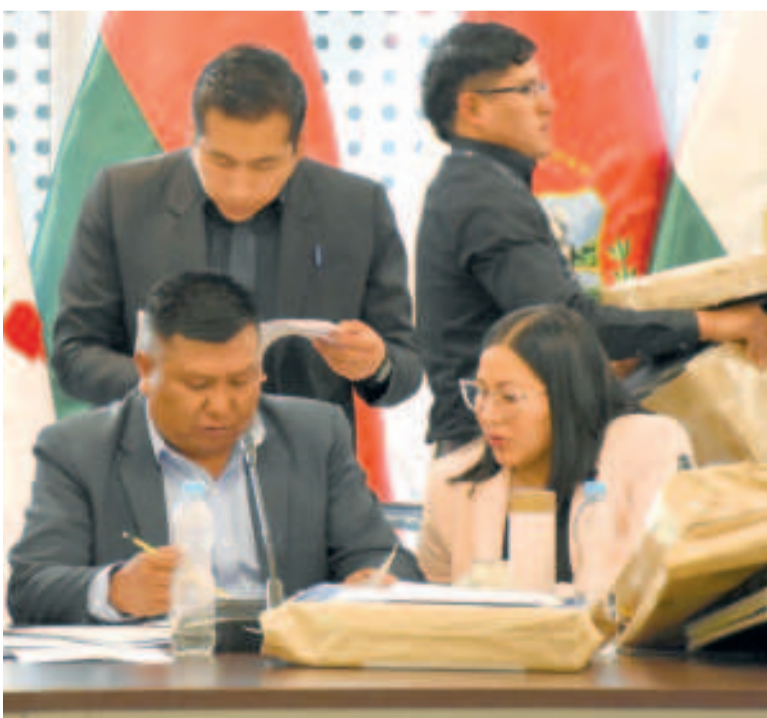
Legisladores que conforman la Comisión Mixta de Justicia Plural.