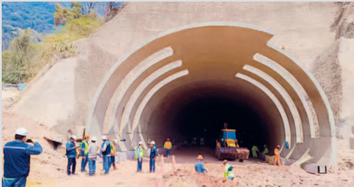
Inspección del túnel de Incahuasi por parte de autoridades de la Administradora Boliviana de Carreteras.

Tiene una longitud de 1.260 metros y una inversión que supera los Bs 135 millones. Comprende dos carriles de 3,50 metros de ancho a cada lado.