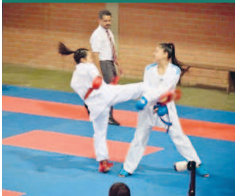
El campeonato nacional clasificatorio de karate se desarrollará en Santa Cruz.

El evento multideportivo, que contará con la participación de Chile, Colombia, Ecuador, El Salvador, Guatemala, Panamá, República Dominicana, Venezuela, Bolivia y Perú, se desarrollará del 27 de noviembre al 8 de diciembre.