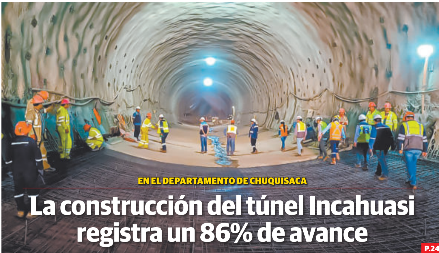
EN EL DEPARTAMENTO DE CHUQUISACA