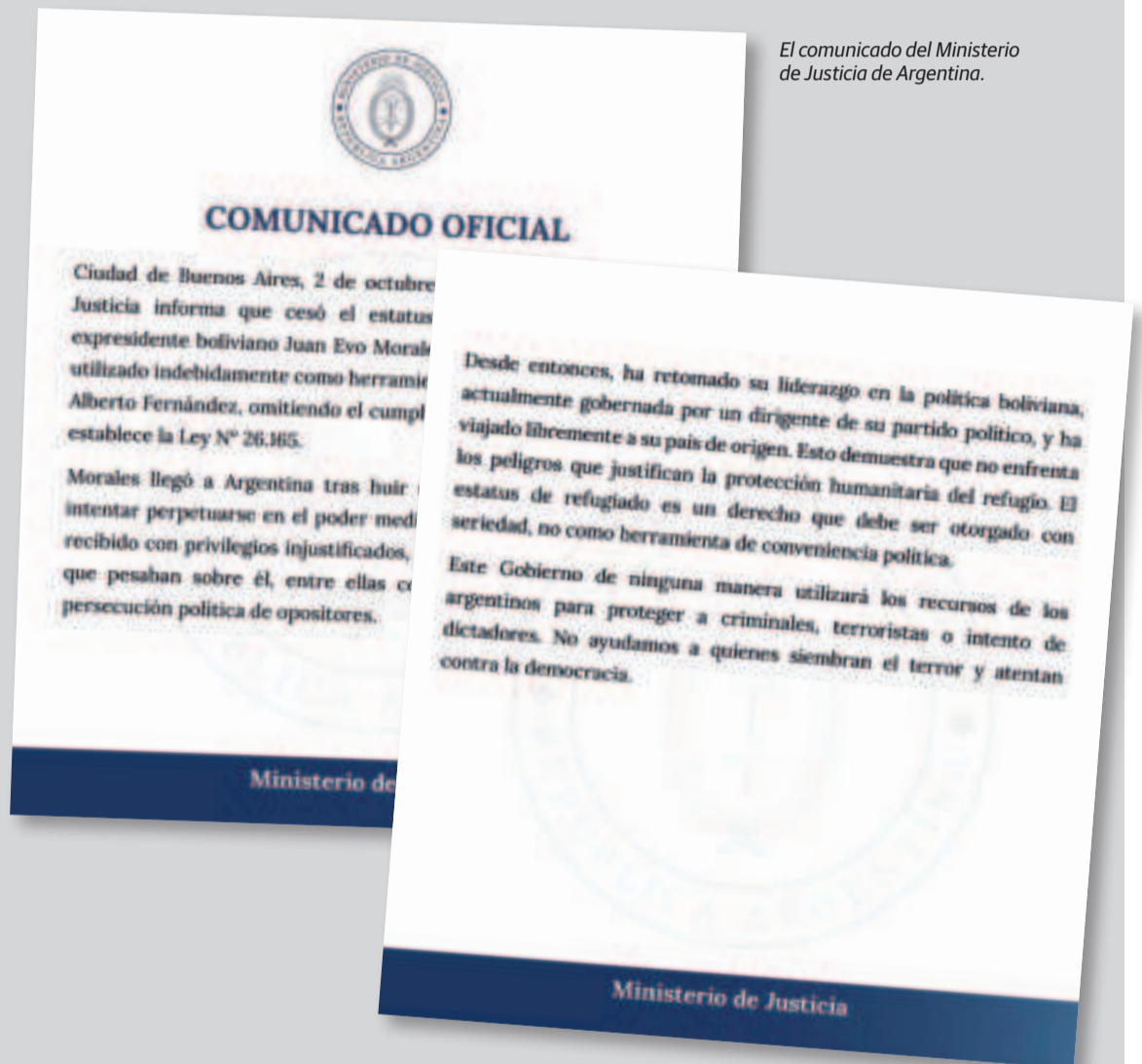
El comunicado del Ministerio de Justicia de Argentina.