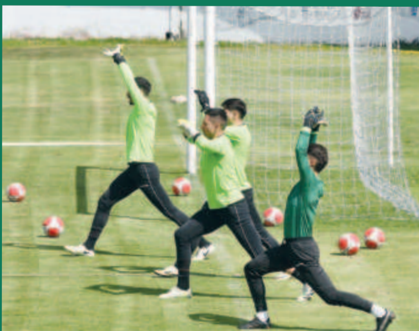
La preparación de los arqueros del equipo nacional que apuntan a la titularidad.

La tarea preparatoria continuará hoy en el mismo escenario de la zona de Achumani.