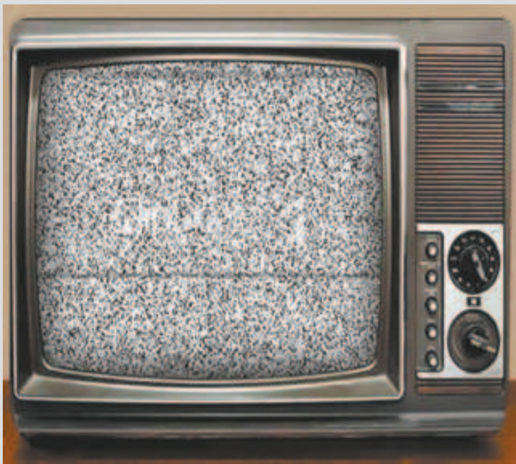
Un televisor antiguo que emite señal analógica.