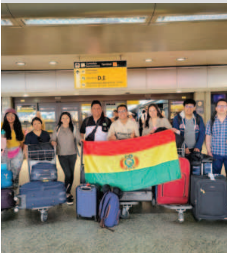
El grupo de becarios parte a especializarse en Rusia.