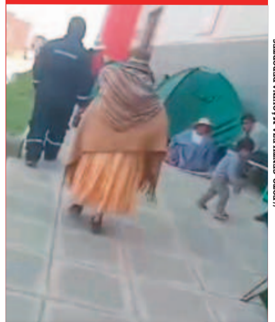
Cientos de personas hacen fila para comprar entradas.

En las afueras del estadio alteño se observó al final de la tarde de ayer una larga fila de personas que espera comprar las entradas. La mayoría de la gente se instaló en carpas, donde pernoctaron en la noche, en medio de un fuerte viento, para no perder su puesto.