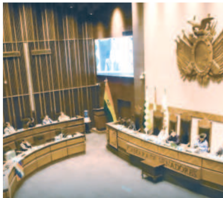
La sesión de ayer en el Senado.

va para la suscripción de contratos petroleros entre YPFB y Canacol Energy son Ovai, Florida Este y Arenales, todas ubicadas en Santa Cruz. La autorización, mediante ley, para el área Tita-Techi completa los proyectos exploratorios que la compañía colombiana tiene en el país.