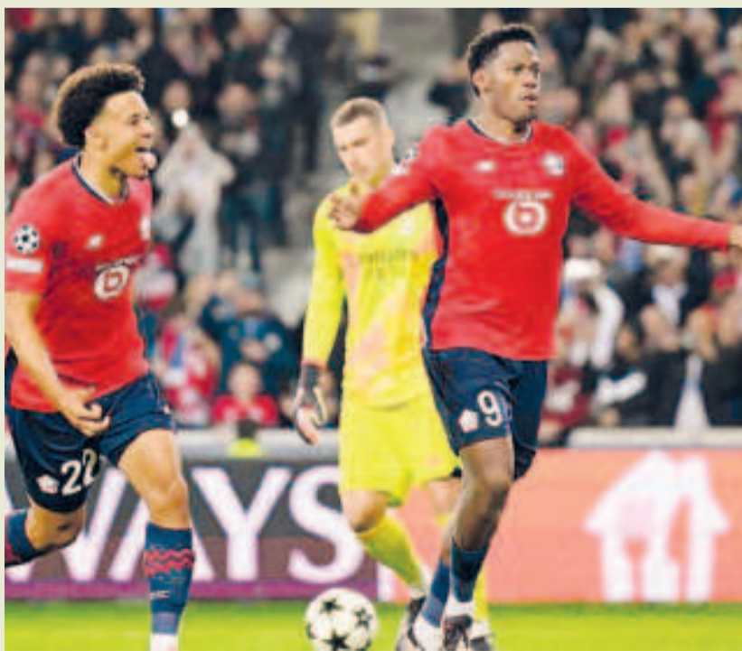
El canadiense Jonathan David (9) festeja su gol que le dio el triunfo al Lille.