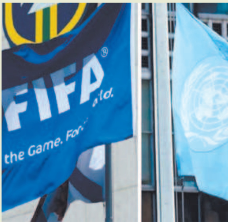
La ONU le pide a la FIFA respetar los derechos internacionales.