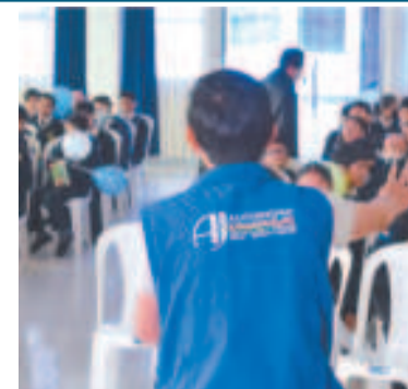
Actividades de la campaña de la AJ.

Recordó que se están construyendo más de 170 plantas industriales en diferentes regiones del país, con una inversión mayor a los Bs 32.000 millones.