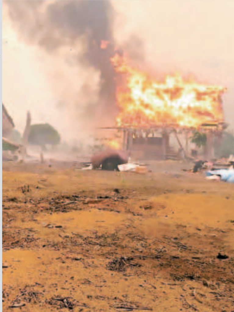
El incendio de viviendas en Riberalta, Beni.