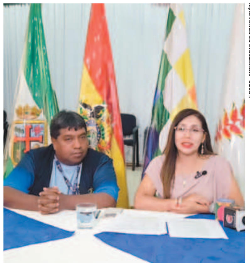
La viceministra de Educación Especial y Alternativa, Viviana Mamani.

El bono tiene el propósito de contribuir a la disminución de la tasa de deserción escolar, incentivando la matriculación, permanencia y culminación del año escolar de los estudiantes en Bolivia.