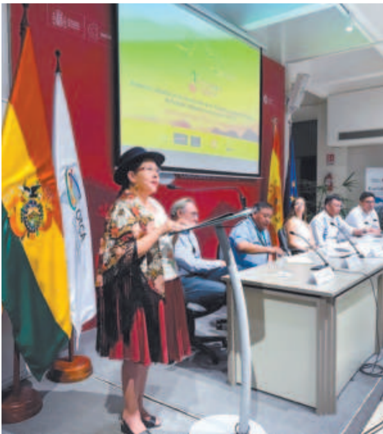
La canciller Celinda Sosa.

El evento también permitió socializar los resultados, logros y desafíos en el proceso de creación de la Plataforma Regional Amazónica de Pueblos Indígenas, un esfuerzo enfocado en integrar los saberes ancestrales de los pueblos indígenas a las estrategias de resiliencia y adaptación ante el cambio climático en la región.