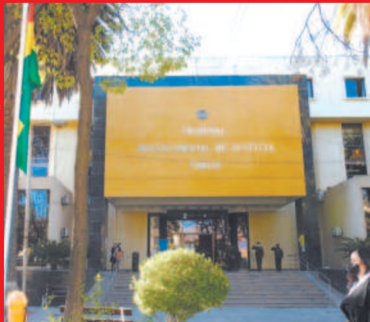
Fiscalía de Tarija.