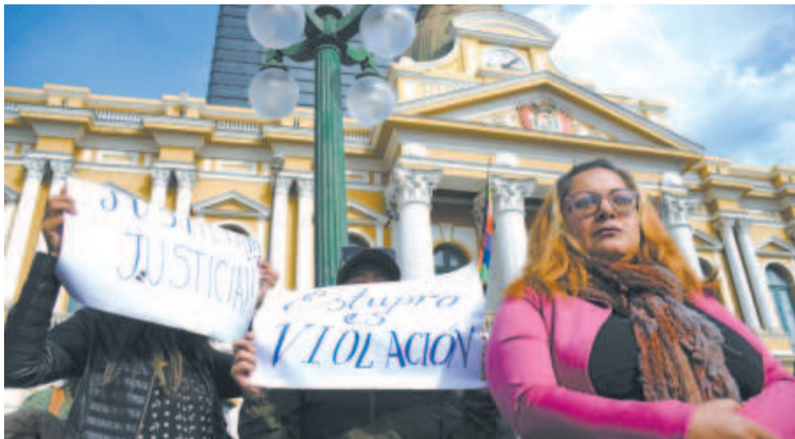
Protesta de mujeres por el caso de estupro y trata que involucra a Morales.

El exdirigente de la CSUTCB Rufo Calle denunció que el expresidente Morales creó grupos juveniles en los nueve depar-