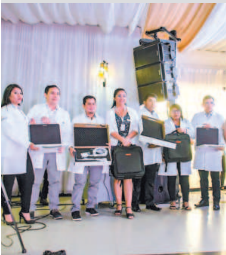
Participantes del Congreso de Telesalud.