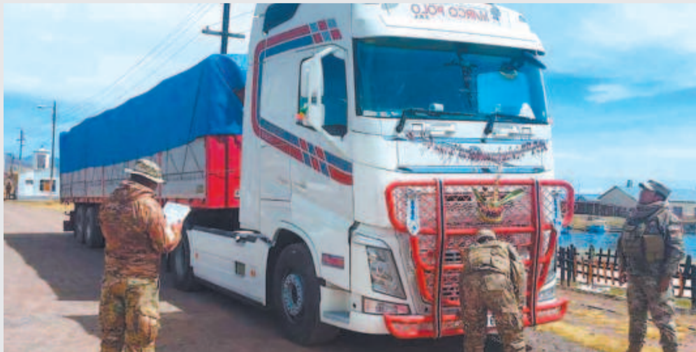
Los controles en las fronteras del país serán más rigurosos.

El Comité de Seguridad Alimentaria señaló que extremará medidas para garantizar el abastecimiento de los productos para la población boliviana.