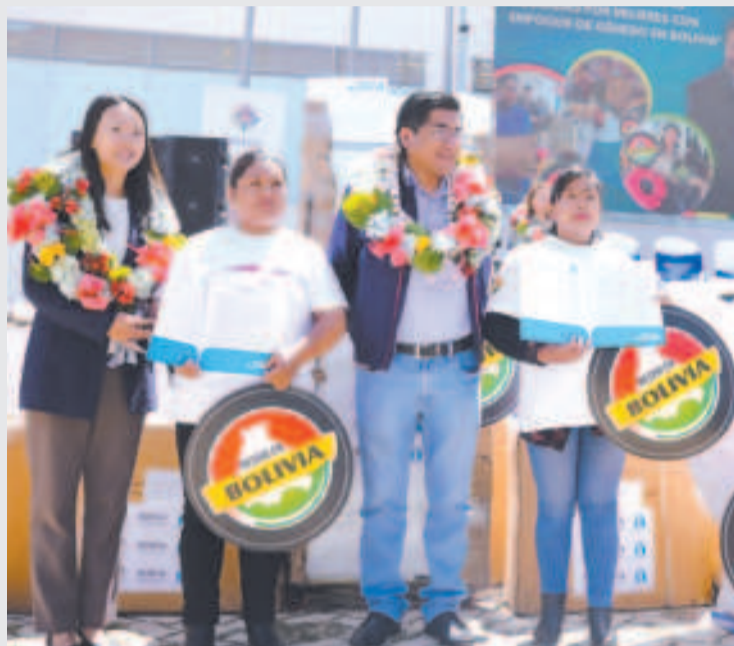
Algunas de las beneficiadas con la entrega de maquinarias y equipos.

A través de una iniciativa conjunta entre el gobierno del presidente Luis Arce y la Cooperación Internacional de Corea (Koica), emprendedoras de El Alto fueron beneficiadas con la entrega de maquinaria, equipos y mobiliario, con el objetivo de fortalecer la producción nacional. La inversión total alcanza los Bs 301.530.