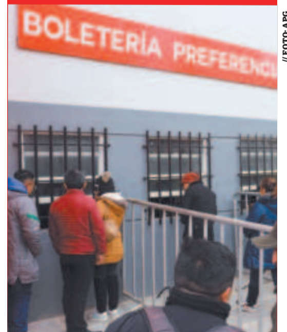
Se agotaron las entradas para el cotejo del jueves.

Contaron que los boletos que cuestan 60 bolivianos están ofreciendo en 150 y 200 bolivianos y los que valen a 100 en 350 bolivianos.