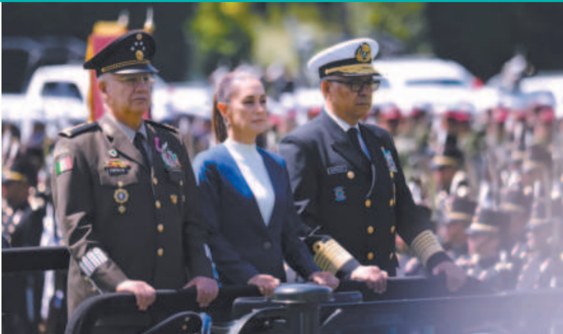
Claudia Sheinbaum en el reconocimiento militar mexicano a su mandato.