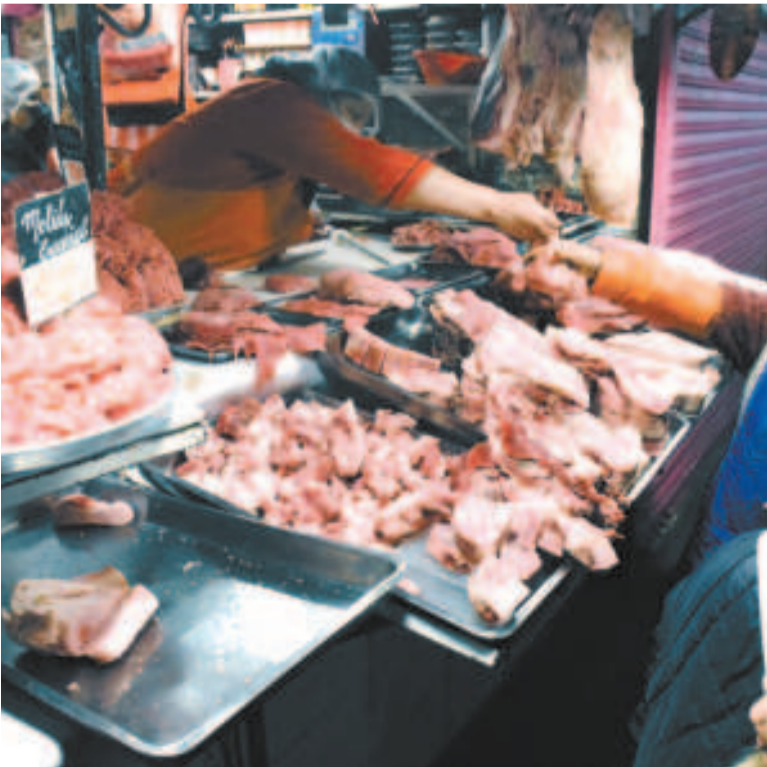
Los mercados registran un incremento del precio de la carne de res en gancho.