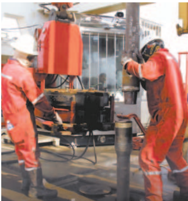
Actividades de exploración petrolera.