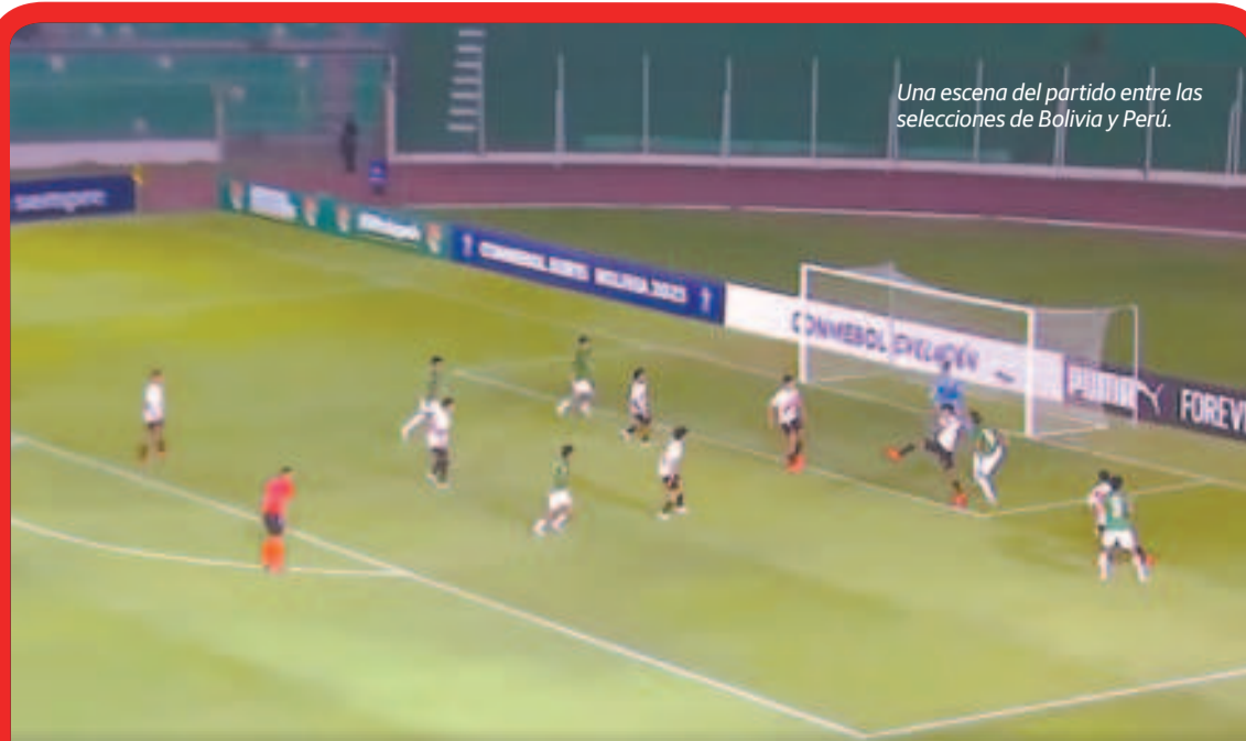
Una escena del partido entre las selecciones de Bolivia y Perú.