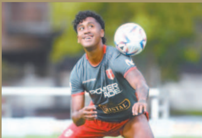
El mediocampista Renato Tapia se lesionó y es baja en la selección peruana.

Aún no se sabe la fecha exacta de regreso de Tapia, lo único confirmado es que no estará ante Uruguay y Brasil, dos partidos claves para Perú en la búsqueda de salir del fondo de la tabla.