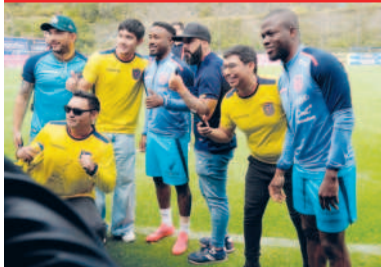
Seleccionados ecuatorianos interactúan con los hinchas en el cierre de prácticas.

El cotejo tendrá un condimento especial, ya que significará el reencuentro de la selección ecuatoriana con un viejo conocido como Gustavo Alfaro, quien los llevó al Mundial Qatar 2022 y cuya etapa dejó un gran recuerdo.