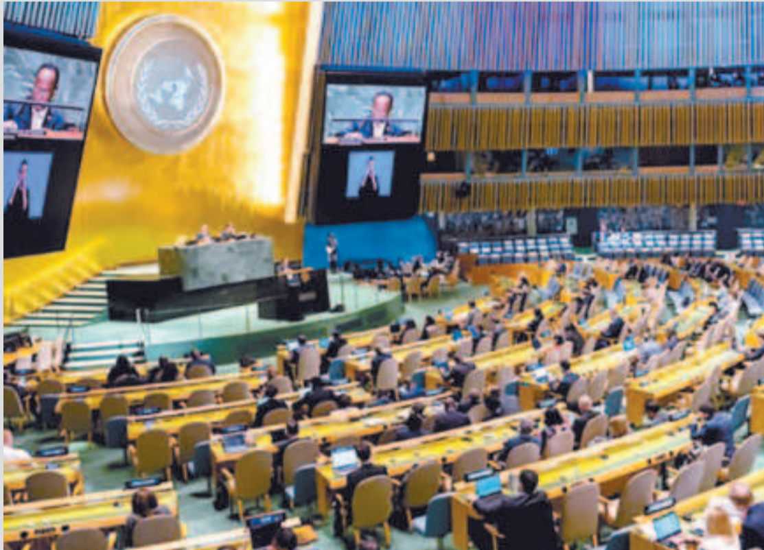
Asamblea General de la ONU.

país se compromete a promover un diálogo constructivo y respetuoso en el Consejo de Derechos Humanos; fomentar la cooperación internacional y la asistencia técnica