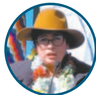
Eva Copa Alcaldesa de El Alto

“Hoy iniciamos esta construcción porque los recursos siempre serán para el pueblo”.