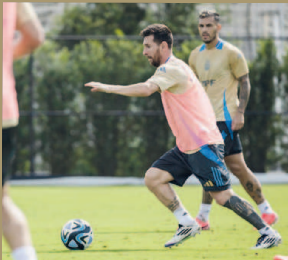
Lionel Messi volverá a capitanear al seleccionado argentino en el duelo contra Venezuela.

Argentina: Rulli; Montiel, Otamendi, Lisandro Martínez, Tagliafico; De Paul, Paredes, Enzo Fernández, Lo Celso; Messi y Julián Álvarez. DT: Lionel Scaloni.