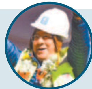
Luis Arce Catacora Presidente del Estado

“Ya podremos intercambiar nuestros productos de los Yungas al altiplano”.