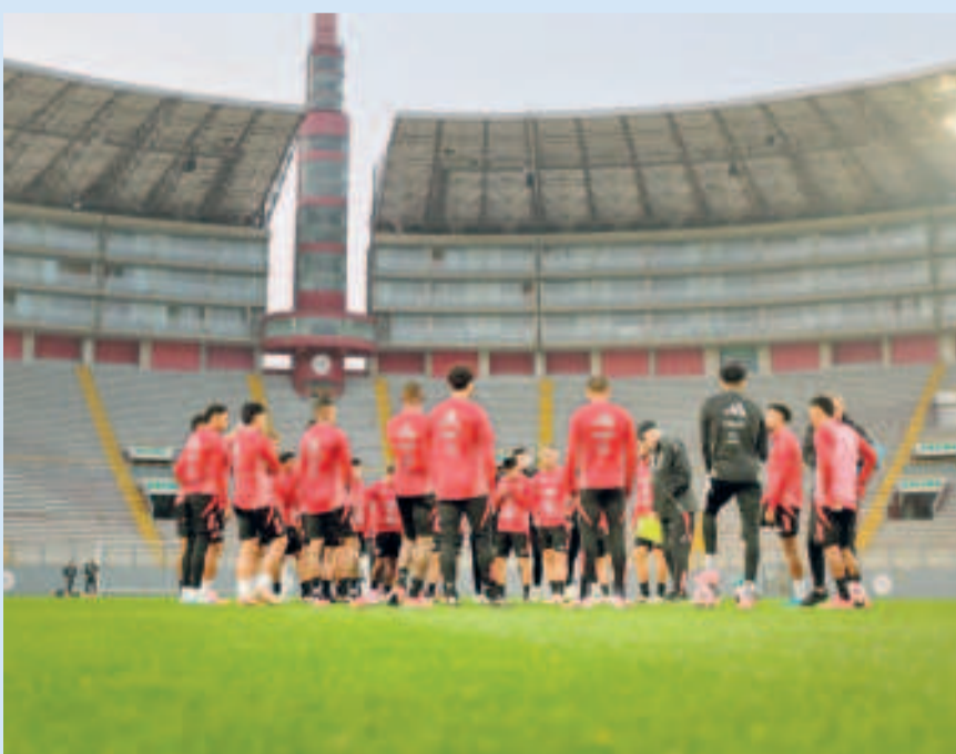
Jugadores del equipo peruano escuchan la charla técnica del técnico Jorge Fossati.

Respecto al último partido ante Venezuela en Mar del Plata, la Celeste recuperará a Federico Valverde y a Nahitan Nández, que se habían perdido el encuentro por acumulación de amarillas.