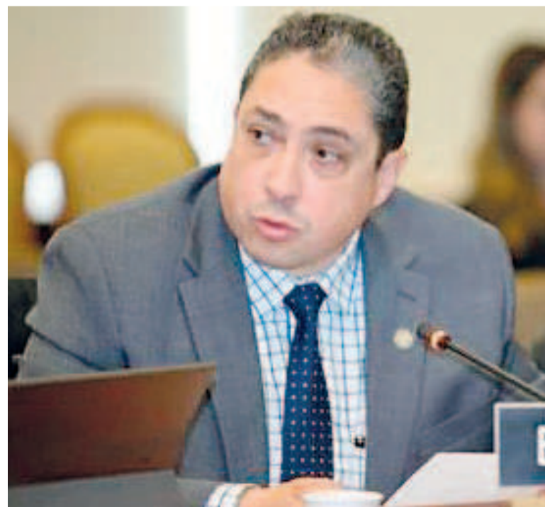
El embajador de Bolivia ante la OEA, Héctor Arce Zaconeta.

También planteó la posibilidad de aumentar la cantidad de los jueces de la Corte-IDH a un juez por cada una de las nacionalidades de los países que aceptaron plenamente su jurisdicción.