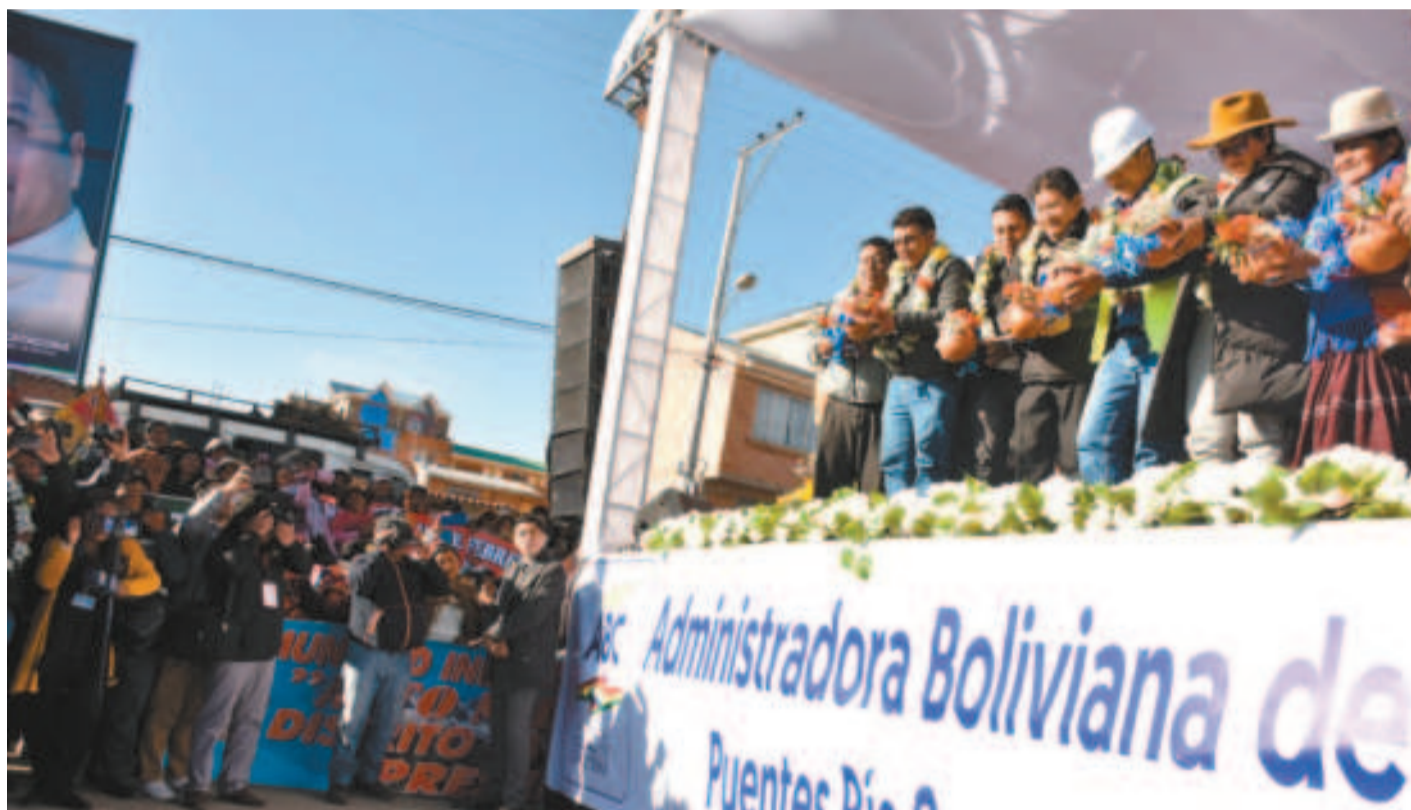
El momento de la ch'alla de las obras por parte de autoridades nacionales y locales.

El tramo vial pasa por las zonas alteñas Distrito 5, Ingenio Originario, Siete Lagunas, Achachicala Centro y por la comunidad de Chacaltaya.