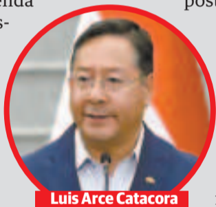
Luis Arce Catacora

“Este resultado es un claro reconocimiento internacional al liderazgo de Bolivia en la promoción y protección de los derechos humanos, especialmente en beneficio de los grupos más vulnerables, como mujeres, pueblos indígenas y campesinos. Seguiremos trabajando en los foros multilaterales para defender los derechos humanos, avanzar en la agenda de desarrollo sostenible y amplificar las voces de quienes más lo necesitan”, publicó en redes sociales el presidente Luis Arce al respecto.