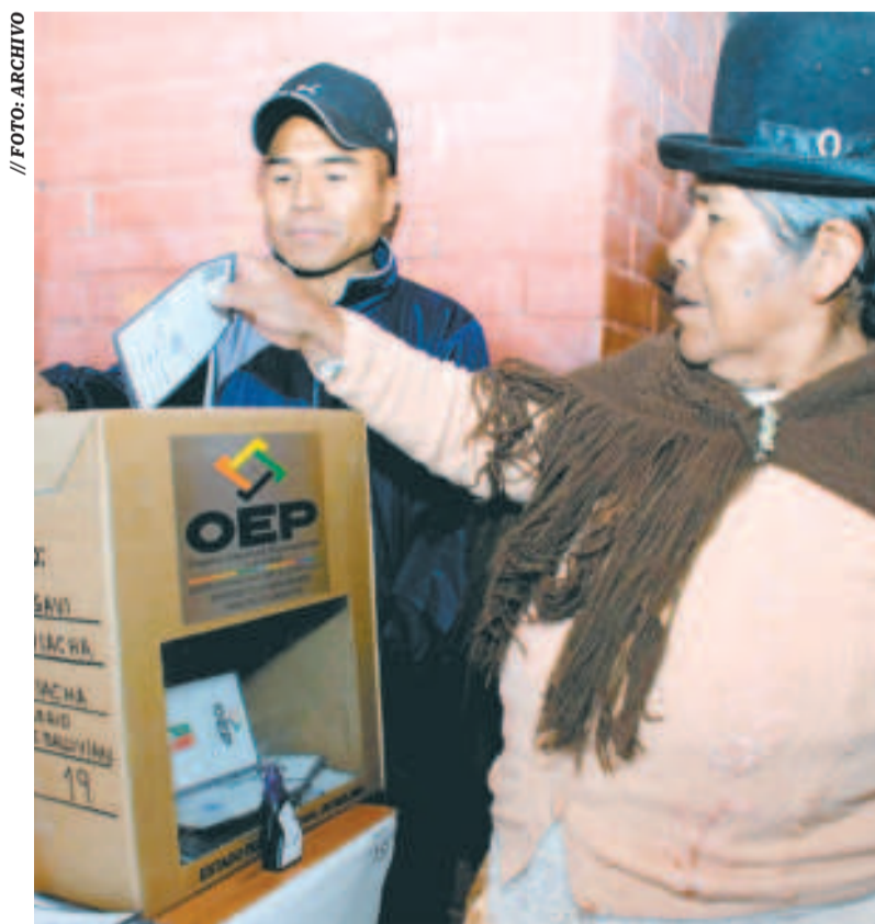
Una mujer emite su voto en un ánfora.