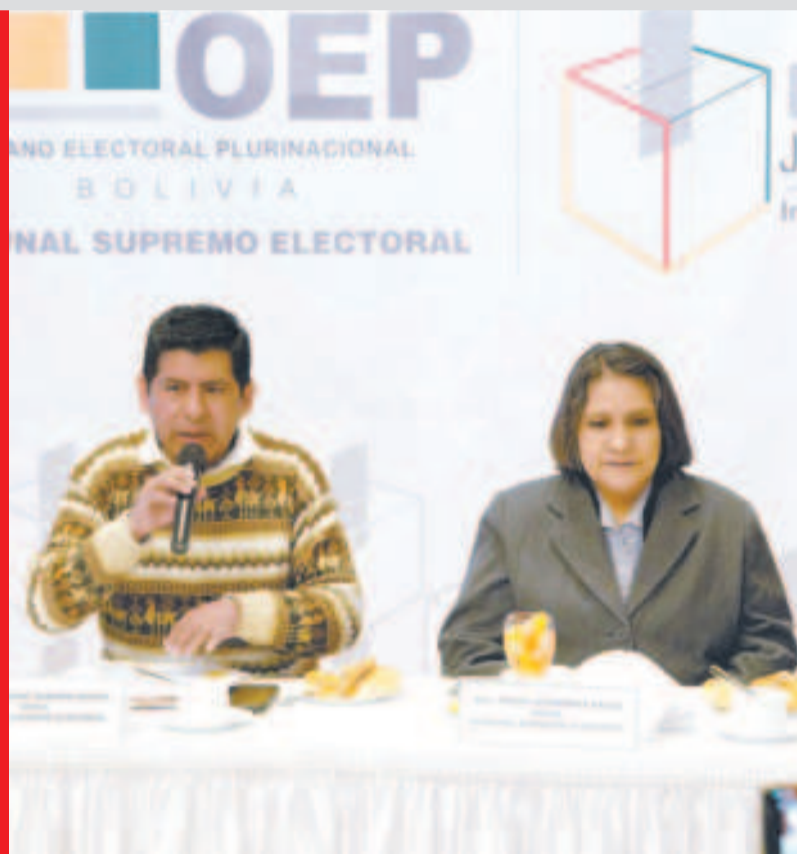
Vocales del TSE en conferencia en La Paz.