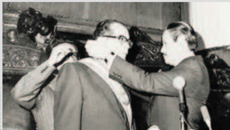
Posesión del presidente Hernán Siles Zuazo, en 1982.

dictadura militar colapsó y el poder regresó al Congreso Nacional, conformado según la composición de 1980, que decidió considerar válidas las elecciones de 1980 y designar, en consecuencia, a Siles Zuazo como presidente.