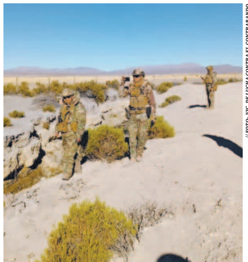
Control militar en la frontera Bolivia-Chile.

"Esto implica ya un delito que está penado de 10 a 14 años de cárcel. Entonces, esta norma ya va a instrumentar todo y vamos a lograr estabilizar los precios", indicó.