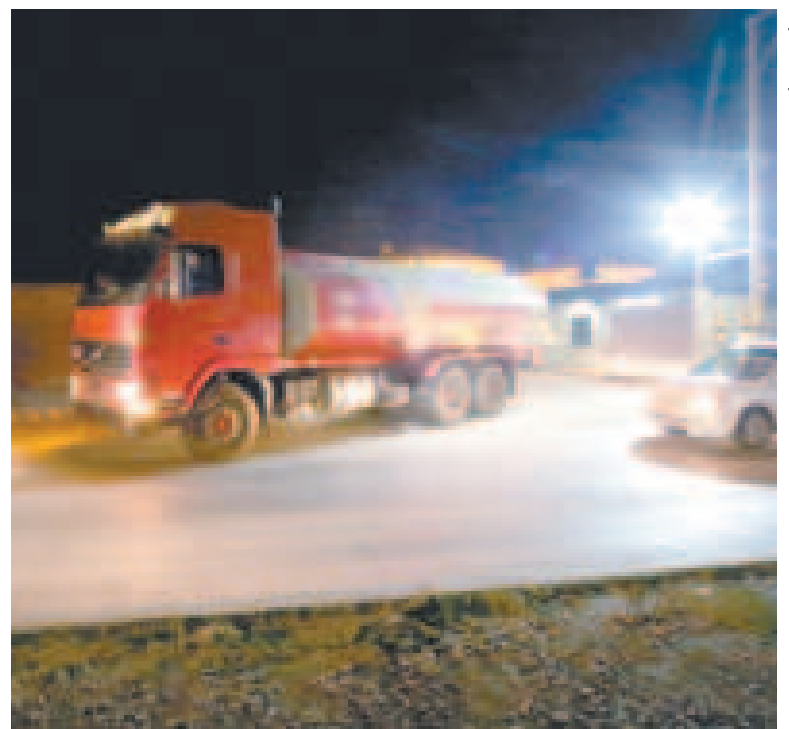
El despacho de combustibles de una planta de almacenaje de YPFB.