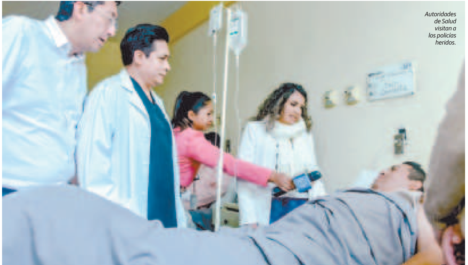
Autoridades de Salud visitan a los policías heridos.

“Uno de los casos más delicados es el del policía que sufrió una lesión en el pie. Nos hemos encontrado con él y con su hermana durante la visita. En total, tenemos 22 policías heridos, algunos de los cuales están internados en hospitales de la Caja Nacional en Cochabamba, Oruro y La Paz. El paciente más complicado ha pasado por una primera cirugía de reconstrucción, y mañana se someterá a una nueva intervención”, informó.