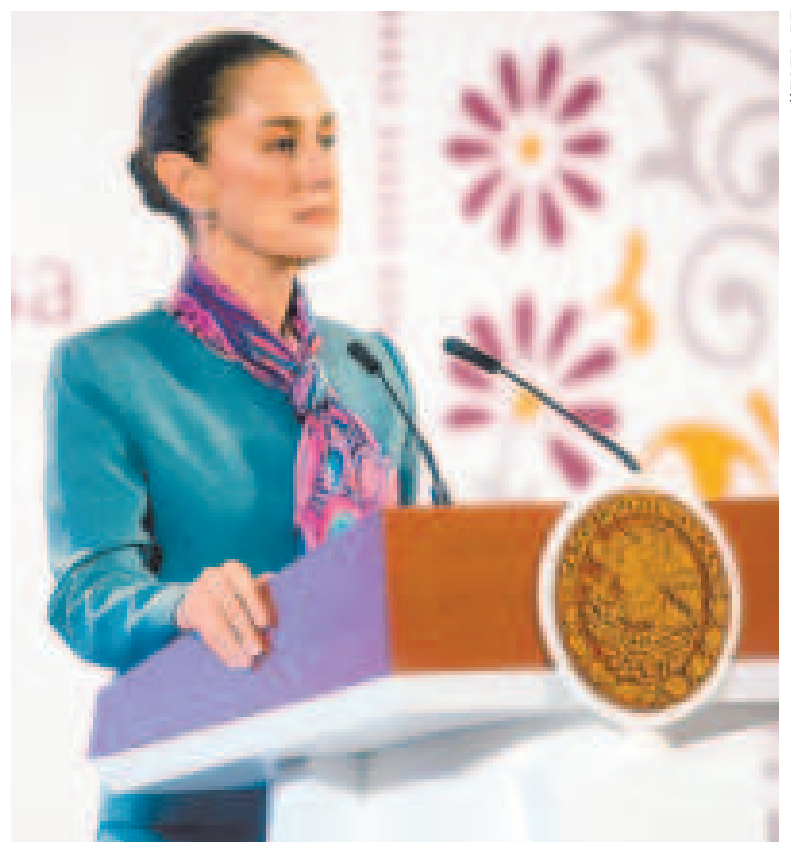
La presidenta de México, Claudia Sheinbaum.

También recordó sus promesas de campaña y anunció tres nuevos programas de bienestar: apoyo a mujeres de 60 a 64 años, asistencia a estudiantes de escuelas públicas hasta secundaria y atención de salud a domicilio para adultos mayores.