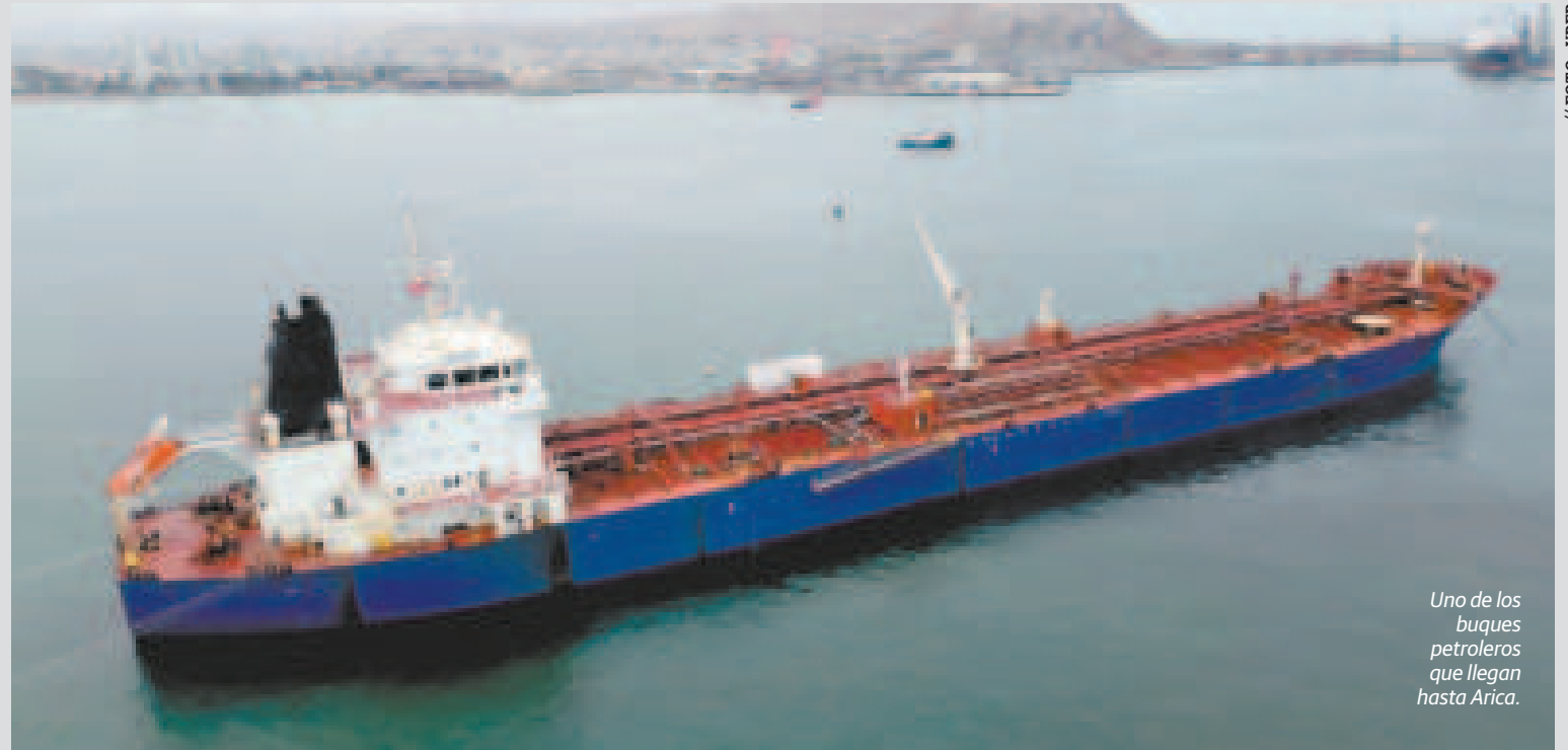
Uno de los buques petroleros que llegan hasta Arica.

Entre el 15 y 18 de este mes, las condiciones climatológicas en el puerto permitieron a la firma petrolera descargar gasolina del buque Largo Edén.