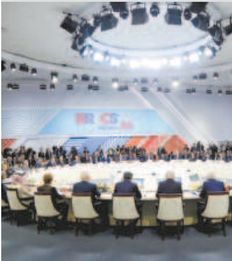
Entre más de 30 países, Bolivia y Cuba fueron elegidos para ser Estados asociados del bloque.