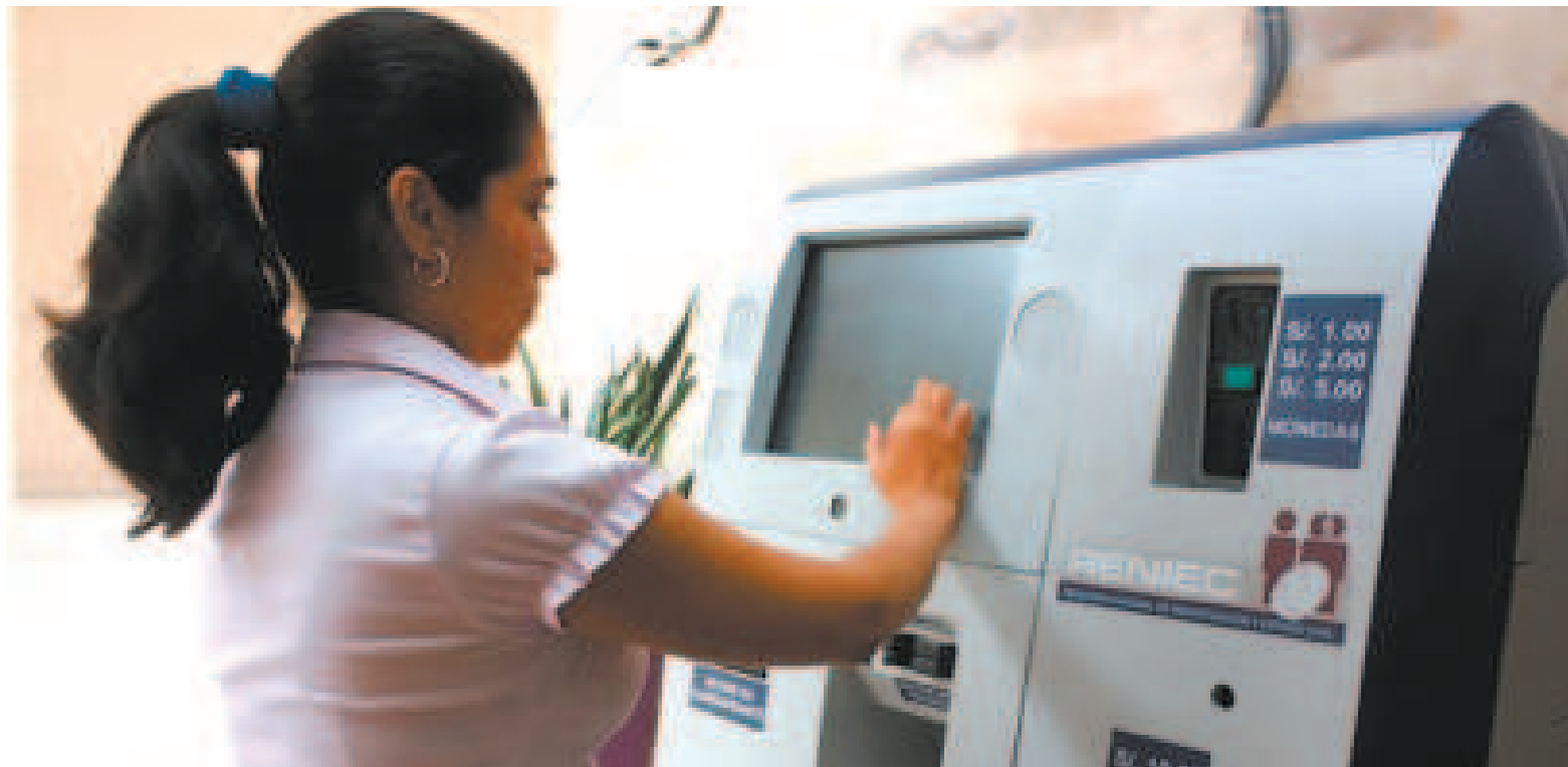
Perú fue el primer país en tener un sistema automatizado para la obtención de documentos personales.