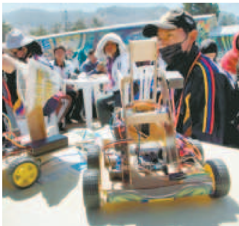
Jóvenes se aprestan a participar en el campeonato.