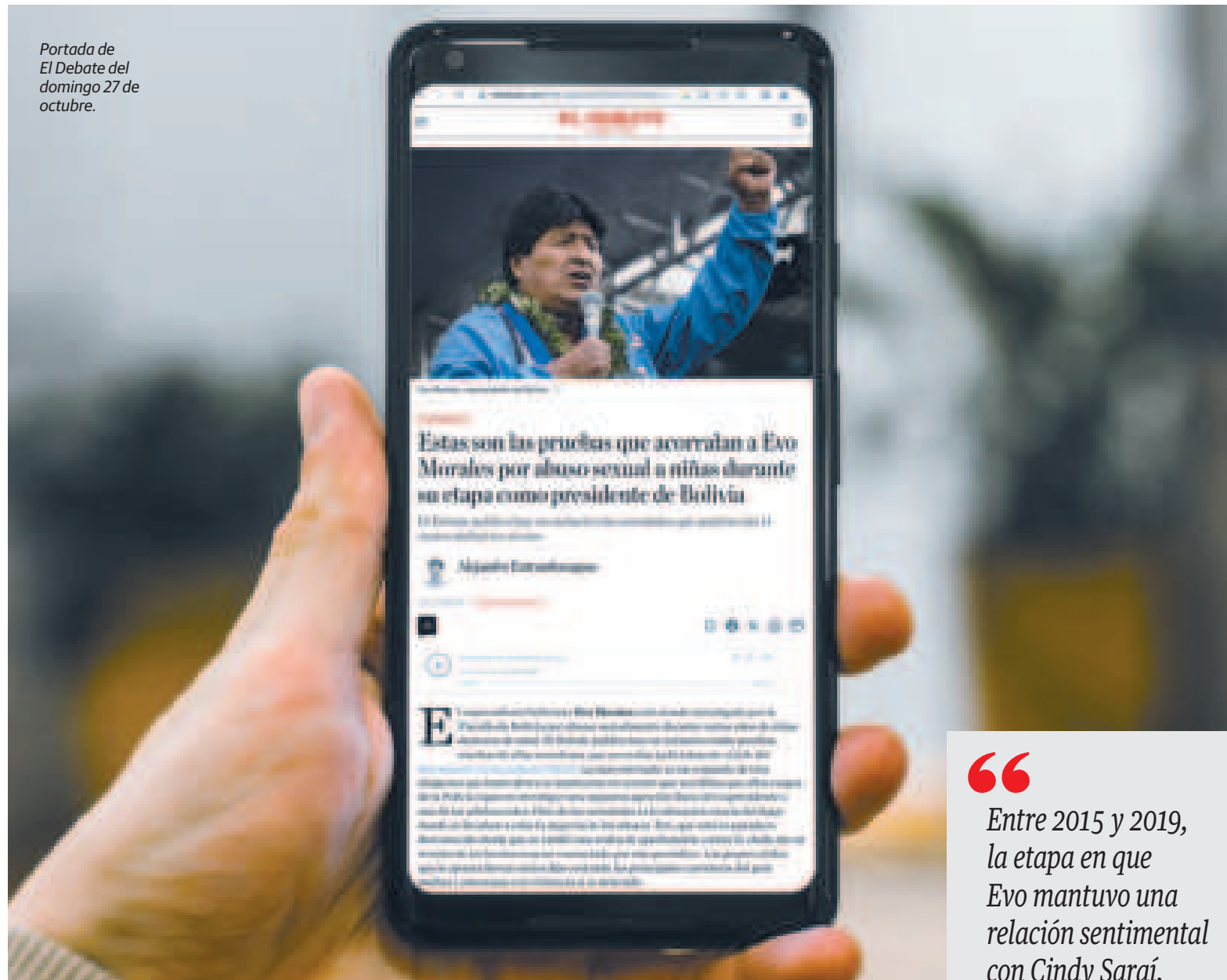
Portada de El Debate del domingo 27 de octubre.

El Debate asegura que “un miembro de la escolta que entonces tenía el mandatario, hacía beber a las niñas su alcohol preferido, Ron Kayana”.