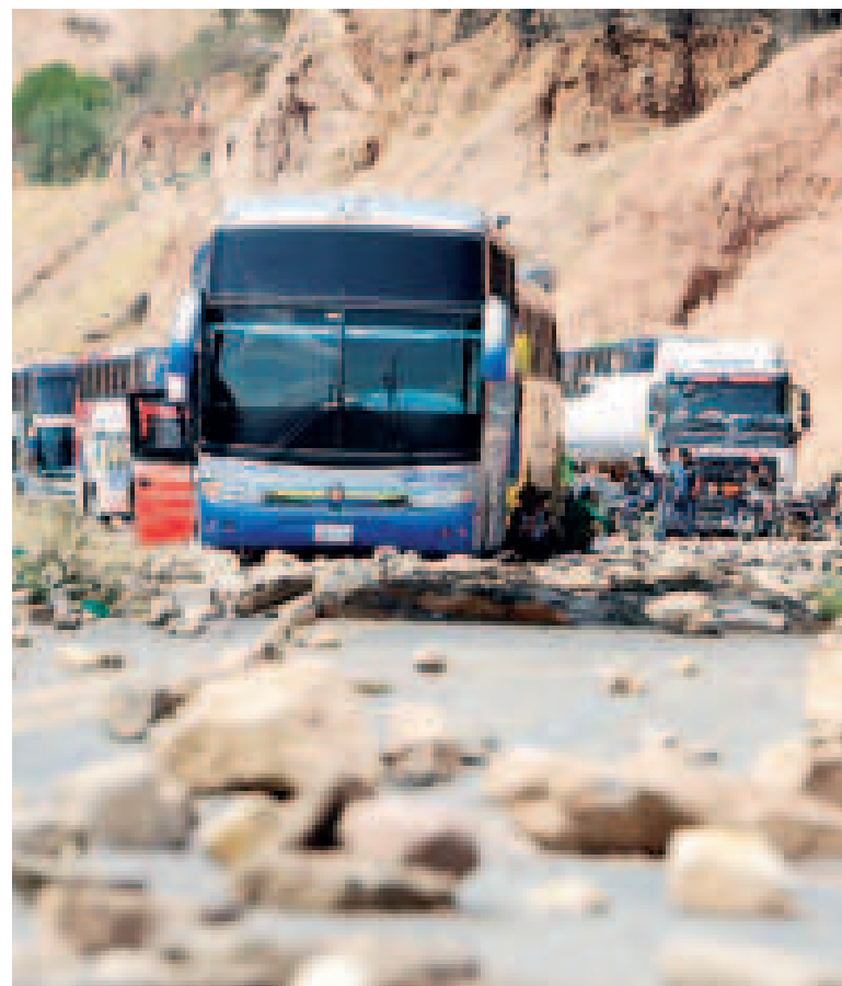
Los bloqueos evistas provocan graves daños a la economía de los bolivianos.