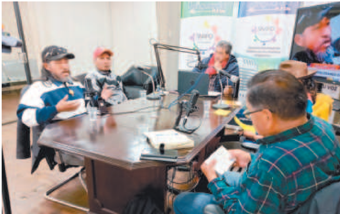
Panelistas invitados al programa radial de las RPO.

“Ahora su enfoque se centra en el cálculo político. Buscan cómo perjudicar al Gobierno y consideran que bloquear es la mejor manera de desestabilizar, porque se provoca un aumento en el precio de la canasta familiar por la falta de combustible”, agregó.