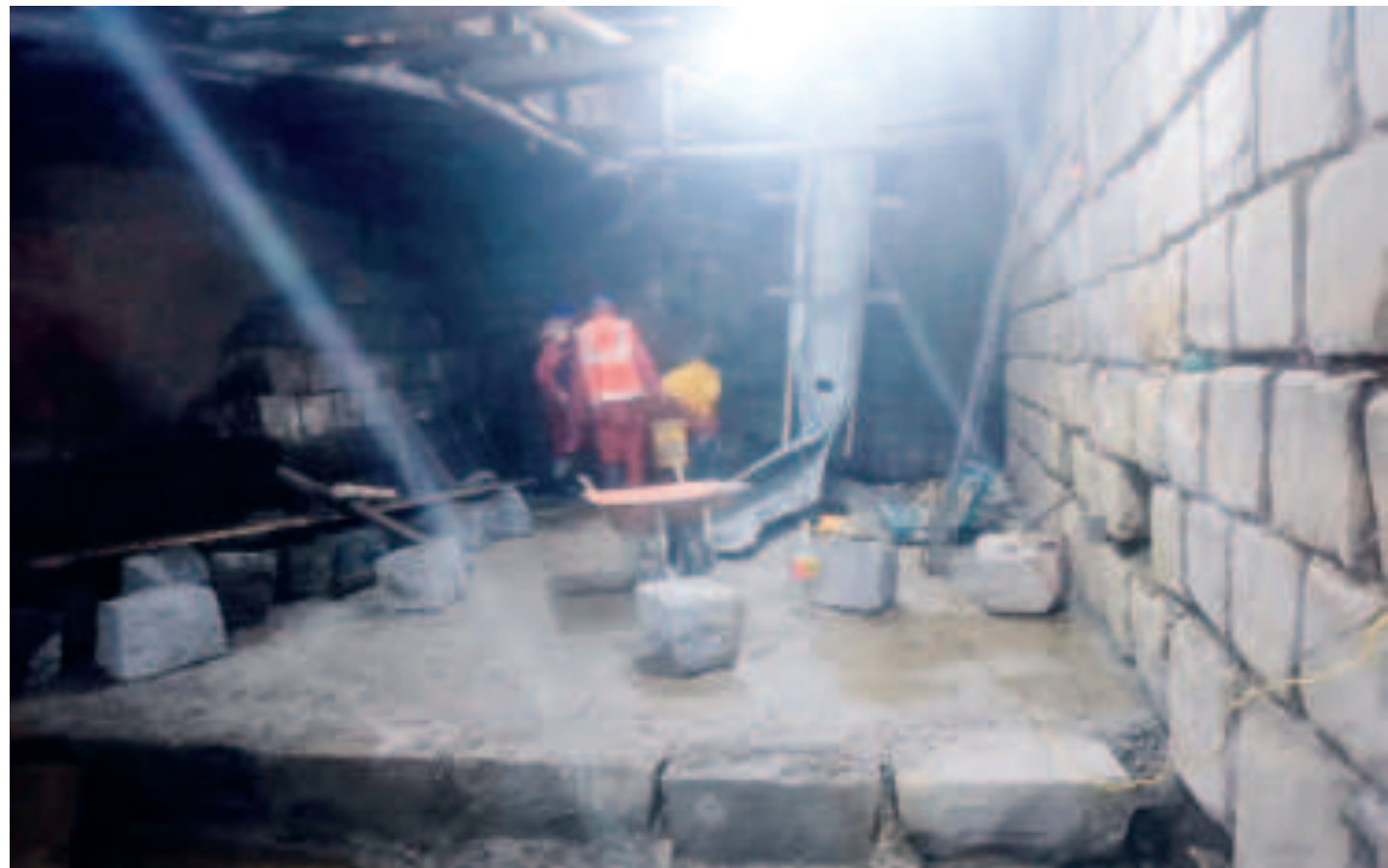
Obreros en el interior de la bóveda del río Choqueyapu, en San Francisco.

“Pese a los avances, la situación es crítica, especialmente en la llamada caída 13, ubicada cerca de San Francisco, donde el Ejecutivo municipal nos advirtió del riesgo de un sifonamiento de hasta 21