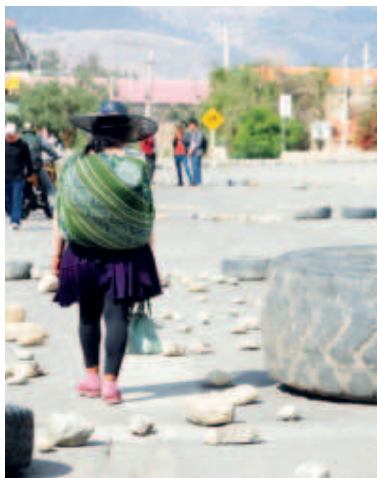
Los bloqueos del evismo costaron cerca de $us 4 mil millones a Bolivia solo este año.