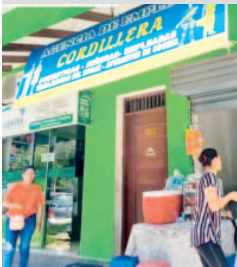
Una de las agencias de empleo ubicada en la avenida Cañoto, Santa Cruz.