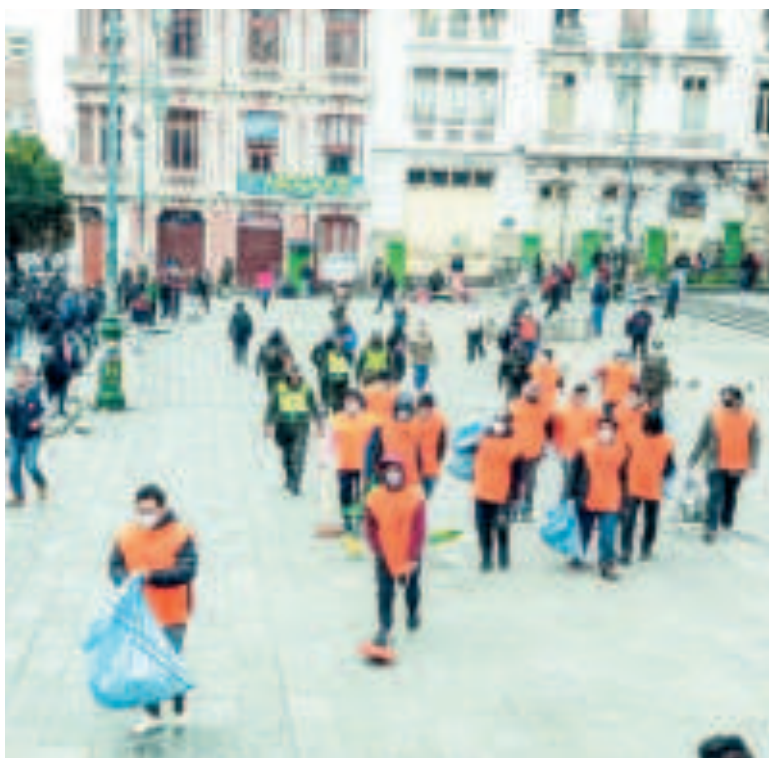
Personas arrestadas por consumir bebidas alcohólicas en vía pública.

El caso ha sido remitido al Ministerio Público para determinar la situación jurídica del aprehendido, especialmente porque la discoteca funcionaba en un área céntrica, próxima a una universidad y varias unidades educativas, lo que generaba preocupación entre los vecinos de la zona.