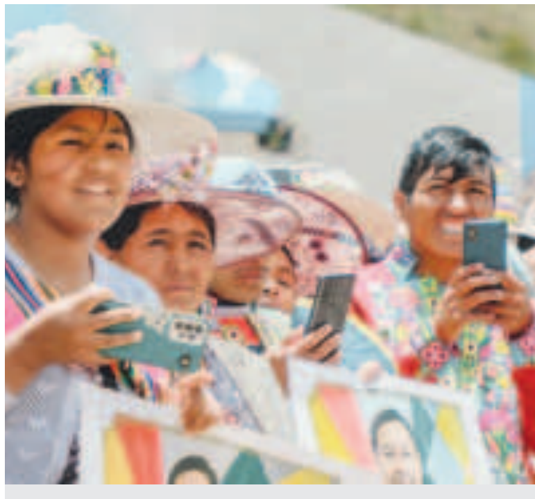
Habitantes de Potosí con acceso a telefonía móvil.