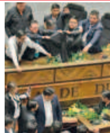
Incidente en la ALP.

"Estas aguas turbias se van a ir aclarando durante el proceso de la convocatoria a la elección general presidencial, esto empezará el 12 de abril de 2025", apuntó.