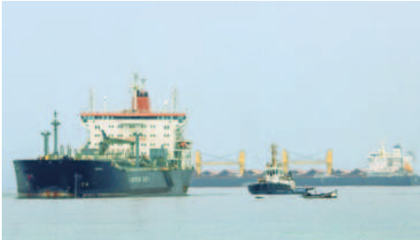
Los buques con combustible están en Arica.