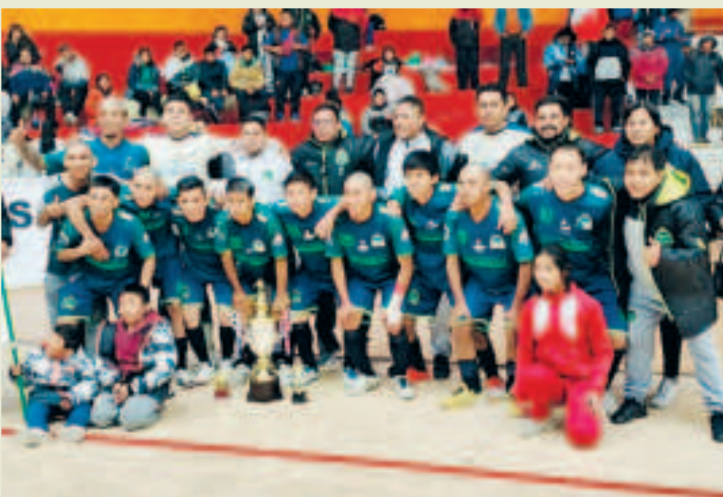
El equipo Las Casas Constructora se clasificó a las finales de la Copa Simón Bolívar de futsal.