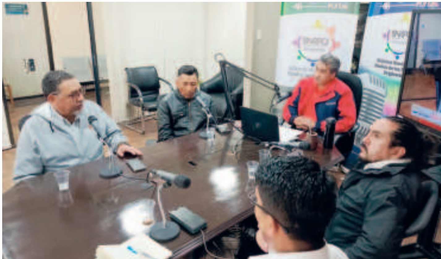
Panelistas invitados al programa radial de las RPO.

“El evismo considera que cuando retorne Evo al gobierno se solucionará todo automáticamente”, criticó.