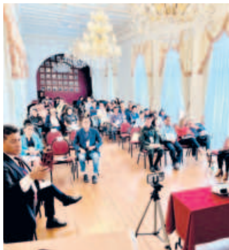
El encuentro de periodistas, en Sucre.

Los próximos encuentros de periodistas, para emitir sus pronunciamientos, están programados en ciudades de Cochabamba, Potosí, La Paz, Oruro, Tarija, Santa Cruz, Beni y Pando, cubriendo así el país entero en una conmemoración que resalta la importancia de la Ley de Imprenta en la consolidación de la democracia boliviana.