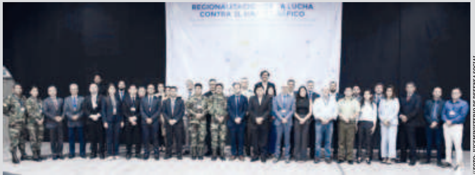
Representantes de 12 países y de organizaciones internacionales.

Representantes de 12 países, junto con organizaciones internacionales, analizaron las transformaciones del narcotráfico en esta parte del mundo.