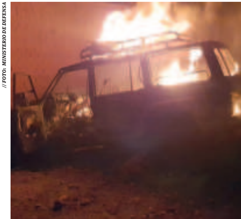
Vehículo incinerado del Grupo de Tarea Lacaya.

Ambos fueron trasladados de emergencia a la Corporación del Seguro Social Militar (Cossmil) en La Paz para recibir atención médica especializada.