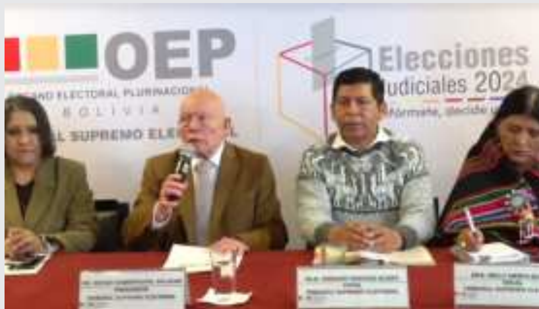
El presidente y vocales del TSE.

de convocar una nueva Asamblea Constituyente.