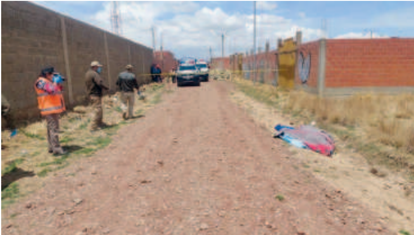
Un caso de feminicidio en el municipio de Viacha, en el departamento de La Paz.