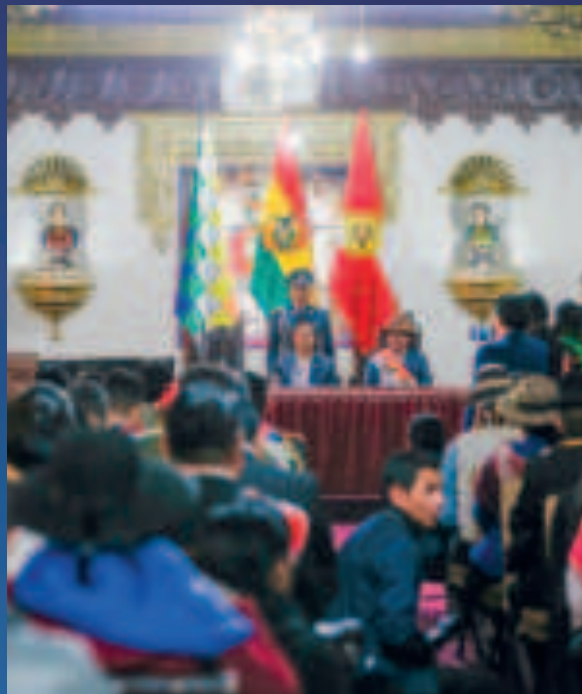
Acto de firma de convenios para obras en Potosí.