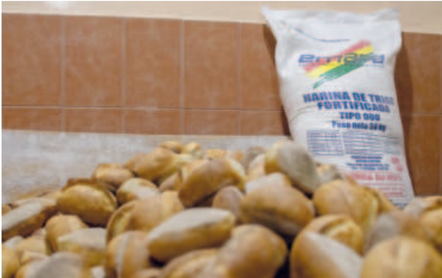
En la presente gestión, Emapa entregará 2,4 millones de bolsas de 50 kilos de harina a los panificadores para asegurar el abastecimiento del pan de batalla.