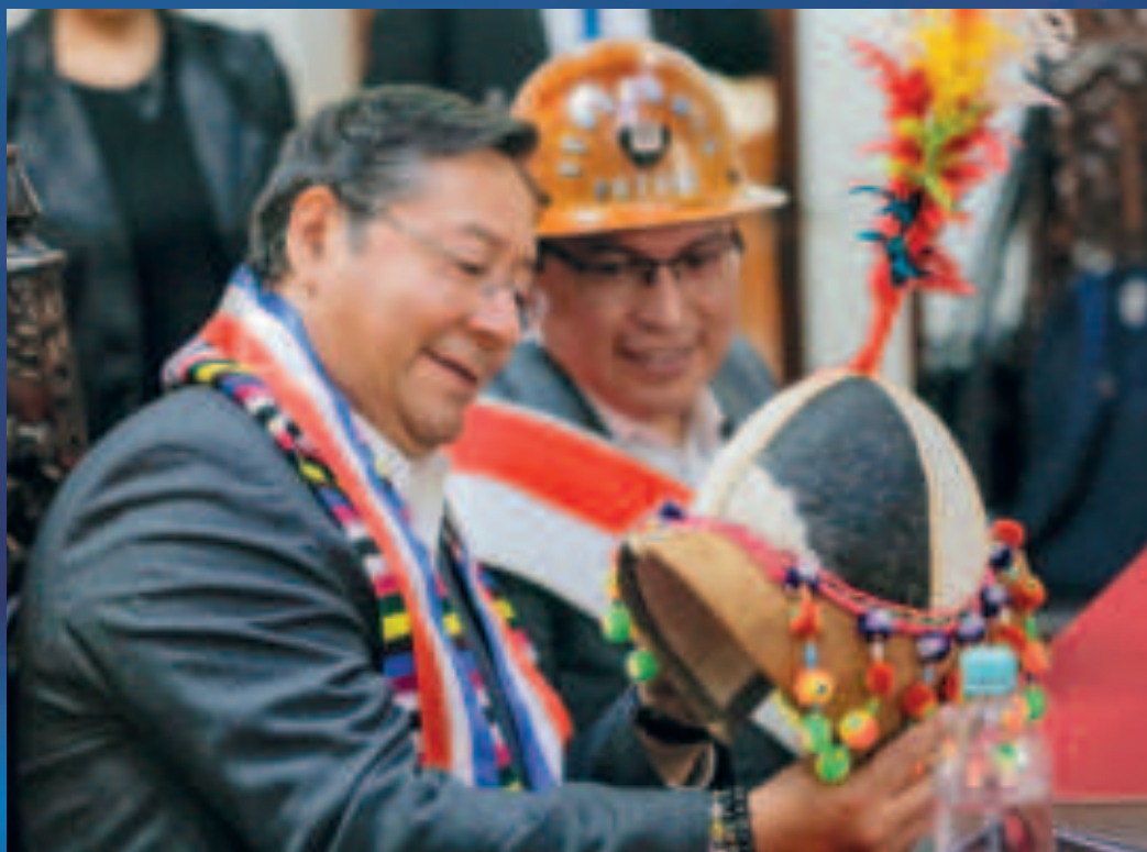
Luis Arce mira un presente que le entregaron.

“Ya van a ir cayendo los precios de los principales productos de la canasta familiar en los mercados para alivio de las amas de casa y también poco a poco para el alivio de los transportistas”, añadió el mandatario boliviano.