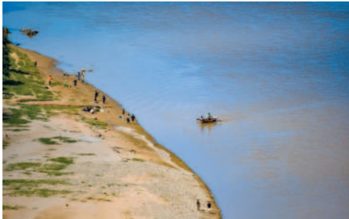
Se impulsan acciones destinadas a reducir el impacto de la crisis climática.

Las iniciativas del proyecto se enfocarán en estudios científicos detallados sobre los impactos climáticos en la dis-