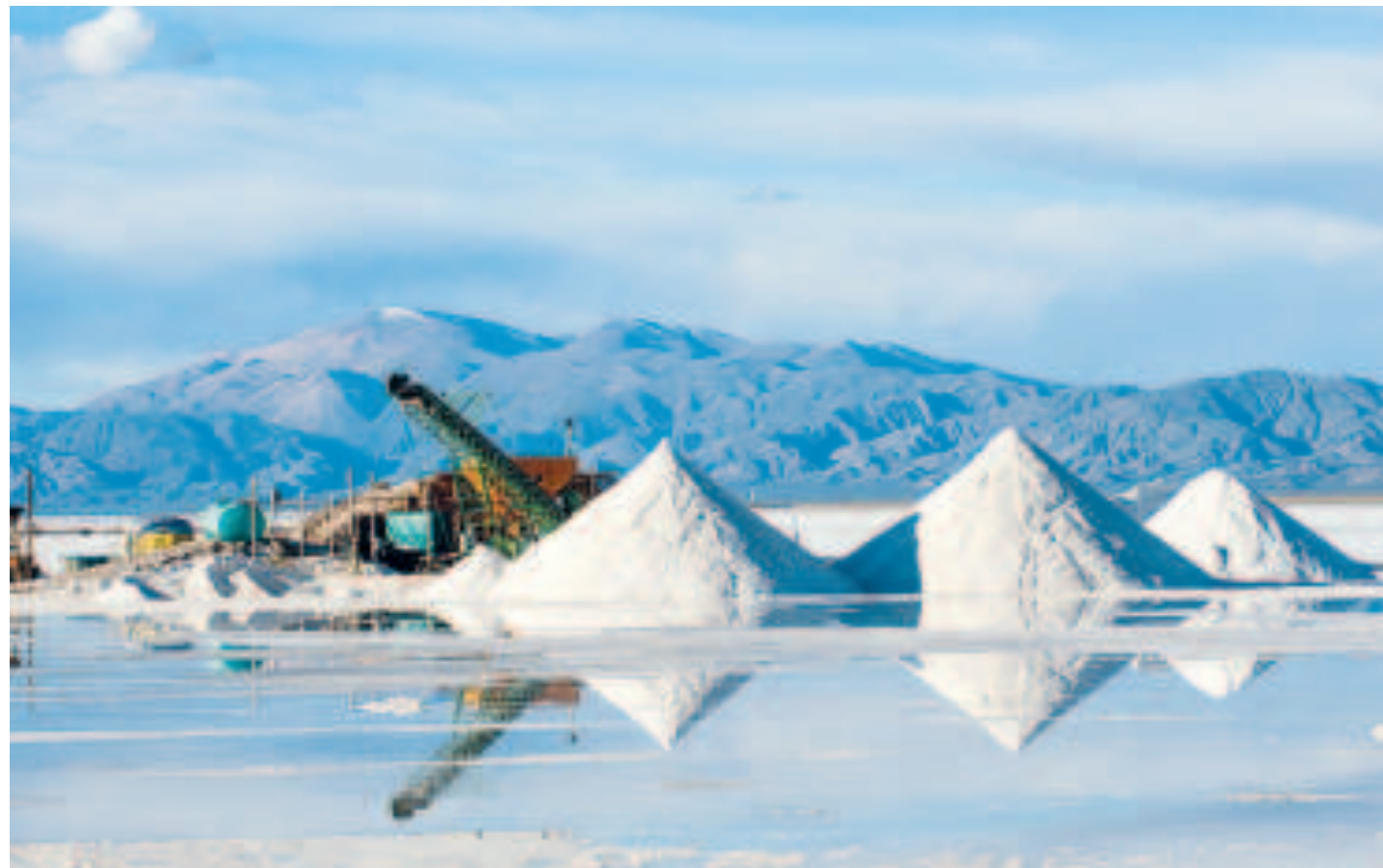
Trabajos que realiza personal de YLB, en el salar de Uyuni.

Alarcón recordó que el contrato es el resultado de