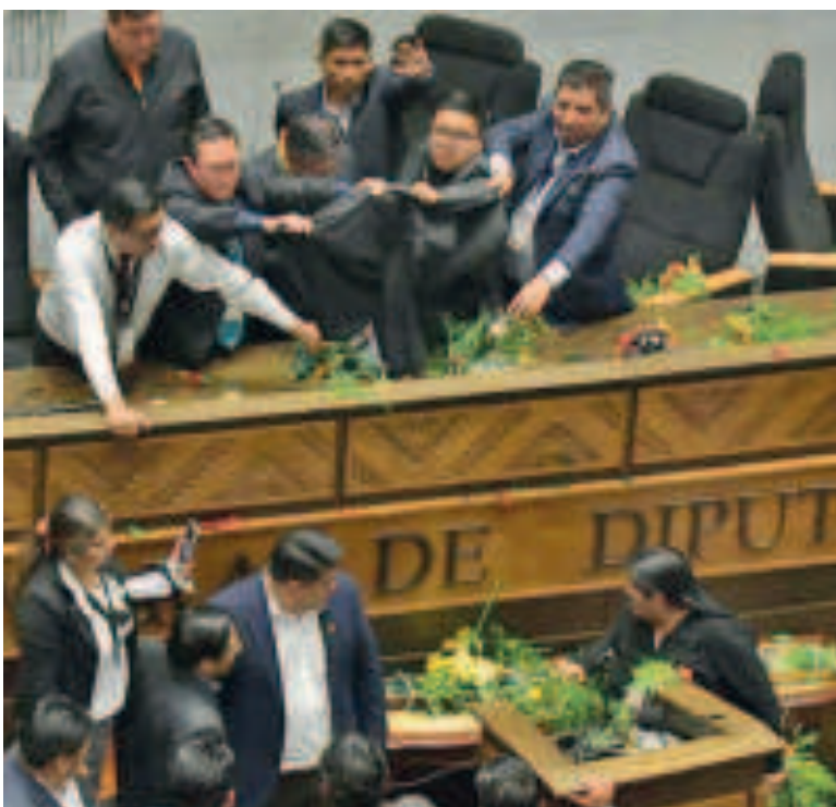
Incidente en la Asamblea el 8 de noviembre.