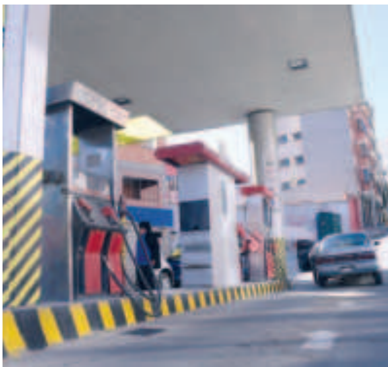
Una estación de servicio que comercializa combustibles.