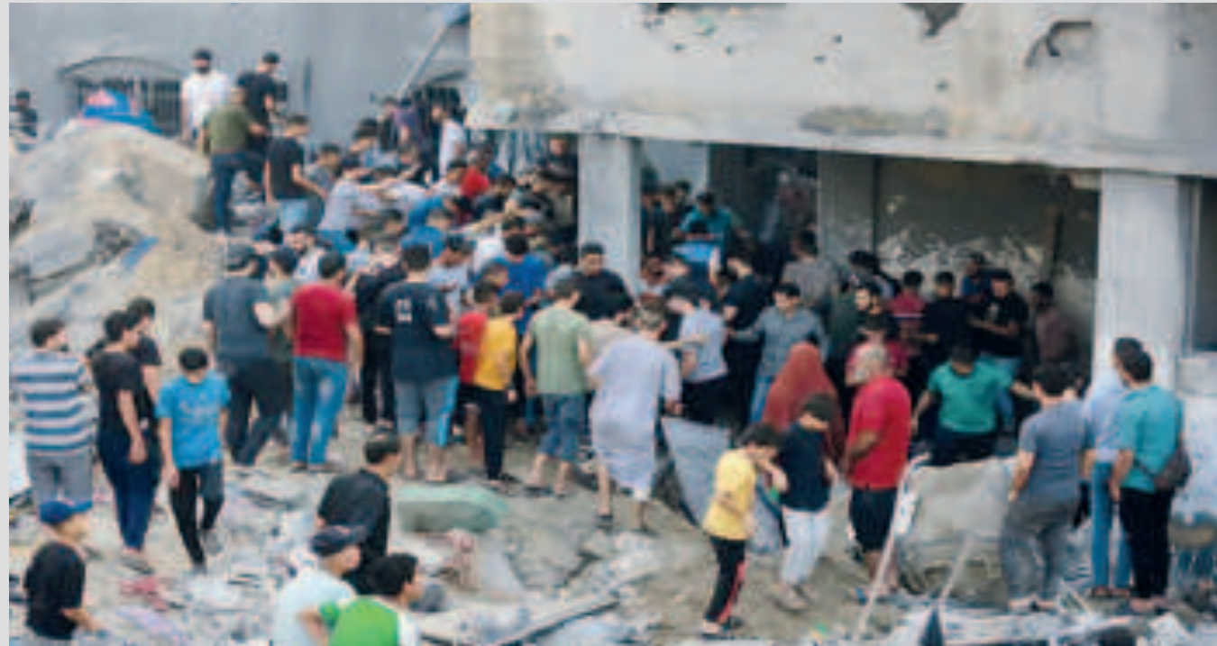
Civiles palestinos colaboran en las acciones de búsqueda y rescate de supervivientes del ataque israelí en la ciudad de Jabalia.

Los rescatistas creen que aún hay muchas más personas atrapadas bajo los escombros y continúan los esfuerzos para localizar a los supervivientes del criminal ataque mientras continúan las operaciones de búsqueda y rescate.