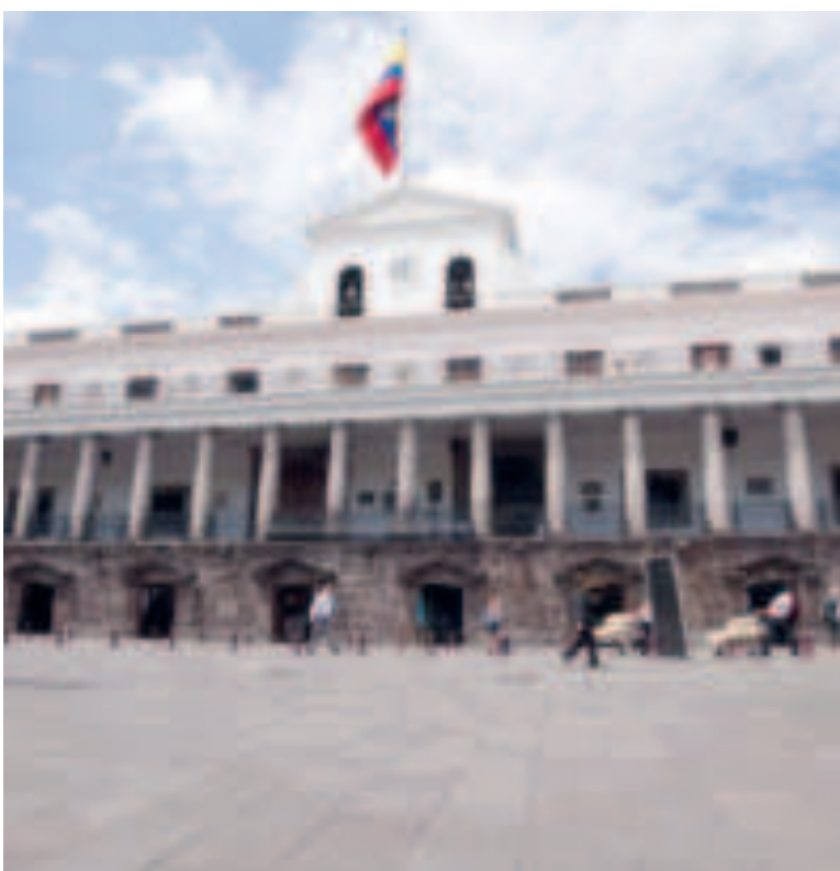
La sede presidencial de Ecuador.