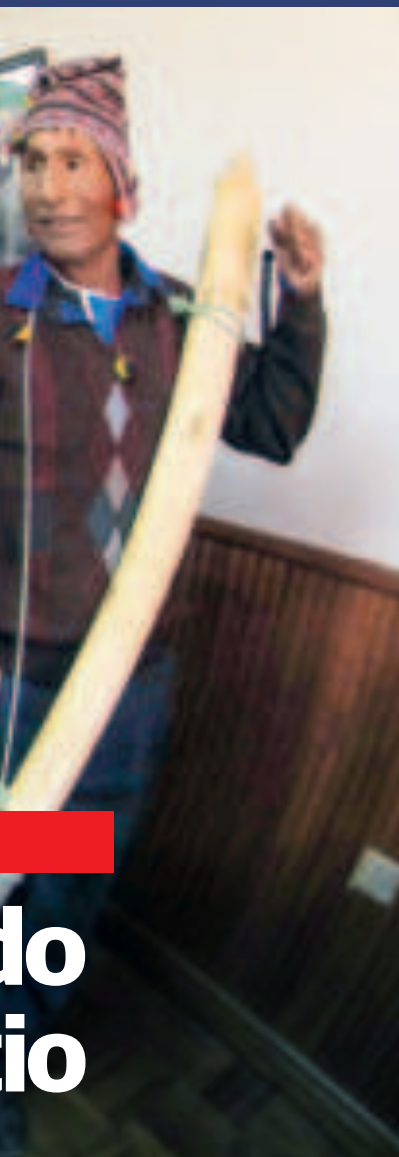
El presidente Luis Arce junto a representantes de organizaciones sociales en los 214 años de la gesta libertaria de Potosí.