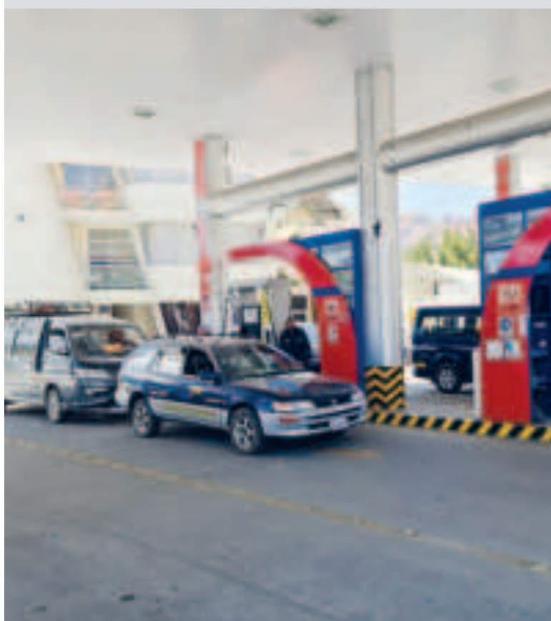
La comercialización de combustibles en una estación de servicio.