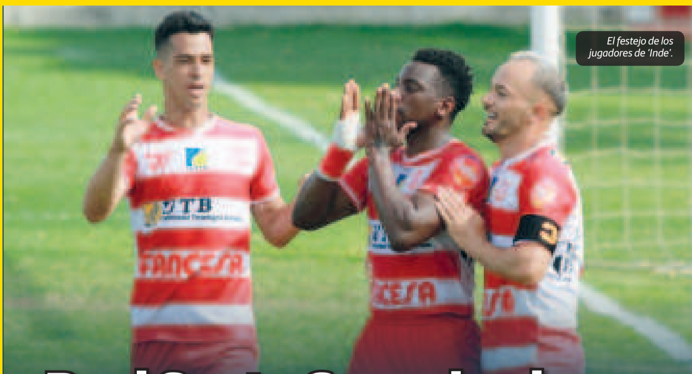
El festejo de los jugadores de 'Inde'.