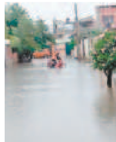
Inundaciones en las calles de Cochabamba.

Otras vías como la avenida Víctor Ustáriz, 6 de Agosto y otras del centro reportaron inundaciones. Varias calles de la OTB Sergio Almaraz, que está en la zona oeste, cerca de la Línea Verde del Tren Metropolitano hacia Quillacollo, quedaron anegadas.