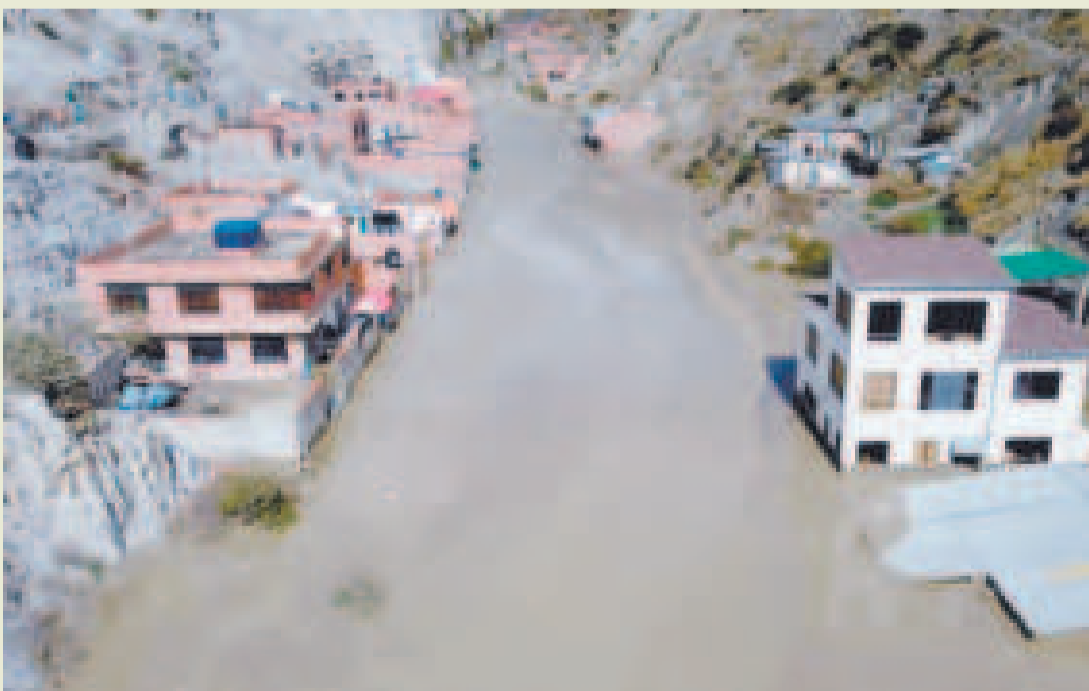
Una intensa lluvia causó una mazamorra que afectó a Bajo Llojeta en la ciudad de La Paz.