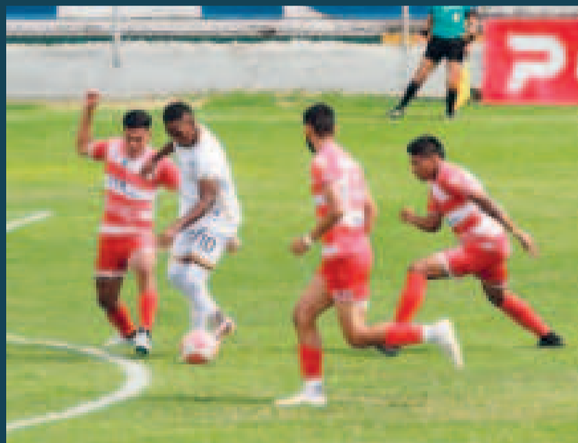
Una escena del cotejo que terminó con triunfo del equipo inmobiliario.

"Me cansé de recibir llamadas, todo tiene un límite y ayer (miércoles) decidí lo que hoy anuncio", dijo el entrenador argentino sin especificar el nombre del dirigente.