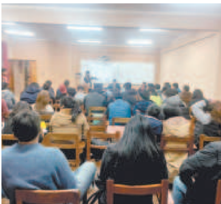
Estudiantes de la Facultad de Ingeniería Minera de la UTO.