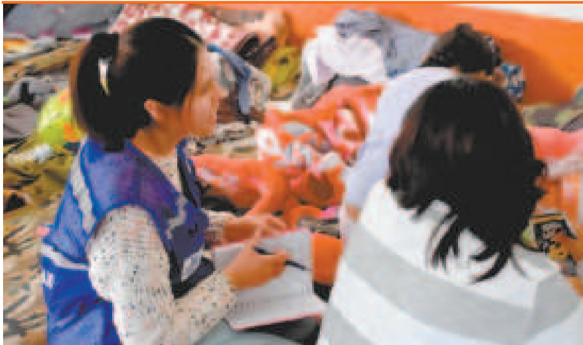
Brigadas del Ministerio de Salud y Deportes atienden a familias en Bajo Llojeta.