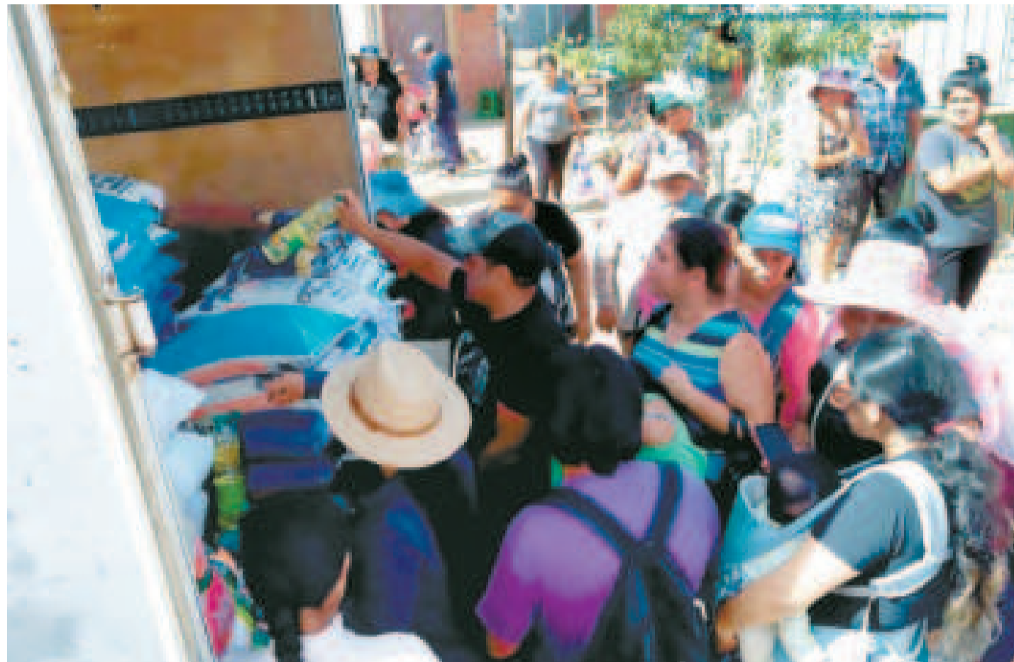
Emapa facilita el acceso a los alimentos a la población.

Además de garantizar precios justos, la estrategia de Emapa responde a la necesidad de descentralizar el