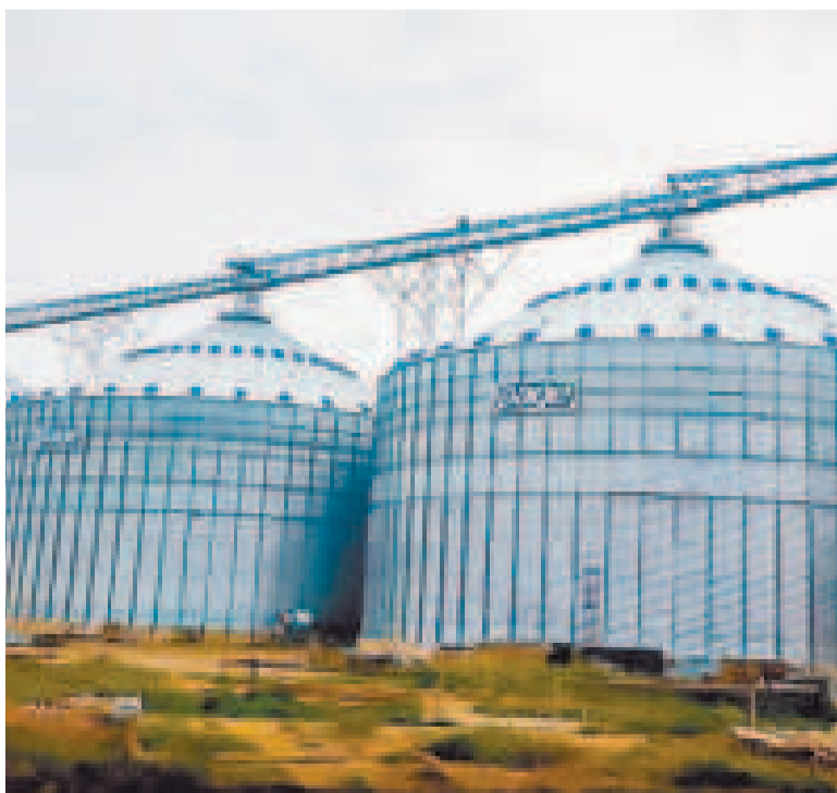
Dos silos principales de la planta.