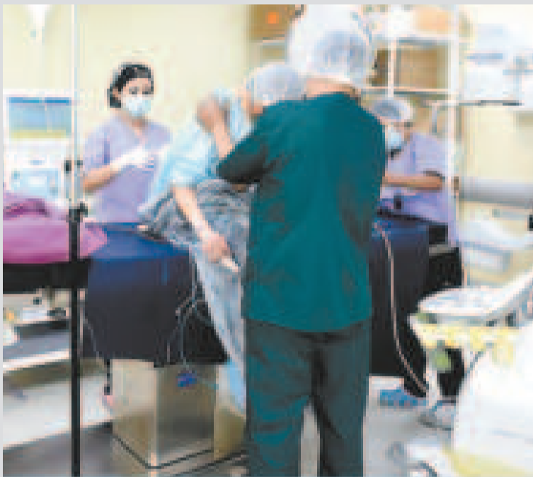
Médicos en el Centro de Medicina Nuclear y Radioterapia de La Paz.