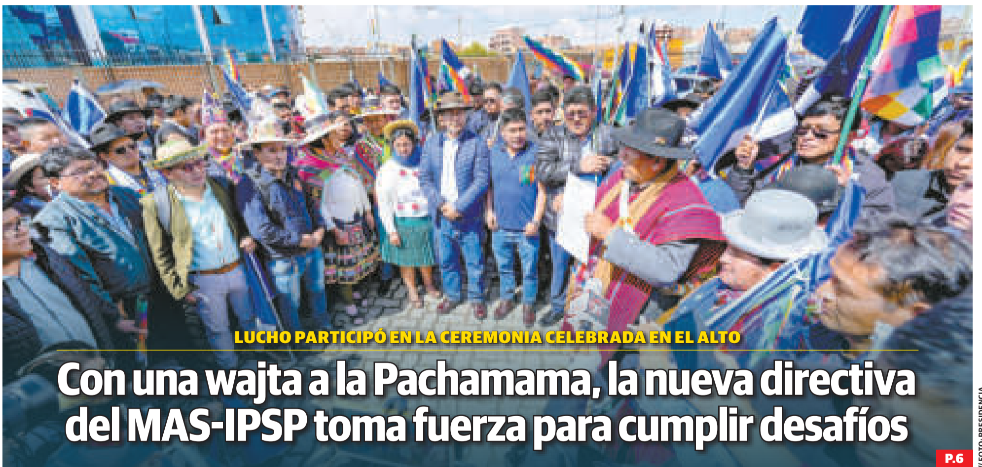
LUCHO PARTICIPÓ EN LA CEREMONIA CELEBRADA EN EL ALTO