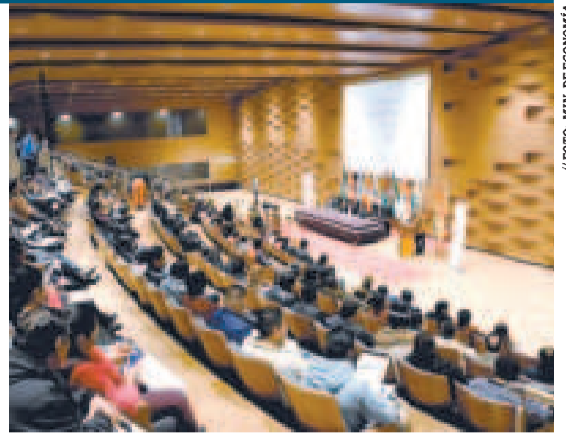
El ministro Montenegro durante su exposición en la Asamblea.

Con estas acciones, el Ejecutivo reafirma su compromiso con la gestión eficiente de los recursos públicos y el fortalecimiento de las autonomías departamentales.