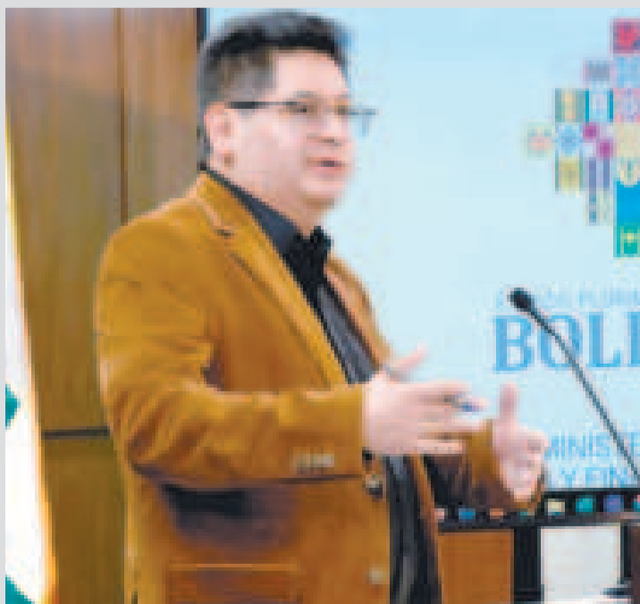
El ministro de Economía, Marcelo Montenegro, en conferencia de prensa.