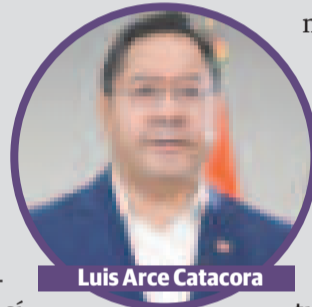
Luis Arce Catacora

La mayor parte de los pacientes atendidos en el este centro provienen de los departamentos de La Paz, Cochabamba, Oruro, Potosí, Tarija, Chuquisaca y Santa Cruz, que son atendidos con celeridad y eficiencia y con toda la experiencia acumulada por el personal médi-