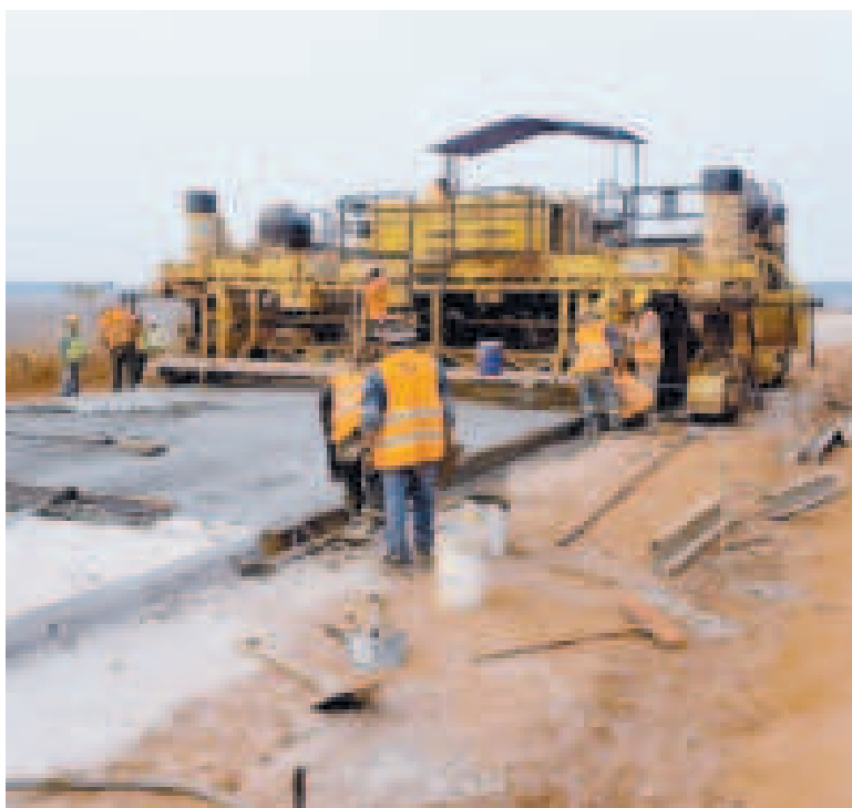
Los trabajos de pavimentación de la ruta pandina.