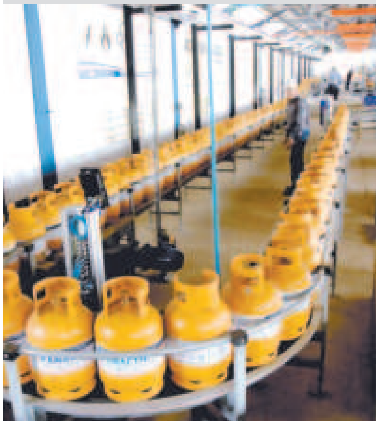
El proceso de engarrafado del GLP.