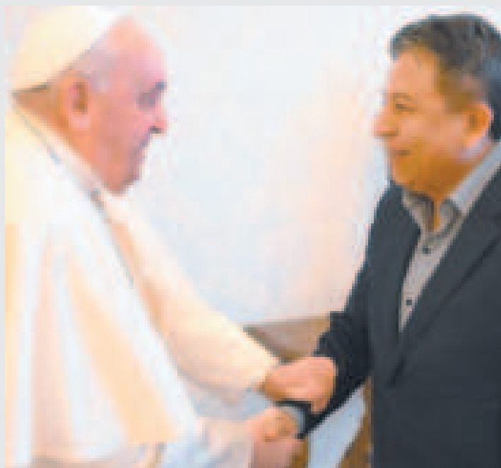
El papa Francisco junto al vicepresidente David Choquehuanca.

El encuentro sirvió para reforzar las buenas relaciones entre la Santa Sede, Bolivia y la Iglesia local; también se habló de la contribución de esta última a la sociedad boliviana y repasaron algunos aspectos de la situación política y socio-económica de la nación, según las noticias del Vaticano.