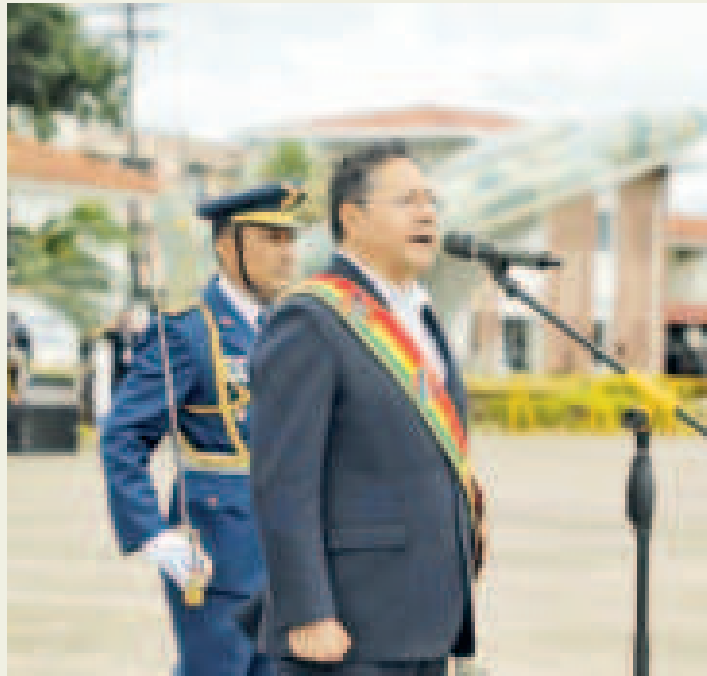
El presidente Luis Arce durante el 101 aniversario de la FAB.

“Estas amenazas exigen que nuestra Fuerza Aérea esté preparada para defender nuestros recursos naturales frente a cualquier intento de injerencia externa”, afirmó el mandatario en su discurso.