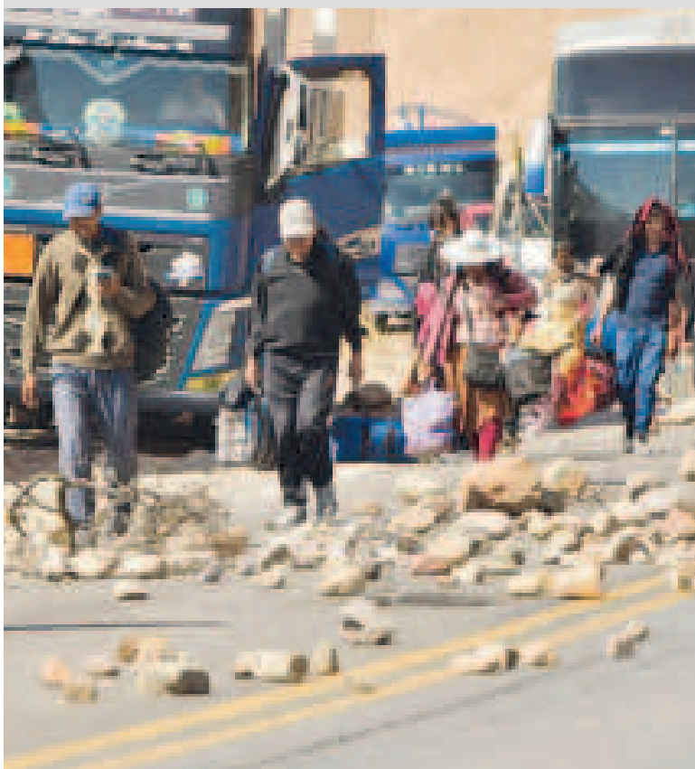
Los bloqueos organizados por Evo Morales dañaron más a Cochabamba.