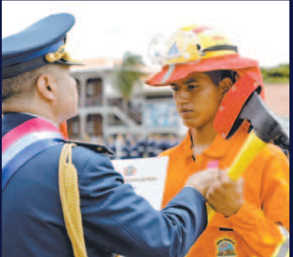
Reconocimientos a efectivos militares por su apoyo en la lucha contra los incendios.

Para la FAB, el acontecimiento histórico más trascendental de su aeronáutica fue la fundación de la Escuela Militar de Aviación en 1923. Desde entonces, a la par de los adelantos que iba experimentando la aviación militar boliviana, fue construyendo la infraestructura básica y adquiriendo material aéreo, para cumplir con eficiencia la misión asignada.