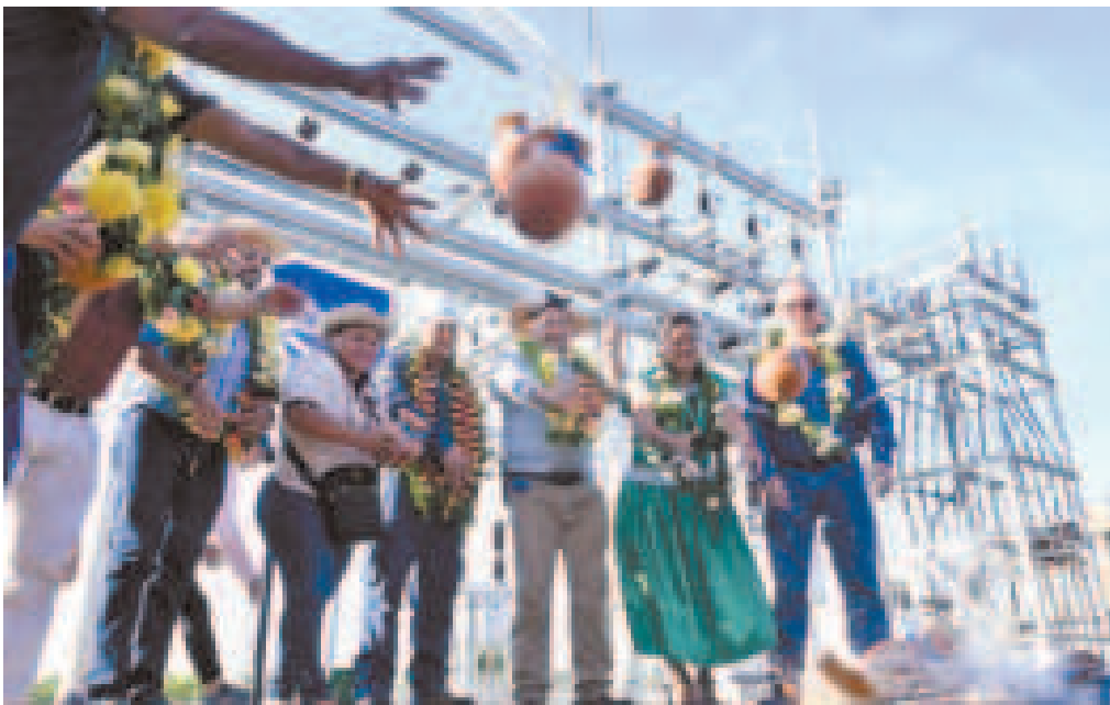
Ch'alla del nuevo nodo de retiro de media tensión en la subestación Paraíso, en Trinidad.

“No solo estamos interconectando para poder llegar con electricidad desde el occidente