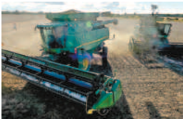
La distribución de diésel permite que la maquinaria inicie las labores de siembra.

“Han garantizado la producción, siempre que no falte el diésel en estos días y en diciembre. La siembra todavía se puede salvar. Esto nos da tranquilidad, pero también mucha responsabilidad