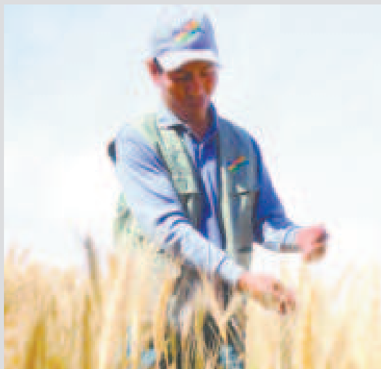
La subvención del trigo es una política para garantizar la seguridad alimentaria.

“Con el acopio y la subvención del trigo queda claro que la política del Gobierno nacional es ser defensor el bolsillo del pueblo”, afirmó Montenegro. Destacó la importancia de esta iniciativa en el marco de las políticas de seguridad alimentaria impulsadas por el presidente Luis Arce.