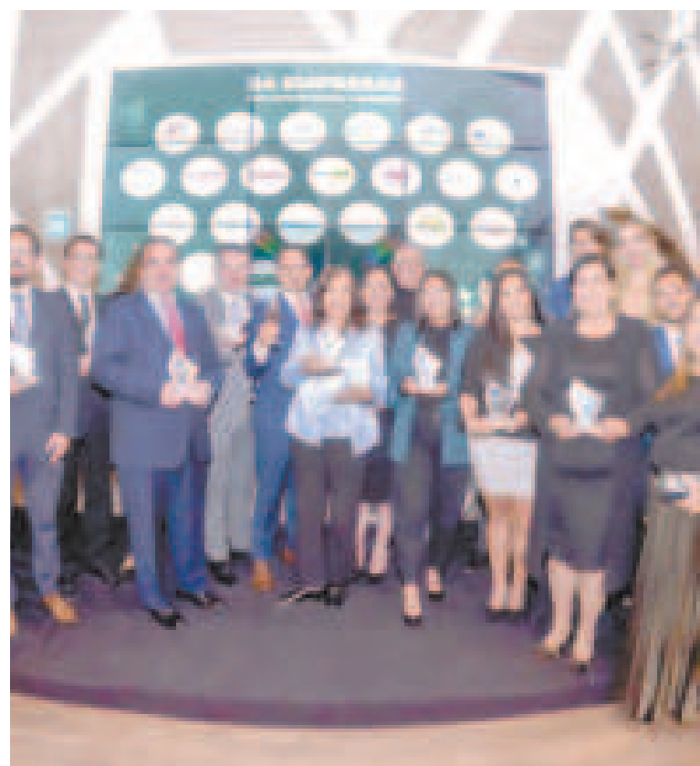
Los representantes de las empresas premiadas.

Los representantes de las 24 empresas recibieron estatuillas fabricadas con ampollas de vidrio recuperadas de centros de salud, como otra iniciativa de sostenibilidad.