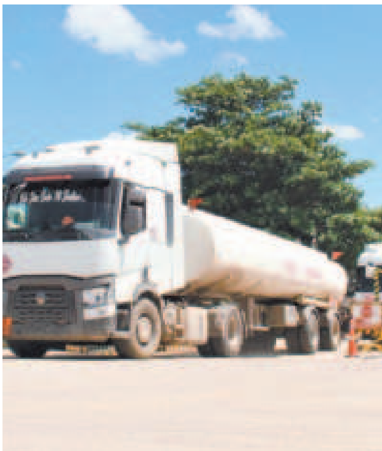
Los importadores de combustible deben cumplir los requisitos vigentes.

A través de una información institucional, la Aduana Nacional