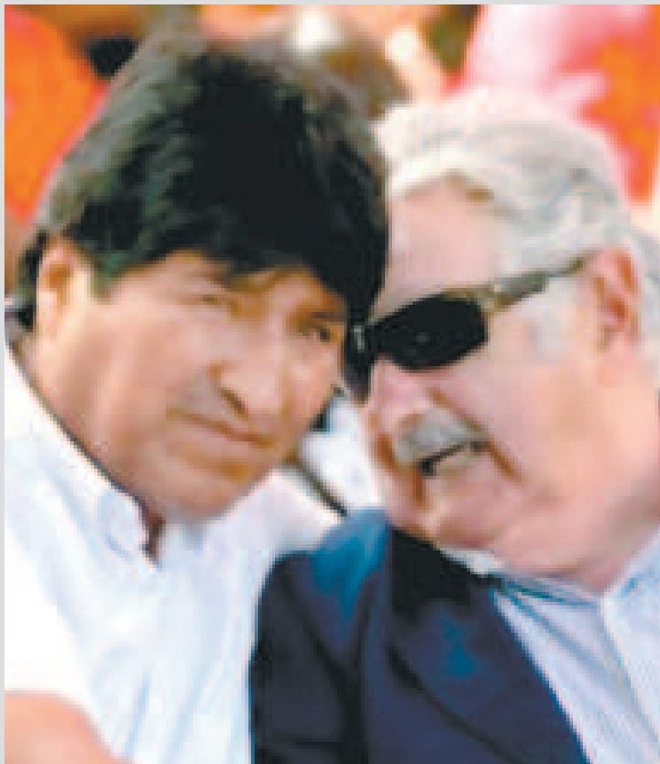
Evo Morales y Pepe Mujica.