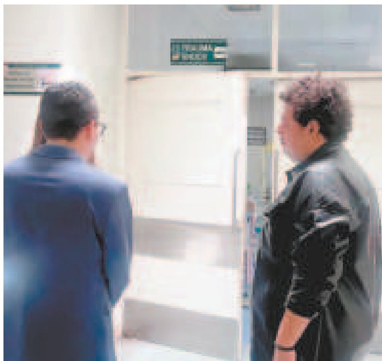
La Fiscalía investiga la caída de un fiscal de un segundo piso.