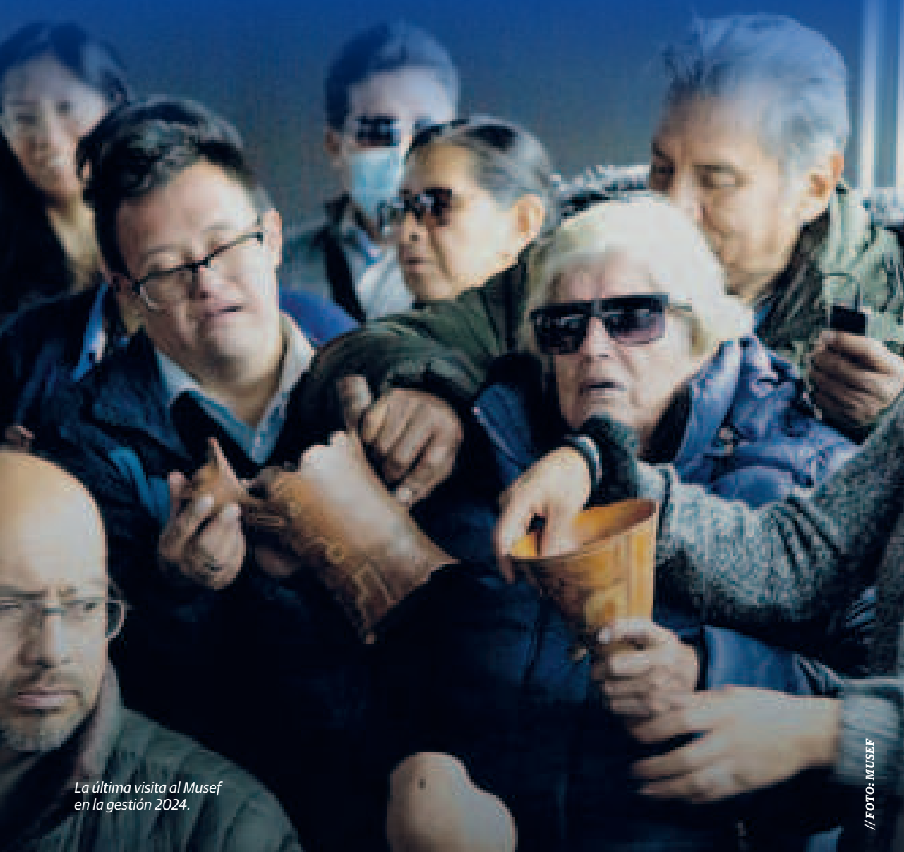
La última visita al Musef en la gestión 2024.