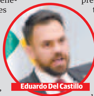
Eduardo Del Castillo

El ministro de Gobierno, Eduardo Del Castillo, se adscribió a las críticas del expresidente de Uruguay contra Morales y consideró que Mujica "nos da una lección proveniente de la reflexión y la sabiduría a to-