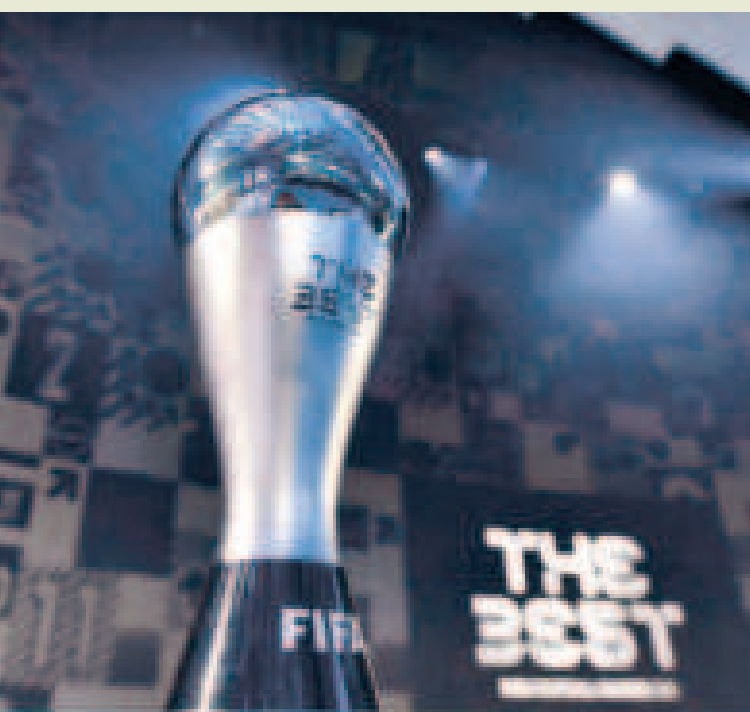
El trofeo que se entregará al mejor futbolista del mundo.