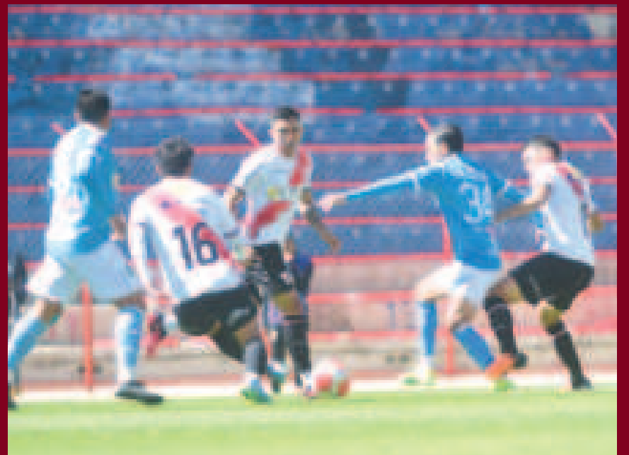
Una incidencia del cotejo que se jugó en el estadio alteño.

El cuadro de la banda roja ocupa el puesto 11 de la tabla acumulada con 40 puntos; en tanto, el equipo cochabambino es décimo segundo con 39, pero con el pase asegurado a la Copa Libertadores.