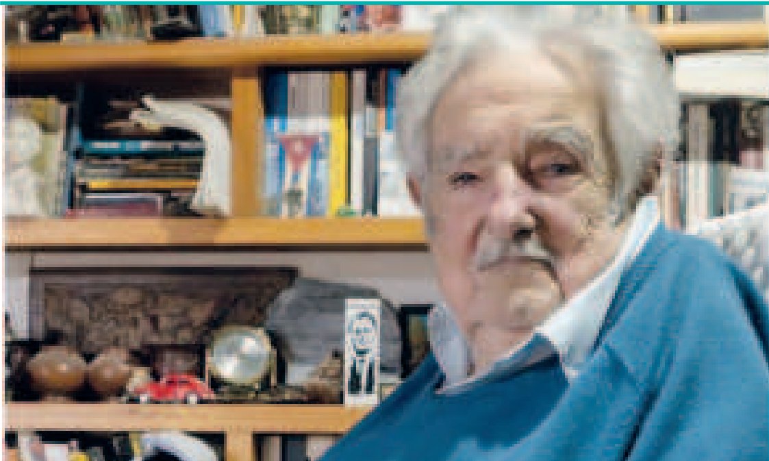
El expresidente uruguayo José 'Pepe' Mujica.