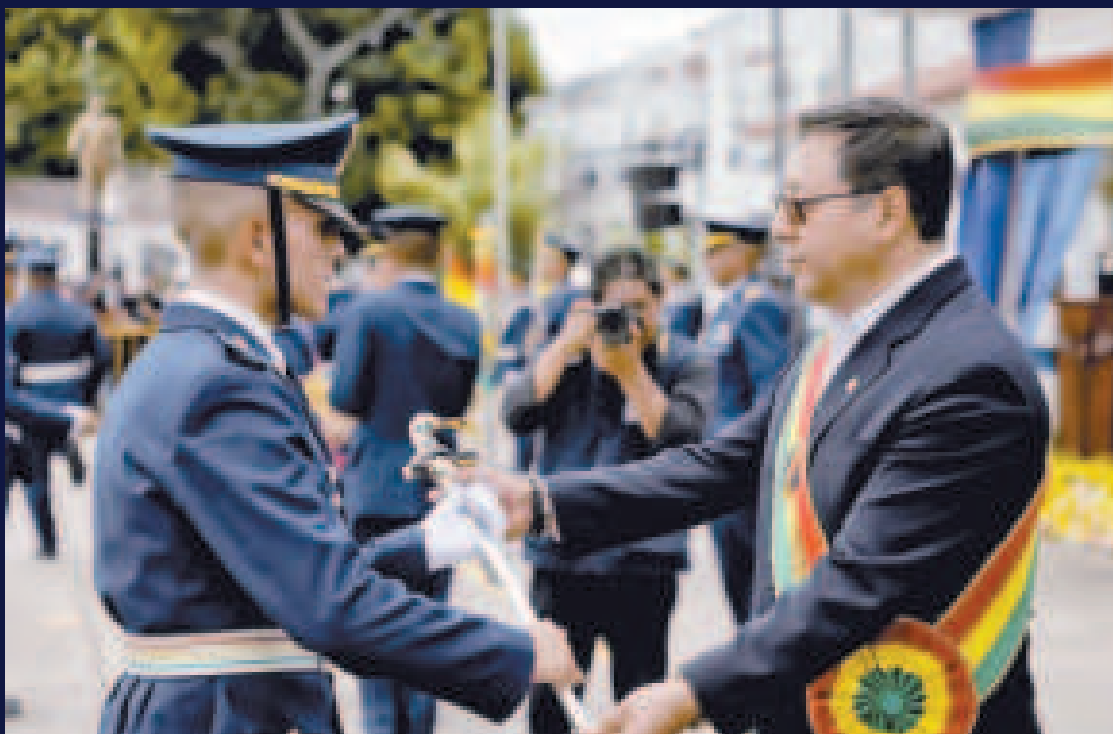
El presidente Luis Arce participó del acto de egreso de cadetes y alumnos de los institutos militares de la Fuerza Aérea.

“La Fuerza Aérea Boliviana tiene una larga tradición de valor, sacrificio y excelencia, y ustedes son ahora parte de esta historia. Ser subteniente y sargento no solo es alcanzar un rango militar, sino asumir un rol como líderes estratégicos y operativos, prestos a enfrentar las demandas de un mundo cada vez más exigente”, aseveró.