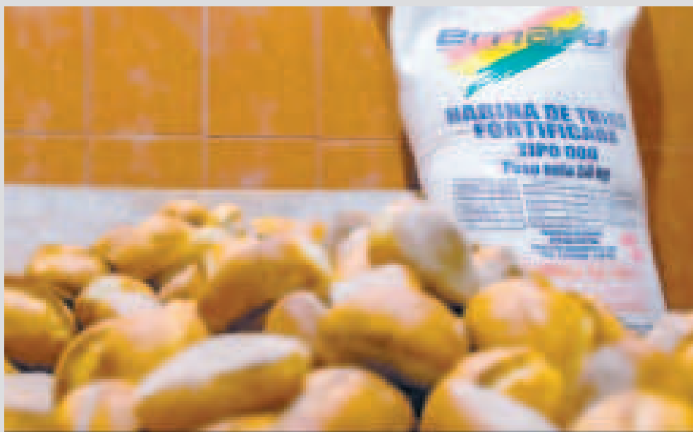
La harina que subvenciona el Gobierno garantiza estabilidad en el precio del pan de batalla.

De esta manera el pan llega a las mesas de los bolivianos a un precio accesible al bolsillo.