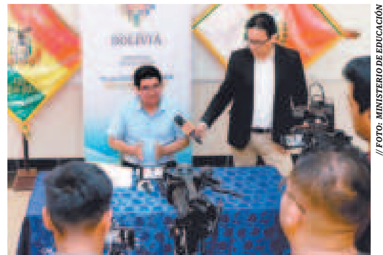
El ministro de Educación, Omar Véliz, en conferencia de prensa desde Tarija.

El monto asignado para cada estudiante es de Bs 200, sin importar si este es de colegio fiscal o de convenio.