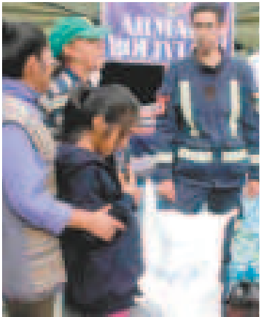
Entrega de la ayuda humanitaria en Bajo Llojeta.