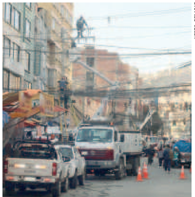
Trabajos en la zona 14 de Septiembre.

del mercado Garcilazo de la Vega y alrededores.