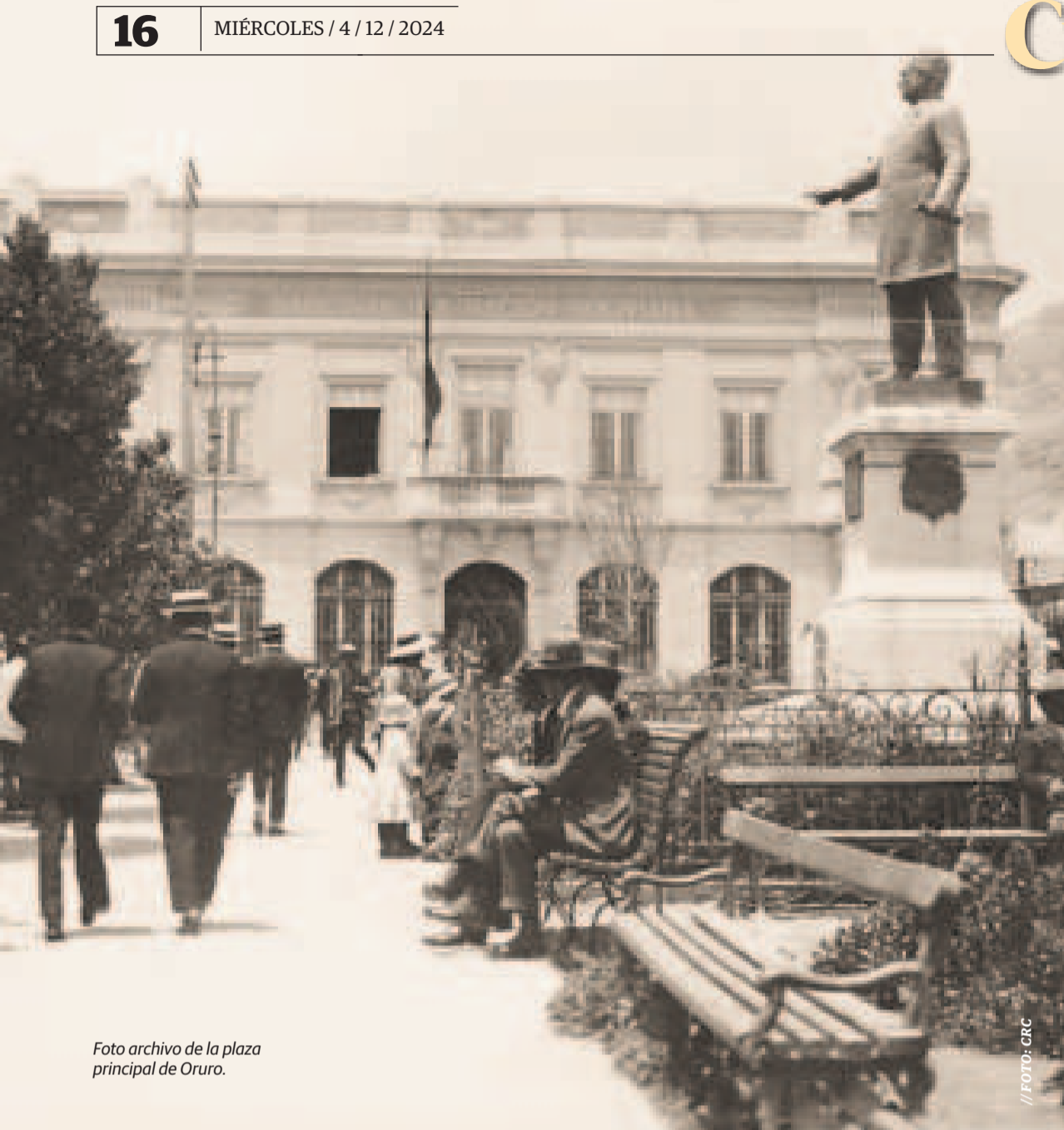
Foto archivo de la plaza principal de Oruro.