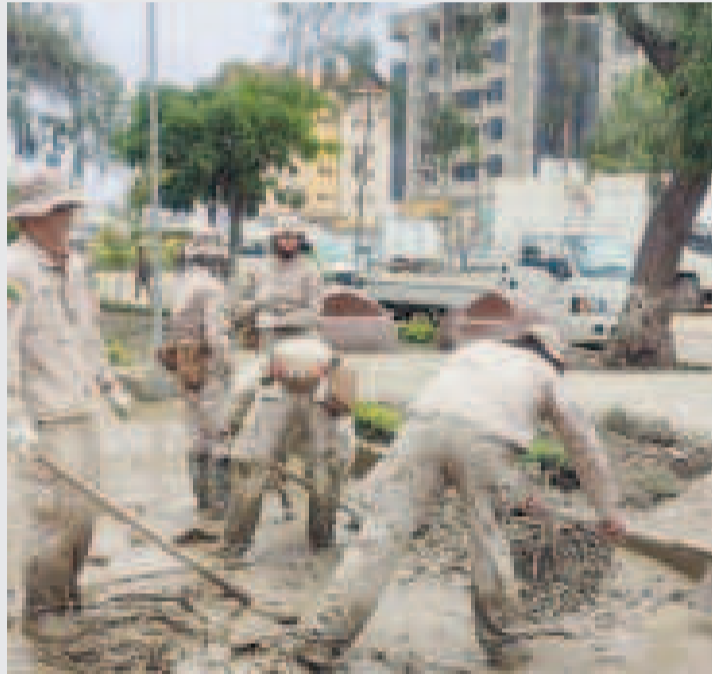
Soldados en trabajo de limpieza en la avenida Blanco Galindo.

de agua, informó la institución castrense.