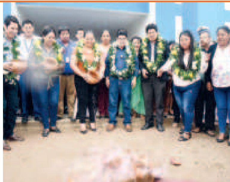
Inauguración de la unidad educativa Simón Bolívar, en Santa Cruz.