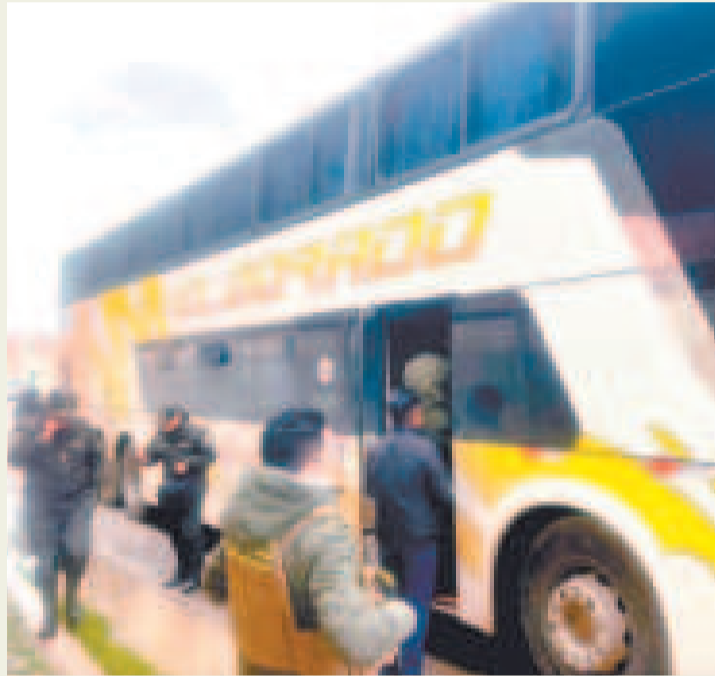
Los migrantes fueron descubiertos en dos buses de transporte.

Los migrantes, entre los que se encuentran ocho menores de edad y una mujer embarazada, estaban a bordo de dos autobuses interceptados en la avenida 6 de Marzo.