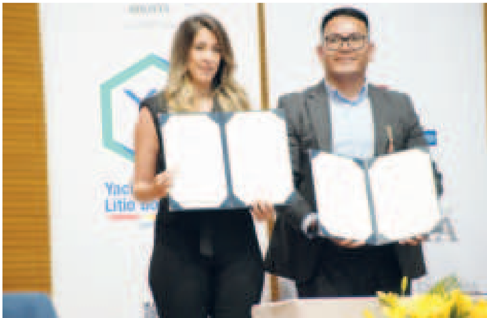
Uno de los contratos firmados por Yacimientos de Litio Bolivianos en la Casa Grande del Pueblo.

A su vez, el ministro de Hidrocarburos y Energías, Alejandro Gallardo, explicó que, una vez que se realicen las pruebas basadas en los parámetros definidos, Bolivia dará “el siguiente paso, que es la negociación de un contrato basado en el respeto a nuestro modelo económico, a nuestra soberanía, a nuestra Madre Tierra y a la sostenibilidad, siempre en busca del beneficio de los bolivianos”, siempre pensando en los intereses del país.