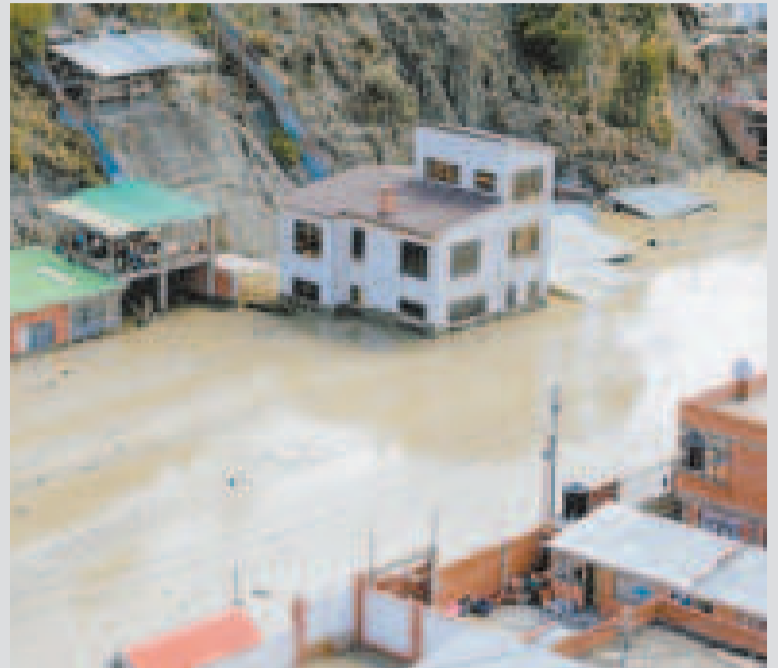
Algunas casas afectadas por el lodo.

La primera autoridad del país también entregó 1,7 toneladas de ayuda humanitaria consistente en alimentos y ropa para los afectados por el desastre, que inició en la noche del sábado 23 de noviembre. Arce instruyó además al Vice-