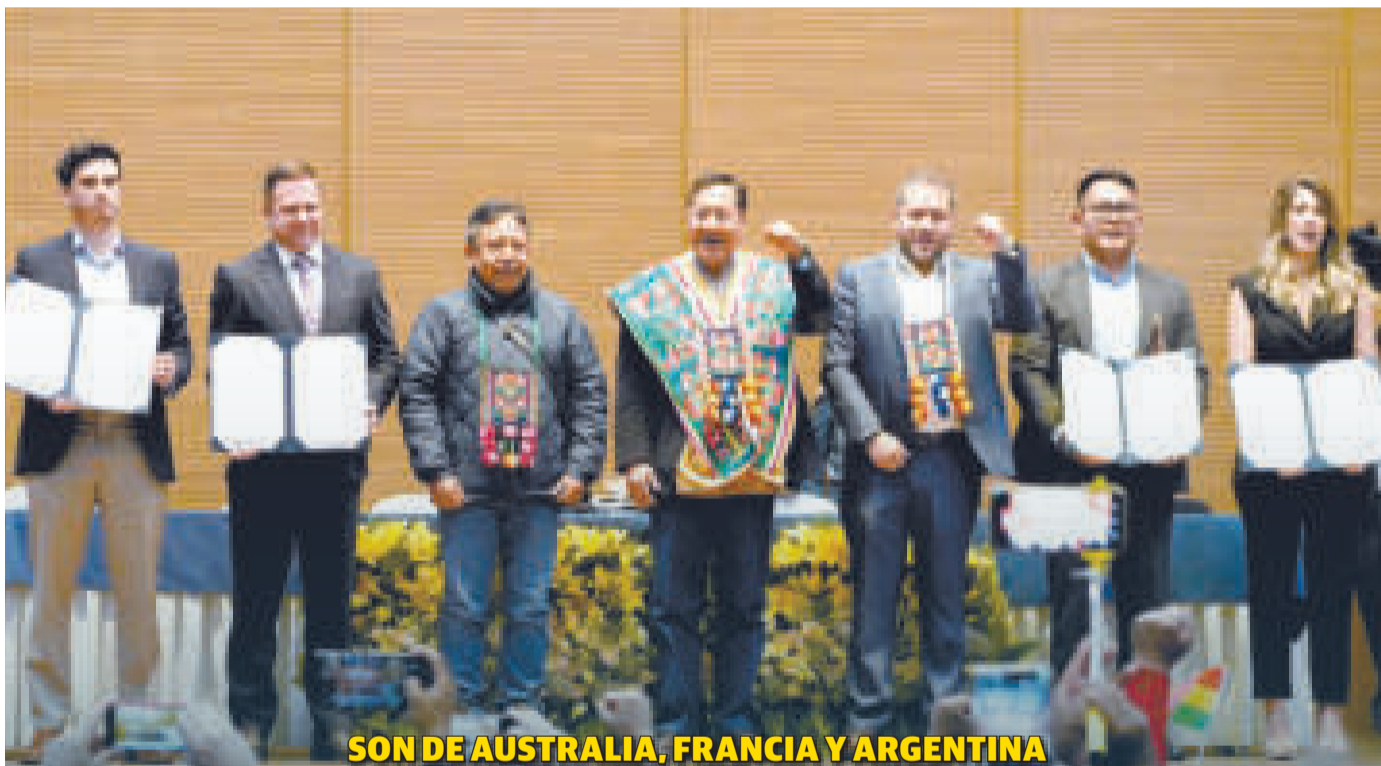
SON DE AUSTRALIA, FRANCIA Y ARGENTINA

Bolivia permite a empresas de tres continentes impulsar la tecnología del litio en salares de Potosí y Oruro