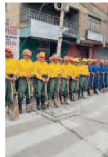
Militares que apoyan en Colcapirhua.