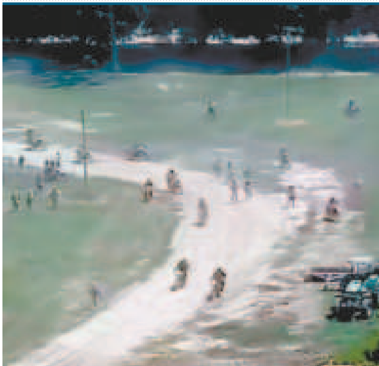
Avasalladores volvieron a tomar predios en Santa Rita, Santa Cruz.