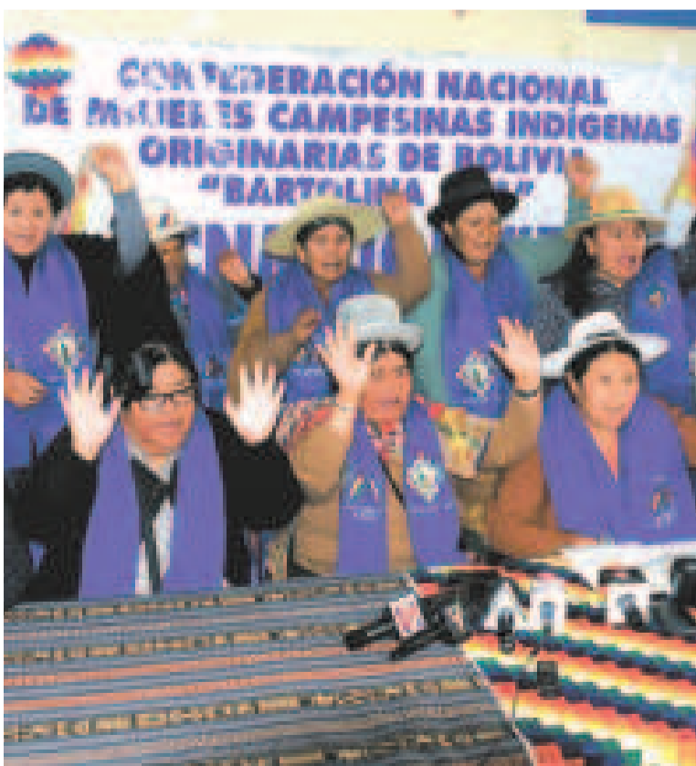
La dirigencia de las mujeres ‘Bartolina Sisa’.