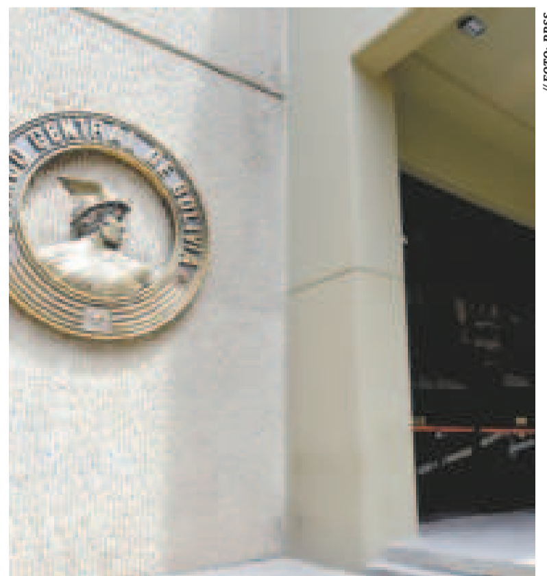
Frontis del Banco Central de Bolivia.

“El bono, disponible en UFV (Unidad de Fomento a la Vivienda) y moneda nacional (bolivianos), ha captado el interés de diversos sectores gracias a