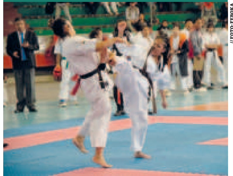
Karatecas nacionales competirán en el Sudamericano de Brasil.

Los dos eventos sudamericanos otorgarán plazas para el Mundial de Japón que se desarrollará el próximo año.