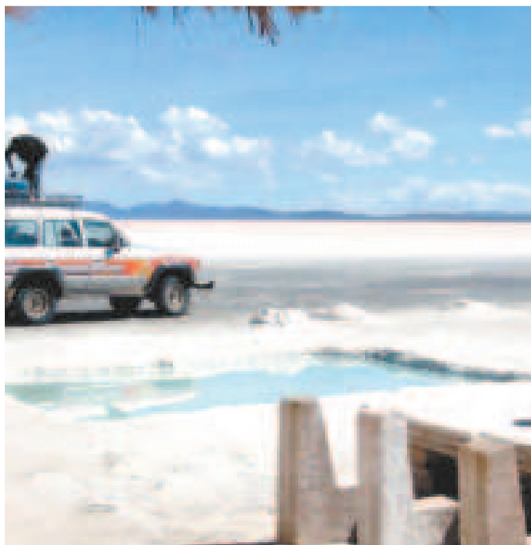
El Gobierno busca consolidar el salar de Uyuni como un destino clave en la región.