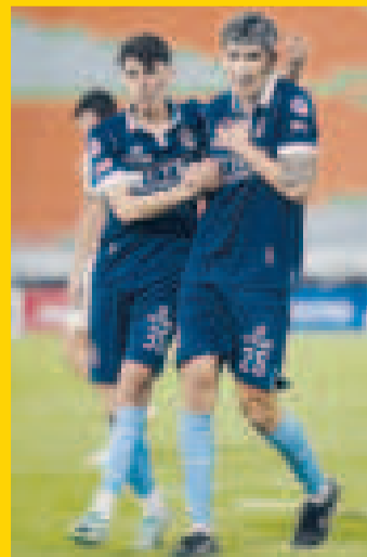
El festejo de Vargas (35) y Justiniano (26)

San Antonio derrotó a Universitario por 2 a 0, en el complemento de la primera parte de la fecha 26 del torneo Clausura de la División Profesional, que se jugó ayer en el estadio Félix Capriles.