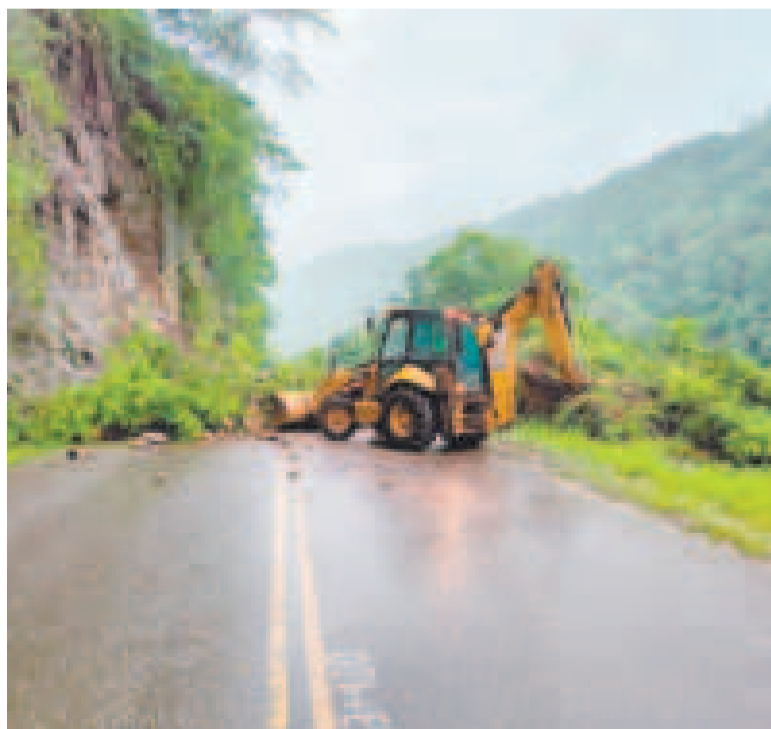
Los trabajos de atención de emergencias en una carretera.