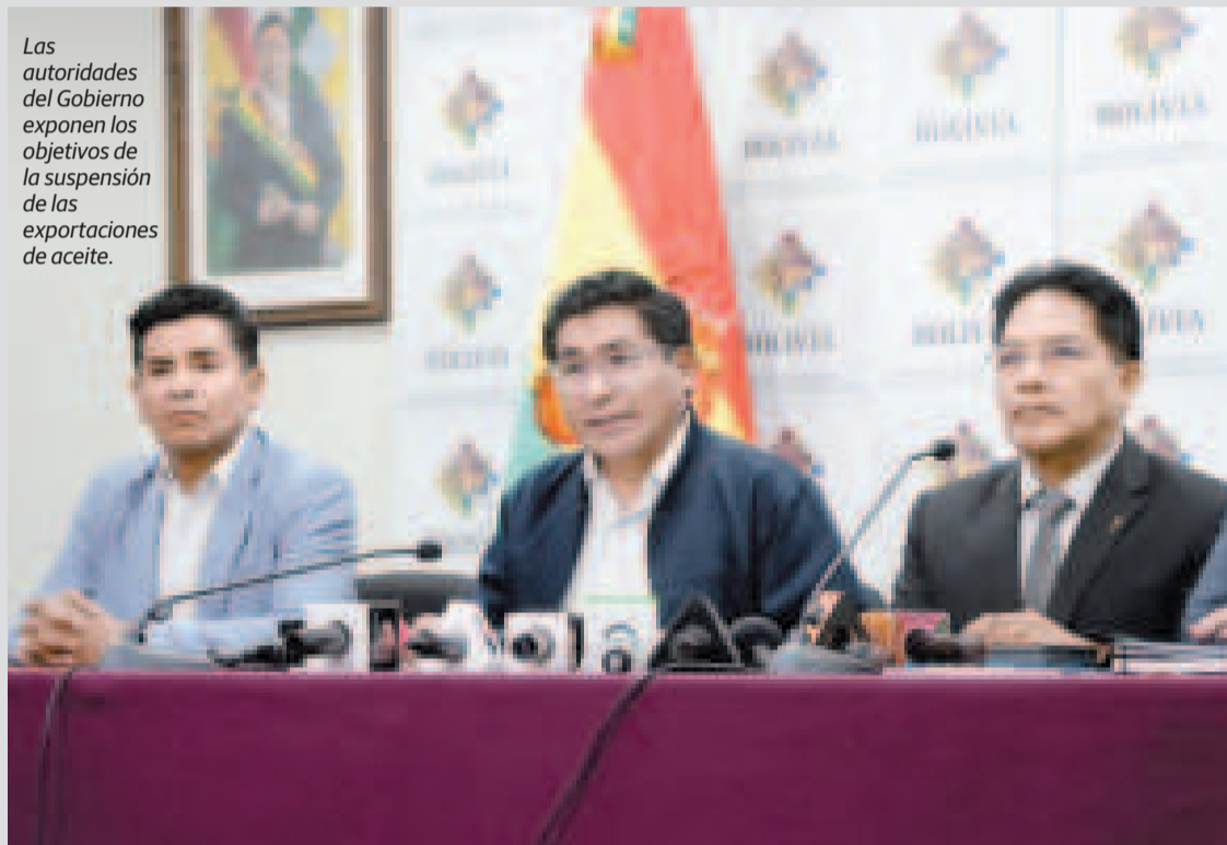
Las autoridades del Gobierno exponen los objetivos de la suspensión de las exportaciones de aceite.

La medida fue consensuada con representantes de la Cámara Agropecuaria del Oriente (CAO) y la Cámara Nacional de Industrias Oleaginosas de Bolivia.