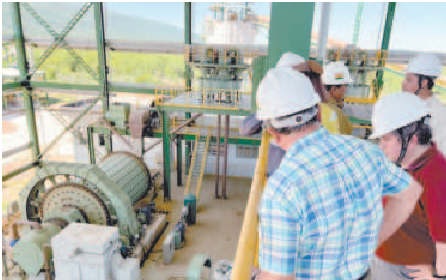
Una inspección a los equipos de las plantas del complejo.

Según los datos oficiales, la Planta de DRI, que es el corazón del complejo, tiene equipos con la tecnología Tenova, que usa