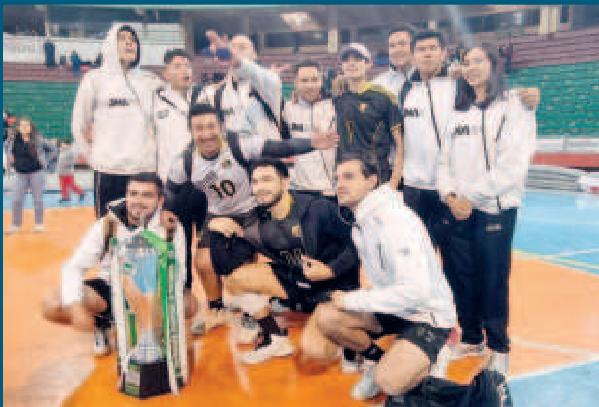
El equipo de San Martín consiguió el segundo lugar del torneo nacional de voleibol de la rama masculina.

La clasificación final es la siguiente: Olympic (con 10 unidades), San Martín (9), Deportivo Ejército, Maranatha y Nimbles (los tres con 7), además de Utepsa (5).