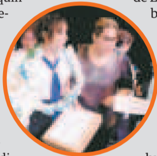
Las personas que culminaron el proceso.