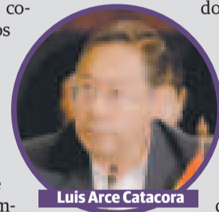
Luis Arce Catacora

Precisamente, en el marco de la cumbre, los Estados par-