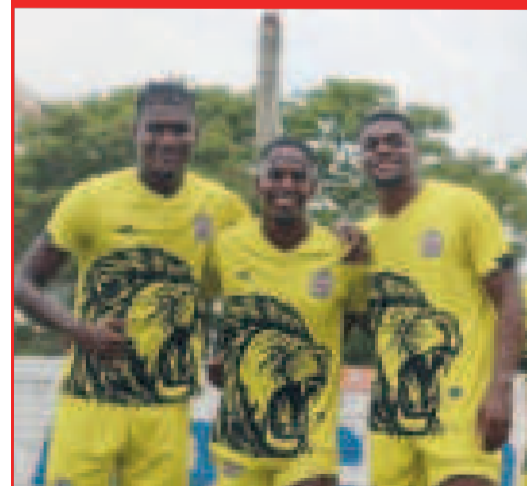
La confianza de los jugadores del equipo realista.