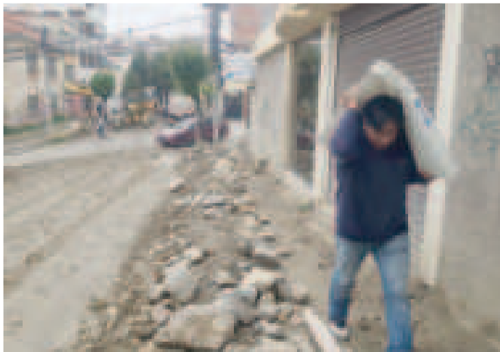
La calle Abdón Saavedra, incompleta.