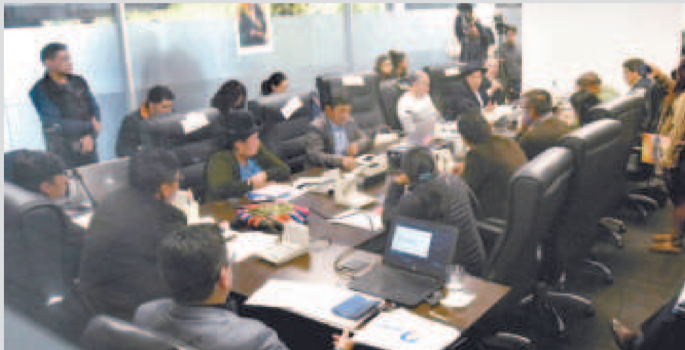
El tratamiento del PGE 2025 en la Comisión de Planificación de la Cámara de Diputados.

Con la aprobación en esta instancia de la Asamblea, el proyecto pasó al pleno de la Cámara de Diputados para su respectivo tratamiento.