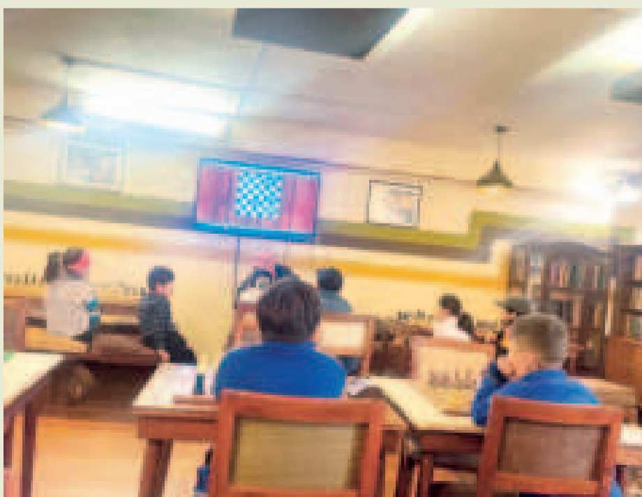
Los cursos de ajedrez que organiza el club Blitz serán prácticos y teóricos.