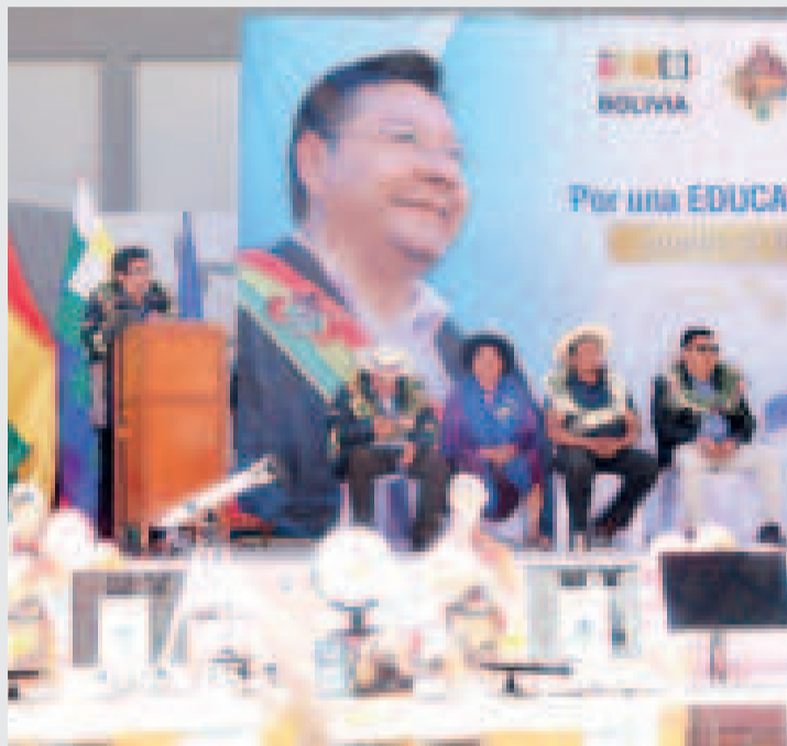
Inauguración de una unidad educativa en Tupiza, Potosí.

La unidad atenderá en dos turnos que llevan los nombres de Enrique Baldivieso y Jaime Mendoza, atendiendo así a las niñas, niños y jóvenes estudiantes tanto en las mañanas como en las tardes.