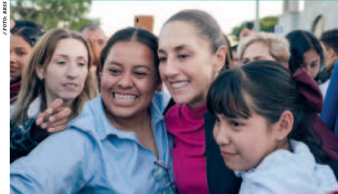
Claudia Sheinbaum, presidenta de México.