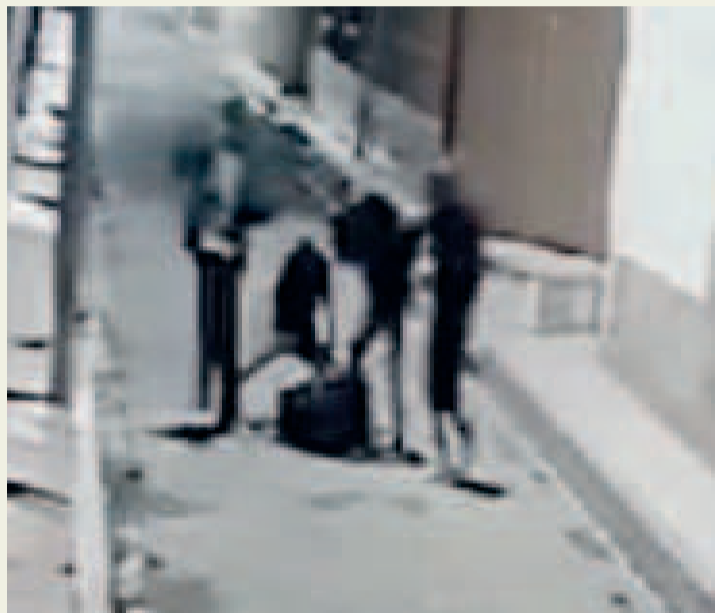
La banda delincuencia juvenil durante un atraco en la ciudad de El Alto.

Los adolescente tenían apodos similares a los personajes de la famosa serie infantil.