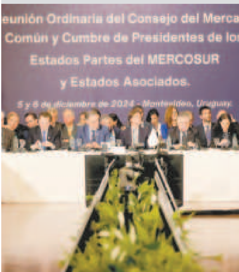
El Mercosur y sus miembros durante la jornada del viernes.