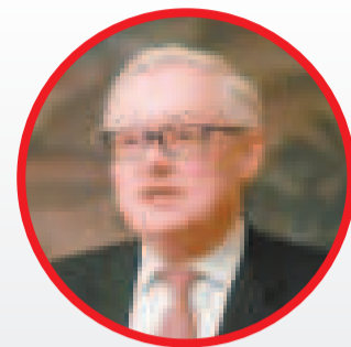
Serguéi Riabkov Viceministro de Asuntos Exteriores de la Federación de Rusia

Los Brics representan el 36% del Producto Interno Bruto (PIB) y el 45% de la población mundial.