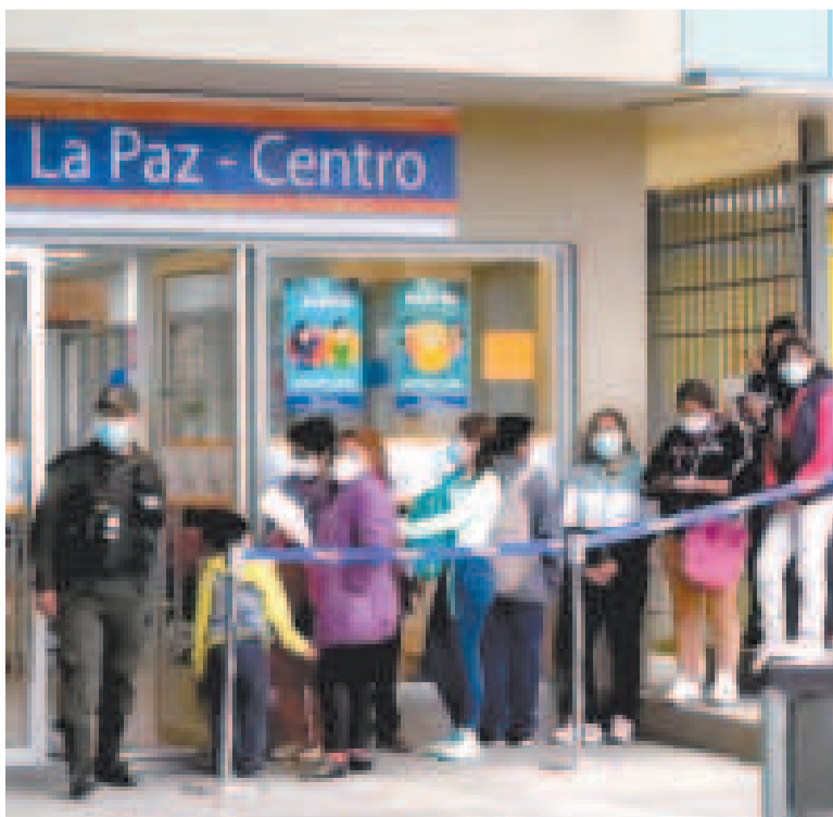
El Segip evidencia una alta demanda de la población.