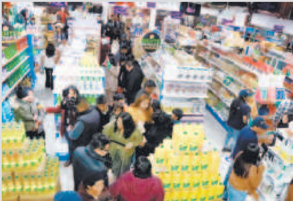
La empresa estatal distribuirá 100 toneladas de aceite a partir del lunes.

La industrialización representa una solución estructural al monopolio de la producción de aceite en manos de los sectores privados del país.