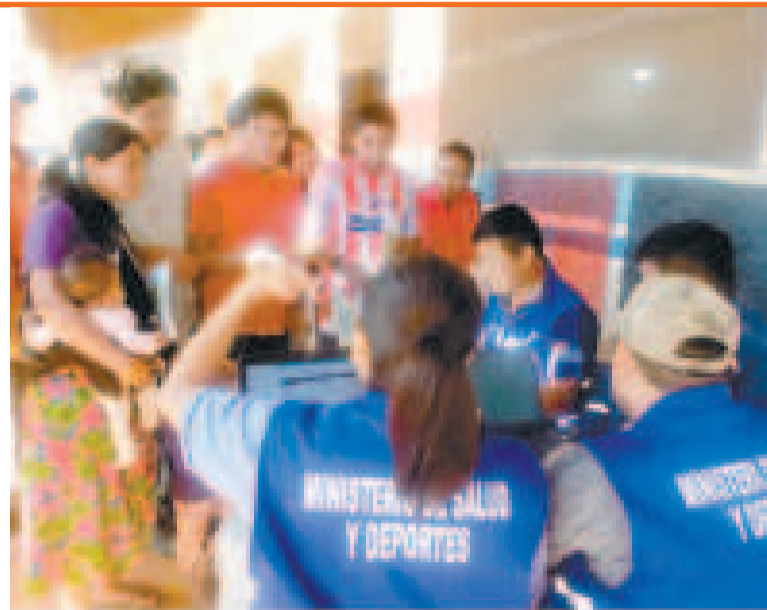
Trabajo de prevención por parte del personal del Ministerio de Salud y Deportes.