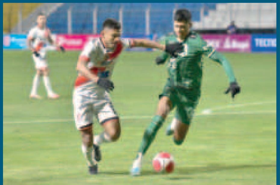
Una escena del partido que se disputó ayer en el estadio potosino.

En la próxima fecha, Nacional Potosí visitará al equipo de Aurora, en el estadio Capriles de Cochabamba.