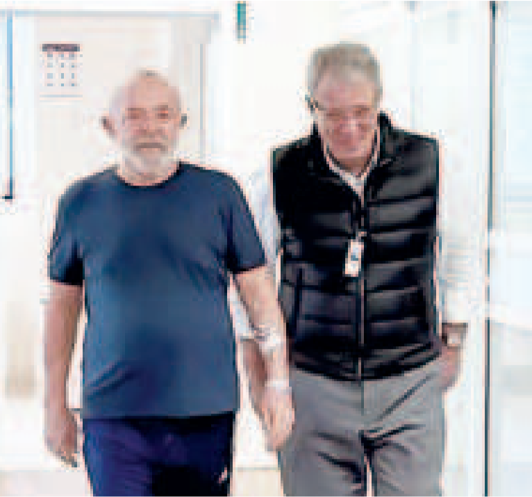
Lula y el neurocirujano Marcos Stavale en los pasillos del Hospital Sirio-Libanés, de Sao Paulo.

SE ESPERA SU ALTA EL 16 O 17 DE DICIEMBRE