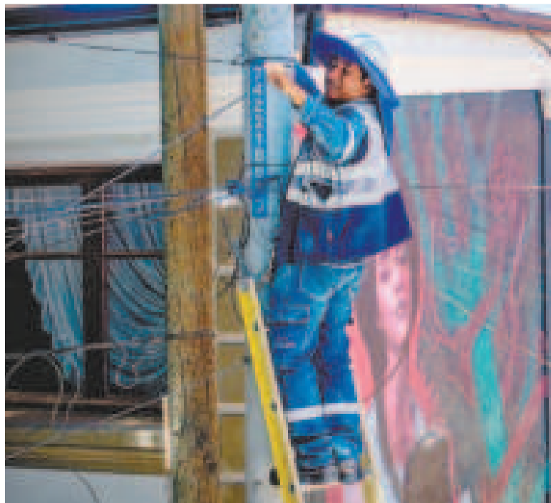
Un trabajador de Entel en la instalación de la fibra óptica.