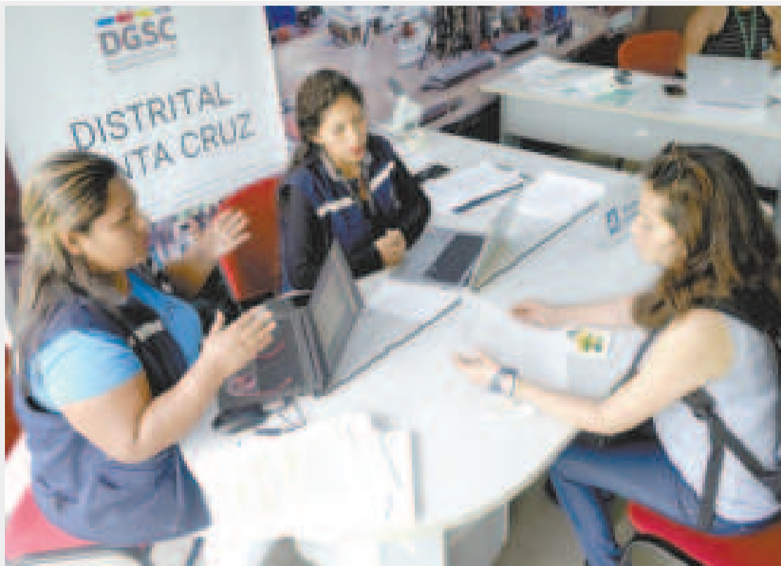
Atención a interesados en las compras externas de carburantes, en la ventanilla única de Santa Cruz.

El alcalde de Villa Abecia, Armando Cruz, agradeció el trabajo conjunto de las autoridades nacionales y locales para hacer realidad este proyecto. “Quiero agradecer a nuestro presidente Luis Arce Catacora, a todas las autoridades que han puesto su granito de arena para que esta fibra óptica llegue a Villa Abecia”.