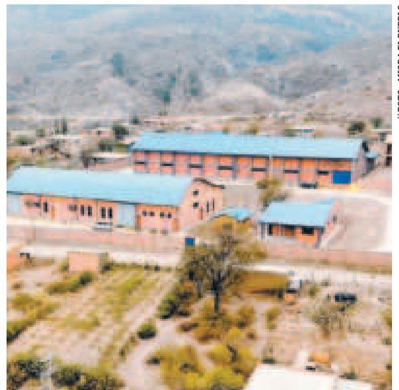
La infraestructura de la Planta de Frutas en Pojo.

La conclusión de esta planta representa un paso significati-