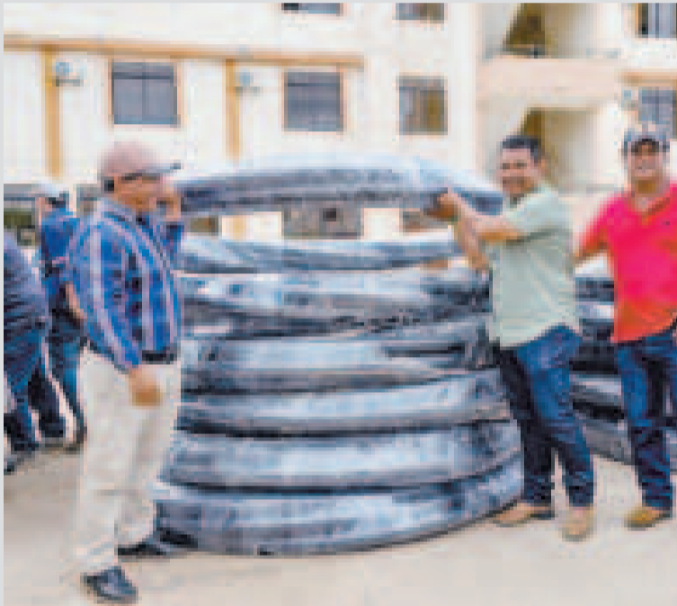
Parte de los insumos que entregó el Gobierno para la perforación de pozos.