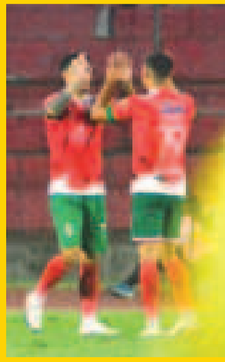
Los de Tomayapo festejan el triunfo.

Real Tomayapo remontó un marcador adverso y venció a Aurora por 2-1, en el estadio IV Centenario de Tarija, por la fecha 28 del torneo Clausura de la División Profesional.