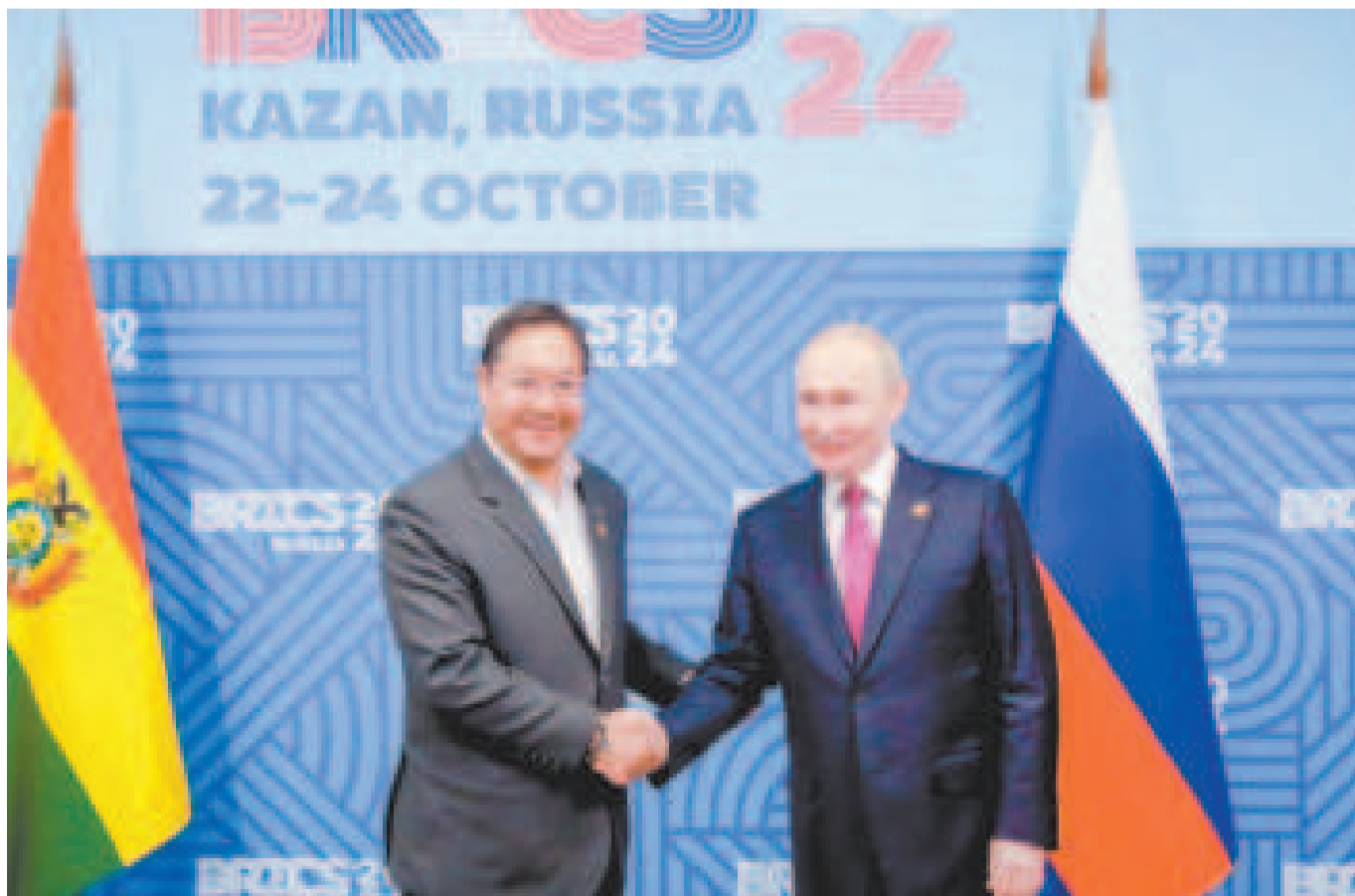
El presidente Luis Arce, junto a su homólogo de Rusia, Vladimir Putin, en la cumbre de los Brics en Kazán.