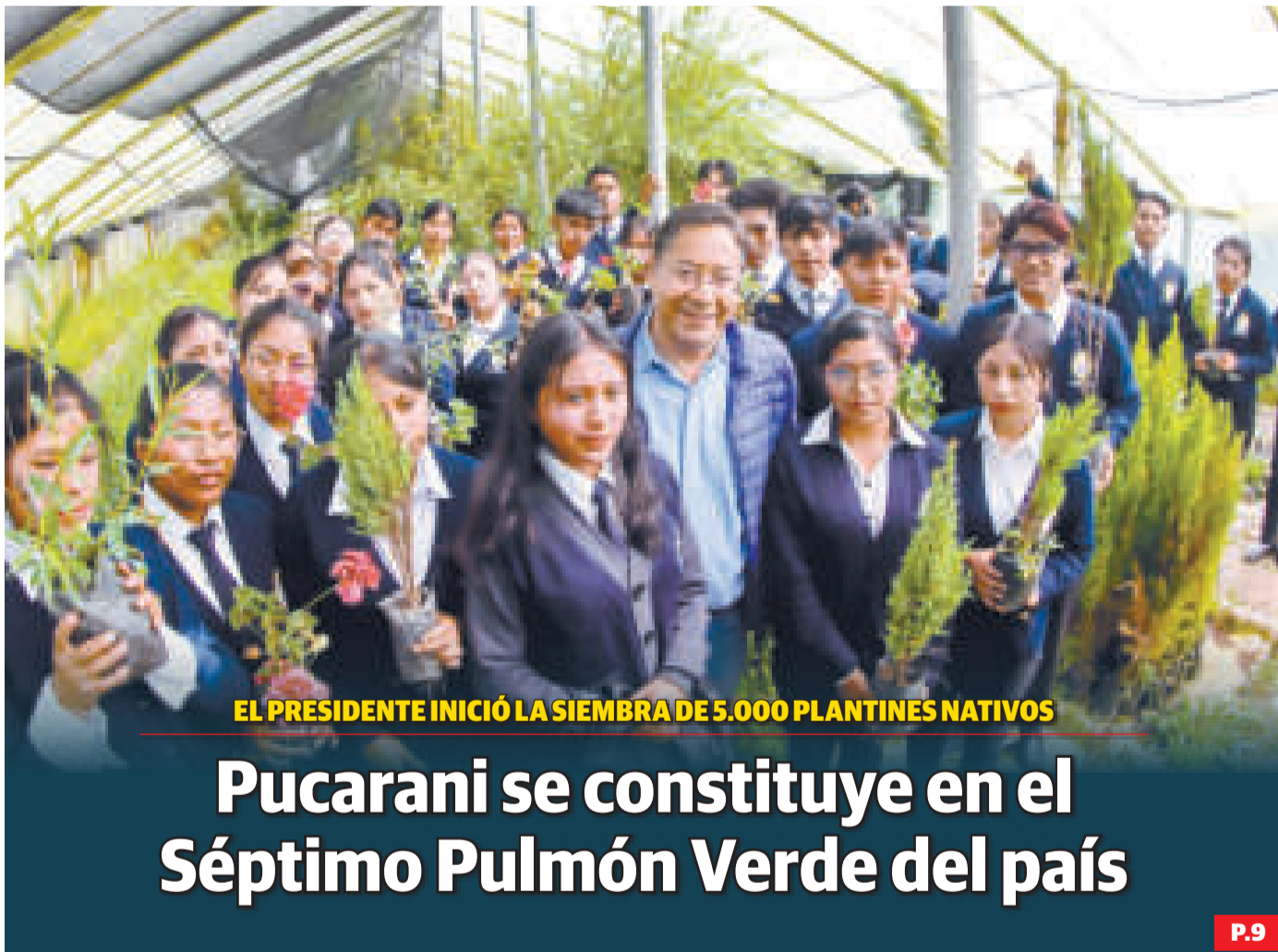
EL PRESIDENTE INICIÓ LA SIEMBRA DE 5.000 PLANTINES NATIVAS