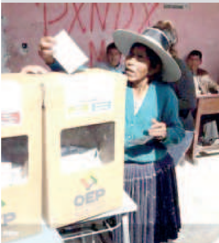
Elección judicial en Llallagua, en 2017.