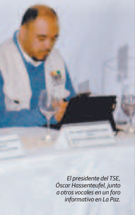
El presidente del TSE, Óscar Hassenteufel, junto a otros vocales en un foro informativo en La Paz.