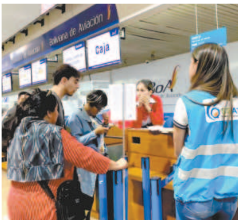
Personal de la ATT en el aeropuerto de El Alto.

“Hemos activado nuestro operativo Navidad Segura con Paz y Unidad con la finalidad de