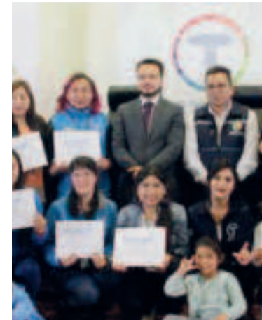
Trabajadores que recibieron sus certificados.

La meningitis es la inflamación de los tejidos que rodean el cerebro y la médula espinal. Suele deberse a una infección, puede ser mortal y requiere atención médica inmediata. Quienes logran superar el cuadro quedan con secuelas.