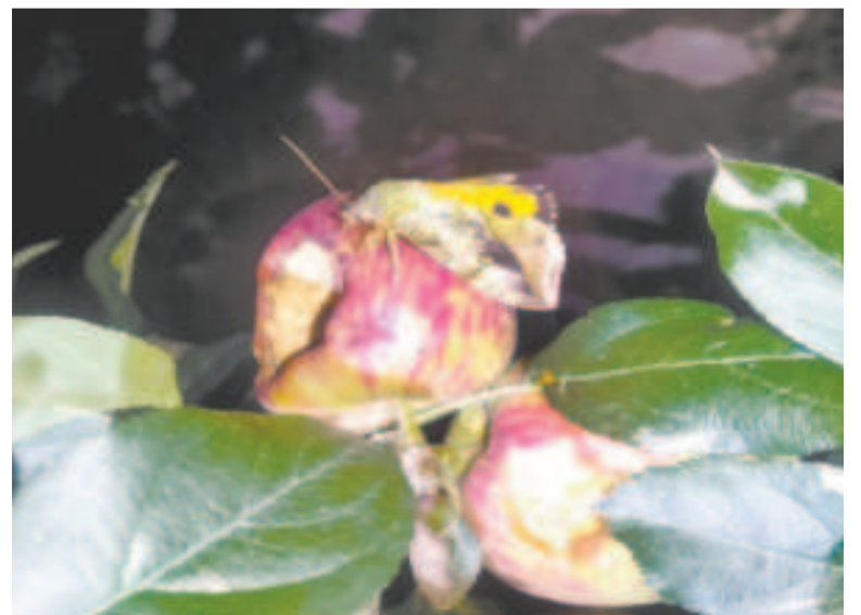
Las frutas quedan dañadas con esta plaga.

Además de las fumigaciones, se han organizado talleres de capacitación para los productores afectados, con