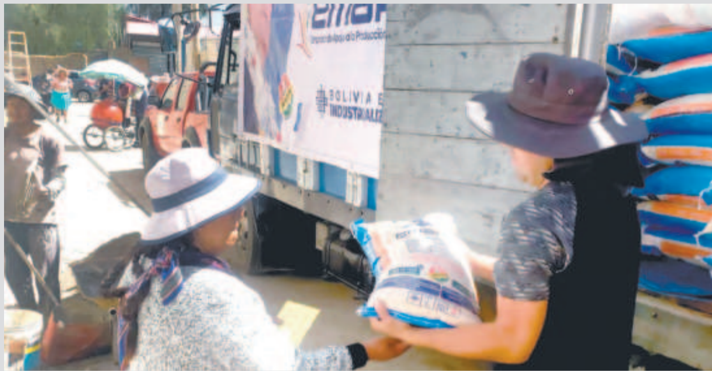
Los vecinos de Thaqa reciben los productos de Emapa.

La estatal está intensificando su visita a diversos municipios alejados de todo el país con productos de la canasta familiar a precios justos.