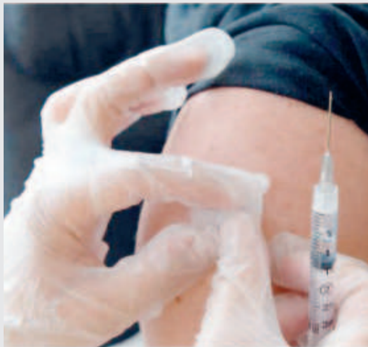
Vacuna contra la meningitis.