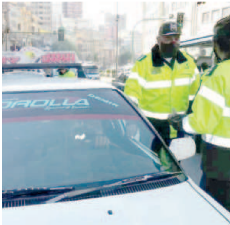
Tránsito activa el plan de operaciones para evitar accidentes fatales por fin de año.