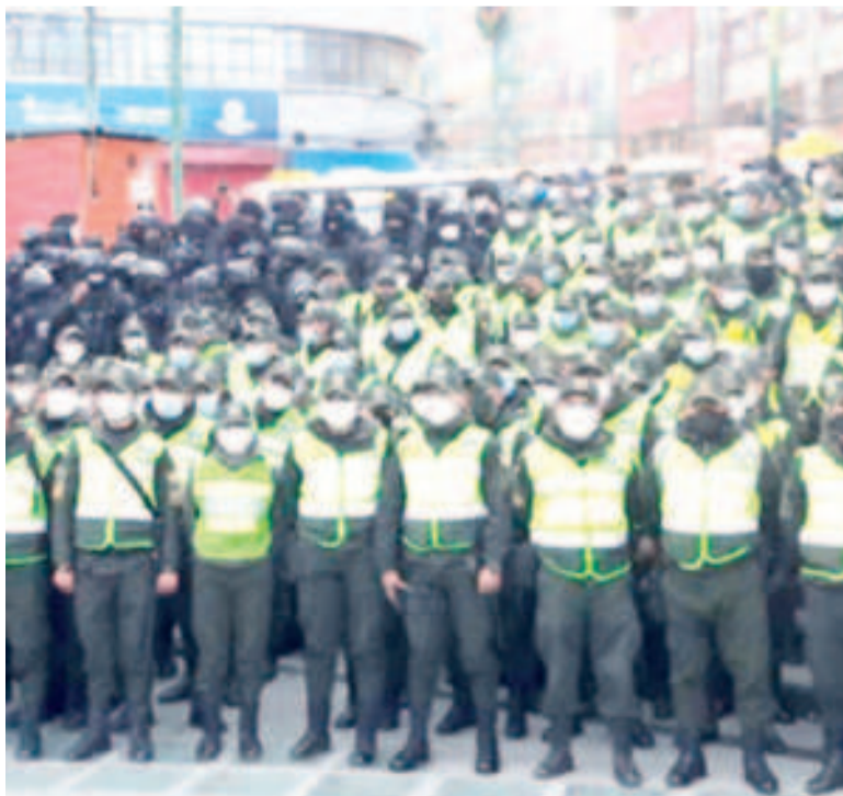
La Policía Boliviana en plan de operaciones.