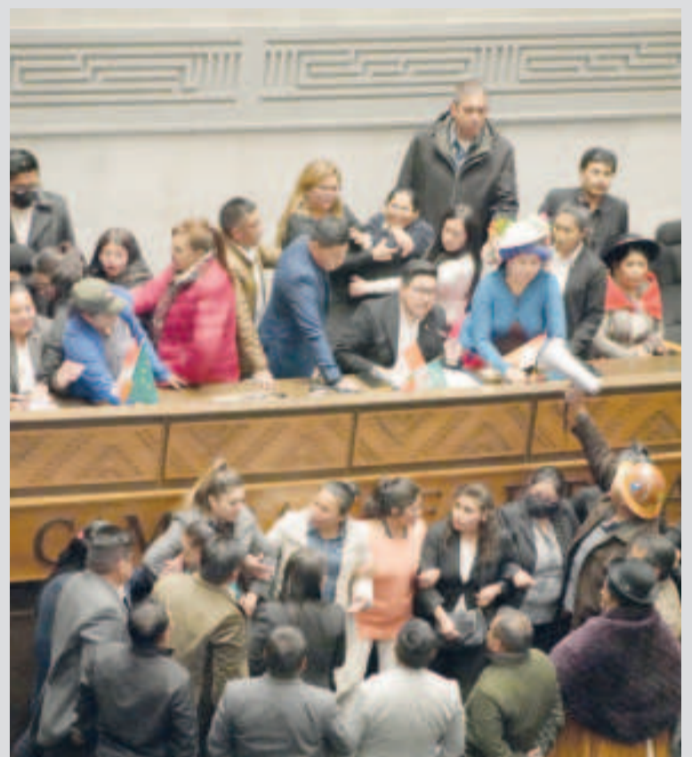
Asambleístas evistas tratan de impedir que se sesione en Diputados.

Para lluvias, el préstamo Contingente para Emergencias por Desastres Naturales y de Salud Pública del BID, por un monto de $us 250 millones quedó pendiente en ser tratado desde septiembre de este año.