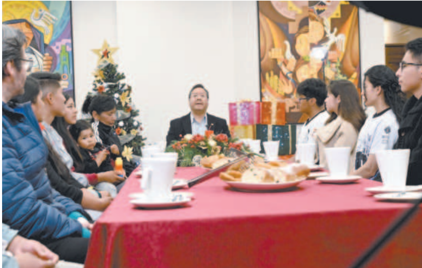
Arce, en su mensaje navideño, acompañado de un grupo de personas en representación de las familias bolivianas.

Prosiguió con la entrega, en el mismo municipio, de la unidad educativa Marcelo Quiroga Santa Cruz, comprometiendo ayuda para la edificación de otras unidades. Y