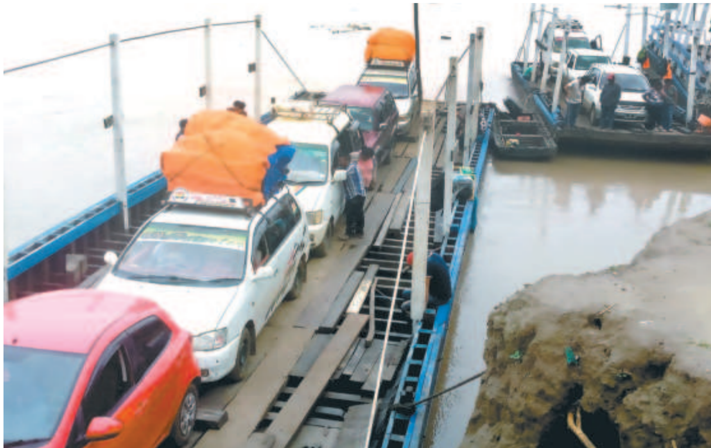
Coches que cruzan el río Mamoré.