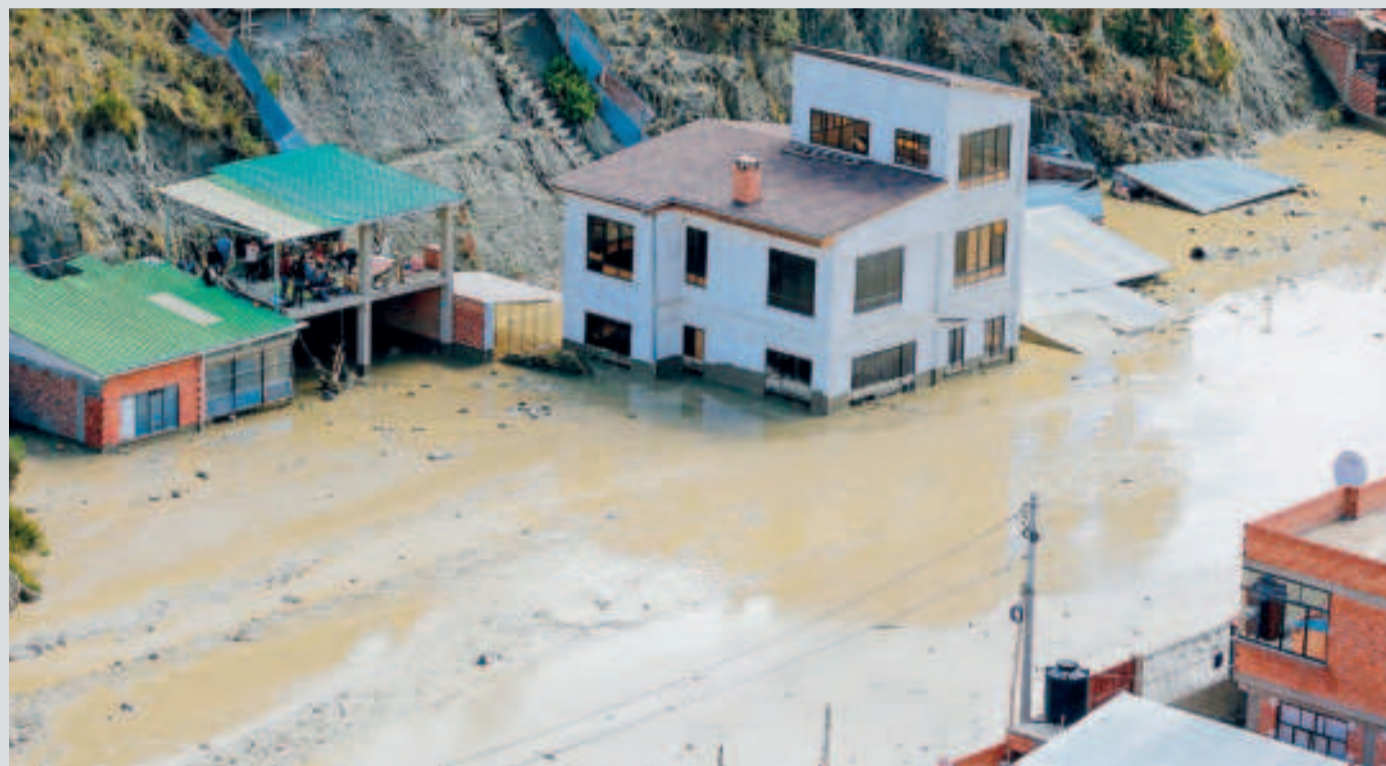
Mazamorra en Bajo Llojeta de la ciudad de La Paz.

La Fiscalía anunció la programación de una declaración virtual para el propietario de la inmobiliaria Kantutani, quien se encuentra en Perú.