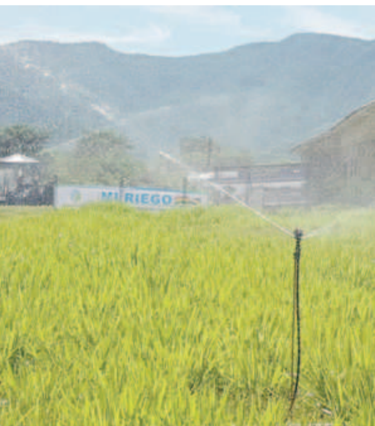
Un sistema de riego en el altiplano.