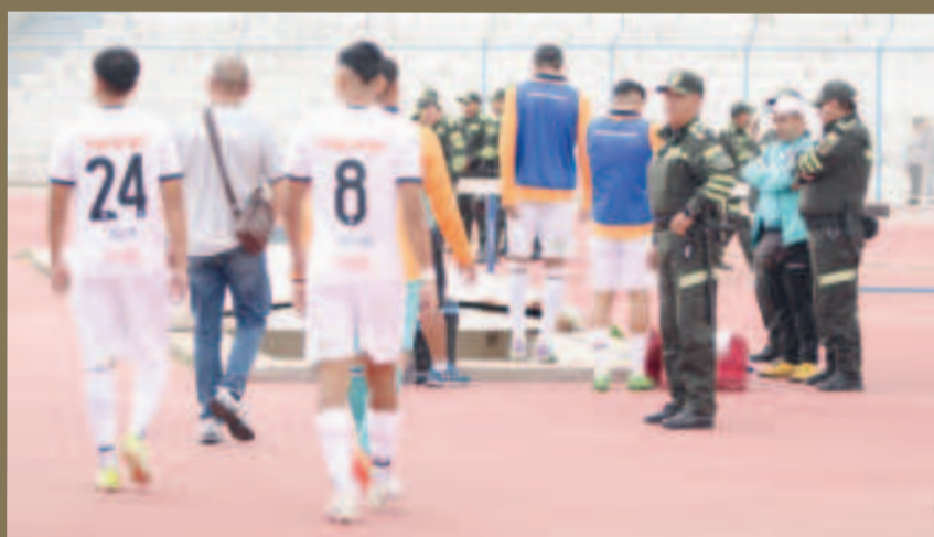
Jugadores de Royal Pari abandonan el campo de juego e ingresan al túnel camino a su camerín.

"Los jugadores fueron a lavarse la cara por el gas pimienta que recibie-