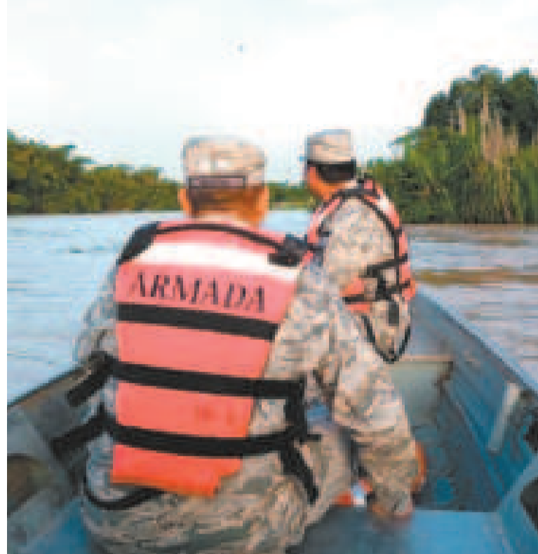
La Armada en vigilia ante la subida del río Acre.

El Senamhi activó una alerta naranja por vientos fuertes de hasta 60 kilómetros por hora, que se sentirán en Potosí, Oruro, Chuquisaca y Tarija. Durante los vientos fuertes, la población no debe estacionar sus vehículos, ni realizar actividades debajo de árboles, letreros, postes o construcciones, por el riesgo de que sean derribados por las ráfagas de viento, como medida de prevención.