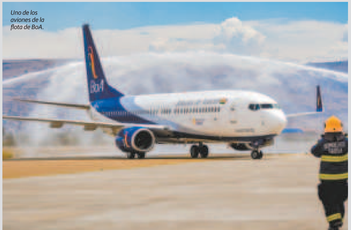
Uno de los aviones de la flota de BoA.

Según los datos, tres aviones permitirán a la empresa aérea hacer alrededor de 30 vuelos diarios, y operar al menos cinco o seis días por semana. “Entonces es una cantidad