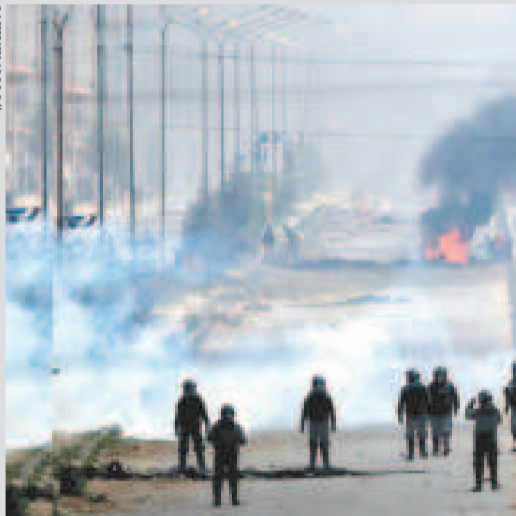
Efectivos lanzan gases en Senkata, en 2019.

“Hay suficientes pruebas, videos y declaraciones que demuestran que en 2019 hubo un rompimiento del orden constitucional, y lo único que pedimos a la justicia es que se dé celeridad en este caso y de una vez tengamos una sentencia por los hechos que causaron la muerte de personas inocentes”, solici-