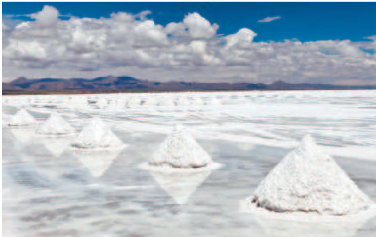
Parte del salar de Uyuni, donde hay reservas de litio.