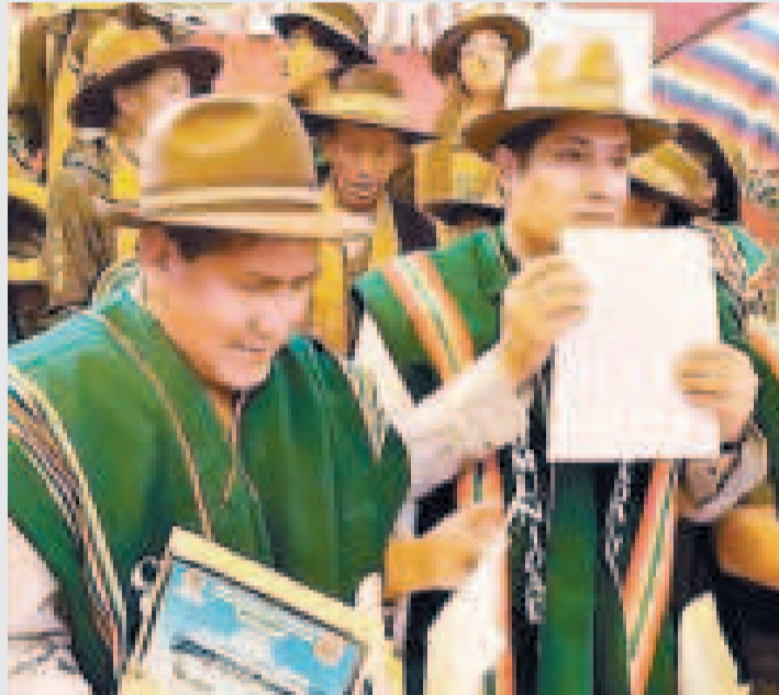
El Ministro de Medio Ambiente y Agua en la firma de convenios en Oruro.