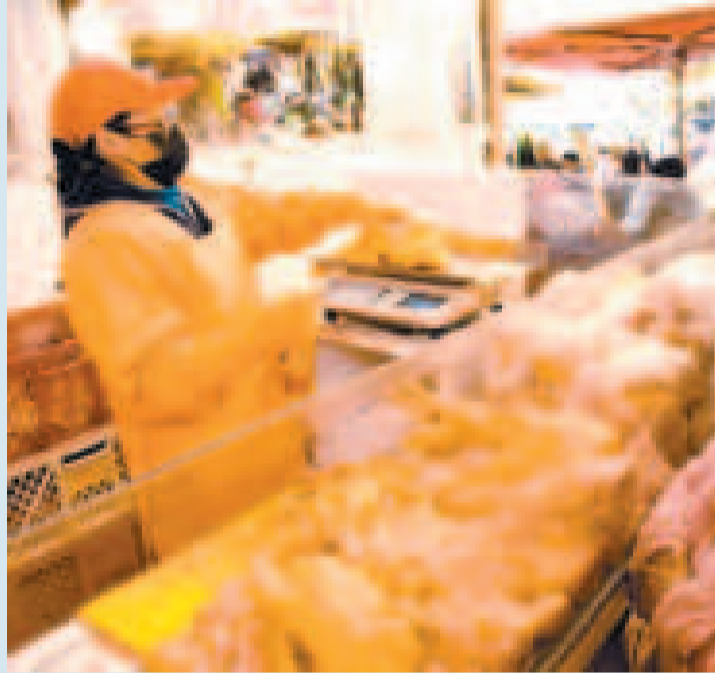
La carne de pollo es uno de los productos esenciales en la dieta de los bolivianos.