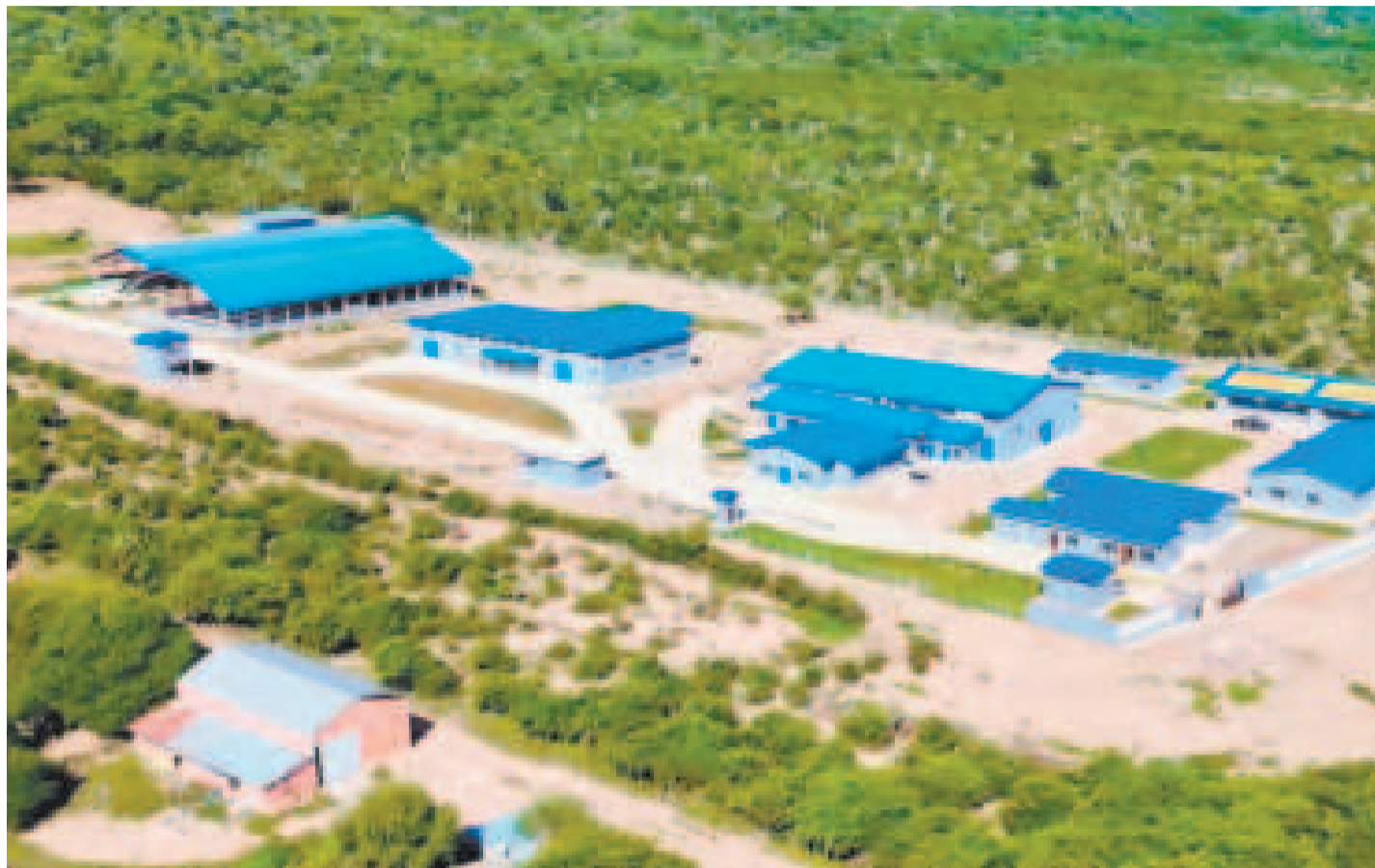
Infraestructura de la Planta de Bioinsumos en Pampa Grande.

“El Banco de Desarrollo Productivo y nuestro Banco Unión generaron líneas de crédito de capital de operaciones para que los pequeños productores puedan adquirir todos los insumos necesarios”, subrayó el mandatario en un acto en San Julián.