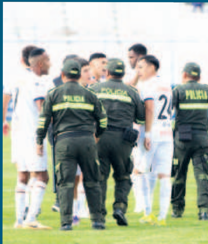
Jugadores de Royal Pari durante el incidente contra efectivos de la Policía.

La Federación y sus tribunales están en receso por las vacaciones de fin de año y se prevé que regresarán a sus labores entre el 3 o 6 de enero del venidero año, tomándose los días posteriores para dar sus primeros criterios sobre el tema que ha puesto un manto de incertidumbre sobre el ascenso-descenso indirecto de categoría en el fútbol boliviano en el ámbito profesional y aficionado.