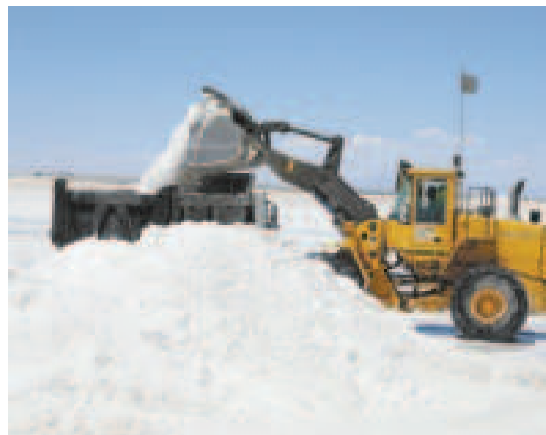
Maquinaria pesada mueve la salmuera en el salar de Uyuni, Potosí.

Adicionalmente, YLB suscribió convenios con las empresas internacionales EAU Lithium Pty Ltd de Australia; Tecpetrol SA, de Argentina; y Geolith Actaris, de Francia, para evaluar y poner a prueba nuevas tecnologías en los salares de Coipasa