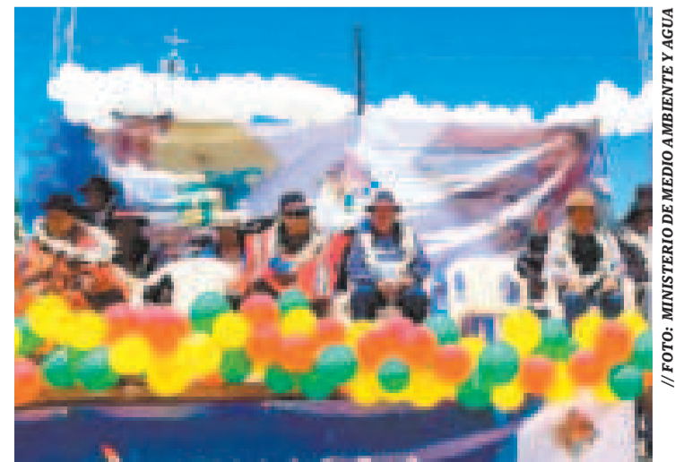
Acto de inicio de obras en Culliri, municipio de Toledo, en Oruro.

Explicó que el agua también es necesaria para asegurar la producción alimentaria, por lo que garantizó la financiación de un estudio para la construcción de una presa en esa región del país.