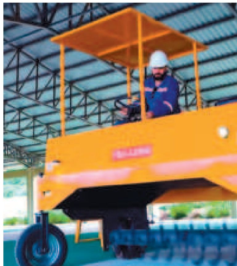
Parte de la maquinaria de la Planta de Bioinsumos.