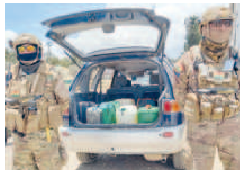
Militares evitan que salga combustible de contrabando del país.

ó que estas acciones tienen como meta y garantizar el bienestar de la población.