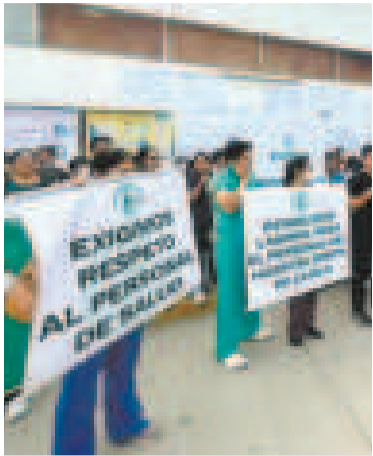
Paro de los trabajadores de salud en Santa Cruz.