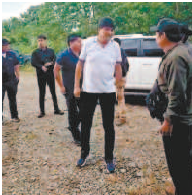
El expresidente Morales resguardado por civiles en el Chapare.

“Hemos cerrado filas en torno a la candidatura de Evo”, dijo en contacto con la prensa, según reportó el diario Opinión.