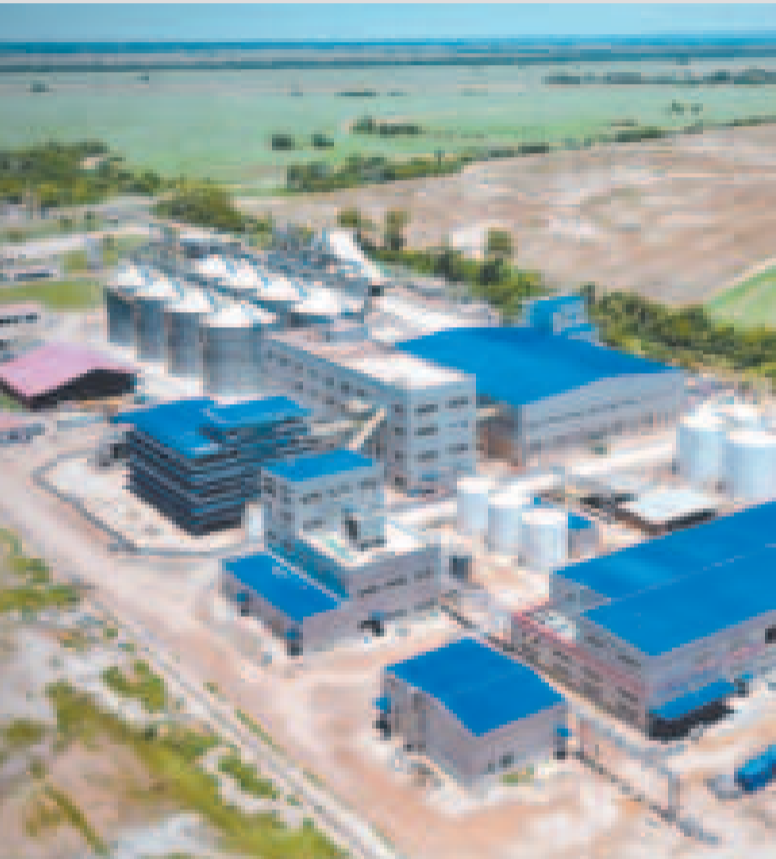
La nueva Planta de Transformación de Subproductos de Soya, en San Julián.

“Estamos trabajando para que el mercado interno no vuelva a enfrentar desabastecimientos y que los precios se mantengan justos para todos los bolivianos”, enfatizó el gerente de la empresa.