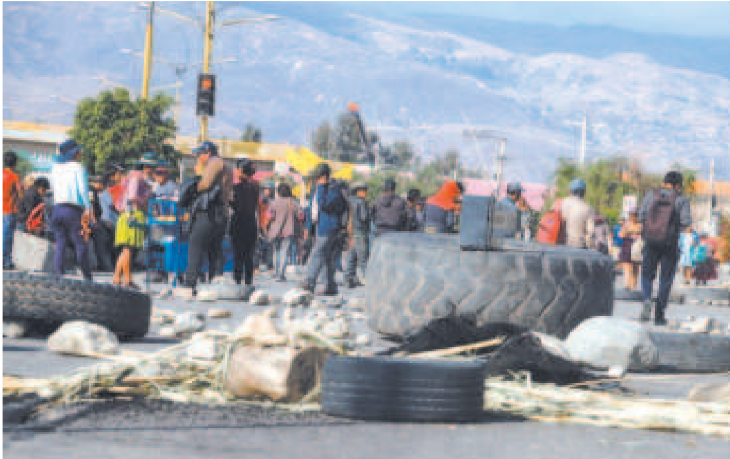
Los bloqueos paralizaron el país por más de 40 días durante este año.