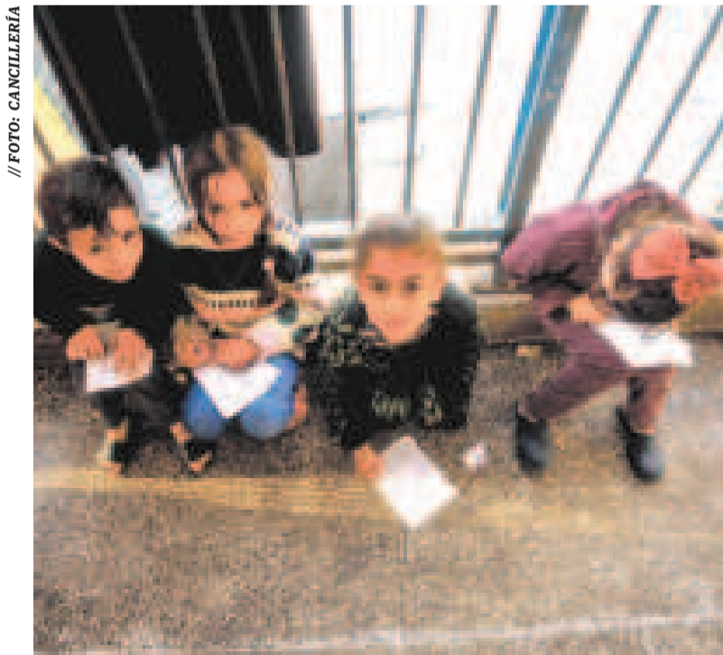
Niños de Palestina.

En octubre, Bolivia, a través de la Cancillería, presentó la solicitud de intervención sobre las acciones, flagelos y crímenes de genocidio en favor del pueblo palestino en la Franja de Gaza, como parte del informe que exhibió Sudáfrica contra Israel ante la Corte Internacional de Justicia (CIJ), en la que reafirma su propósito humanitario.