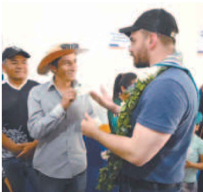
El ministro Eduardo Del Castillo conversa con un ciudadano en Charagua.