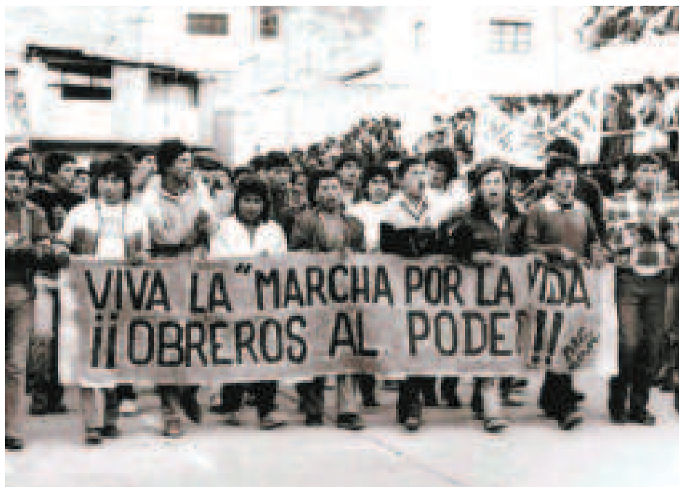
Marcha de trabajadores luego de ser despedidos.

“Tuto es un emisor del FMI y quiere volver a lo mismo que se vivió en los años 80 y 90”, opinó Ticona en contacto con este medio.