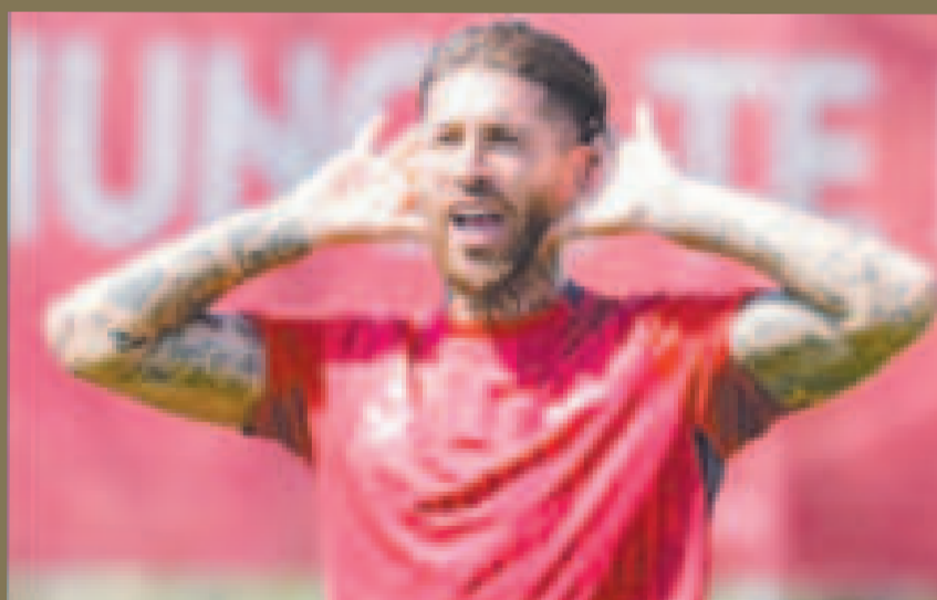
El español Sergio Ramos escucha ofertas y una de ellas es la de Boca Juniors.

El campeón del mundo con España en 2010 disputó sus últimos partidos oficiales en mayo con la camiseta del Sevilla, donde era titular y capitán. Sin embargo, no acordó su arribo a ningún club desde entonces y, aunque se mantiene en forma entrenándose de forma particular, perdió rodaje futbolístico. No obstante, un Fernando Gago que lo tuvo de compañero en Real Madrid y un Juan Román Riquelme que sabe la jerarquía que le aportaría su llegada a un plantel que competirá en el Mundial de Clubes en 2025, congeniaron para hacerle una propuesta formal.