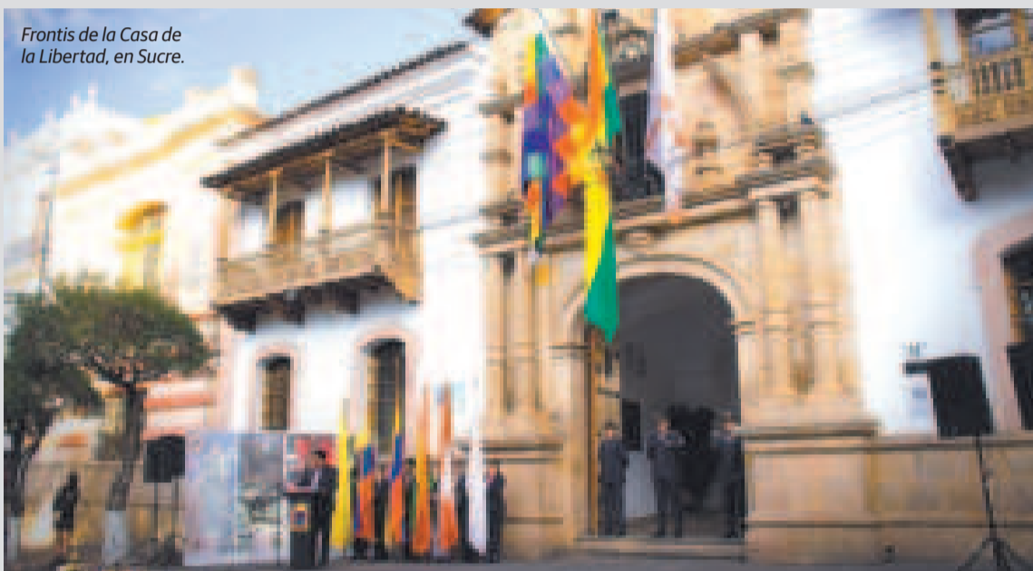
Frontis de la Casa de la Libertad, en Sucre.