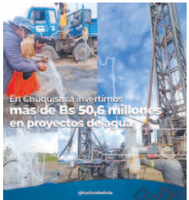
Familias beneficiadas con agua en Chuquisaca.

“Estamos avanzando en la implementación de múltiples proyectos de agua y saneamiento en todo el te-