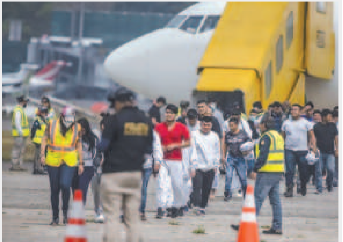
Migrantes deportados de Estados Unidos a Guatemala.

Es de esperar que en las próximas horas el conducto se expanda y consiga mejor tránsito de alimentos y líquidos al estómago del dirigente del Movimiento de Participación Popular, que integra el Frente Amplio uruguayo.