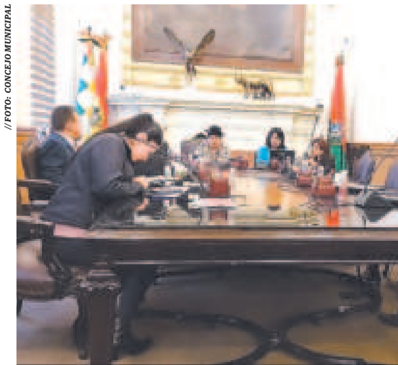
Sesión del Concejo Municipal de La Paz.

“Estamos hablando de lluvias que provocaron desbordes, caída de taludes y severos daños a viviendas y comercios. La norma aprobada permite que el municipio cuente con los recursos necesarios para atender emergencias y prevenir futuros desastres”, dijo Escalier.