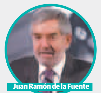
Juan Ramón de la Fuente

“Entonces, la idea es mantener por lo pronto la comunicación entre nosotros y probablemente más adelante haya algún encuentro a nivel ministerial para hacerle algún planteamiento a los jefes de Estado. Pero la comunicación sigue siendo, la verdad, muy fluida en esto, como que estamos en el mismo canal varios de estos países”, añadió el responsable de la diplomacia mexicana en conferencia conjunta con la presidenta Sheinbaum.