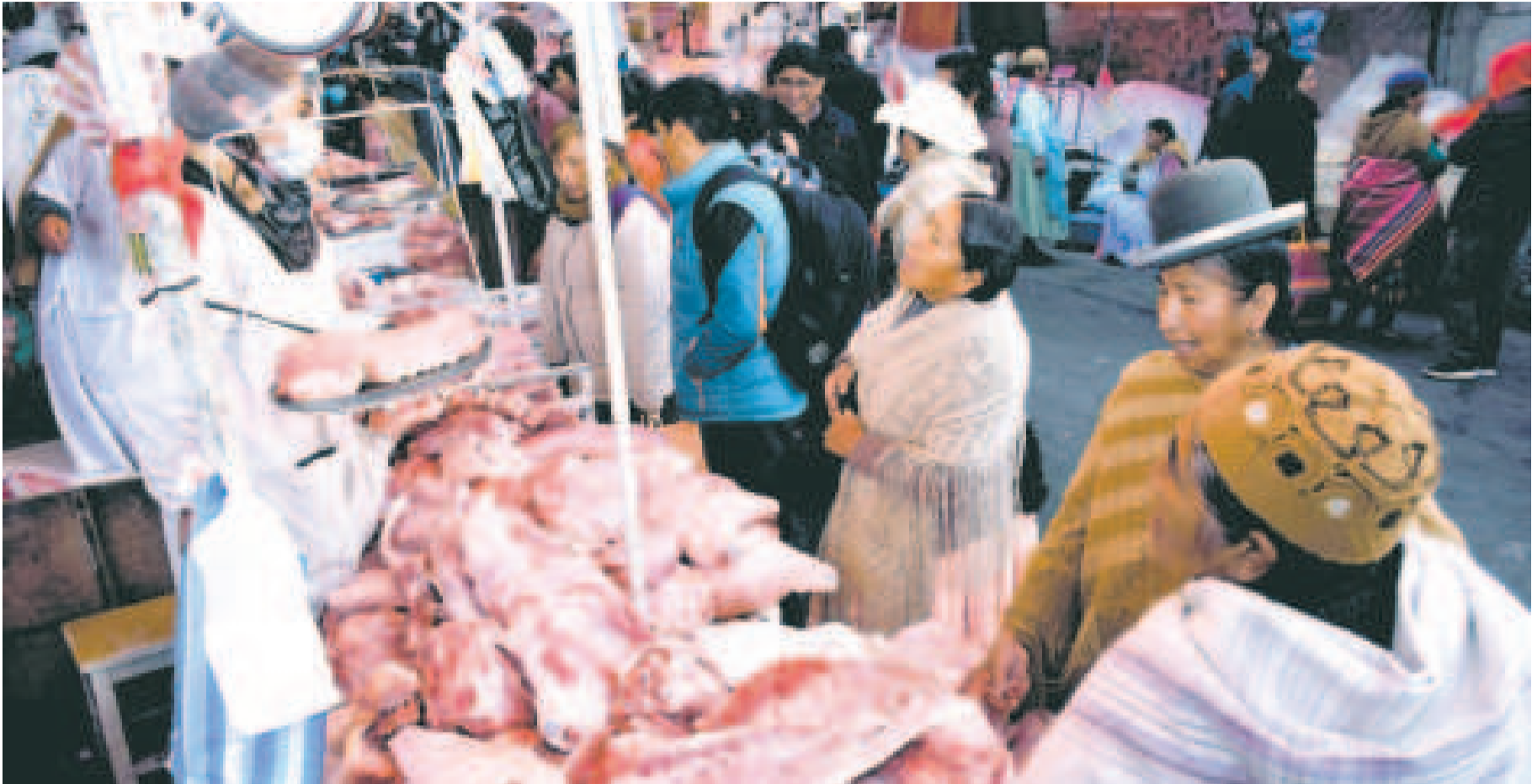
La demanda de carne de cerdo crece en las fiestas de fin de año.