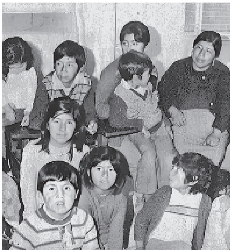
Las mujeres mineras que instalaron una huelga con sus hijos en 1977, en La Paz.

“¡Honor y gloria a las valientes mujeres mineras!”, homenajeó el mandatario mediante sus plataformas digitales.